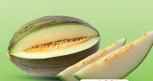
Piel de sapo