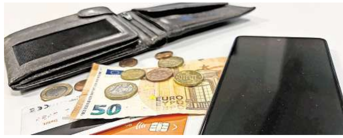
Bargeld, EC-Karte oder Smartphone: Welche Zahlungsart bevorzugen Sie?