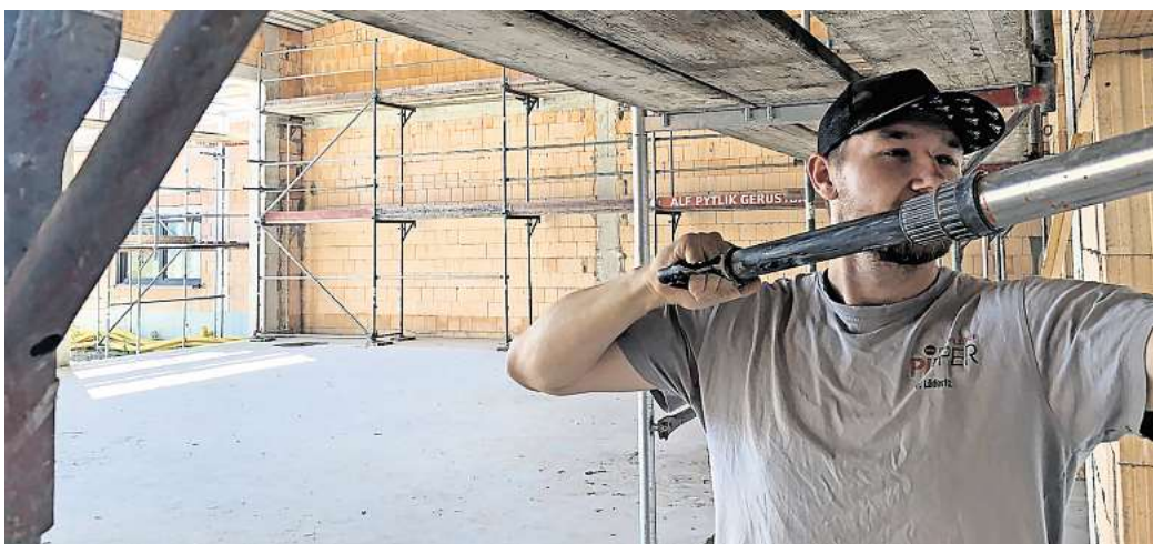
Neubau des Feuerwehrhauses Rötgesbüttel: Die Arbeiten laufen, kommen aber laut Samtgemeinde Papenteich weniger schnell voran als erhofft.

Neben dem neuen Feuerwehrhaus in Rötgesbüttel ist das die neue Sporthalle in Vordorf. Dort stünden Fördermittel auf dem Spiel, wenn die Samtgemeinde nicht gewisse Fristen einhalte, so Kielhorn. „Fördergeld dürfen wir nicht gefährden.“ Und so liege die Priorität im Fachbereich der Samtgemeindeverwaltung gerade mehr in Vordorf als in Rötgesbüttel.