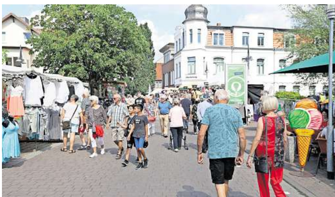
Teil der Bummelmeile: Der Steinweg zwischen Schillerplatz und Bodemannstraße ist gesperrt.

Gesperrt ist auch die Xanthistraße, und zwar am Freitag, 16. August, von 16 bis 2.15 Uhr, am Samstag, 17. August, von 12 bis 2.15 Uhr, und am Sonntag, 18. August, von 10 bis 22 Uhr. Anlieferungen für Geschäfte und Gewerbetreibende sind nur außerhalb dieser Zeiten möglich.