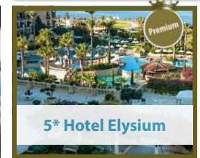
5* Hotel Elysium