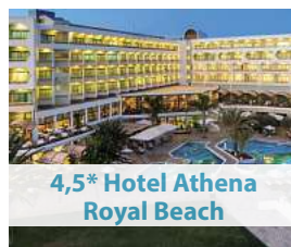
4,5* Hotel Athena Royal Beach