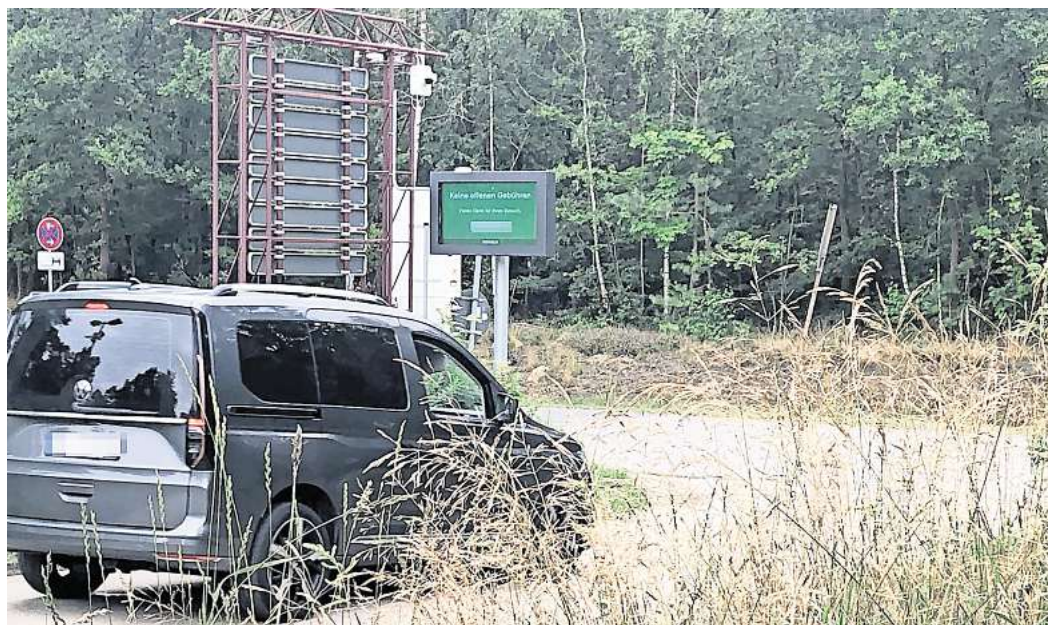
Parken ohne Schranken: Seit dem Frühjahr arbeitet das kameragestützte System am Tankumsee. Schummeln ist – fast immer – zwecklos.

Sind dann Senioren abgehängt? „Die Älteren werden völlig unterschätzt“, sagt Böhme. Sie kenne viele, die bereits mit der Smartphone-App bezahlen. Häufig hätten sie sich das von digitalaffinen Enkeln einrichten lassen.