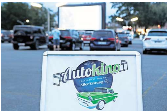
Das Gifhorer Autokino startet am 6. September. Leser können ab sofort beim Online-Voting mitmachen.

Diese Filme stehen für den Wunschfilm am Freitagabend um 20 Uhr zur Auswahl: Sie