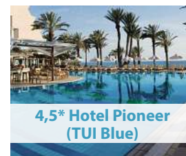
4,5* Hotel Pioneer (TUI Blue)