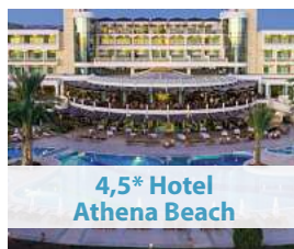
4,5* Hotel Athena Beach