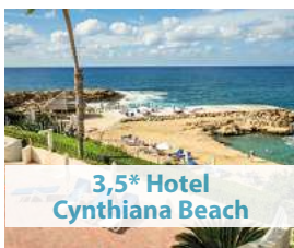
3,5* Hotel Cynthia Beach