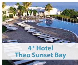
4* Hotel Theo Sunset Bay