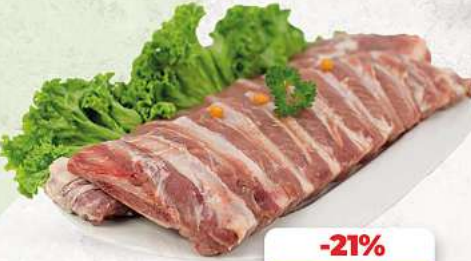
Bauchrippen vom Schwein an unserer Frischetheke je 1 kg