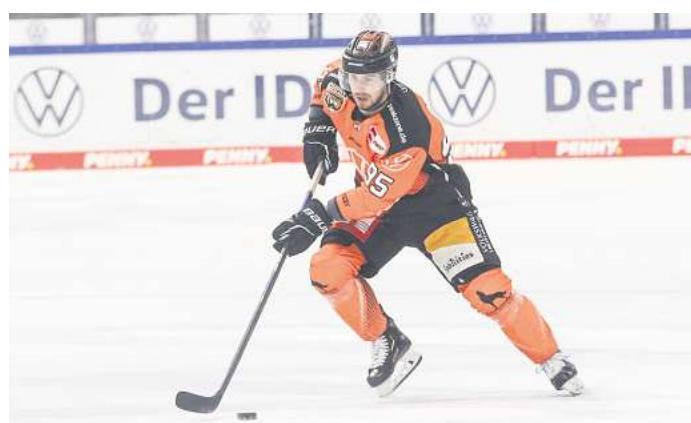
Für das Spiel Grizzlys Wolfsburg gegen Schwenninger Wild Wings am 4. Oktober in der EisArena können Leser Tickets gewinnen.

um 12 Uhr. Die Gewinner werden von uns benachrichtigt. Die Karten können vor dem Spiel an der Kasse 4 unter Vorlage des Personalausweises abgeholt werden.