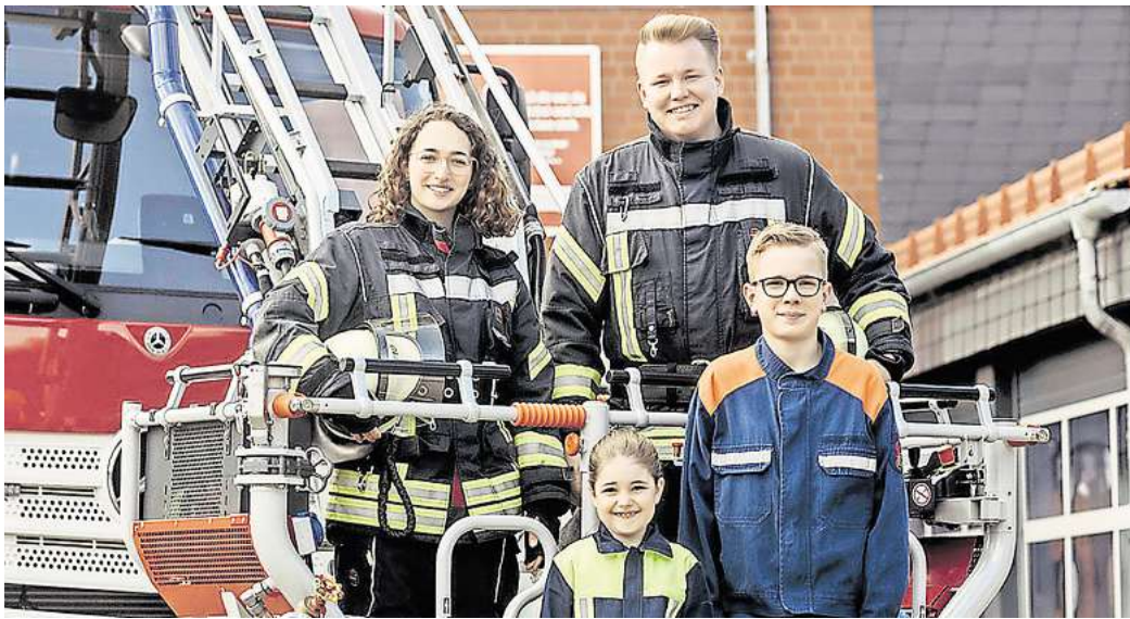
Am heutigen Samstag lädt die Freiwillige Feuerwehr zum abwechslungsreichen Aktionsprogramm auf ihren Hof in die Fallerslebener Straße ein.

Unter anderem gibt es Vorfürhungen der Kinder- und Jugendfeuerwehr, Live-Demonstration eines Brandeinsatzes, Technische Hilfeleistung in Aktion, eine Gefahrgutausstellung und eine Fahrzeugausstellung. Darüber hinaus ist um 15.30 Uhr eine Modenschau geplant und zwischen 13 und 15 Uhr wird es Auftritte des Musikzuges der Freiwilligen Feuerwehr Gifhorn geben. Ein besonderes Highlight ist um