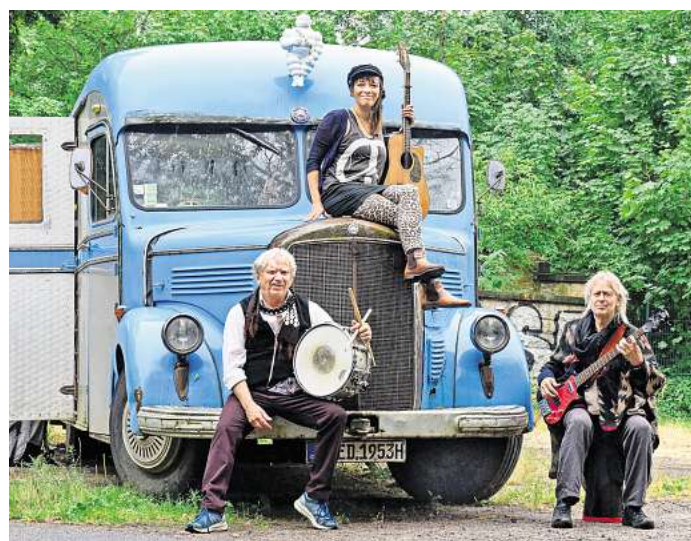
Sind bei Unser Aller Festival 2025 dabei: Ton Steine Scherben.