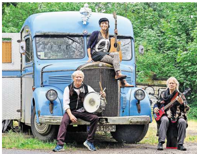
Sind bei Unser Aller Festival 2025 dabei: Ton Steine Scherben.