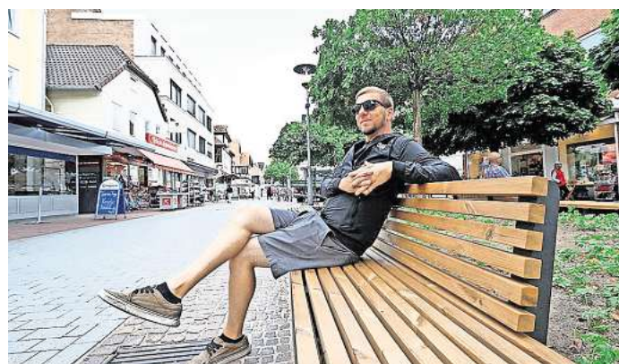
Mehr als nur Möbel: Eines der sechs aktuellen Projekte aus dem Integrierten Stadtentwicklungskonzept (ISEK) sieht den klimagerechten Umbau der Gifhorner Fußgängerzone vor.

Städtebauförderprogramm sollen. Darüber hinaus gibt es aus der Liste mit 54 Projekten weitere, die die Stadt auch noch angehen will. Zum Beispiel, was die Zentren der Ortsteile angeht.