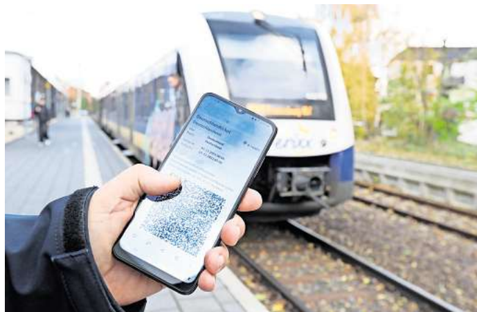
Lange hatten die Verkehrsminister beraten, jetzt haben sie den Preis für das Deutschlandticket ab 2025 festgelegt.

Direkt zur Umfrage: Einfach den QR-Code mit dem Handy scannen.