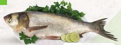
Silberkarpfen Tollstobhik an unserer Frischetheke je 1 kg