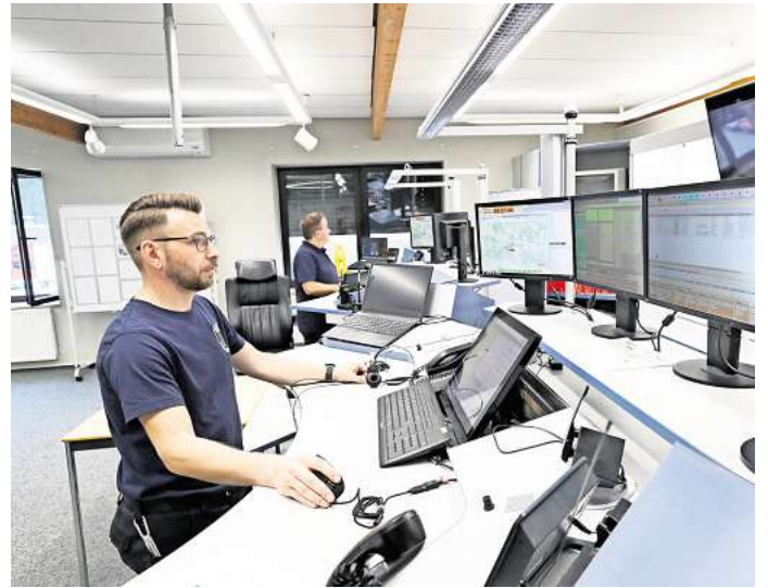
Künftig keine Sprachbarriere mehr auf 112: Die Rettungs-Leitstelle in Gifhorn bekommt im Oktober eine KI, die nahezu in Echtzeit Fremdsprachen übersetzen kann.

Schönberg stellt klar, dass dennoch eine Zeitverzögerung nicht immer auszuschließen ist. Und dass es Fälle ohne gemeinsame sprachliche Verständigung gibt. Erfahrungen, die auch die Leitstelle in Wolfsburg macht, so Stadtsprecher Jan-Niklas Schildwächter. „In Leitstellen kann die Kommunikation mit Anrufern, die nicht Deutsch sprechen, eine erhebliche Herausforderung darstellen. Diese Erfahrungen und Herausforderungen sind besonders relevant in multikulturellen Gesellschaften.“ So könnten Sprachbarrieren zu fatalen Missverständnissen führen, zum Beispiel auch durch ver-