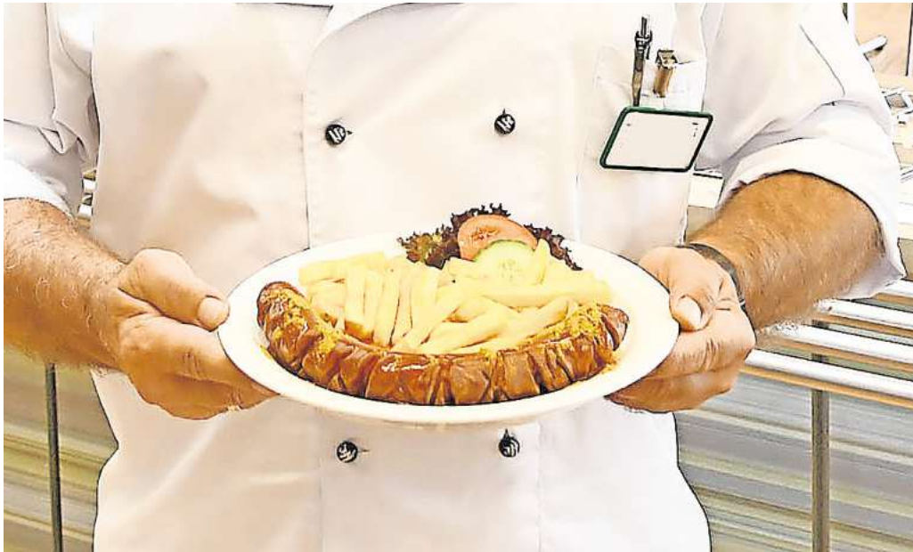
Machen Sie mit bei der Wahl zur leckersten Currywurst im Kreis Peine!

In der Innenstadt und in den Samtgemeinden gibt es zahlreiche Imbisse und Restaurants, die die herzhafteste Spezialität anbieten. Die AZ macht sich gemeinsam mit Ihnen auf die Suche nach der leckersten Currywurst des Landkreises! Im ersten Durchgang sind Sie dazu aufgerufen, Ihre Favoriten zu