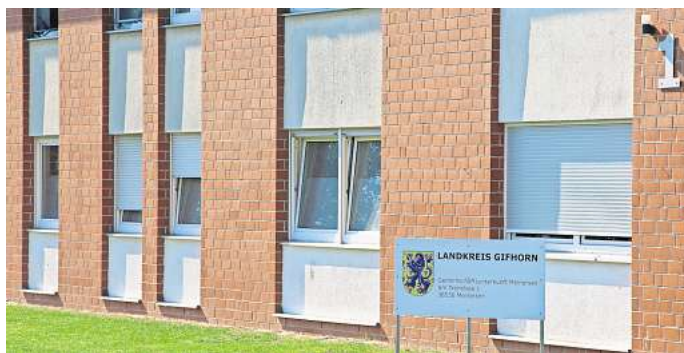
Gemeinschaftsunterkunft in Meinersen: Der Landkreis Gifhorn prüft derzeit eine mögliche Erweiterung.

Aber gleich Container? Und wieso Meinersen? Ein Blick auf die aktuellen Zahlen zur Unterbringung von Geflüchteten: Neben der Einrichtung im Gifhorner Clausmoorhof und dem Camp Ehra-Lessien gibt es in Meinersen die dritte Gemeinschaftsunterkunft im Kreis Gifhorn. Wenn der Landkreis also prüft, wo für den Fall, dass weitere Geflüchtete aufgenommen werden müssen, diese untergebracht werden können, dann steht Meinersen naturgemäß wegen der Gemeinschaftsunterkunft oben auf der Liste. Zudem gibt es in Meinersen freie Kapazitäten: Zurzeit sind in der Meinerser Gemeinschaftsunterkunft 53 Personen mit verschiedenen Familienständen untergebracht, heißt es vom Landkreis. Ein paar Plätze wären also noch frei, denn die Gesamtkapazität beträgt 70 Personen.