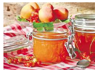
Vor allem Obst aber auch Gemüse lässt sich durch Kochen haltbar machen.

Neben richtiger Lagerung gibt es auch weitere Methoden, um vor allem Gemüse haltbar zu machen. Die gängigsten sind Fermentation, Einkochen und Trocknen. Bei der Fermentierung sorgen Milchsäurebakterien dafür, dass Lebensmittel haltbar werden, indem sie Zucker in Milchsäure umwandeln. Dieser Gärungsprozess ist eine schonende Methode, bei der wichtige Mineralien und Vitamine erhalten bleiben. Die Dauer des Pro-