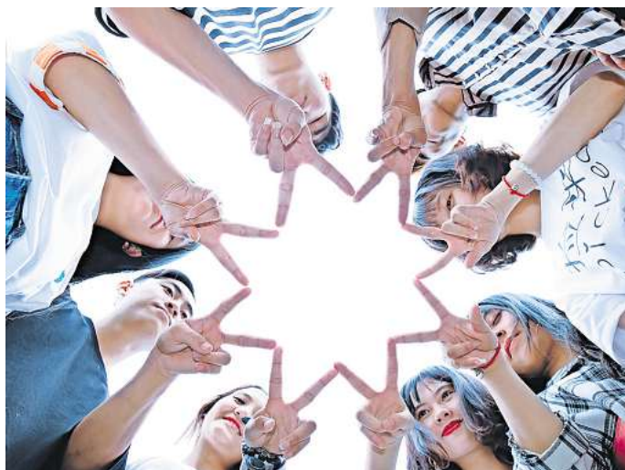
Am 11. Oktober steht das Gifhorer Schloss ganz im Zeichen von Mädchenpower.

Zum Hintergrund: Auch hierzulande sind Mädchen häufiger von sexuellen Übergriffen betroffen als Jungen. Klassische klischeehafte Rollenmodelle in der frühkindlichen Erziehung benachteiligen Mädchen. Das setzt sich in der Schule und im gesellschaftlichen Leben fort, nach dem Motto „so war es schon immer“. Mädchen landen häufiger in typischen, schlechter bezahlten „Frauenberufen“, und als erwachsene Frauen droht ihnen unbezahlte Care-Arbeit.