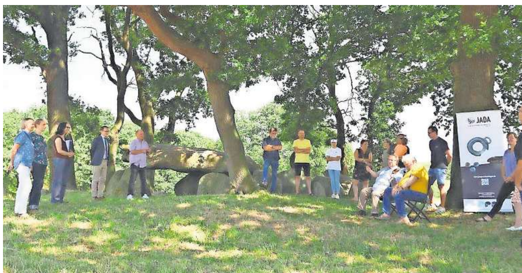
Die Vortragsreihe "Archäologie im Landkreis Gifhorn und Umgebung" geht in eine neue Runde.

Mit etwa 30.000 Fundstellen ist Sachsen-Anhalt sehr reich an archäologischen Denkmälern. Und ständig kommen neue Fundplätze über die Auswertung von Luftbildern, Laserscans oder Archivunterlagen hinzu. Nur wenige dieser Fundplätze sind oberflächlich noch erkennbar. Zu den eindrucksvollsten und den ältesten gehören zweifellos die jungsteinzeitlichen Großsteingräber, auch