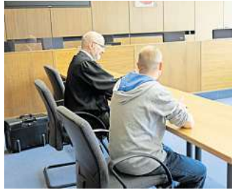
Ein Schleifschwamm brachte ihn vor Gericht: Der 35-jährige Angeklagte mit seinem Verteidiger.

detektiv jedoch seinen Angreifer ab. Der 35-Jährige hätte durchaus weiter flüchten können, er hätte auch den Schwamm wegwerfen können, davon ist die Kammer überzeugt. Das wäre besser gewesen, beides hat er jedoch nicht getan, so die Vorsitzende Richterin. Damit ist für die Kammer klar, dass er im Besitz des Schleifschwammes bleiben wollte.