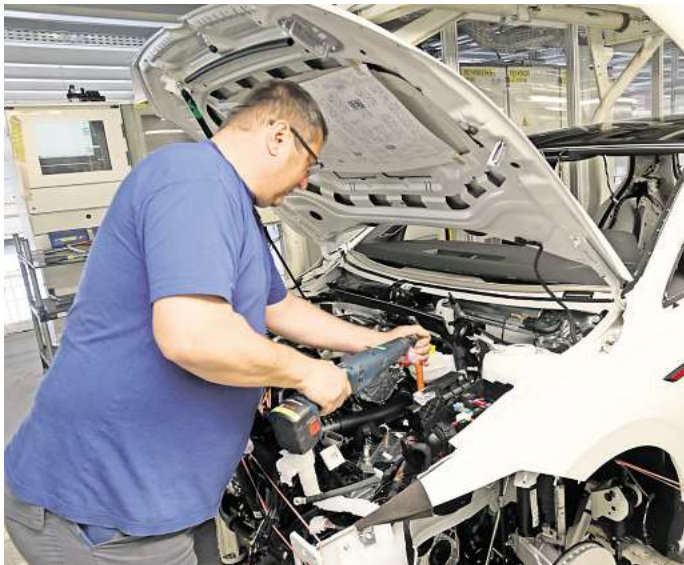
Tarifverhandlungen bei VW: Wird es am Ende trotz der Krise ein Lohnplus für die Mitarbeiter geben? (Symbolbild)

vorstand der Marke Volkswagen und VW-Verhandlungsführer, wies bei den Tarifverhandlungen