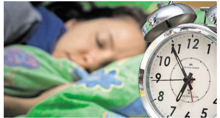
Wann soll der Wecker klingeln? In Dänemark wird gerade ein Unterrichtsbeginn in den Schulen um 9 Uhr getestet. In Deutschland ist eher 8 Uhr üblich.