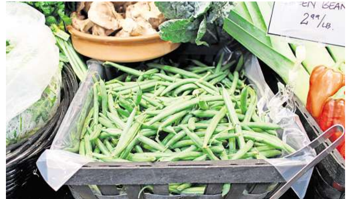
Bioprodukte vom heimischen Erzeuger sind Garant für eine gesunde Ernährung.

Die Nachfrage nach Bio-Lebensmitteln hat dazu geführt, dass immer mehr Supermärkte und Hofläden ein breites Sortiment an biologischen Produkten anbieten. Hofläden sind eine großartige Möglichkeit, frische, regionale und oft biologische Produkte direkt vom Erzeuger zu