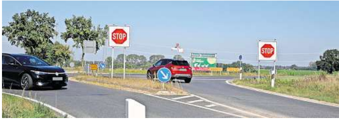
Unfallschwerpunkt Lagesbütteler Kreuzung: Hier soll ein Kreisel entstehen, allerdings wohl kaum vor 2027.

Im vorigen Jahr gab es zwei schwere Unfälle an der Kreuzung, einer davon ein typischer Stop-Schild-Unfall. 2022 zählte die Polizei vier schwere Unfälle, auch darunter wieder einige nach dem Muster. Inzwischen steht von Adenbüttel kommend rechts neben der K56 wieder ein intakter Sichtschutzzaun, der Autofahrern den vorzeitigen Blick auf die L321 nehmen und sie zum Anhalten zwingen soll. Dennoch gab es auch