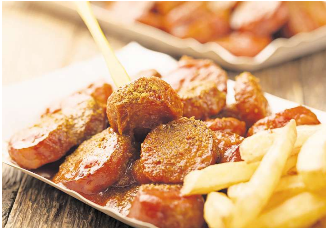
Traditional German currywurst, served with chips on disposable paper tray. Wooden table as background.

Was eine richtig gute Currywurst ausmacht, hängt dabei nicht nur