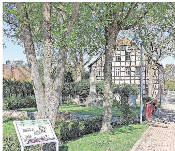
Die Alte Schule zählt zu den Stationen der abwechslungsreichen Tour.

Man erfährt Wissenswertes von der Entstehung, der Entwässerung bis zur aktuellen Wiedervernässung. Themen sind auch die Geschichte eines