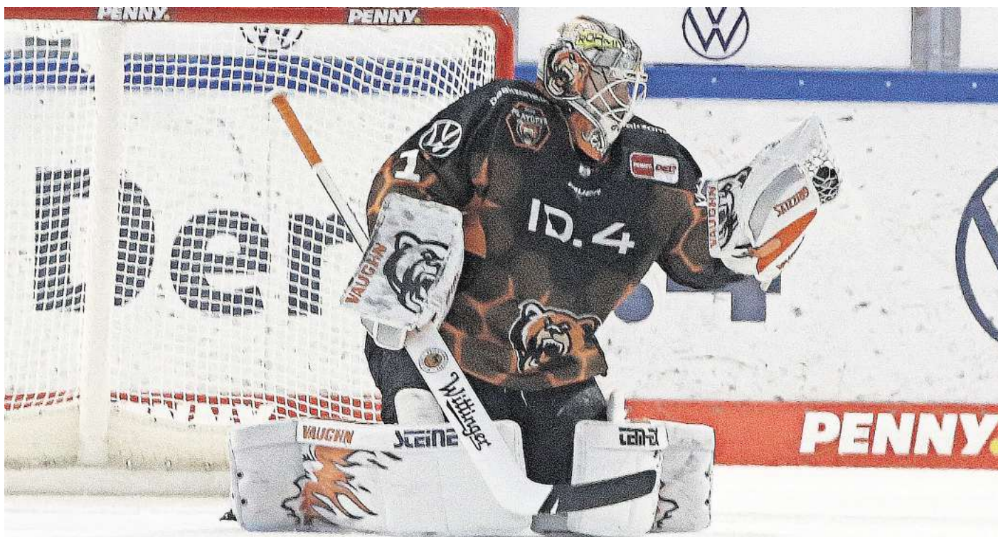
Am 20. Oktober treffen die Grizzlys Wolfsburg in der EisArena auf die Eisbären Berlin. (Symbolbild)

Direkt zur Verlosung: Einfach den QR-Code mit dem Handy scannen.