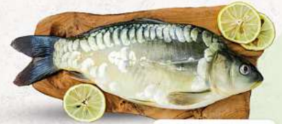
Spiegelkarpfen an unserer Frischetheke je 1 kg

PUTENBERKEULE | SCHWEINENACKEN HAUSGEMACHT MARINIERT