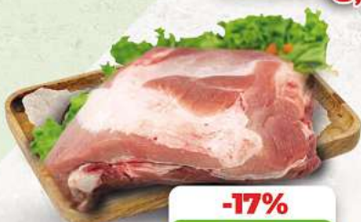
Dicke Rippen ohne Schwarte an unserer Frischetheke je 1 kg