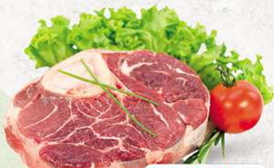
Rinderbeinscheiben an unserer Frischetheke je 1 kg

Herkunftsnachweise von unseren Produkten - siehe Etikettierung