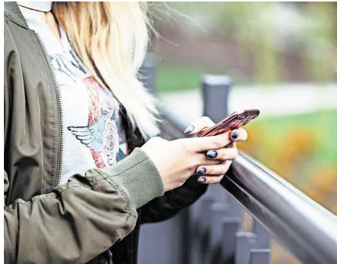
Symbolfoto: Handynutzerinnen und -nutzer können zahlreiche Sicherheitsvorkehrungen treffen, um ihre Daten zu schützen.

Andere Optionen zum Entsperren sind Fingerabdrücke, Gesichts- und Iris-Scanner. Diese Methoden sind aber fehleran-