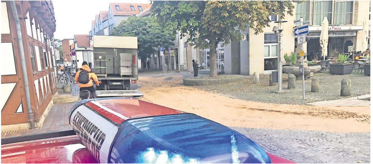
Kilometerlange Ölspur: Ein Remondis-Lastwagen war in der Fußgängerzone leck geschlagen, die Spur zog sich bis zum Betriebshof.

Der Müllwagen stieß laut Polizei in Höhe Kaufhaus Schütte gegen einen Vorbau. Dabei riss ein Hydraulikschlauch ab, es trat Hydraulikflüssigkeit aus. Bollmohr rückte zunächst mit acht Leuten aus. Doch er glaube nicht, dass das reiche, sagte der Brandmeister vom Dienst am Morgen angesichts der Länge der Verunreinigung. Letztendlich hatten bis zu 15 Leute gut zu tun, nach dreieinhalb Stunden war der Einsatz der Feuerwehr beendet. Bis dahin hatte sie 800 Kilogramm Ölbindemittel verbraucht.