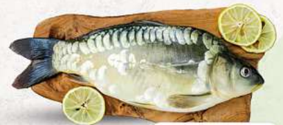
Spiegelkarpfen an unserer Frischetheke je 1 kg

PUTENBERKEULE | SCHWEINENACKEN HAUSGEMACHT MARINIERT