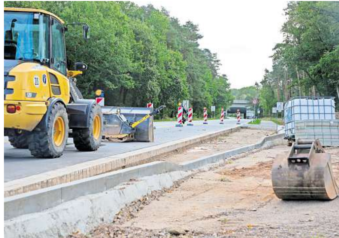
Wieder Bauarbeiten an der Tangente: An der Tankumsee-Kreuzung entstehen für 165.000 Euro zwei Bushaltestellen. Die VW-Werkslinien sollen künftig dort halten.

Das wird laut Landkreis-Sprecherin Anja-Carina Riechert auch noch etwas dauern, wie sie in einer gemeinsamen Antwort von Landkreis und Regionalverband Großraum Braunschweig auf AZ-Anfrage schreibt. „Die Arbeiten sollen bis Ende Oktober abgeschlossen sein.“ Es gibt noch einiges zu tun: Die Bauarbeiter müssen noch in Fahrtrichtung Gifhorn das Betonsteinpflaster sowie Noppen- und Rippenplatten verlegen. Außerdem stehen Bewehrung und Herstellung der Betondecke im Bushaltestellenbereich an. Und wie es sich für eine