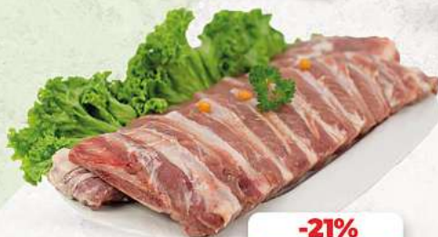
Bauchrippen vom Schwein an unserer Frischetheke je 1 kg