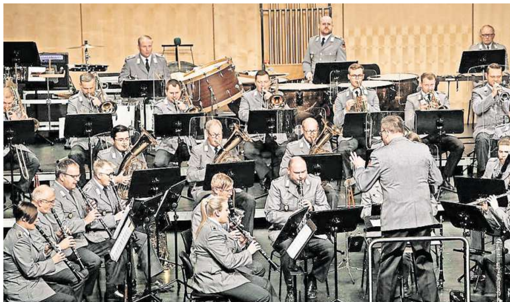
Benefizkonzert für „Helfen vor Ort“: Das Heeresmusikkorps Hannover kommt wieder in die Gifhorner Stadthalle.

Bundeswehr-Orchester unterstützt Gifhorner Verein Helfen vor Ort