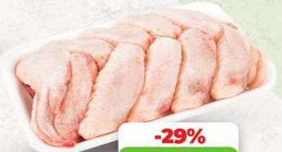
Hähnchenflügel an unserer Frischetheke je 1 kg