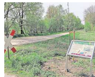
Auf der „Moor ZeitReise“ laden unterschiedliche Stationen zum Verweilen ein.

Weitere Infos zu den Routen finden sich auf der Internetseite der Arbeitsgemeinschaft Fahrradwege in der Gemeinde Sassenburg: https://fahrrad-sassenburg.jimdo-freer.com/pois/moor-zeitreise/