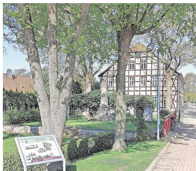
Die Alte Schule zählt zu den Stationen der abwechslungsreichen Tour.

Man erfährt Wissenswertes von der Entstehung, der Entwässerung bis zur aktuellen Wiedervernässung. Themen sind auch die Geschichte eines