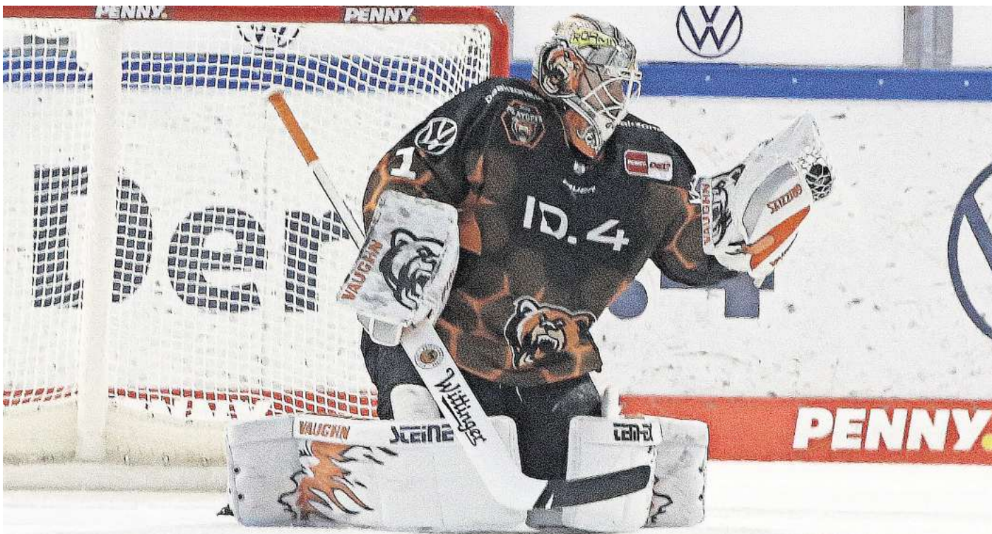
Am 20. Oktober treffen die Grizzlys Wolfsburg in der EisArena auf die Eisbären Berlin. (Symbolbild)

Direkt zur Verlosung: Einfach den QR-Code mit dem Handy scannen.