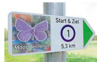
Der Hochmoor-Bläuling zielt die Routenplakette der „Moor ZeitReise“.