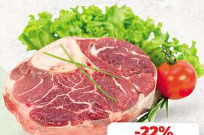
Rinderbeinscheiben an unserer Frischetheke je 1 kg

Herkunftsnachweise von unseren Produkten - siehe Etikettierung