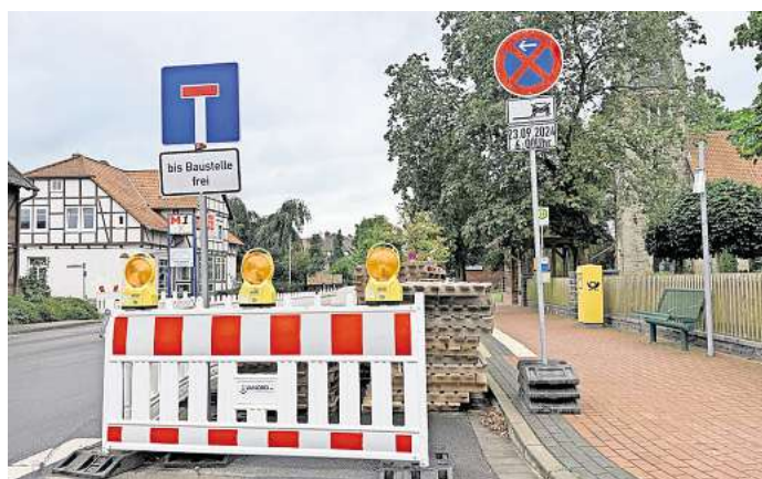
Parsau: Bei der Sanierung der Ortsdurchfahrt steht der nächste Bauabschnitt bevor.

hungsweise die Entfernung der im Zuge der Umleitung angebrachten Bremsschwellen in der Straße Hinter den Höfen angeht – dazu soll es bald eine Anwohner-Umfrage geben.