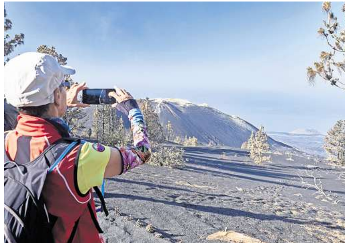
Im Rahmen einer Tour dürfen Reisende La Palmas neuen Vulkan Tajogaite besteigen.

„Ruta de los Volcanes“ heißt eine 17,5 Kilometer lange Wandertour im Süden von La Palma, bei der ein Höhenunterschied von etwa 1207 Metern zu überwinden ist. Die Tour gilt als anspruchsvoll und führt bis auf 1932 Meter Höhe. Generell ist die Strecke gut ausgeschildert und schlängelt sich durch verschiedene Gemeinden – von El Paso über Mazo nach Fuencaiente, was im Naturpark Cumbre Vieja liegt. Für den Weg solltest du mindestens fünf Stunden