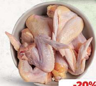
Putenflügel an unserer Frischetheke je 1 kg