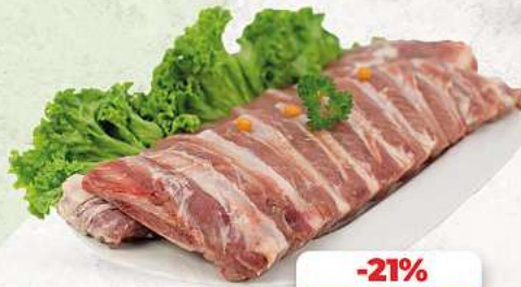
Bauchrippen vom Schwein an unserer Frischetheke je 1 kg