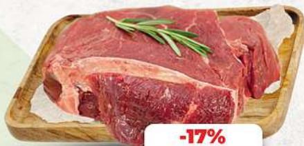
Rinderbugstück an unserer Frischetheke je 1 kg

Herkunftsnachweise von unseren Produkten - siehe Etikettierung