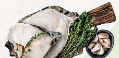
Seewolf an unserer Frischetheke je 1 kg

HÄNNCHENSCHENKEL | SCHWEINEBAUCH | SCHWEINENACKEN