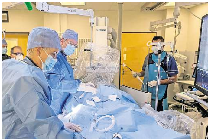
Behandlung von Vorhofflimmern im Herzkatheterlabor: Im Gifhorner Helios Klinikum gibt es jetzt eine Alternative zur medikamentösen Behandlung.

Beim Vorhofflimmern ziehen sich die Vorhöfe nicht mehr richtig zusammen und das Blut im Vorhof bewegt sich kaum noch. Die Folge ist die Bildung von Blutgerinnseln. Wird ein solches Gerinnsel aus dem Herzhof ausgeschwemmt, kann