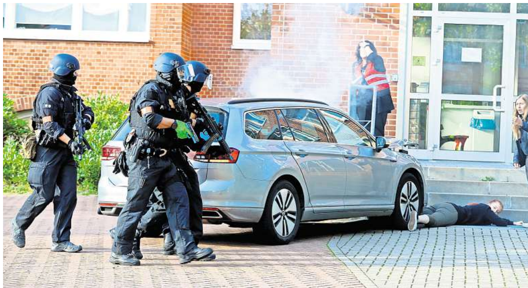
Großübung in Gifhorn: Am Freitag trainierten Polizei, Feuerwehr und Rettungsdienste für den Extremfall.

Ein weiterer Bestandteil des Drehbuchs: Die Polizei trägt später gerettete Opfer aus der Schule und bringt sie zum Rettungs-