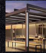
Terrassen- überdachungen Glasoasen Markisen