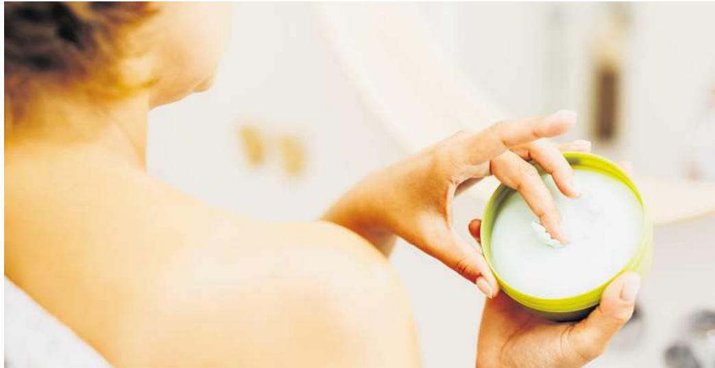
Weichmacher können unter anderem durch Kosmetikprodukte in den Körper gelangen.

Auch bei der Textilveredlung werden weichmachende Substanzen eingesetzt, um die Griffigkeit und Geschmeidigkeit von Stoffen zu verbessern. Neben Harzen, ölartigen Stoffen und Naturstoffen werden häufig Phthalate eingesetzt. Dabei handelt es sich um chemische Substanzen, die eine schädigende Wirkung haben können. Kein Weichmacher im eigentlichen Sinn ist die Substanz Bisphenol A (BPA), die zum Beispiel in Plastikdosen und Trinkflaschen enthalten ist sowie in der