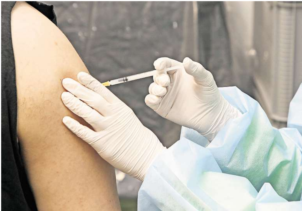
Umfrage: Lassen Sie sich gegen Grippe und Corona impfen?

Auch die Auffrischung der Covid-19-Impfung legt die Stiko der oben angeführten Personengruppe ans Herz, ausgenommen Schwangere ohne Grunderkrankungen, für die die Basisimmunität als ausreichend bewertet wird. Laut dem Robert Koch-Institut (RKI) ist eine Basisimmunität dann erreicht, wenn das Immunsystem dreimal Kontakt mit Bestandteilen des Erregers (Impfung) oder dem Erreger selbst (Infektion) hatte. Mindestens einer der drei Kontakte sollte dabei eine Impfung sein.