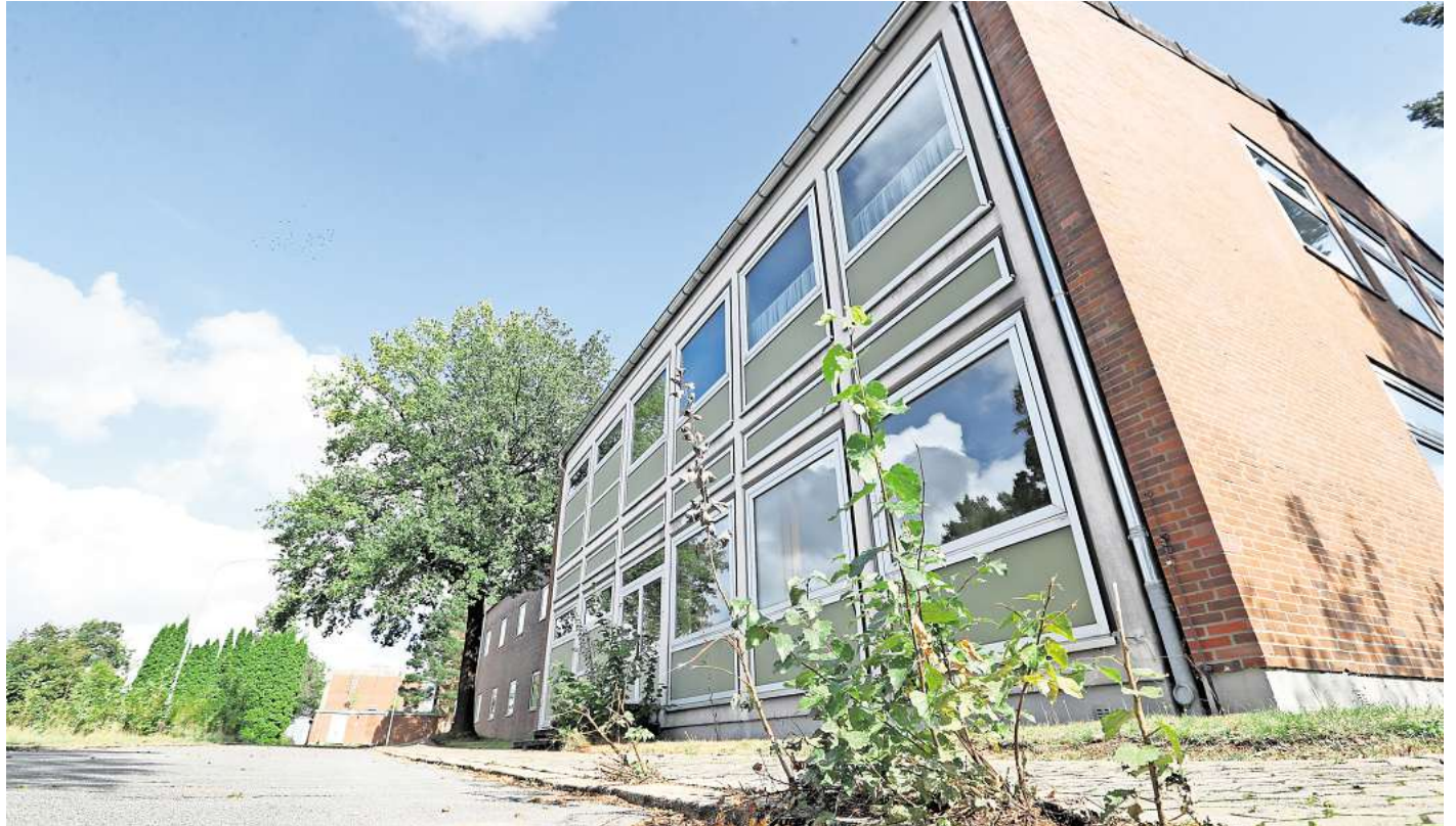
Wird zur neuen Übergangs-Grundschule: Handwerker müssen die alte BGS-Fahrschule am Wilscher Weg noch zurecht machen.

Am Ende werde die Grundschule acht allgemeine Unterrichtsräume