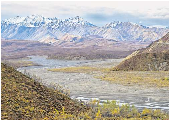
Die farbenfrohen Berghänge des Polychrome Mountain im Denali-Nationalpark, Alaska.

Island ist vor allem für schwarze Strände, spektakuläre Wasserfälle und weitläufige Landschaften bekannt. Doch nicht viele wissen, dass die nordische Insel auch bunte Berge zu bieten hat. Landmannalaugar heißt das Gebiet im südlichen Hochland Islands, das etwa 180 Kilometer entfernt von Reykjavik zu finden ist. Die Entstehung des Landmannalaugar ist auf einen Ausbruch des Torfajökull-Vulkans im Jahr 1477 zurückzuführen; das vulkanische Gestein Rhyolith sorgt für die Schattierung der Bergrücken in Rot, Orange, Grün und Blau. Bis heute ist das Hochlandgebiet geothermisch aktiv.