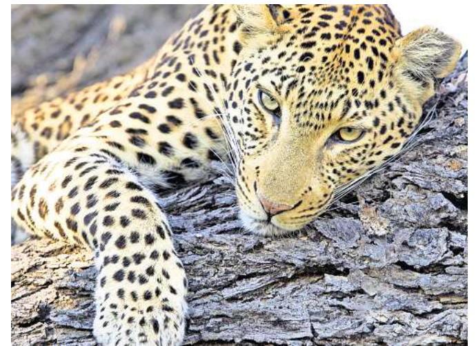
Die Zuschauer erwarten beeindruckende Bilder aus den unterschiedlichsten Ländern wie beispielsweise Südafrika.

Die Zuschauer erwarten beeindruckende Tierszenarien, die Gänsehaut erzeugen, spannende Stories und berührende Begegnungen mit Menschen aus den unterschiedlichsten Kulturen. In Namibia, Südafrika, Botswana und Simbabwe