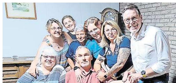
„Willkommen in Nedderknöfel“: Die Theatergruppe Barwedel präsentiert ihr neues Herbststück.

Eintrittskarten gibt es online über www.remmlerhof.de und an den Vorverkaufsstellen: Postagentur Brome, Salon Rapunzel in Tülow, Toto Lotto in Jemke und Weyhausen. Preise: 20 Euro zuzüglich Gebühren für die 15 Uhr-Vorstellung und 10 Euro