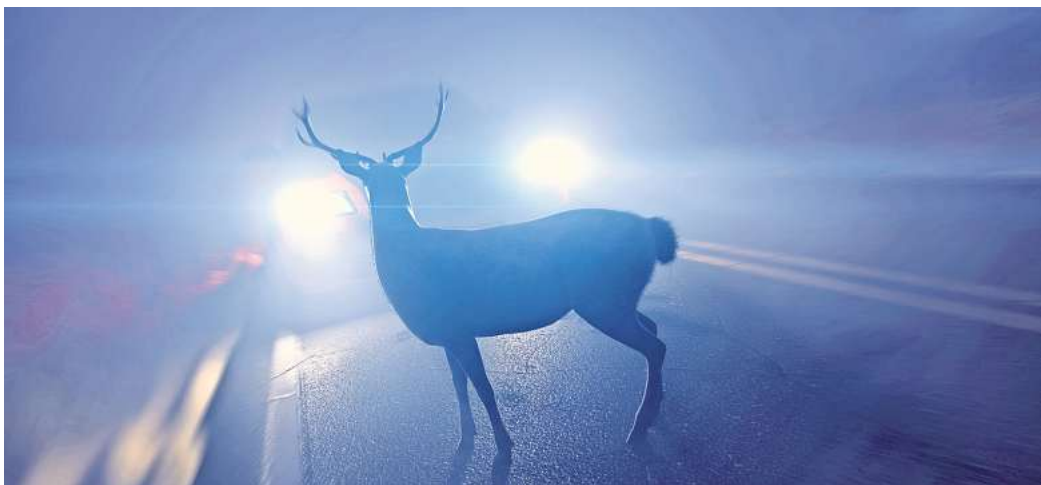
Wildunfälle im Herbst: Autofahrer sollten besonders aufpassen.

In Peine musste die Polizei allein in diesem Jahr schon zu 410 Wildunfällen ausrücken, so Spilker. Glücklicherweise ist es dabei nicht zu schweren oder gar tödlichen Verletzungen gekommen. Doch ein 16-jähriger verletzte sich bei solch einem Unfall mit seinem kleinen Motorrad leicht.