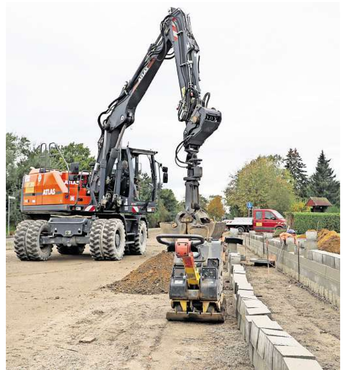
Baustelle in Westerbeck: Die Firma arbeitet sich an die Ortsausfahrt in Richtung Gifhorn heran. Der westliche Abschnitt der Hauptstraße soll Ende des Jahres freigegeben werden.

Bis der Asphalt zwischen der Borde und Gossen kommt, wird es noch etwas dauern, teilt Christina Rochlitz, Sprecherin der Landesbehörde für Straßenbau und Verkehr, auf AZ-Nachfrage mit. Die Arbeiten an Gossen, Borden, Nebenanlagen und