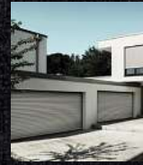
Garagentore Deckenlauffore Kastenrolltore