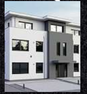
Fenster & Rollläden Schiebeanlagen Faltanlagen

V. Gloger Direktförderung ohne komplizierte Antragstellung auf alle Produkte