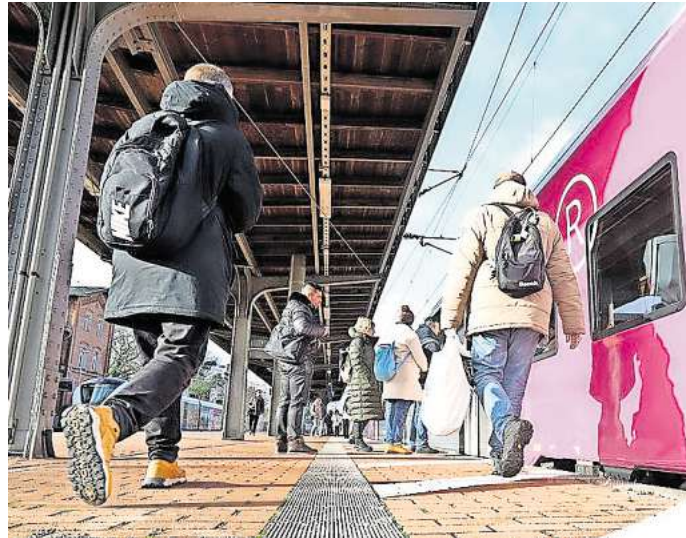
Mehr zahlen für Bus und Bahn: Nicht nur das Deutschlandticket wird ab 1. Januar teurer, der Verkehrsverbund Region Braunschweig passt auch seine Tarife an.

Das Deutschlandticket kostet ab 2025 58 Euro im Abo. „Damit ist es immer noch günstiger als alle anderen Monatstickets und bleibt auch künftig ein attraktives Angebot, welches das Reisen in ganz Deutschland erheblich vereinfacht“, so VRB-Geschäfts-