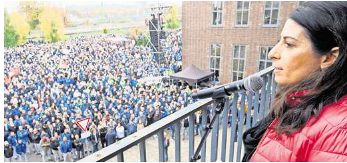
Info-Veranstaltung bei VW: Die Betriebsratsvorsitzende informierte die Beschäftigten über die Sparpläne des Vorstands.