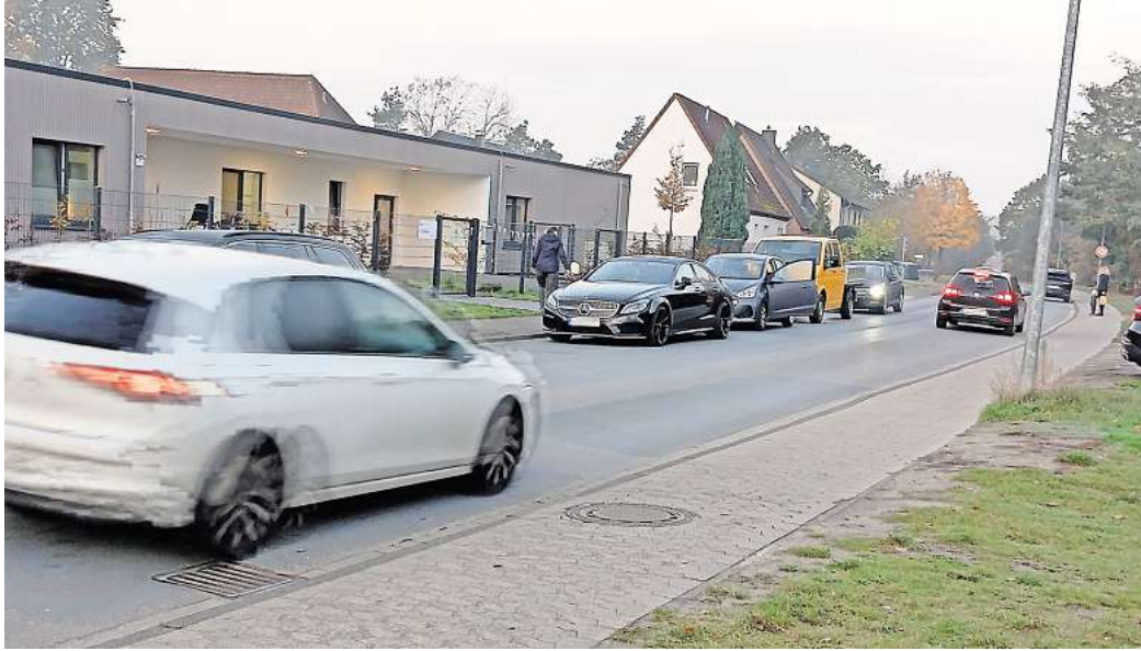
Kita Wilscher Weg: Wenn morgens die Kinder gebracht werden, wird es schon mal eng. Es fehlt Parkraum an der Einrichtung.

Richtig eng wird es auch, wenn dann noch Fahrzeuge auf der gegenüberliegenden Seite geparkt werden. Wieder Slalom, die Autofahrer verständigen sich mit Lichthupe, wer fahren soll, die Warteschlange wird länger. Direkt gegenüber der Kita ist ein unbefestigter Seitenstreifen, auf den geschätzt zehn Pkw passen dürften. Genutzt wird er an diesem Morgen nur von einem. Da-