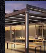
Terrassen- überdachungen Glaseisen Markisen