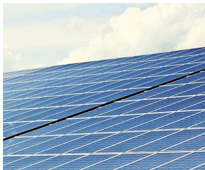
Gifhorn plant drei Solarparks: 37, 23 und 3 Hektar groß sollen die Flächen jeweils werden.