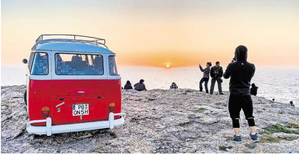
Das Bulli-Abenteuer von Fotograf Peter Gebhard steht im Mittelpunkt der Multimedia-Show am 11. November in der Stadthalle Gifhorn.

Multimedia-Show von Fotograf Peter Gebhard am 11. November in Gifhorner Stadthalle