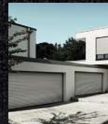
Garagentore Deckenlauffore Kastenrolltore