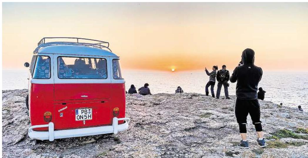
Das Bulli-Abenteuer von Fotograf Peter Gebhard steht im Mittelpunkt der Multimedia-Show am 11. November in der Stadthalle Gifhorn.

Multimedia-Show von Fotograf Peter Gebhard am 11. November in Gifhorner Stadthalle