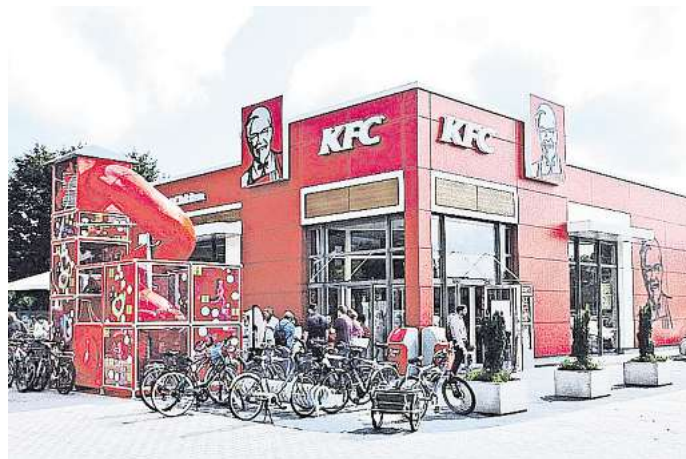
Kentucky Fried Chicken (KFC): Die Hähnchenkette will ein Restaurant in Gifhorn aufmachen – konkrete Angaben über Zeitpunkt und Standort gibt es noch nicht.

Der Fastfood-Riese operiert bei seiner Expansion im Stil der großen Mitbewerber und setzt auf Lizenznehmer. Beim Franchising wird eine Geschäftsidee