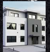
Fenster & Rollläden Schiebeanlagen Faltanlagen

V. Gloger Direktförderung ohne komplizierte Antragstellung auf alle Produkte