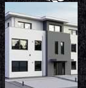
Fenster & Rollläden Schiebeanlagen Faltanlagen

V. Gloger Direktförderung ohne komplizierte Antragstellung auf alle Produkte