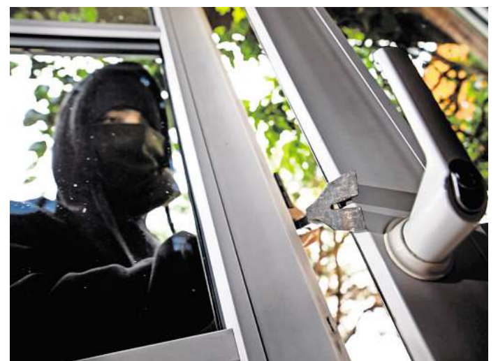
Hinter Einbrüchen in der Region scheint eine Einbrecherbande gesteckt zu haben: Die Polizei meldet einen Fahndungserfolg.

Dem Haupttäter wird vorgeworfen, bereits am 21. Juni und am 15. Juli in Häuser und Wohnungen in Wolfsburg sowie am 18. Juli nicht nur in das Doppelhaus am Eyfelheideweg, sondern auch noch in ein Haus an der Straße „Am Tappenberg“ in Winkel eingebrochen zu sein. Die Ermittler gehen davon aus, dass weitere Einbruchsdiebstähle in der Region um Gifhorn und Wolfsburg sowie in Brandenburg auf das Konto der Bande gehen. Weitere Tatzusammenhänge werden geprüft.