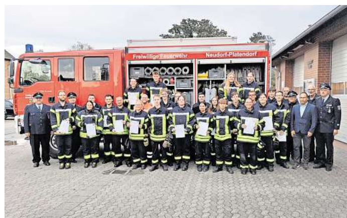
Prüfung erfolgreich bestanden: In der Sassenburg endeten jetzt gleich zwei Ausbildungen.

Feuerwehren laufen daher unvermindert weiter.