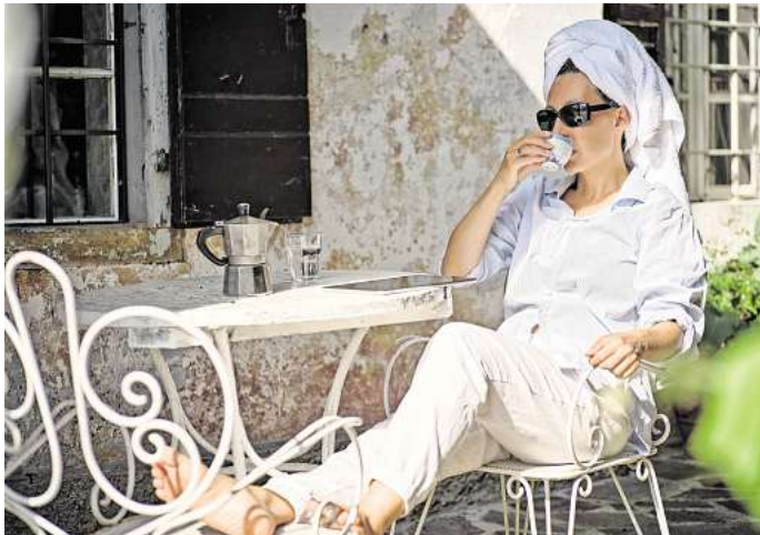
La Dolce Vita trifft auf Jomo: Espresso trinken und entspannen.

Bei einem Jomo-Urlaub wird der Druck, möglichst viel erleben zu müssen oder das perfekte Bild für Social Media zu schießen, bewusst zu Hause gelassen. Stattdessen geht es darum, auf die eigenen Bedürfnisse zu hören, sich zu entspannen und das