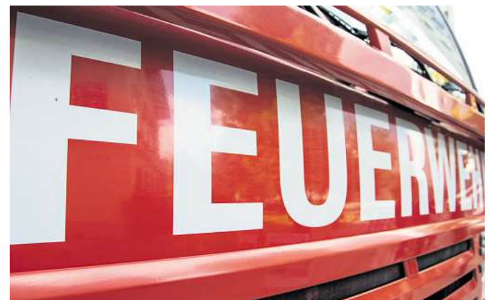
Zahlreiche Einsatzkräfte der Feuerwehr rückten zu einem Großeinsatz in Ehra-Lessien aus.