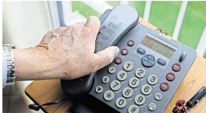
Tote Telefone in Wettmershagen: Unter anderem eine 88-Jährige ist seit 23. September ohne Festnetzanschluss, und ein Handy hat sie nicht.

„Das Kabel wurde entweder bei Tiefbauarbeiten Dritter oder