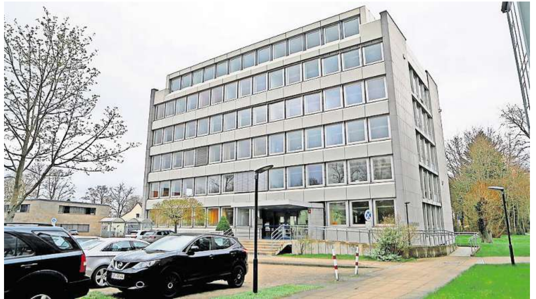
Land in Sicht?: Das Katasteramt zieht bald aus dem Behördenhaus in Gifhorn. Was dann mit der Immobilie passiert, ist weiter unklar.

Ganz ausschließen mag die Verwaltung das nicht. Anja-Cari-