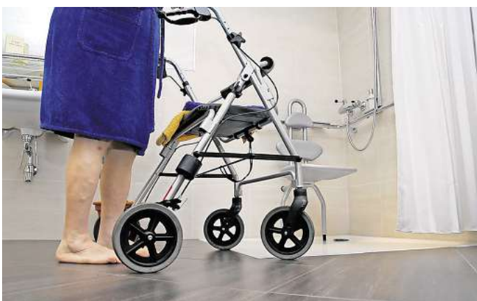
Es wird konkret: In Groß Oesingen entsteht ein Gebäude mit seniorengerechten Wohnungen.