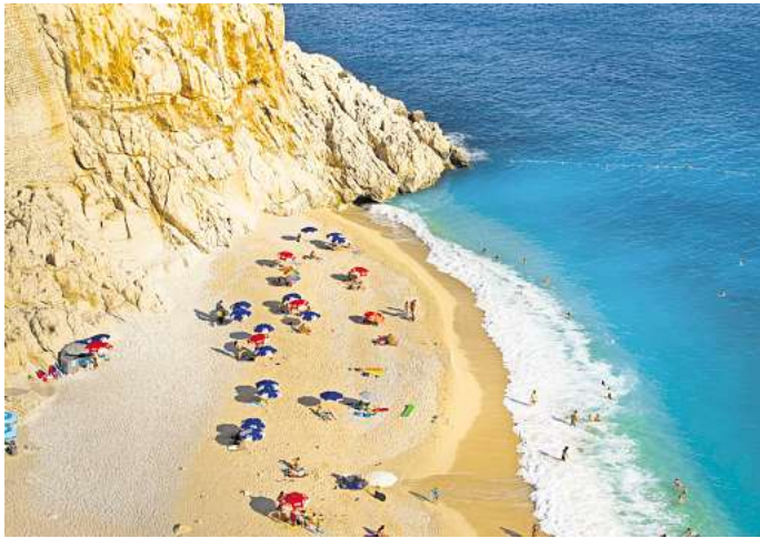
Die Türkische Riviera rund um Antalya ist im Sommer ein beliebtes und günstiges Pauschalreiseziel.

Für Reisen im Sommer 2025 bietet Alltours Rabatte von bis zu 55 Prozent an. Zwar gelten