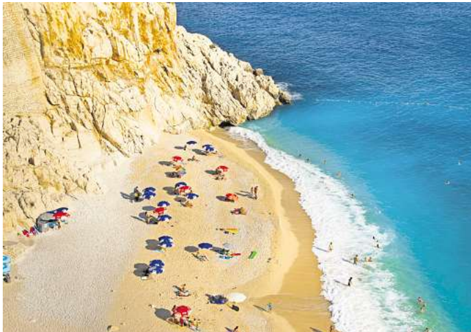
Die Türkische Riviera rund um Antalya ist im Sommer ein beliebtes und günstiges Pauschalreiseziel.

Für Reisen im Sommer 2025 bietet Alltours Rabatte von bis zu 55 Prozent an. Zwar gelten