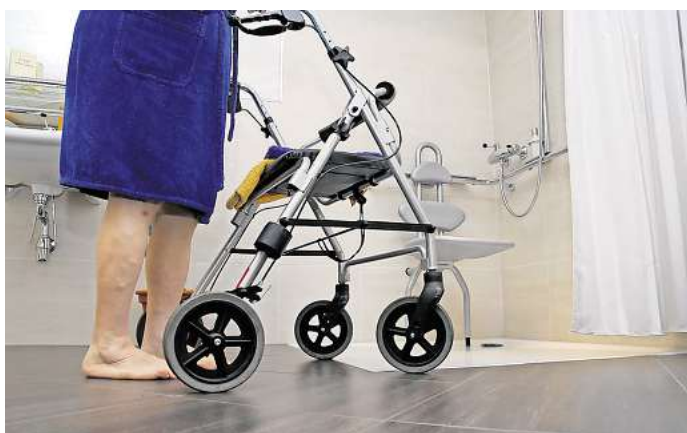
Es wird konkret: In Groß Oesingen entsteht ein Gebäude mit seniorengerechten Wohnungen.

Bürgermeister Heers berichtete, dass die Dorfgemeinschaft in Zahreholz zusammen mit Kindern ein Insektenhotel gebaut habe. Auf dem Friedhof habe man teils aus Spenden elf Bäume für Baumgrabstellen gepflanzt. Die Landfrauen verschönern derzeit das Wartehäuschen in der Klein Oesinger Straße. Und die neue Halle des Bauhofes wird demnächst errichtet.