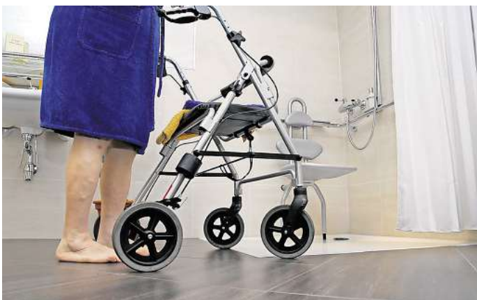
Es wird konkret: In Groß Oesingen entsteht ein Gebäude mit seniorengerechten Wohnungen.