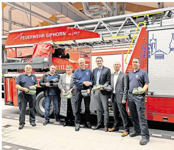
Sag's mit Pizza und anderen Geschenken: Aldi bedankte sich jetzt bei Gifhorns Feuerwehr für den Einsatz beim Großbrand des Marktes an der Adam-Riese-Straße.

Die beim Einsatz getragenen Schuhe werden über einen separaten Kleidertransport in die Wäscherei im Feuerwehrgerätehaus gebracht, erklärt Aldi den Hintergrund der Spende.