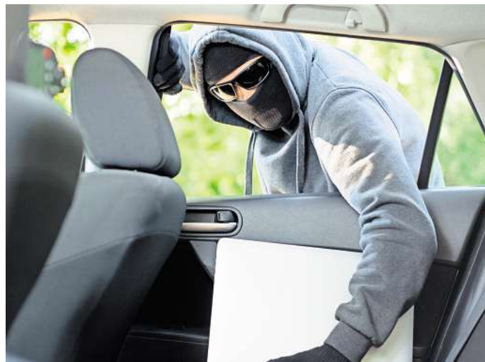
Im Kreis Gifhorn sind offenbar Betrüger und Diebe unterwegs.

In Meine waren ebenfalls in der vergangenen Woche zur Mittagszeit Diebe unterwegs. Dabei hatten sie es auf eine 60-jährige Frau abgesehen, die auf dem Parkplatz des Raiffeisenmarktes ihren Kofferraum belud. Die Unbekannten sollen währenddessen die Handtasche der Frau gestohlen haben, die hinterm Fahrersitz lag.