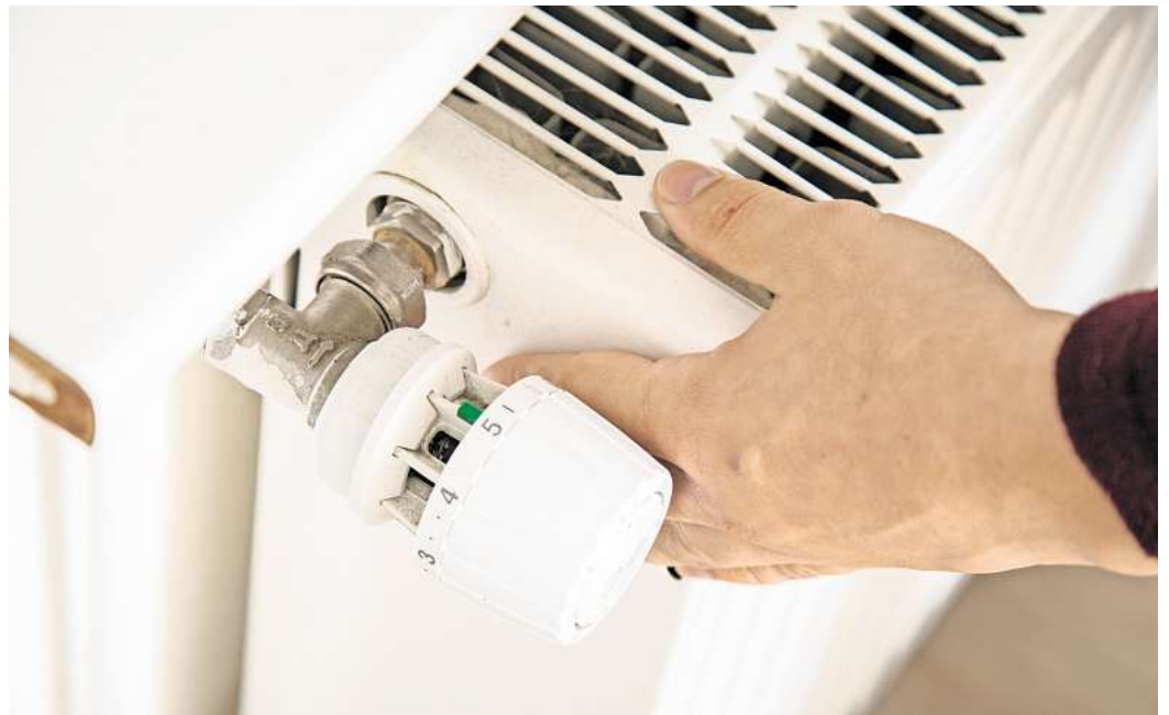
Keine fossilen Brennstoffe mehr zum Heizen: Das Nahwärmenetz in Tiddische und Hoitlingen rückt näher.

In der Einwohnerfragestunde fragte eine ZuhörerIn nach dem