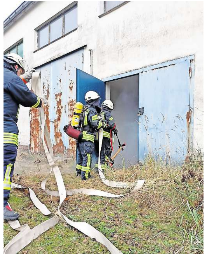
Ein Lagerfeuer in einer Gewerbehalle gerät außer Kontrolle: Kniffliges Übungsszenario in Ehra-Lessien.

Alle Züge der Feuerwehr arbeiteten intensiv zusammen. In jedem Zug funktionierten bestimmte Übungsteile besonders gut, das vierköpfige Beobachterteam deckte aber auch Optimierungspotenzial auf. Die Erkenntnisse wurden nach Übungsende direkt mit den je-