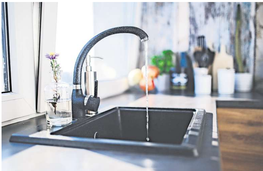
Neue Kalkulationen beim Wasserverband Gifhorn: Die Verbandsversammlung hat jetzt festgelegt, wo es teurer wird und wo billiger.

Auf die jetzige Preiserhöhung hat Lampe und Arms zufolge auch das Wetter Einfluss. Wegen des vielen Regens in den vergangenen beiden Jahren habe der Wasserverband zehn Prozent