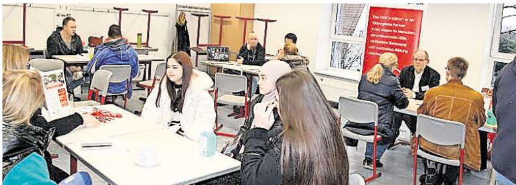
Klasse statt Masse: Die BBS I richtet erneut eine Speeddating-Kontaktbörse zwischen Ausbildungsbetrieben und zukünftigen Auszubildenden aus.

Veranstaltung über das Berufliche Gymnasium Wirtschaft sowie Gesundheit und Soziales am Montag, 13. Januar, um 19 Uhr in der Cafeteria; Informationsveranstaltung über das Berufliche Gymnasium Technik am Dienstag, 14. Januar, um 19 Uhr an den Berufsbildenden Schulen II (1. Koppelweg 50 in Gifhorn); Fachoberschule - Fachhochschulreife an den BBS I Gifhorn: Informationsveranstaltung über die Fachoberschule Wirtschaft am Montag, 20. Januar, um 19 Uhr in der Cafeteria der BBS I Gifhorn. Diese Veranstaltung richtet sich an Schülerinnen und Schüler, die den Sekundarabschluss I erreichen und die Fachhochschulreife anstreben.