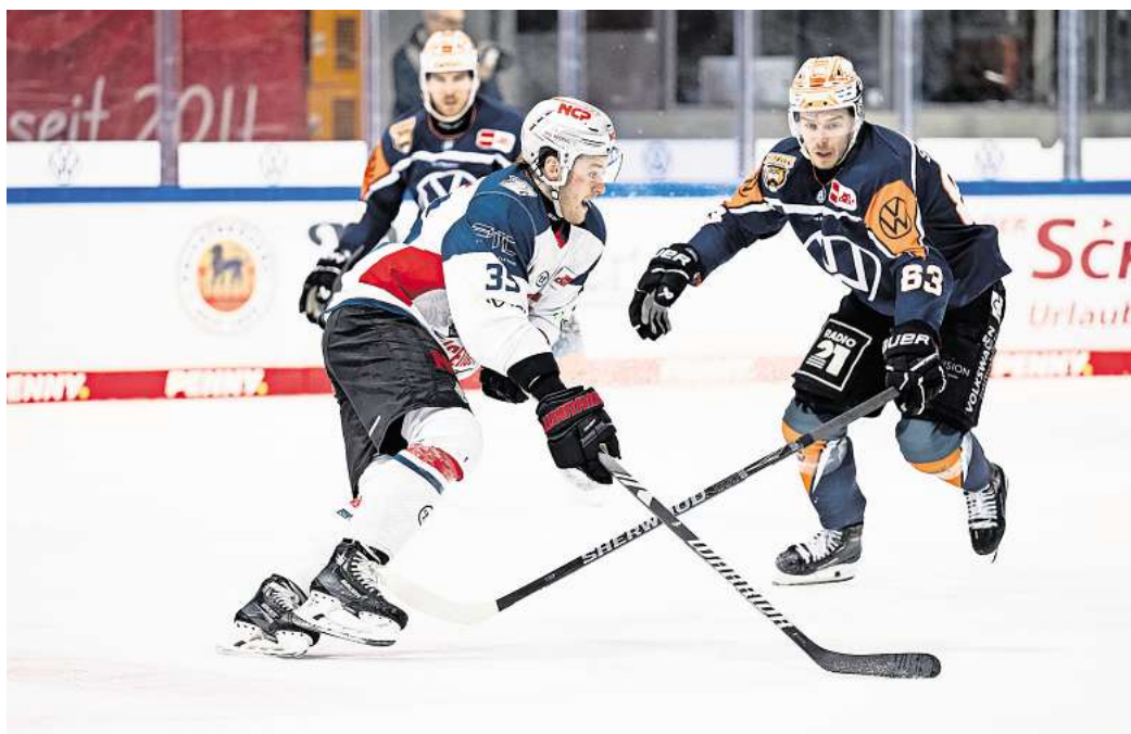
Für das Spiel der Grizzlys Wolfsburg gegen die Nürnberg Ice Tigers können Hallo-Leser Tickets gewinnen.

Die Bilanz zwischen den Grizzlys Wolfsburg und den Nürnberg Ice Tigers war in der vergangenen DEL-Saison ausgeglichen. Das erste Spiel im Herbst 2023 konnte Nürnberg für sich entscheiden. In Spiel Nummer zwei und drei behielten die Grizzlys das bessere Ende für sich. Im vierten Aufeinandertreffen verloren die Grizzlys vor heimischem Publikum mit 2:4. In der aktuellen Saison 24/25 haben beide Teams bereits einmal gegeneinander gespielt. Dieses Duell haben die Grizzlys am 25. Oktober mit 1:2 in der Eis-Arena in Wolfsburg verloren. Gelingt den Grizzlys am Freitag die Revanche?