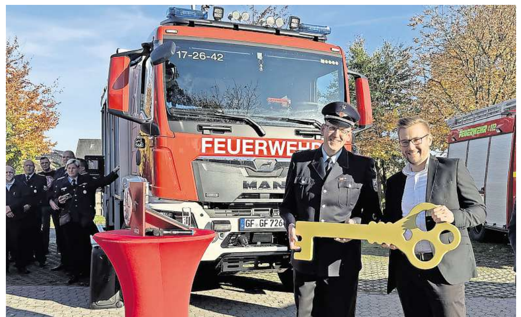
Feierstunde: Kürzlich übergab die Samtgemeinde ein TLF 4000 an die Feuerwehr Ehra-Lessien. Ein weiteres Fahrzeug ist in Planung.

Die Ausschussmitglieder empfahlen den Haushaltsplan dem Samtgemeinderat, der die letztendliche Entscheidung trifft, zum Beschluss.