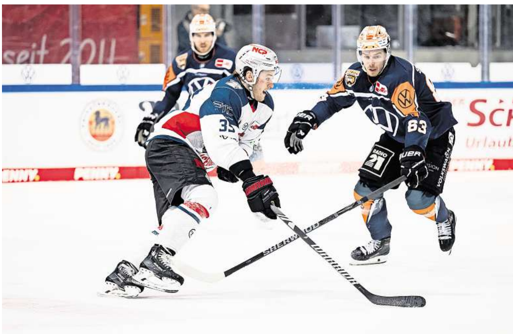
Für das Spiel der Grizzlys Wolfsburg gegen die Nürnberg Ice Tigers können Hallo-Leser Tickets gewinnen.

Die Bilanz zwischen den Grizzlys Wolfsburg und den Nürnberg Ice Tigers war in der vergangenen DEL-Saison ausgeglichen. Das erste Spiel im Herbst 2023 konnte Nürnberg für sich entscheiden. In Spiel Nummer zwei und drei behielten die Grizzlys das bessere Ende für sich. Im vierten Aufeinandertreffen verloren die Grizzlys vor heimischem Publikum mit 2:4. In der aktuellen Saison 24/25 haben beide Teams bereits einmal gegeneinander gespielt. Dieses Duell haben die Grizzlys am 25. Oktober mit 1:2 in der Eis-Arena in Wolfsburg verloren. Gelingt den Grizzlys am Freitag die Revanche?