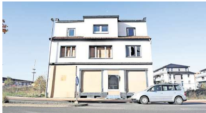
Lost place an der Braunschweiger Straße in Gifhorn: Der Leerstand ist nicht zu übersehen.

Die Stadt hat in diesem Jahr ihr aufwändig erstelltes Integriertes