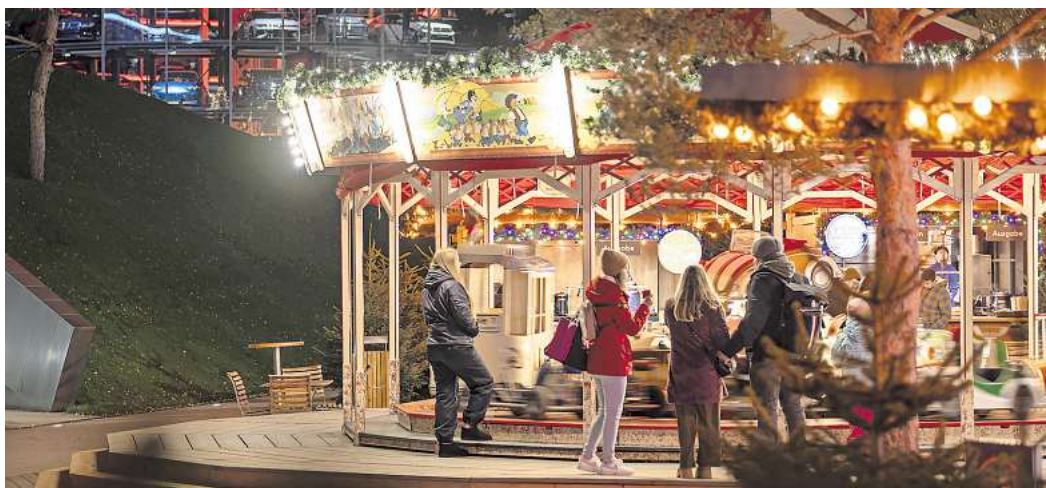
Winterwunderland in Wolfsburg: Der Weihnachtsmarkt in der Autostadt.

50-Euro-Gutschein von Expert zu gewinnen