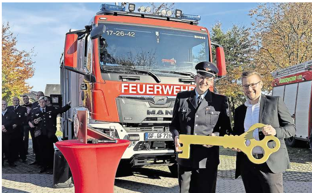
Feierstunde: Kürzlich übergab die Samtgemeinde ein TLF 4000 an die Feuerwehr Ehra-Lessien. Ein weiteres Fahrzeug ist in Planung.

Die Ausschussmitglieder empfahlen den Haushaltsplan dem Samtgemeinderat, der die letztendliche Entscheidung trifft, zum Beschluss.