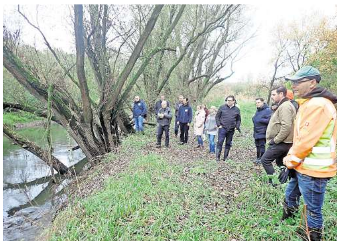
Barben-Projekt: Bei einem gemeinsamen Besichtigungstermin begutachteten alle Beteiligten zusammen die umgesetzte Maßnahme.

Damit ist die Oker nun auf 900 Metern Länge ökologisch aufge-