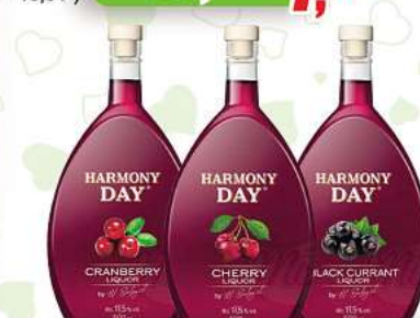
Harmony Day Likör