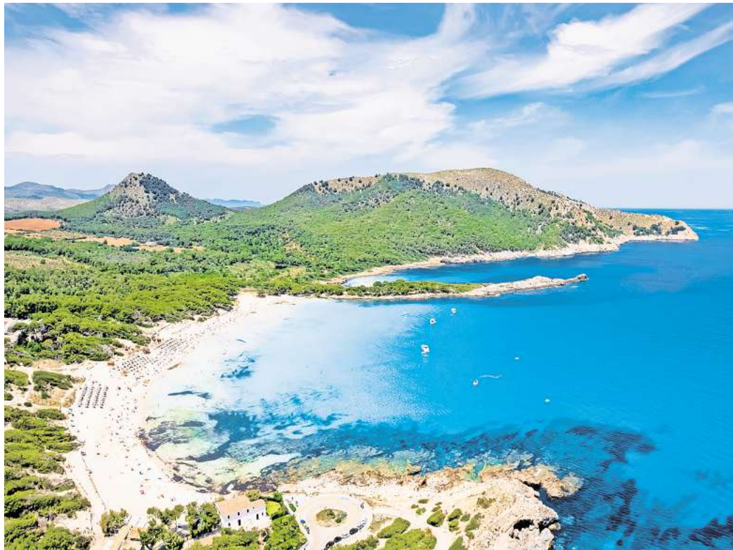
Zählt die Caló des Moro zu den schönsten Stränden Mallorcas? Die Einheimischen sagen: Ja.

Darüber hinaus gilt die Playa de Muro als besonders familienfreundlich.