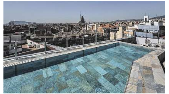
Zahlreiche Hotels, wie hier das 4* Catalonia Atenas in Barcelona, stehen in allen Zielen zur Auswahl.

Neben den Städtezielen stehen auch die schönsten Urlaubsgebiete im Flugplan. Die traumhafte portugiesische Algarve, Santorin, Sizilien, Chalkidiki, die Liparischen Inseln oder Sardinien sind ebenfalls mit Direktflug exklusiv bei momento by DER SCHMIDT buchbar. Immer mit großer Hotelauswahl