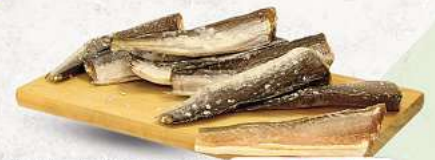
Getrockneter und gesalzener Hecht an unserer Frischetheke je 100g