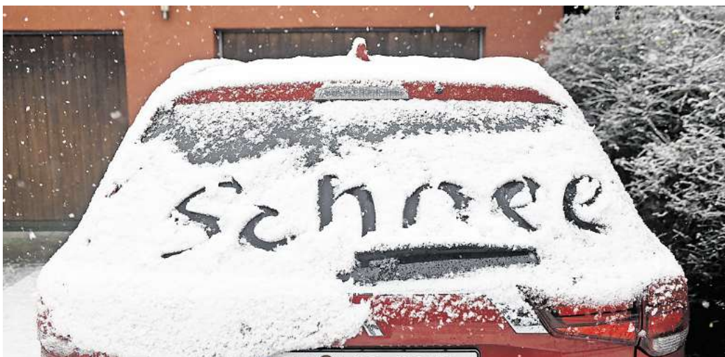
Der Winter ist bislang mehr oder weniger ausgefallen. Wünschen Sie sich noch einmal Schnee in diesem Frühjahr? (Symbolbild)

Für viele Winterfans ist das eine Enttäuschung. Sie vermischen verschneite Landschaften, Schlittenfahren und gemütliche Wintertage. Besonders Kinder und Wintersportler hoffen weiterhin auf Schnee. Doch nicht alle sehen das so. Wer sich nach Sonne und wärmeren Temperaturen sehnt, freut sich über den möglichen Frühstart in den Frühling. Gartenbesitzer und