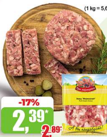
Sülze Satz temenski