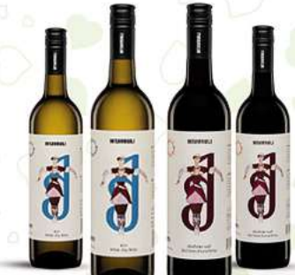
Georgischer Weiss oder Rotwein