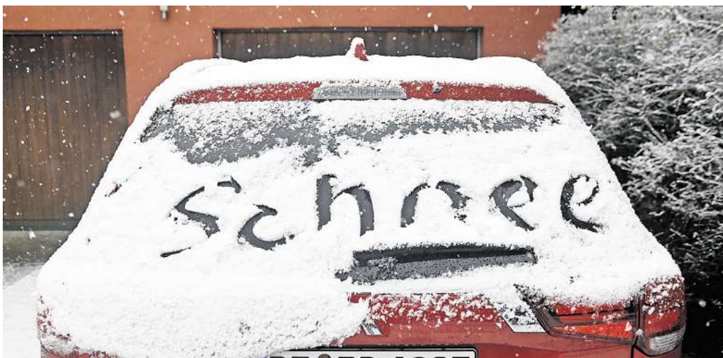
Der Winter ist bislang mehr oder weniger ausgefallen. Wünschen Sie sich noch einmal Schnee in diesem Frühjahr? (Symbolbild)

Für viele Winterfans ist das eine Enttäuschung. Sie vermissen verschneite Landschaften, Schlittenfahren und gemütliche Wintertage. Besonders Kinder und Wintersportler hoffen weiterhin auf Schnee. Doch nicht alle sehen das so. Wer sich nach Sonne und wärmeren Temperaturen sehnt, freut sich über den möglichen Frühstart in den Frühling. Gartenbesitzer und