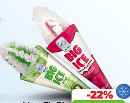
Limo Eis Big

Himbeer oder Kiwigeschmack Waffelhörnchen