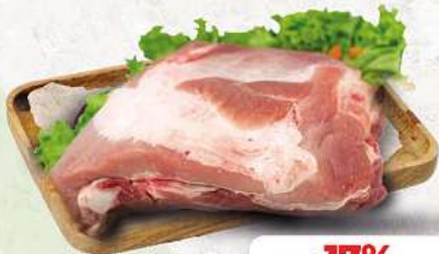
Dicke Rippe vom Schwein an unserer Frischetheke je 1 kg

Herkunftsnachweise von unseren Produkten - siehe Etikettierung