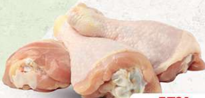
Hähnchenunterschenkel an unserer Frischetheke je 1 kg