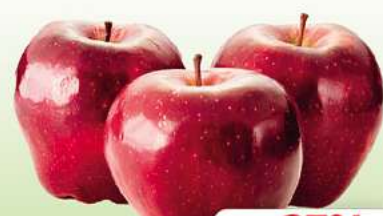
RED Chief Äpfel