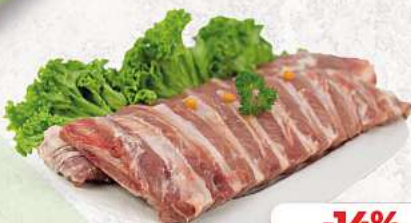
Schweinebauchrippen an unserer Frischetheke je 1 kg

Herkunftsnachweise von unseren Produkten - siehe Etikettierung