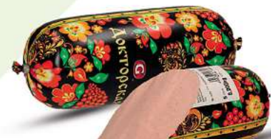
Brühwurst Doktorskaja "Chochloma"

Mo. - Fr.: 08:00 - 19:00 Uhr | Samstag: 08:00 - 16:00 Uhr