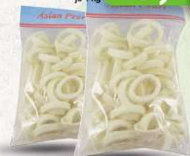
Tintenfischringe roh, sauber 700g (1 kg = 12,69*)