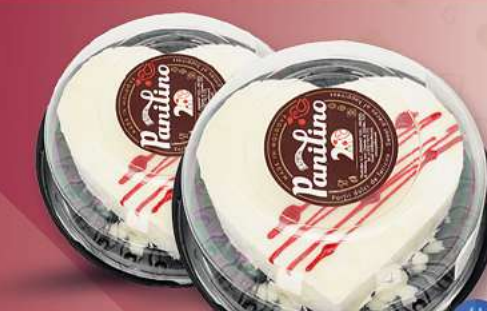
Panilino Torte Herz