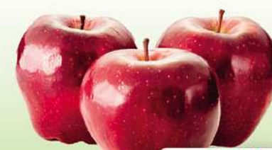
RED Chief Äpfel