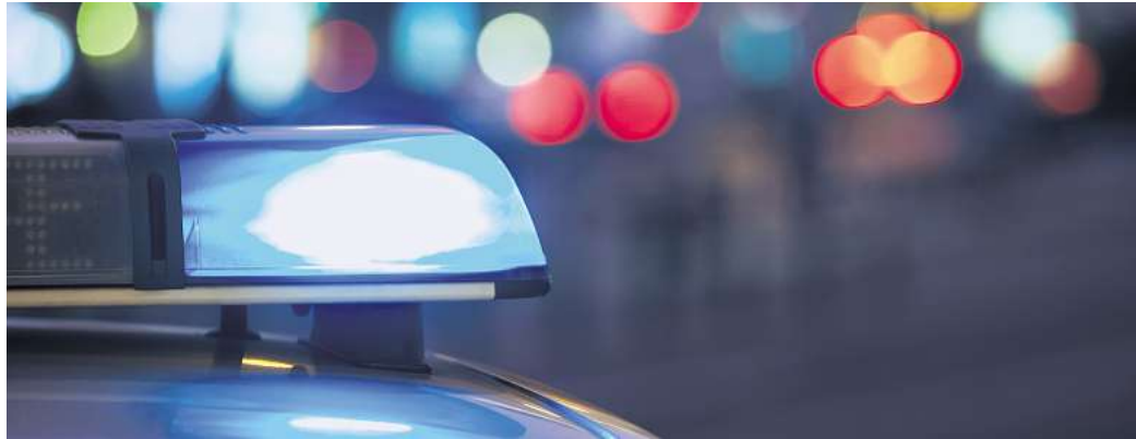
Polizei meldet Leichenfund: Eine vermisste Frau wurde in einem Waldstück bei Wahrenholz tot aufgefunden.

Trotz fehlender Hinweise auf eine Fremdeinwirkung liegt der Fall derzeit bei der Hildesheimer Staatsanwaltschaft. „Wenn keine eindeutige Todesursache vorliegt, werden automatisch Polizei und Staatsanwaltschaft einge-