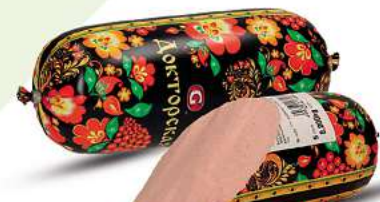
Brühwurst Doktorskaja "Chochloma"

Mo. - Fr.: 08:00 - 19:00 Uhr | Samstag: 08:00 - 16:00 Uhr