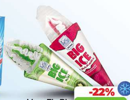
Limo Eis Big

Himbeer oder Kiwigeschmack Waffelhörnchen