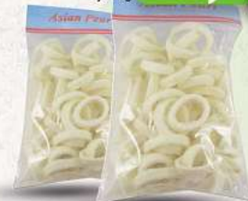
Tintenfischringe roh, sauber 700g (1 kg = 12,69*)