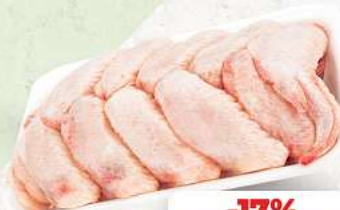
Hähnchenflügel an unserer Frischetheke je 1 kg