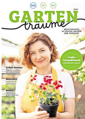
Das neue AZ/WAZ/PAZ-Gartenmagazin erscheint im März.

Unter dem Motto „Mein grünes Paradies zuhause“, können Sie uns ab sofort Ihr Lieblingss motive aus Ihrer persönlichen Naturoase senden. Ihre Fotos haben die Chance, im neuen verlagseigenen Magazin „Gartenträume – Mein Paradies in Garten, Balkon und Terrasse“ zu erscheinen, das PAZ, AZ und WAZ am 29. März herausbringen. Themen, Wissen, Gestaltung, Pflanzen, gepaart mit Tipps und