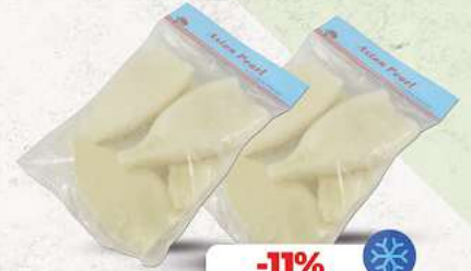
Tintenfisch Tuben roh sauber Packung 700g (1 kg = 12,69*)