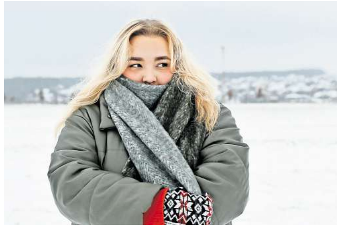
Wir Menschen wissen in der Regel instinktiv, wann es Zeit wird, uns aufzuwärmen.

Auch die bekannte Gänsehaut gehört zum Frieren, hat aber beim Menschen keine Funktion mehr. „Hätten wir Federn oder Fell würde die Gänsehaut dafür sorgen, dass es sich aufstellt und die warme Luft um uns herum