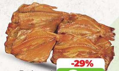
Rotbarsch kaltgeräuchert an unserer Frischetheke je 1 kg