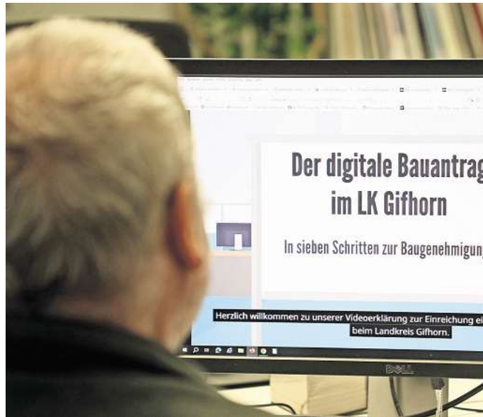
Digitalisierung beim Landkreis Gifhorn: Bauanträge sind ab 1. Mai nur noch papierlos zu stellen.