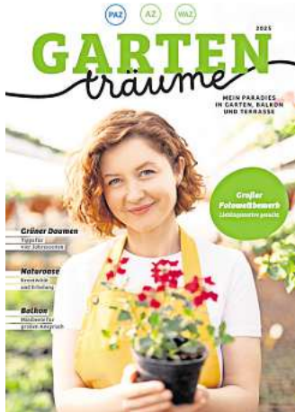
Das neue AZ/WAZ/PAZ-Gartenmagazin erscheint im März.

Unter dem Motto „Mein grünes Paradies zuhause“, können Sie uns ab sofort Ihr Lieblingss motive aus Ihrer persönlichen Naturoase senden. Ihre Fotos haben die Chance, im neuen verlagseigenen Magazin „Gartenträume – Mein Paradies in Garten, Balkon und Terrasse“ zu erscheinen, das PAZ, AZ und WAZ am 29. März herausbringen. Themen, Wissen, Gestaltung, Pflanzen, gepaart mit Tipps und