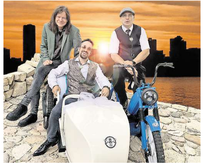
Rock 'n' Roll und Classic Rock, bis die Schuhe qualmen: Headliner des Springtie Festivals ist die Band The Quintenz.