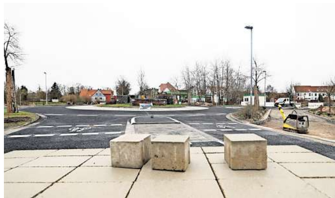
Dauerbaustellen in Gifhorn: Die Hamburger Straße ist inzwischen wieder vorläufig frei - bis zum nächsten Bauabschnitt.

Auch Landesbehörde und Landkreis wünschen sich ihren Sprecherinnen zufolge ein schnelleres Tempo. Doch in der Praxis sei das nicht machbar. Arbeiten auf engen Verhältnissen, viele Partner, die ihre Arbeiten aufeinander abstimmen müssen, und die Grundstücke sollen so weit wie möglich erreichbar