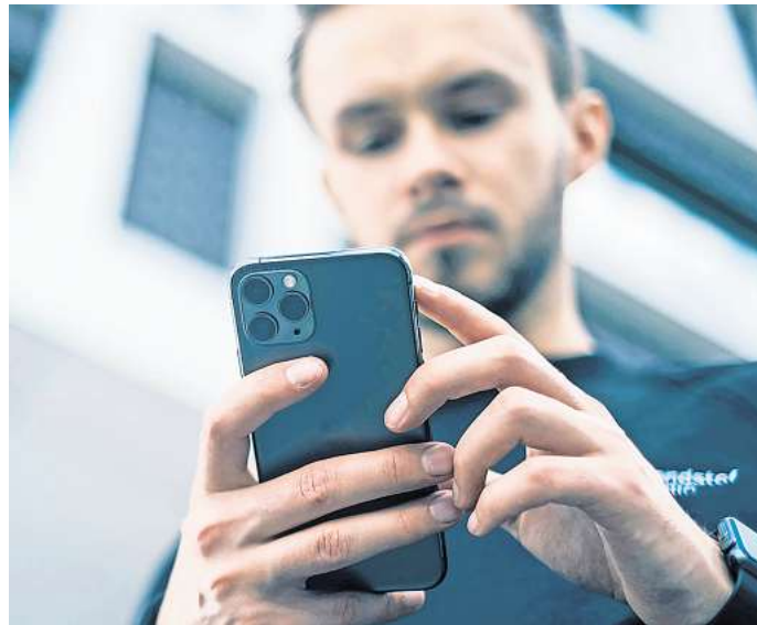
Immer dabei bleiben: Gamification nennt sich das Zauberwort, damit das Lernen den Menschen Spaß macht und sie motiviert werden.