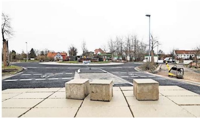
Dauerbaustellen in Gifhorn: Die Hamburger Straße ist inzwischen wieder vorläufig frei - bis zum nächsten Bauabschnitt.

Auch Landesbehörde und Landkreis wünschen sich ihren Sprecherinnen zufolge ein schnelleres Tempo. Doch in der Praxis sei das nicht machbar. Arbeiten auf engen Verhältnissen, viele Partner, die ihre Arbeiten aufeinander abstimmen müssen, und die Grundstücke sollen so weit wie möglich erreichbar