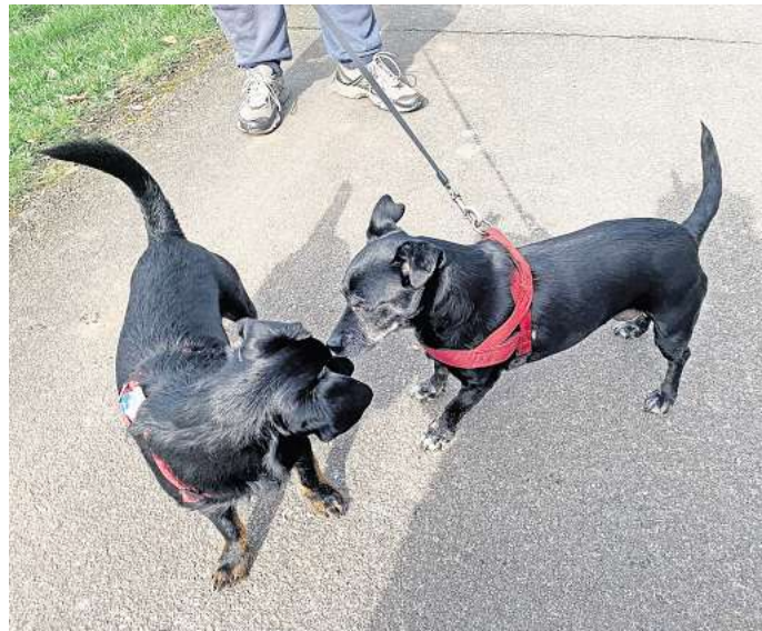
Fellige Vierbeiner: In der Samtgemeinde Brome können Hunde jetzt auch online an- und abgemeldet werden.

Genutzt werde dafür ein System des pmHundManagers. Unterlagen wie Versicherungs- und Sachkundenachweise könnten darüber online eingereicht werden. Gleichzeitig ist die Anmeldung im Hunderegister Niedersachsen (optional) möglich. Für die Anmeldung steht den Nutzern eine detaillierte Schritt-für-Schritt-Anleitung auf der Homepage der Samtgemeinde zur Verfügung. Die Digitalisierung der Hundesteuer-Anmeldung sei zum jetzigen Zeitpunkt erfolgt, weil sie „relativ einfach umzusetzen war und viel genutzt wird, weil es viele Halter gibt“.