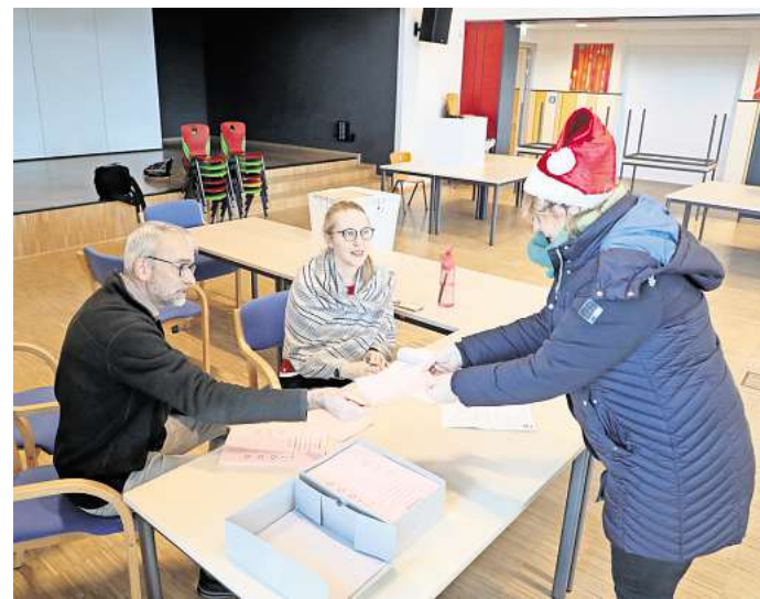
Einstimmige Entscheidung: Der Samtgemeinderat hat Einsprüche gegen die Gültigkeit der Bürgermeisterwahl vom Dezember abgewiesen.