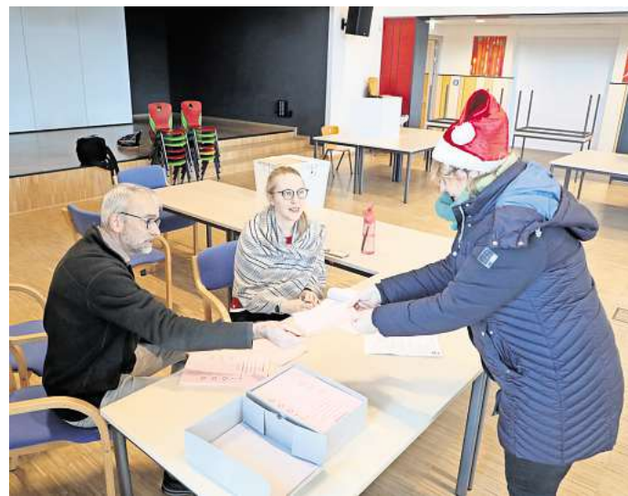
Einstimmige Entscheidung: Der Samtgemeinderat hat Einsprüche gegen die Gültigkeit der Bürgermeisterwahl vom Dezember abgewiesen.

Insgesamt sei festzustellen, dass „die von Herrn Ehrhoff vorgebrachten Verstöße in keiner Weise eine Beeinträchtigung der Samtgemeindebürgermeisterwahl darstellen. Verstöße sind nicht festzustellen“. Der Wahlleiterspruch sei deshalb aus Sicht des Wahlleiters als unbegründet zurückzuweisen. Die Ratsdamen und -herren folgten dieser Einschätzung von Oltersdorf offenkundig. Der zweite Einspruch gegen die Gültigkeit der Wahl, der mit „Eine Bürgerin aus Tappenbeck“ unterzeichnet war, wurde aufgrund der Anonymität als unzulässig abgewiesen.