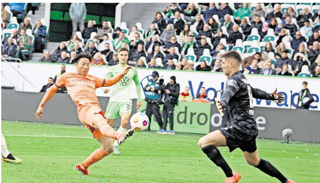
Für das Spiel des VfL Wolfsburg gegen den VfL Bochum können Leser Eintrittskarten gewinnen.

Nach der Winterpause hat der VfL Wolfsburg vor heimischen Publikum noch kein Spiel verloren. Drei Partien fanden seither in der Volkswagen Arena statt. Nach der kurzen Unterbrechung über Weihnachten war zunächst Borussia Mönchengladbach zu Besuch in Wolfsburg. Mit 5:1 schickten die Wölfe die Gäste wieder nach Hause. Gegen Holstein Kiel und Bayer Leverkusen gab es in der Folge jeweils zwei Unentschieden (2:2, 0:0). Besonders gegen Bayer Leverkusen zeigte das Team von VfL-Trainer Ralph Hasenhüttl eine starke Leistung.