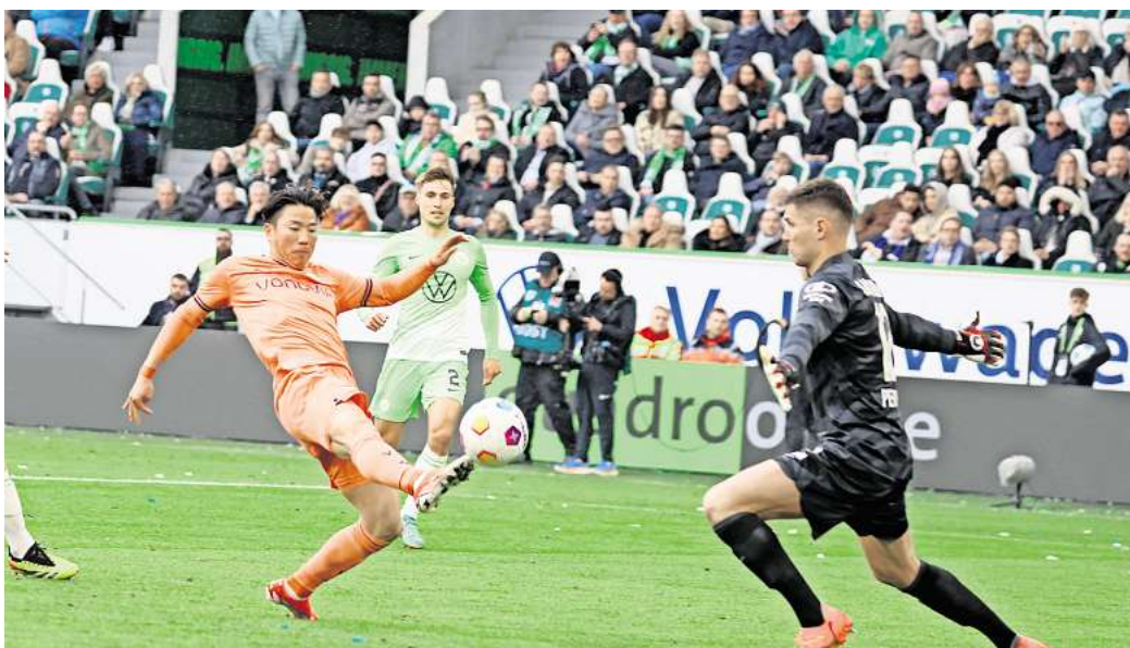
Für das Spiel des VfL Wolfsburg gegen den VfL Bochum können Leser Eintrittskarten gewinnen.

Nach der Winterpause hat der VfL Wolfsburg vor heimischen Publikum noch kein Spiel verloren. Drei Partien fanden seither in der Volkswagen Arena statt. Nach der kurzen Unterbrechung über Weihnachten war zunächst Borussia Mönchengladbach zu Besuch in Wolfsburg. Mit 5:1 schickten die Wölfe die Gäste wieder nach Hause. Gegen Holstein Kiel und Bayer Leverkusen gab es in der Folge jeweils zwei Unentschieden (2:2, 0:0). Besonders gegen Bayer Leverkusen zeigte das Team von VfL-Trainer Ralph Hasenhüttl eine starke Leistung.