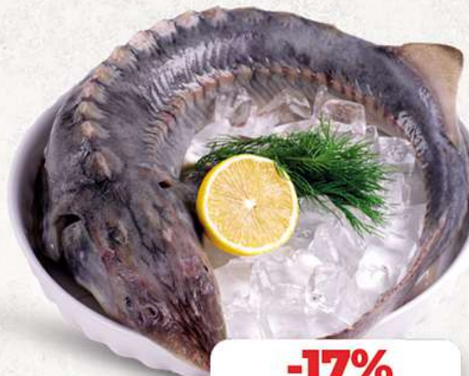
Frischer Stör an unserer Frischetheke je 1 kg