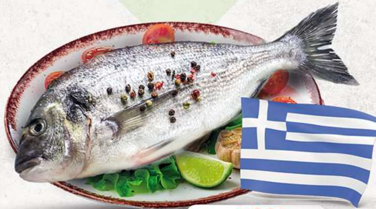
Griechische Dorade Royal an unserer Frischetheke je 1 kg