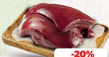
Rinderleber an unserer Frischetheke je 1 kg