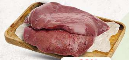
Schweineleber an unserer Frischetheke je 1 kg