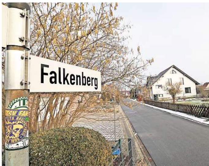
Sanierung steht an: Auf der Straße Falkenberg in Gamsen rücken im Mai die Bagger an.

Sie sollen sich farblich von der übrigen Verkehrsfläche abheben – mit anthrazitfarbenem statt rotbuntem Pflaster.