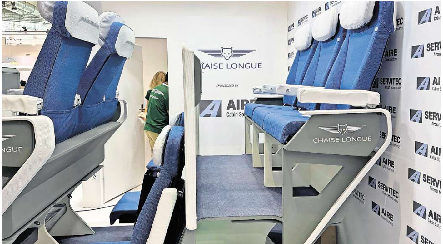
So soll das Sitzreihen-Konzept „Chaise Longue“ aussehen.