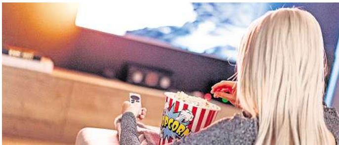
Schauen Sie noch klassisches Fernsehen? Machen Sie mit bei unserer Umfrage.

Gleichzeitig bleiben Streaming-Dienste, Mediatheken und Video-Plattformen stabil in der Nutzung. Viele Menschen schätzen die Flexibilität, Inhalte jederzeit abrufen zu können, statt sich nach festen Sendezeiten zu richten. Dennoch bleibt das klassische Fernsehen – vor allem bei älteren Zuschauern – weiterhin ein wichtiger Bestandteil des Medienkonsums.