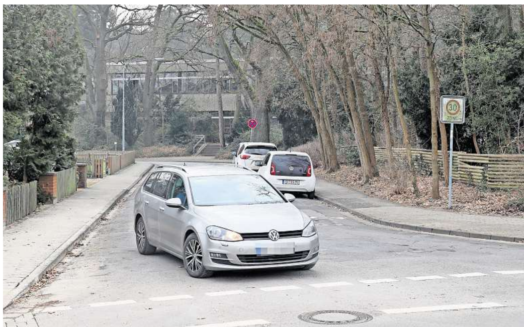
Aus dieser Richtung künftig nicht mehr: Zur Sicherheit der Otto-Hahn-Gymnasiasten macht die Stadt Gifhorn den Brandweg zur Einbahnstraße.

Deshalb richtet die Stadt ab 24. Februar eine Einbahnstraßenregelung im Brandweg zwischen Dannenbütteler Weg und Breiter Weg ein, mit Fahrtrichtung von Dannenbütteler Weg nach Breiter Weg. Den Brandweg können Kraftfahrer dann ausschließlich über Breiter Weg, Rosenweg oder Fliederstraße in Richtung Dannenbütteler Weg zurück verlassen. Kornath: „Der Radverkehr wird in beide Rich-