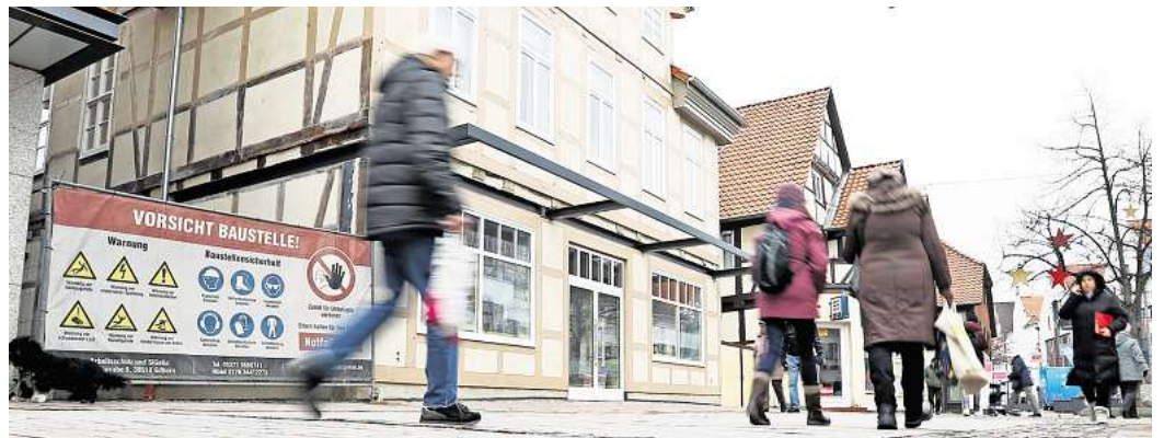
Wandel der Innenstadt in Gifhorn: Der Mix aus Handel und Gastronomie mit Erlebnischarakter – wie hier beim geplanten Mühlenladen im Steinweg – wird laut Experten künftig immer wichtiger.

Kritik am Gastronomie-Angebot bezog sich laut Gutachten auf mangelnde Individualität und To-Go-Angebote. Auffällig: Eisdiele wurden besonders positiv bewertet, Kneipen und Bars hingegen mehrheitlich als negativ.