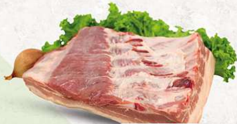
Schweinebauch an unserer Frischetheke je 1 kg

Herkunftsnachweise von unseren Produkten - siehe Etikettierung