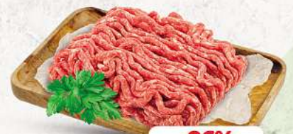
Schweinehackfleisch an unserer Frischetheke je 1 kg