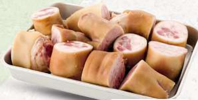
Schweinpfoten an unserer Frischetheke je 1 kg