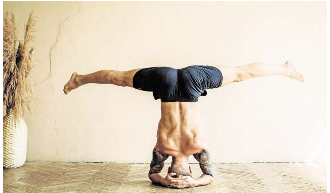
Gesundheit ist ein Markt, der immer weiter wächst.