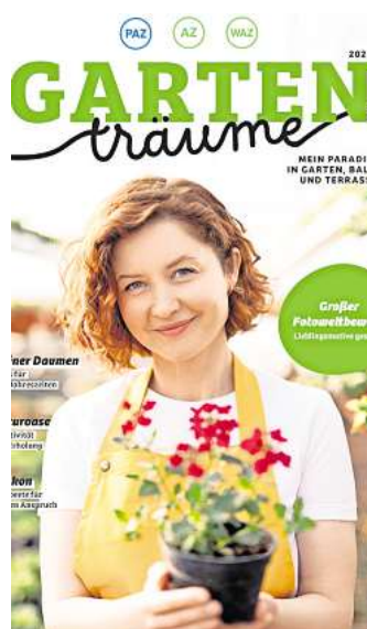
Mit etwas Glück erscheint Ihr Gartenfoto im neuen Gartenmagazin von AZ, WAZ und PAZ.

Machen Sie mit und senden Sie uns Ihren Gartenschnappschuss bis zum 26. Februar zu. Schaufeln, pflanzen, säen, ernten, spielen oder entspannen – an Motiven rund um Blumen, Bäume, Gemüse, Gestaltungsideen, Kinder, Großeltern, Sonntag, Garten im Regen, Indian Summer oder Wintergrillen mangelt es nicht. Senden Sie