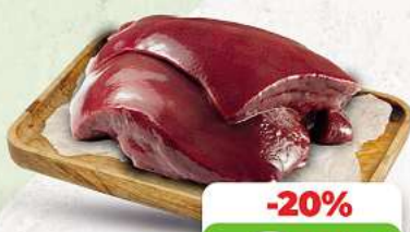
Rinderleber an unserer Frischetheke je 1 kg