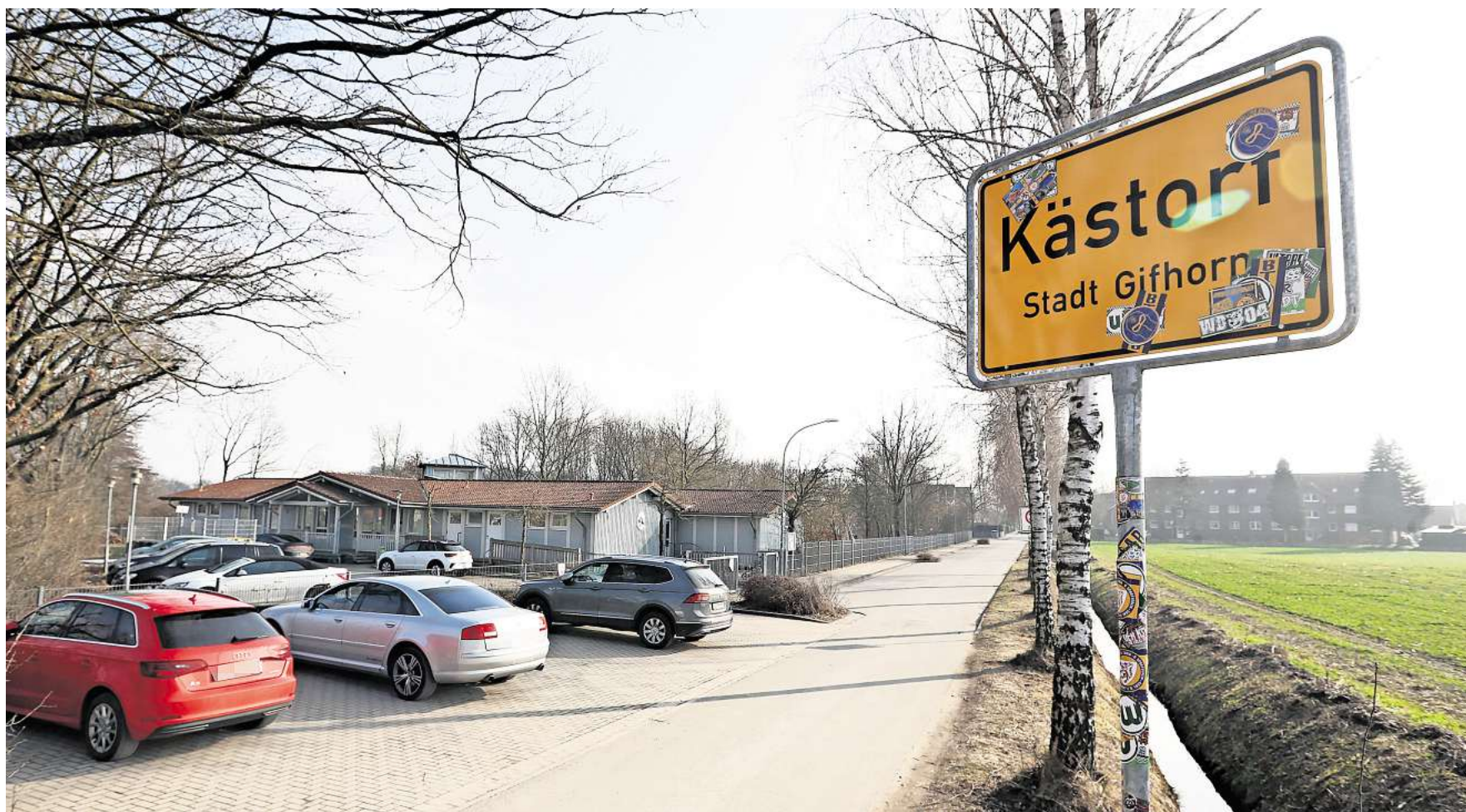
Wohnen am Kindergarten: In Kästorf soll ein neues Wohngebiet entstehen, die Planungen laufen.