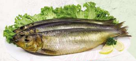
Heringe mit Kopf rund, kalt geräuchert je 1 kg