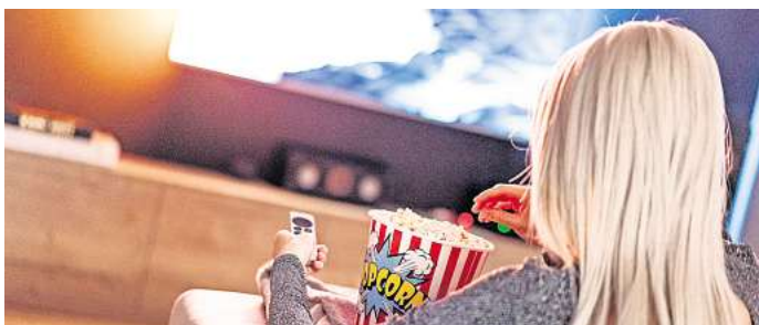
Schauen Sie noch klassisches Fernsehen? Machen Sie mit bei unserer Umfrage.

Gleichzeitig bleiben Streaming-Dienste, Mediatheken und Video-Plattformen stabil in der Nutzung. Viele Menschen schätzen die Flexibilität, Inhalte jederzeit abrufen zu können, statt sich nach festen Sendezeiten zu richten. Dennoch bleibt das klassische Fernsehen – vor allem bei älteren Zuschauern – weiterhin ein wichtiger Bestandteil des Medienkonsums.