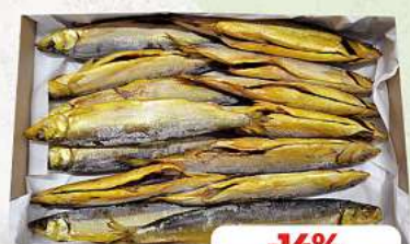
Felchen mit Kopf ausgenommen, kalt geräuchert je 1 kg