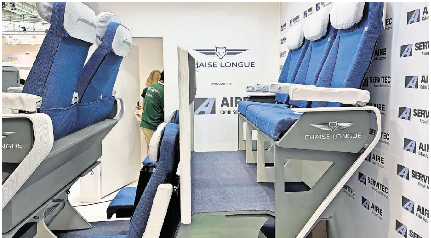
So soll das Sitzreihen-Konzept „Chaise Longue“ aussehen.