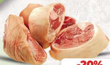
Eisbein/Haxe an unserer Frischetheke je 1 kg

Herkunftsnachweise von unseren Produkten - siehe Etikettierung