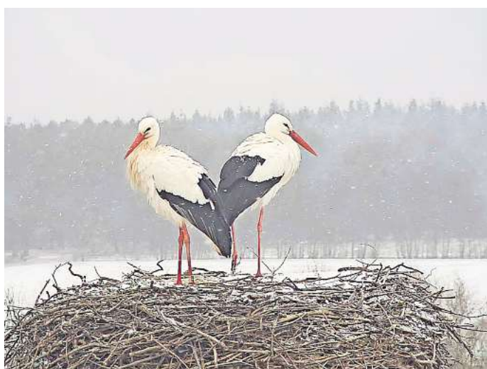
Das Storchenpaar Mai und Fridolin ist wieder vereint.

Eigentlich beginnt für die Storchenmännchen Mitte Februar eine arbeitsreiche Zeit, denn sie bringen nach ihrer Ankunft das Nest in Ordnung, bevor die Weibchen aus dem Süden einfliegen. Doch in diesem Jahr war eben Mai schneller. „Dass Mai jetzt schon