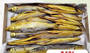
Felchen mit Kopf ausgenommen, kalt geräuchert je 1 kg