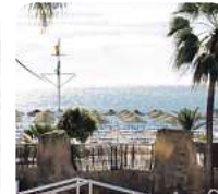
4* Ibersol Terremolinos Beach