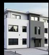
Fenster & Rollläden Schiebeanlagen Faltanlagen

V. Gloger Direktförderung ohne komplizierte Antragstellung auf alle Produkte