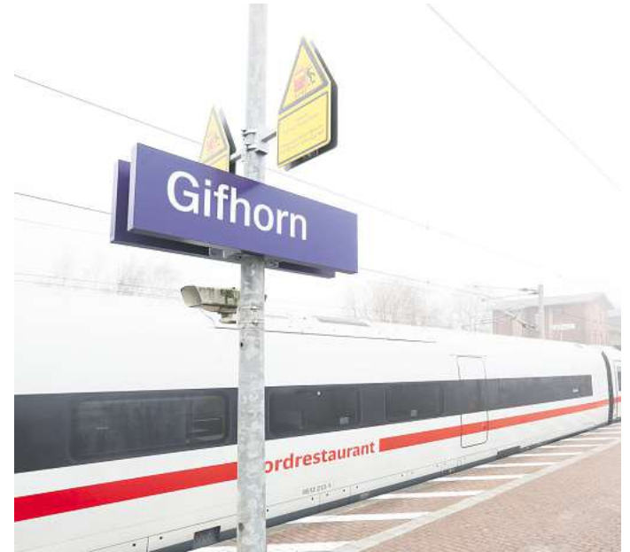
Außerplanmäßiger ICE-Halt in Gifhorn: 340 Reisende mussten den Zug wegen einer Bedrohungslage räumen.

Verletzt wurde letztendlich niemand, berichtet Müller. Die Ermittlungen gegen den 44-jährigen Afghanen laufen, in nunmehr zwei Fällen: Bundespolizisten leiteten Strafverfahren wegen Beleidigung und Bedrohung wegen des Vorfalles auf dem Hauptbahnhof Hannover ein. Ein weiteres Ermittlungsverfahren, wegen Störung des öffentlichen Friedens durch Androhung von Straftaten, wurde wegen des Stopps in Gifhorn eingeleitet.