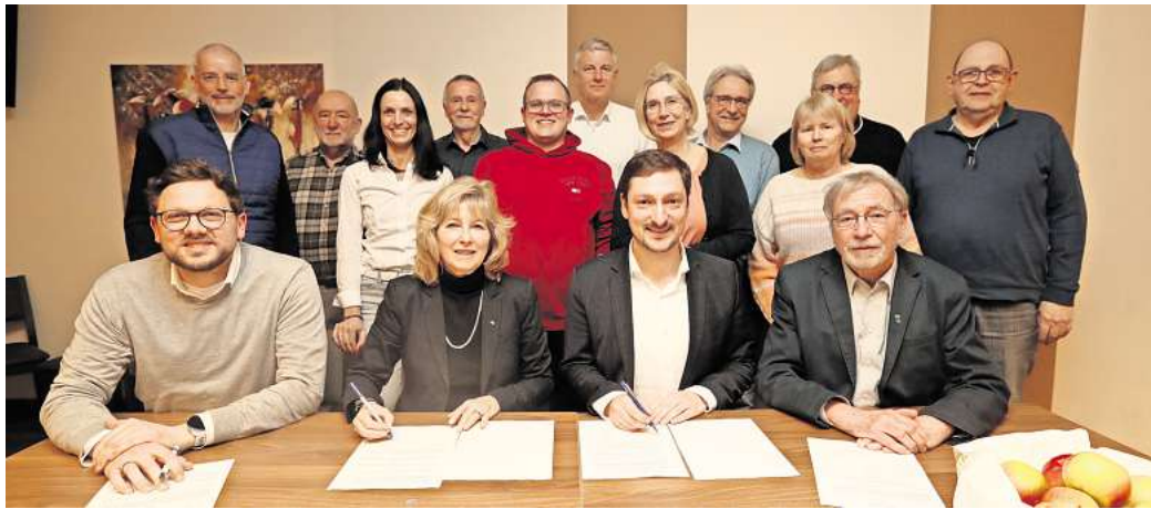
Bürgerliches Engagement fördern: Mit der Unterzeichnung eines Treuhandvertrags wurde jetzt die „Hehlenriedestiftung“ in der Samtgemeinde Isenbüttel auf den Weg gebracht.

„Es ist für uns einfacher, den bürokratischen Kram an deren Engagementzentrum GmbH abzugeben“, so Gaus bei der Vertragsunterzeichnung im Isenbüttel Hof im Beisein weiterer Mitglie-