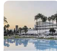
4* Sol Estepona Atalaya