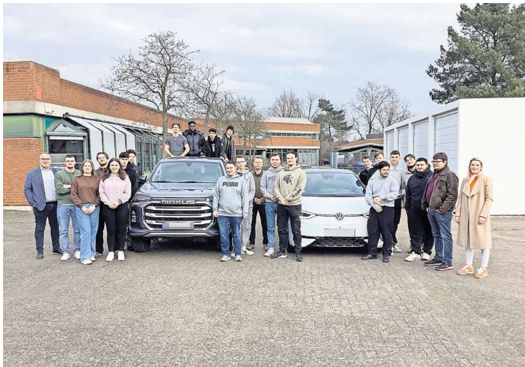
Qualitätsprüfung von E-Autos: Als Praxisprojekt unterziehen Schülerinnen und Schüler der Fachoberschule Fahrzeugtechnik der BBS II verschiedene Autotypen jetzt einer technischen Analyse.

Ein wesentlicher Punkt war es, zu analysieren, ob es Unterschiede in Qualität und Innovation gibt zwischen Fahrzeugen von renommierten Autoherstellern und denen aus China. „Die gibt es sehr wohl“, so die einhellige Meinung der Experten, und diese wurde auch bei der Gifhorer Analyse bestätigt. Verglichen wurden nach genauer Vorgabe