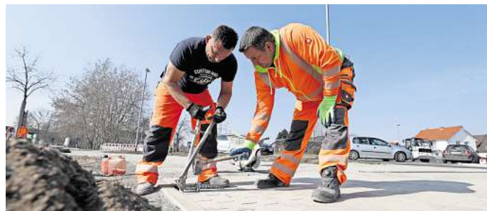
Hamburger Straße: Der zweite Bauabschnitt mit Vollsperrung beginnt in der nächsten Woche.

Und was kommt dann auf den Verkehr zu? Die Stadt sperrt den Abschnitt zwischen Robinienweg und der südlichen Zufahrt zur HEM-Tankstelle voll. „Die Anlieger haben freie Zufahrt“, so Siemer. Der Kreisverkehr bleibt in drei Richtungen frei: Bruno-Kuhn-Straße, Campus und nördliche Hamburger Straße. Die offizielle Umleitung ist von der Vollsperrung des ersten Bauabschnitts noch bekannt: über die B4 und Zum Luisenhof. Inoffiziell wird