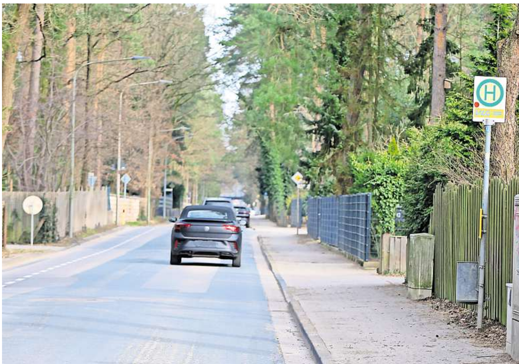
Eyßelheideweg in Gifhorn: Im Frühjahr kommen barrierefreie Bushaltestellen auf der Südseite, während der Sommerferien die neue Asphalt-Fahrbahn - unter Vollsperrung für den Durchgangsverkehr.

Eine Verengung des Straßenzuges Eyßelheideweg und „Am Tappenberg“ an den Bushalte-