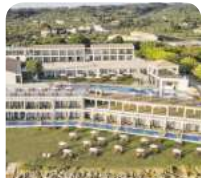
4,5* Cavo Orient

Zakynthos, die Perle des Ionischen Meeres, verführt mit atemberaubenden Stränden und kristallklarem Wasser – perfekt für einen unvergesslichen Urlaub.