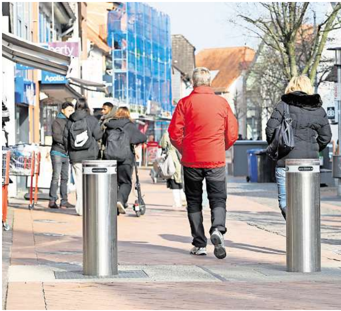
Die Glfhorne Stadtverwaltung schlug nun vor, den Förderantrag zur Aufwertung der Glfhorne Fußgängerzone zurückzuziehen. Der Stadtrat entscheidet darüber am 31. März.

Die Stadt hatte den Aufnahmeantrag in das Städtebauförderungsprogramm 2025 „Lebendige Zentren“ für die Gesamtmaßnahme „Fokusraum Innenstadt – Urbane Achse und Blau-Grünes Band“ im Mai 2024 gestellt. Die darin enthaltenen Maßnahmen wurden im Rahmen des Integriertes Stadtentwicklungsprogramm (ISEK) erarbeitet. Darum möchte die Stadt den Antrag zurückziehen: Am 5. November fand eine gemeinsame Ortsbegehung mit