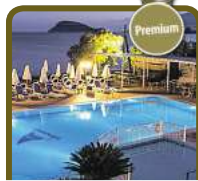
5* Mediterranean Beach Resort

Auch in den Herbstferien mit Kinderfestpreis!