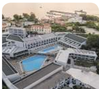
4* Zante Sun