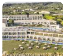
4,5* Cavo Orient

Zakynthos, die Perle des Ionischen Meeres, verführt mit atemberaubenden Stränden und kristallklarem Wasser – perfekt für einen unvergesslichen Urlaub.