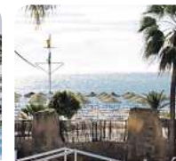
4* Ibersol Terremolinos Beach