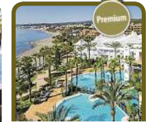
4,5* H10 Estepona Palace