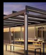
Terrassen- überdachungen Glasoasen Markisen