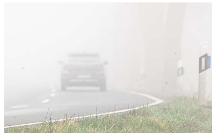
Vorsicht, Falle: Viele Autofahrer im Kreis Gifhorn waren am Dienstag im dichten Nebel nur mit Tagfahrlicht unterwegs - und somit hinten unbeleuchtet.

Offenbar reagiere die Licht-Automatik nicht immer verlässlich auf Nebel, sagt Dietrich. „Die Leute verlassen sich zu sehr auf die Technik.“ Und merkten oft nicht, dass sie nur mit dem Tagfahrlicht vorn - oder gar nicht beleuchtet - unterwegs sind. Er empfiehlt deshalb auch, nach Werkstattbesuchen die Einstellungen am Fahrzeug zu checken, denn oft würden die Mechatroni-