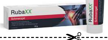
Abbildung Betroffenen nachempfunden

RUBAXX SCHMERZGEL. Wirkstoff: Rhus toxicodendron Dil. D6. Homöopathisches Arzneimittel bei Besserung rheumatischer Schmerzen und Folgen von Verletzungen und Überanstrengungen. www.rubaxx.de • Zu Risiken und Nebenwirkungen lesen Sie die Packungsbeilage und fragen Sie Ihre Ärztin, Ihren Arzt oder in Ihrer Apotheke. • PharmaSGP GmbH, 82166 Gräfelfing