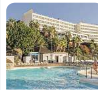
4,5* Benalma Costa del Sol

Willkommen an der Sonnenküste Andalusiens mit ihren goldenen Stränden und türkisblauem Wasser! Ob erholsamer Strandurlaub, sportliches Abenteuer oder kulturelle Highlights – an der Costa del Sol ist alles zu finden.