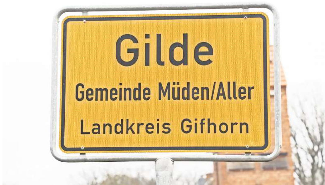
Brutaler Raub in Gilde: Jetzt ist vor dem Landgericht Hildesheim das Urteil gefallen.

Schließlich gibt der so Miss-handelte vor lauter Angst nach und rückt einen Schlüssel zu einem Wertglass heraus. Die Beute: Jagdwaffen, Munition, Bargeld und Schmuck. Die Täter machten sich erst nach der