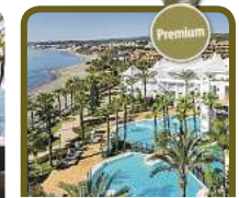
4,5* H10 Estepona Palace