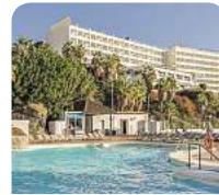
4,5* Benalma Costa del Sol

Willkommen an der Sonnenküste Andalusiens mit ihren goldenen Stränden und türkisblauem Wasser! Ob erholsamer Strandurlaub, sportliches Abenteuer oder kulturelle Highlights – an der Costa del Sol ist alles zu finden.