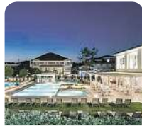
4,5* Zante Park