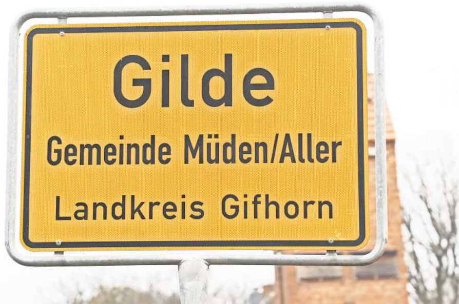
Brutaler Raub in Gilde: Jetzt ist vor dem Landgericht Hildesheim das Urteil gefallen.

Der Prozess ging über drei Verhandlungstage, ursprünglich waren vier angesetzt. Das Urteil ist laut Schaffert noch nicht rechtskräftig. Der Haftbefehl bleibt aufrechterhalten.