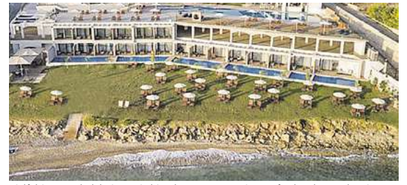
Viele fältige Hotelangebote, wie hier das 4,5* Cavo Orient auf Zakynthos, stehen in allen Zielen zur Auswahl.

Ausflüge und weitere Leistungen sind zusätzlich buchbar. So ist vom Badeurlaub bis zur Erlebnisreise alles möglich und einem Traumurlaub steht nichts im Wege.