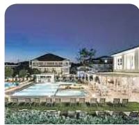
4,5* Zante Park