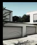
Garagentore Deckenlauf-tore Kastenroll-tore