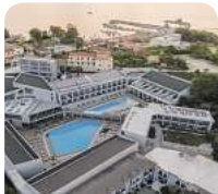
4* Zante Sun