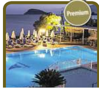
5* Mediterranean Beach Resort

Auch in den Herbstferien mit Kinderfestpreis!