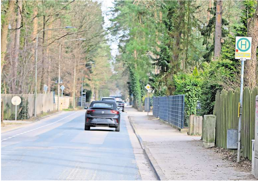
Eyßelheideweg in Gifhorn: Im Frühjahr kommen barrierefreie Bushaltestellen auf der Südseite, während der Sommerferien die neue Asphalt-Fahrbahn - unter Vollsperrung für den Durchgangsverkehr.

Eine Verengung des Straßenzuges Eyßelheideweg und „Am Tappenberg“ an den Bushalte-