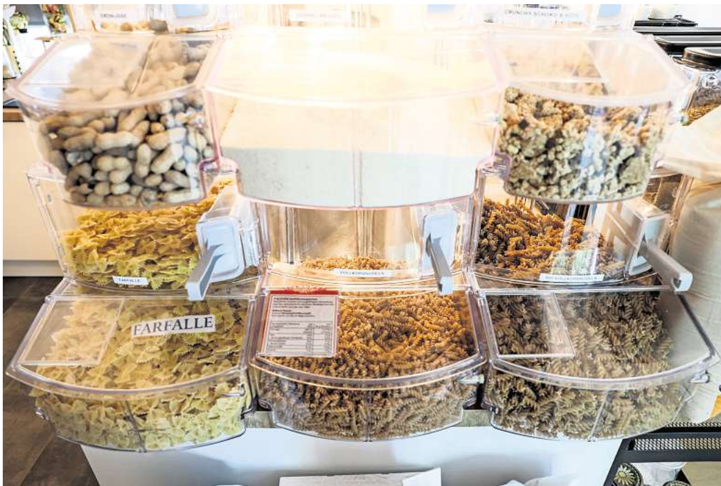
Nachhaltiges Einkaufen – ganz ohne Verpackung.

Wir möchten Ihre Meinung wissen: Achten Sie beim Einkaufen