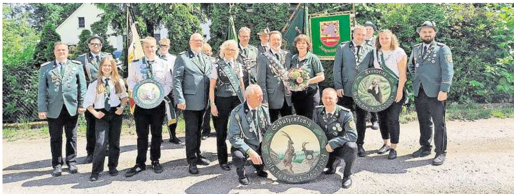
Das Königshaus 2024 ist vorbereitet für das diesjährige Schützenfest.

Wilscher feiern Schützenfest – mit vollem Programm