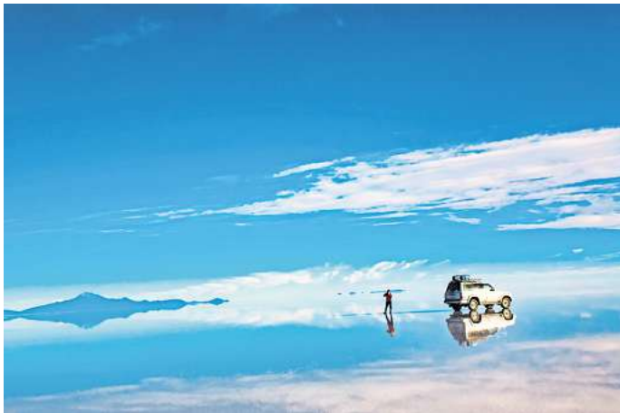
Die Spiegelungen in der Salar de Uyuni: Dieses Naturwunder spielt sich in Bolivien nur zu einer bestimmten Zeit ab.

Die sogenannte Theißblüte hat nichts mit einer blühenden Blumenwiese zu tun. Gemeint ist ein eher „flatteriges“ Naturspektakel, das sich Ende Juni am ungarischen Donaufluss Theiß im Nationalpark Hortobágy ereignet.