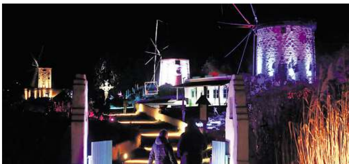
Derzeit laufen Gespräche über eine mögliche Wiederholung der Aktion im Gifhorer Mühlenmuseum.