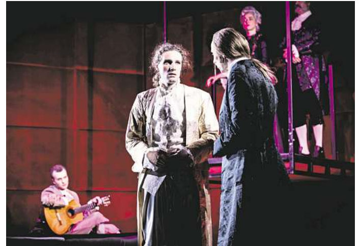
„Die Königin und der Besuch des Leibarztes“ im Schlosstheater Celle

Ein Stück voller Spannung, Humor und tiefgründiger Dialoge, dass dich in die Welt der höfischen Macht und menschlichen Schwächen entführt. Tauchen Sie ein in eine Geschichte, die von Liebe, Verrat und dem Streben nach Wahrheit erzählt – ein echtes Highlight der diesjährigen Schlossfestspiele Celle!