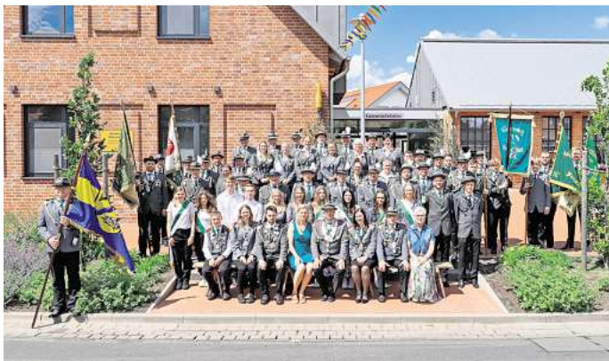
Die Schützenfamilie 2024 samt seiner Majestäten freut sich auf das diesjährige Schützenfest.

Seinen Abschluss findet das Schützenfest am 21. Juni mit dem Lustigen Sonabend, bei dem die Band „Musikspass Eldingen“ für den musikalischen Part zuständig ist.