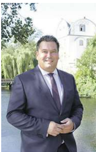
Gifhorn trauert um Landrat Tobias Heilmann.

Ab sofort besteht für Bürgerinnen und Bürger darüber hinaus die Möglichkeit, ihr Beileid in einem Kondolenzbuch zu bekunden, das der Familie von Tobias Heilmann überreicht werden soll. Das Kondolenzbuch liegt bis zum 17. Juni 2025 im Kaminzimmer des Gifhorer Schlosses aus, das als Abschiedsraum eingerichtet wurde. Es ist zugänglich montags bis freitags jeweils in der Zeit von 10 bis 18 Uhr. Das Ka-