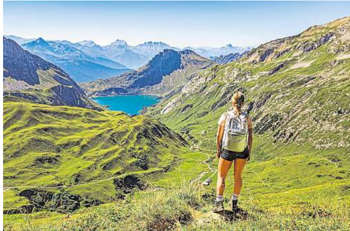
Eine junge Frau steht auf einem Berg und schaut auf den Spullersee. Er ist eine Station auf dem Lechweg.