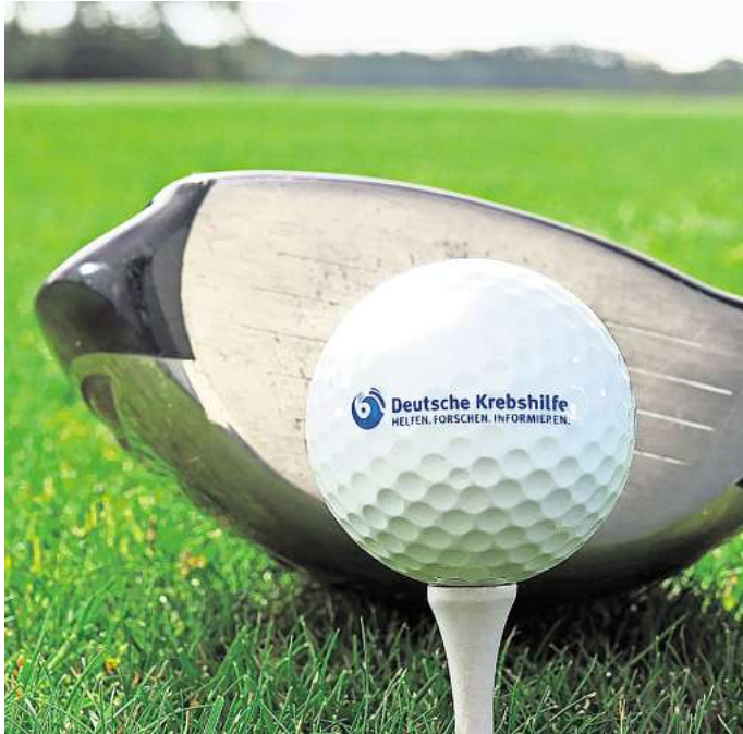
Zur Unterstützung der Kinderkrebshilfe: Der Golfclub Gifhorn lädt zum Benefiz-Golfturnier ein.

Die Erlöse aus dem Turnier fließen direkt in die Arbeit der Deutschen KinderKrebshilfe. Für die Gifhorer Teilnehmenden gibt es zudem einen sportlichen Anreiz: Die Brutto- und Nettosiegerinnen und -sieger haben die Chance, sich für das Bundesfinale am 4. Oktober im Golfpark Rothenburg-Schönbrunn zu qualifizieren. Zu den geförderten Projekten zählen unter anderem der Auf- und Ausbau von Kinderkrebszentren und die Entwicklung neuer Therapien.