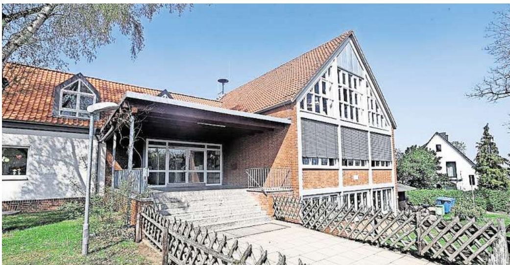
Die Grundschule in Leiferde: Wieder einmal befasste sich der Gemeinderat mit dem Verkehrschao rings um die Schule.