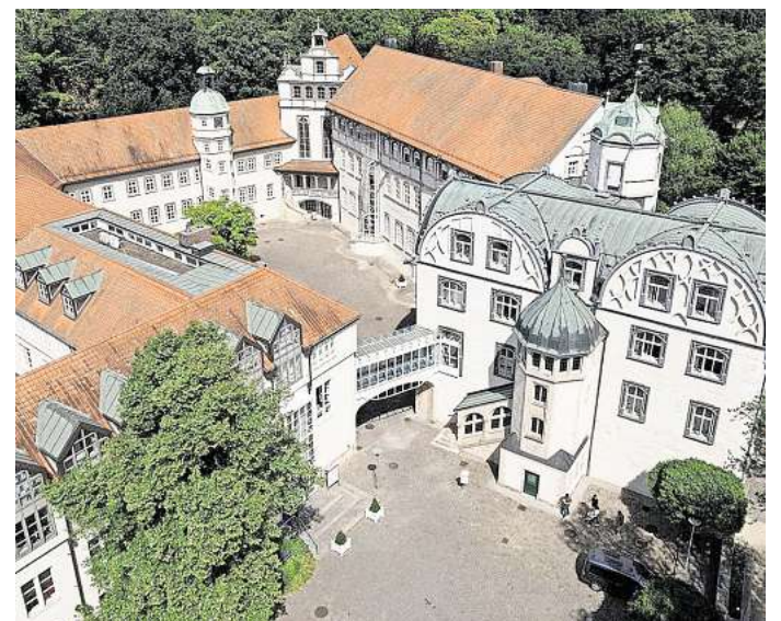
Auf der Suche nach einem neuen Landrat: Gifhorns Kreistag hat jetzt den 26. Oktober als Termin für die Direktwahl festgelegt. Stichwahl wäre am 9. November.