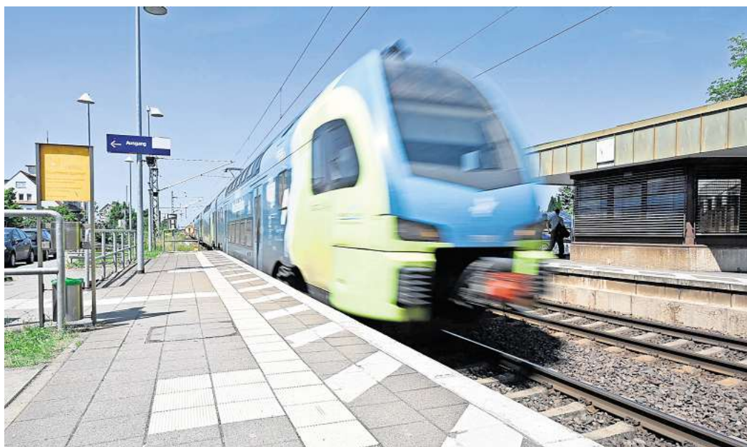
Viele Menschen reisen bequem mit dem Zug

Flugreisen bleiben vor allem bei Fernzielen im Ausland beliebt. Sie sind die schnellste Op-