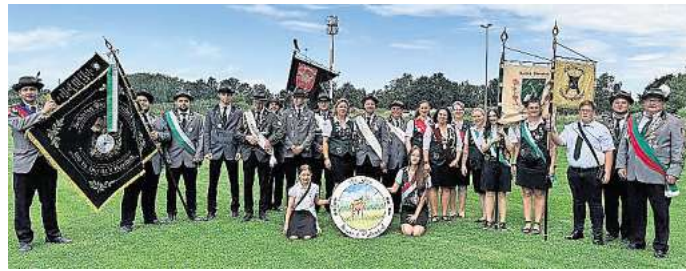
Das Königshaus: 2024: Die noch amtierenden Majestäten sind schon ganz gespannt, wer ihre Nachfolge antreten darf.

Ab 16 Uhr wird es dann spannend, wenn das Schießen um die Gunst der Königswürde beginnt. Das Geheimnis wird um 20 Uhr bei der Proklamation gelüftet – zuerst wird bekannt gegeben, wer