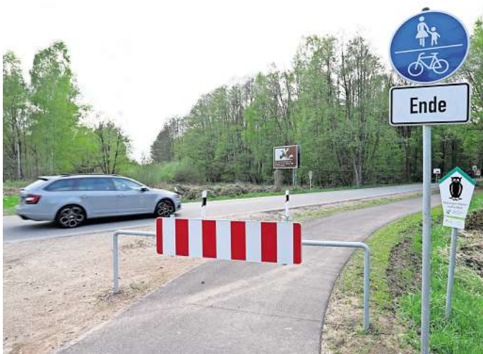
Der Radweg zwischen Brome und Steimke: Von Sachsen-Anhalt aus kommend endet er derzeit an der Landesgrenze. Auf Niedersachsenseite verzögert sich der Bau.

Genau diese Fällungen von 160 Bäumen sind auch einer der Bestandteile der Einwendung der BUND-Kreisgruppe. „Insbesondere die Einwendungen des BUND seien noch zu prüfen und zu behandeln“, hieß es deswegen von der Landkreisverwaltung im Mai 2025. Die Einwendung des BUND