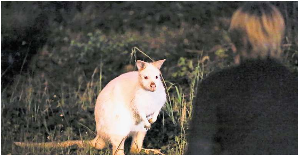
Känguru-Jagd 2017 in Gifhorn: Bei der Aktion war damals auch die Polizei im Einsatz.

Das Artenschutzzentrum in Leiferde hatte auch schon einen Anruf aus Bayern, ob es ein Löwenbaby aus einer Haushaltsauflösung aufnehmen könne, berichtet Rogoschik weiter. Eine Vogelspinne aus dem Prinzenpark in Braunschweig suchte auch einmal ein neues Zuhause, und momentan bekommt das