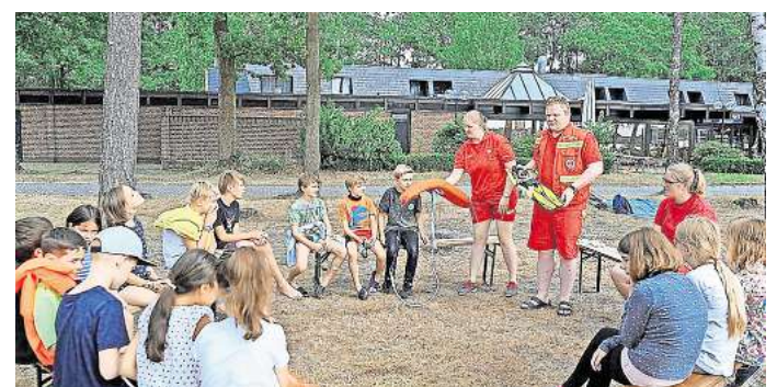
Badenixen und Wasserdrachen: Die DLRG erklärt auch in diesem Jahr, wie sie am Tankumsee für Badesicherheit sorgt.

Am Donnerstag, 31. Juli heißt es von 10 bis 11.30 Uhr „Drachen-Rallye auf dem Kletterturm - Auf den Spuren von Tankino, dem kleinen Drachen vom Tankumsee“. Bei dem Ferienspaß gilt es, knifflige Rätsel zu lösen und die Geschicklichkeit unter Beweis zu stellen - es gibt tolle Preise zu gewinnen. Für Kinder zwischen