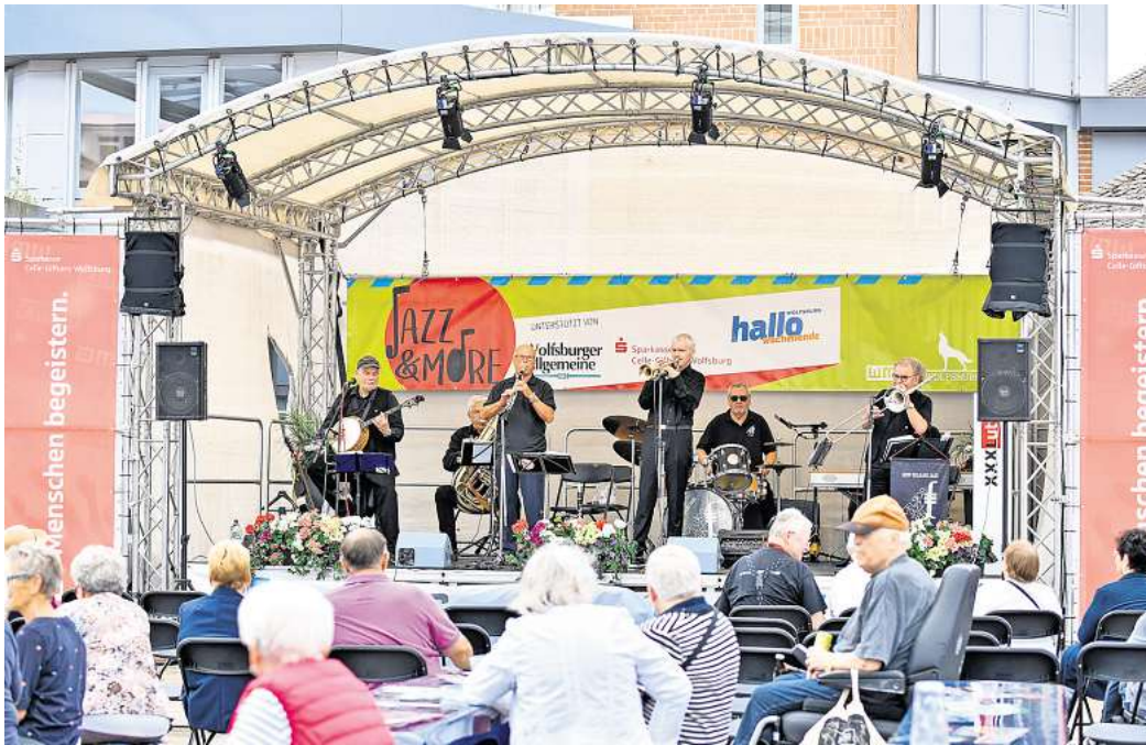
Bis zum 16. August geben verschiedene Jazz- und Bluesbands ihr musikalisches Können zum Besten.

Die Excelsior Jazzmen treten bereits seit mehreren Jahren bei Jazz & More auf und nehmen ihre Zuhörerinnen und Zuhörer musikalisch mit auf eine Reise in die 1920er und 1930er Jahre. 1992 in Schwülper gegründet, hat die Band seitdem viele Auftritte in der Harz-und-Heide-Region bestritten. Die Wolfsburger Jazzfans können sich auch in diesem Jahr wieder auf eine breites Repertoire mit Titeln aus den ersten Jahrzehnten des letzten Jahrhunderts mit den Schwerpunkten Dixieland, Swing, Blues, Gospel und Ragtime freuen. Die Band bietet ein abwechslungsreiches Programm mit