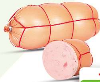
Brühwurst Brühwurst "Rublevskaja" fein zerkleinert 900g (1 kg = 7,32*)