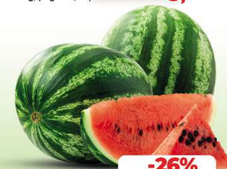
Wassermelon HKL und Herkunft siehe Etikett je kg