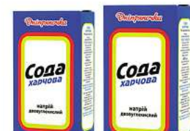
Ukrainisches Backpulver (Soda) Dnipranochka 400g (1kg = 2,48*)