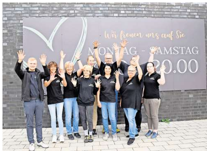
Team des nah & gut-Marktes in Steinhorst

Erste Führungstätigkeiten übernahm er dann schließlich im Edeka-Markt Lüchow in Amelinghausen. Seit Ende 2023 arbeitete er als Teamleiter im nah & gut-Markt in Steinhorst. In seiner Freizeit ist der gebürtige Lüneburger meist auf dem