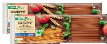
Vollkorn Spaghetti REWE Bio Vollkorn-Spaghetti 500g (1kg = 1,70*)