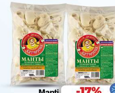
Manti Teigtaschen Kajuscha Manti Teigtaschen "Kasachisch Art" Schw.-Rind 1000g