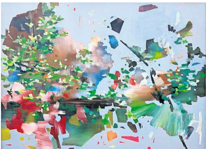
Pflanzen als Metapher für Menschen am Rande der Gesellschaft: Die Künstlerin Nozomi Hasegawa ist neue Stipendiatin der Bösenberg-Stiftung.

Menschen am Rand der Gesellschaft, die ebenfalls wenig Beachtung finden. In ihren Bildern verwendet sie Blumen und Pflanzen als Metapher für Menschen, die durch Vorurteile und Beschränkungen fragmentiert wahrgenommen werden. Dadurch visualisiert sie die Wahrnehmung dieser Elemente und ihre Bedeutung für die Gesellschaft.