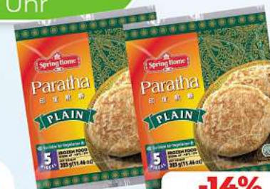
Paratha Natur 5 Stück 325g (1kg = 5,82*)