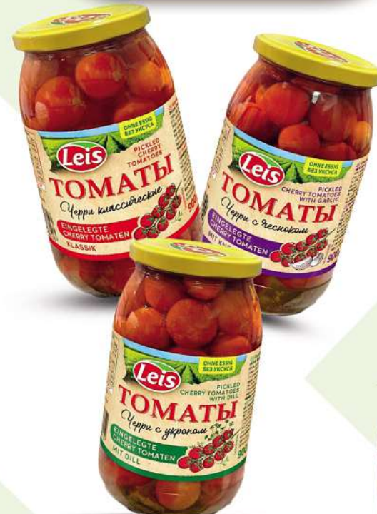
LEIS Cherry Tomaten Original oder mit Dill oder mit Knoblauch 900ml (1L = 3,21*)