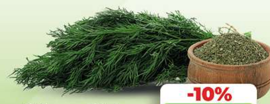
Dill zum Einlegen HKL siehe Etikett je Stück

TÄGLICH FRISCHES OBST & REGIONALES GEMÜSE