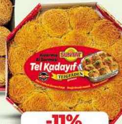
Teigfäden SUNTAT Tel Kadayif Teigfäden geröstet 400g (1kg = 11,10*)