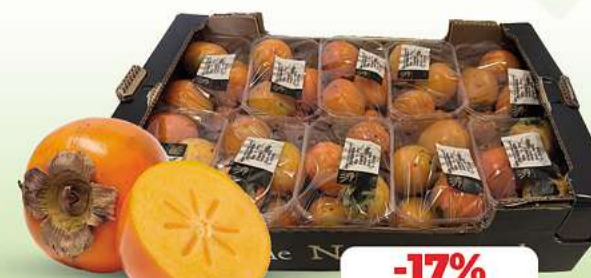
Kaki HKL und Herkunft siehe Etikett 1 kg Packung