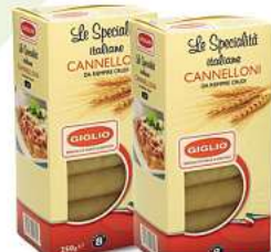
Cannelloni Teigwaren aus Hartweizengrass italienische Cannelloni 250g (1kg = 4,60*)