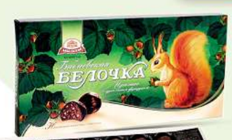
Praline-Konfekt "Babavskaja Belochka" 400g (1kg = 14,98*)