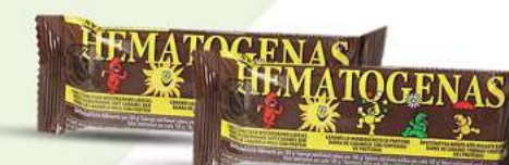
Weichkaramellriegel Eiweißhaltiger Weichkaramellriegel "Gematogen" 50g, (1kg = 17,60*)