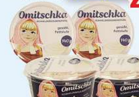
Schmelzkäse "Omischka" Schmelzkäsezubereitung, geschält, semihart 140g (1kg = 12,07*)