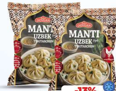
Manti DOVGAN Manti mit Hähnchenfleisch usbekischer Style 420g (1kg = 5,60*)