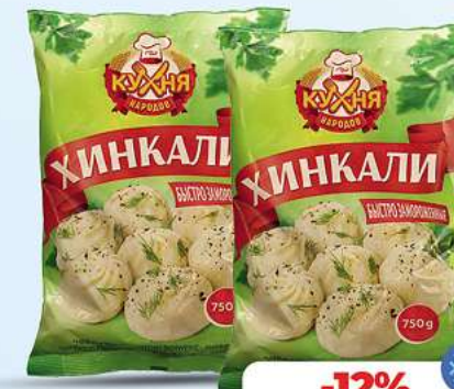
Teigtaschen mit Fleischfüllung "Chinkali" 750g (1kg = 4,92*)