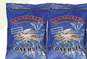
Sonnenblumenkerne Geröstete weiße Sonnenblumenkerne mit Schale gesalzen "Karpaysky" 200g (1 kg = 9,95*)