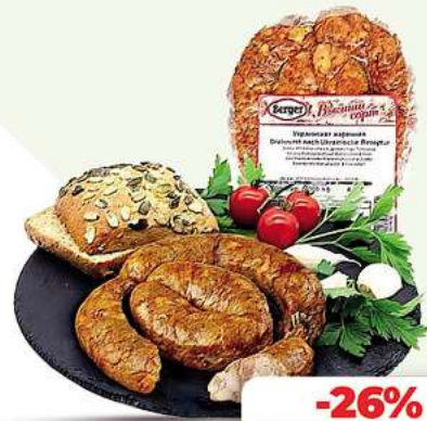
Bratwurstschnecke Ukrainische Bratwurstschnecke ca. 300g (Preis je 100g) (1 kg = 11,10*)