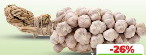
Frischer Knoblauch HKL und Herkunft siehe Etikett je 100g