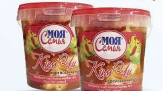
Kim Chi MOJA SEMJA "Kim Chi", scharf 1100g (1kg = 2,72*)