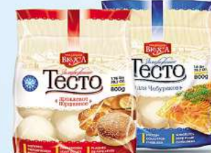
Hefeteig Hefeteig portioniert oder Teig für Tschibureki Teigtaschen portioniert 800g (1kg = 2,49*)