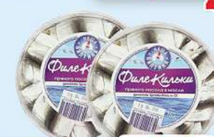
Sprossenfilets Gewürzte Sprossenfilets (Spratus spratus) in Öl 180g (1kg = 15,56*)