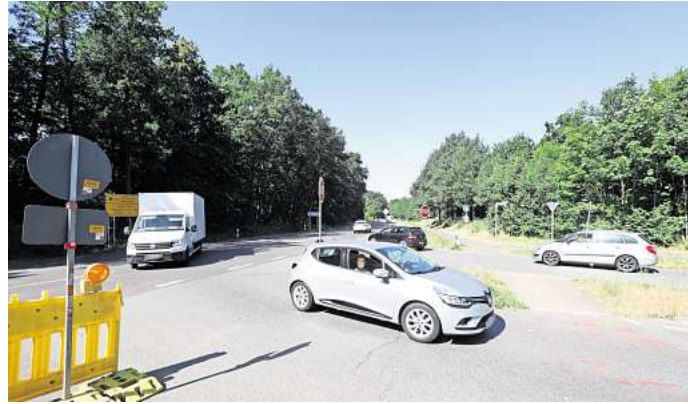
Abzweig Westerbeck: Noch ist dieser Knoten an der B188 ein Unfallschwerpunkt. Doch in diesen Tagen startet der Bau der Ampelanlage.

Stop-Schild-Missachtung zum Dritten: Der Westerbecker Abzweig war dafür jahrelang be-