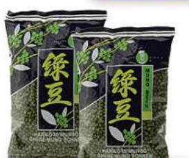
Mungbohnen 400g (1kg = 3,48*)