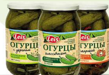
Leis Gurken Klassik oder mit Dill oder mit Paprika Slices 900ml (1L = 2,43*)