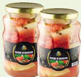
Gerula Wassermelone Römische Gerula Wassermelone / Pepene murat 1,7L (1L = 2,35*)