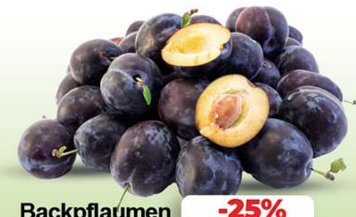
Backpflaumen Zwetschgen HKL und Herkunft siehe Etikett je kg