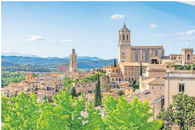
Der Spaziergang auf der Stadtmauer von Girona ist eine tolle Gratis-Aktivität.

Das Labyrinth von Barri Vell Gironas Altstadt Barri Vell zählt zu den besterhaltenen mittelalterlichen Stadtzentren Spaniens. In dem Labyrinth aus engen Gassen, in denen die Zeit stehen geblieben zu sein scheint, kannst du dich wunderbar treiben lassen. Das Wahrzeichen der Stadt ist die Kathedrale von Girona (Catedral de Santa Maria), die mit knapp 30 Metern das breiteste gotische Kirchenschiff der Welt hat.