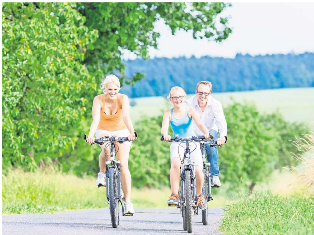
Sportlicher Erlebnistag für die ganze Familie: Rings um Wolfsburg und Gifhorn startet wieder "AZ/WAZ on Tour".

Kontaktieren Sie uns – wir sind für Sie da! Tel: 0176 2354 0798 mp-gf-service.de Öffnungszeiten: Mo-Do: von 7:30–17:00 Uhr Fr: von 7:30–15:00 Uhr