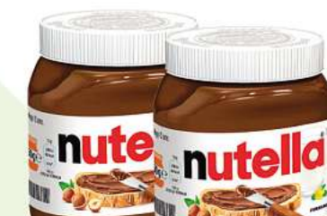
Nutella Ferrero 450g (1kg = 7,31*)