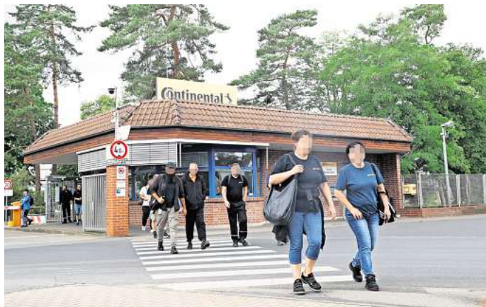
Continental stellt seine Produktion bis Ende 2027 in Gifhorn ein.

Doch Stiebel Eltron steht bereits als Nachfolger in den Startlöchern. Das Unternehmen wolle sich mit dem zukünftigen Standort Gifhorn auf den Aufbau einer Produktion von Innenmodulen für Wärmepumpenanlagen spezialisieren. „Eine