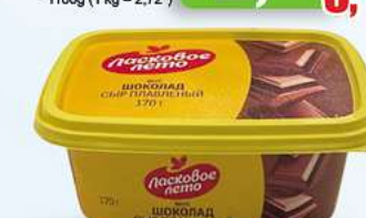
Schoko Schmelzkäse BY Saruschin Schoko Schmelzkäse 170g (1kg = 9,35*)