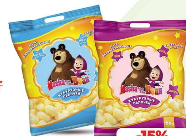
Maisstäbchen "Mascha i Medvedj" oder "Mascha und der Bär" Milchgeschmack 160g (1kg = 10,56*)