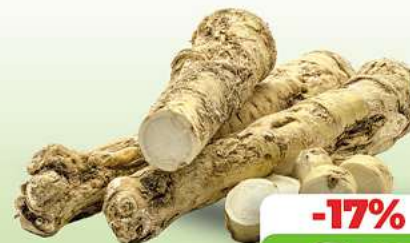
Meeretiich HKL und Herkunft siehe Etikett je 100g