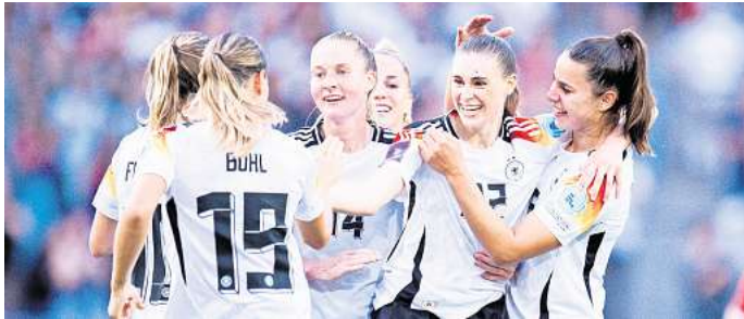
Die Frauen-Nationalmannschaft zeigt Einsatz und Zusammenhalt

Zahlreiche Spitzenmannschaften aus ganz Europa treten gegeneinander an, darunter die Titelverteidigerinnen, aufstrebende Nachwuchsteams und bekannte Fußballstars. Die Spiele versprechen spannende Begegnungen auf hohem Niveau und ziehen immer mehr Fans in die Stadien sowie vor die Bildschirme.