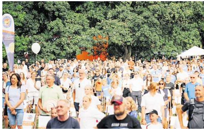
Für den „Walk4help“ wurde der Braunschweiger Bürgerpark zur lebendigen Charity-Arena.

Zwar wurde der angepeilte Weltrekord, der mit dem ersten „Walk4help“ 2019 für die größte Charity-Walkstaffel erreicht wurde, mit insgesamt 49.846 Kilometern nicht gebrochen. „Das Hauptziel, nämlich Bewusstsein für planetare Gesundheit zu