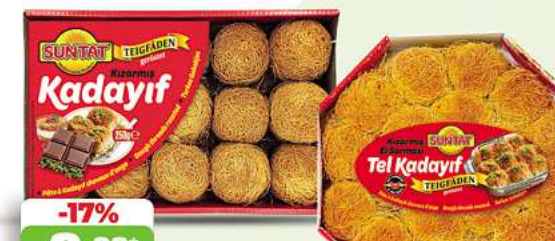
Kadayif SUNTAT Burma Kadayif Teigfladen geröstet 250g (1kg = 13,32*)