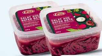
Leis Salat aus Roter Bete mit Mayonnaise und Knoblauch 500g (1kg = 4,78*)