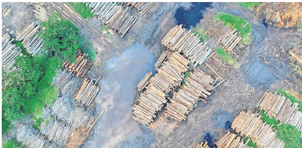
Wälder sterben oder werden abgeholzt: Ein Beispiel für den rabiaten Umgang mit der Natur. Das 1,5-Grad-Ziel ist kaum noch zu halten.

„Das Zeitfenster, um die 1,5-Grad-Marke zu halten, schließt sich rapide“, sagt Joeri Rogelj, Studienautor und Forschungsdirektor am Grantham Institute des Imperial College London. Im vergangenen Jahr wurde die 1,5-Grad-Marke bereits zum ersten Mal überschritten: Im Vergleich zum vorindustriellen Niveau