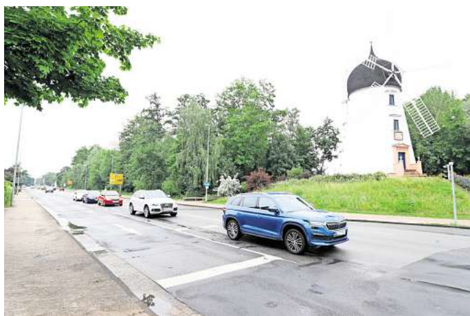
Umbau der Lüneburger Straße: Der Rat der Stadt Gifhorn hat am Montag die endgültige Variante beschlossen.

Reichen sonst die Staus vor der Konrad-Adenauer-Straße bis zurück auf die B188? Gunter Wachholz von der SPD sah durchaus die Gefahr. „Die Lüneburger Straße ist eine der wichtigsten Hauptverkehrsadern“, begründete er für die Gruppe CDU/SPD sprechend die Zustimmung für Variante 2b. Er griff einen Kommentar in der AZ auf, warum diese Lösung nicht gleich auf den