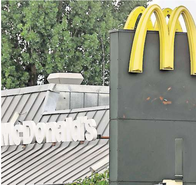
McDonald's will in Deutschland weiter wachsen: In Meinersen stehen die Erschließungsarbeiten im Gewerbegebiet Ettenbütteler Weg an.

Bei Anfragen hält sich das Unternehmen aktuell noch mit konkreten Informationen bedeckt. Man plane im Laufe der nächsten Jahre die Eröffnung von etwa 500 weiteren Restaurants. „Im Rahmen unseres Expansionsvorhabens sind wir ebenfalls an einem Standort in Meinersen interessiert“, teilt das Team der Pressestelle McDonald's auf Anfrage mit.