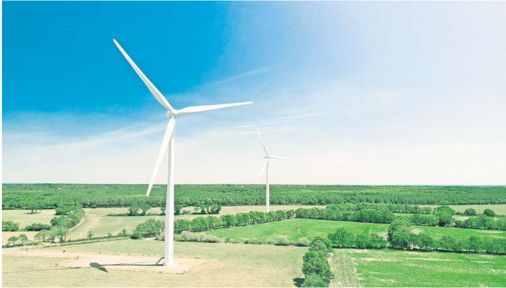
Klimafreundliche Energie: 409 moderne Windräder mit einer Gesamtleistung von 2,2 Gigawatt gingen 2024 ans Netz – so viel wie seit 2017 nicht mehr.

Dabei wurde im ersten Halbjahr kräftig gewerkelt: 409 moderne Windräder mit einer Gesamtleistung von 2,2 Gigawatt gingen ans Netz – so viel wie seit 2017 nicht mehr. Der Bundesverband Windenergie (BWE) und die Herstellerlobby VDMA Power Systems erwarten, dass dieses Jahr bis zu 5,3 Gigawatt hinzukommen. Das würde aber bedeuten, dass die Latte erneut gerissen wird. „Den positiven Entwicklungen zum Trotz klappt eine Lücke zwischen dem tatsächlichen