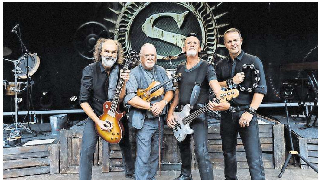
Im Rahmen ihrer "Doggerland! 2025"-Tour gibt die Rockgruppe Santiano am 30. August ein Konzert auf dem Burgdorfer Schützenplatz.

Die Teilnahme an der Verlosung ist ganz einfach: Gehen Sie auf unsere Gewinnspielseite und hinterlassen dort Ihre Kontaktdaten. Unter allen Teil-