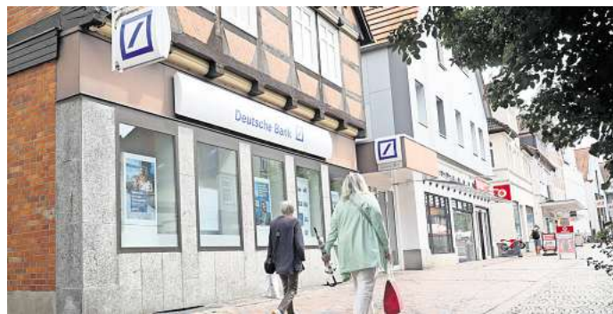
Radikaler Schnitt: Die Deutsche Bank verlässt Gifhorn Anfang 2026.