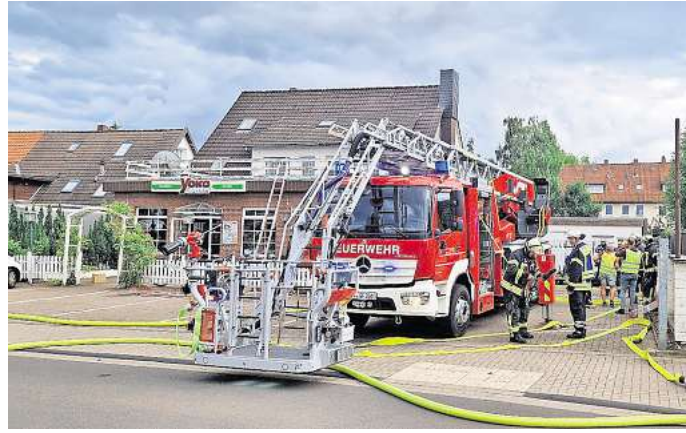
Feuerwehreinsatz nach missglücktem Unkrautabflammen: Der Fall vom Sonnenweg in Gifhorn ist jetzt einer für die Staatsanwaltschaft.

Das wird dann richtig teuer. Die Satzung der Stadt Gifhorn sieht zum Beispiel 100,81 Euro pro Stunde pro Einsatzkraft,