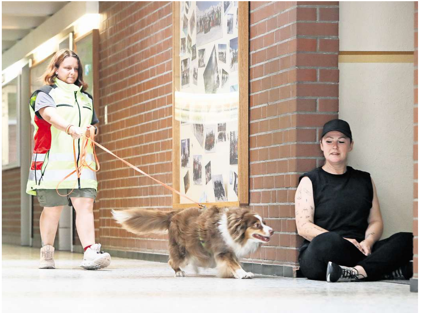
Die Rettunghundestaffel Gifhorner Land trainiert zwei- bis dreimal die Woche.

„Jeder Mensch verliert mikroskopisch kleine Hautschuppen, die sich auf dem Boden verteilen und für den Hund wie ein roter Faden sind, wenn er auf der Suche ist“, beschreibt Flögel. Die Aufgabe der Mantrailer-Hunde sei es, dieser Spur zu folgen. Die Herausforderung dabei: Durch den Wind sowie andere Umwelteinflüsse verteilen sich die Schuppen überall. Die Kunst sei es dann, den Hund dazu zu brin-