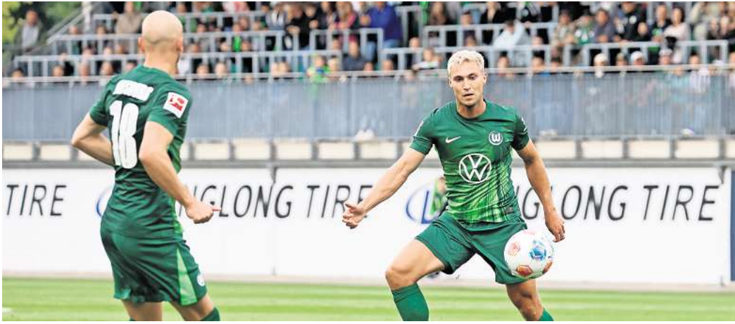
Der VfL Wolfsburg möchte im ersten Heimspiel der Saison punkten.