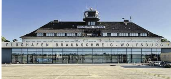
„Fliegen ab Braunschweig“ ab sofort noch komfortabler ab dem neuen Passagierterminal

Den Katalog, weitere Informationen und Buchungsmöglichkeit dieser exklusiven Angebote unter der kostenfreien (aus dem dt. Festnetz) Buchungshotline T. 08 00 / 38 300 38 (Mo-Fr. 9 – 18, Sa. 9 – 13 Uhr), im FIRST Reisebüro Schmidt und weiteren Reisebüros oder unter www.fliegen-ab-braunschweig.de .