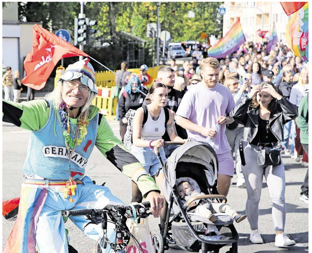
Christopher Street Day in Wolfsburg: Nach einer Gegendemo fuhren drei Männer nach Gifhorn - dort attackierten sie brutal eine 39-Jährige. Nun fand die Verhandlung am Amtsgericht Gifhorn statt.

Sichtlich unangenehm war ihr die Aussage vor Gericht. „Für mich ist das Thema beendet. Ich möchte nix mehr sagen.“ Entschuldigungen der Täter nehme sie dankend an. Zum Glück habe sie „nur“ ein blaues Auge und Schürfwunden erlitten. Was für sie dramatischer war: Erst wenige Wochen vor der Attacke hatte sie in Folge eines Fahrradunfalls schwere Kopfverletzungen erlitten. Dass nun die Tritte keine Verschlimmerungen erzeugt hätten, sei ihr wichtig. Erspart blieb ihr, noch einmal ein Video der Attacke sehen zu müssen, das ein Fahrgast mit dem Smartphone gemacht hatte. Erst nach Abspielen des Videos wurde die Frau in den Zeugenstand gerufen.