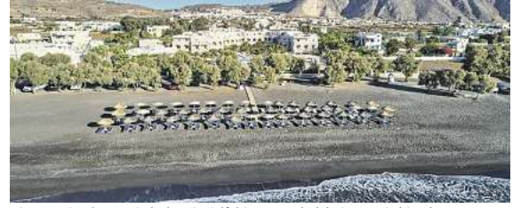
Die Trauminsel Santorin lockt mit vielfältigen Hotelangeboten, wie hier das 4,5* Premium Hotel Santo Miramare.

Zur Auswahl stehen – wie in allen ab Braunschweig angefliegenen Zielen – vielfältige, besondere Hotelangebote: Neben Premium, Best Preis und Top Lage Anlagen auch Flair Hotels mit acht Zimmern und eigenem Pool. Zum Jubiläum 10 Jahre „Fliegen ab Braunschweig“ gibt es ein besonderes Angebot nach Santorin. Schon ab € 599,- im Standard- (3 – 3,5*) oder ab € 899,- im Top Glückshotel (4,5 – 5*) kann man auf diese Trauminsel reisen.