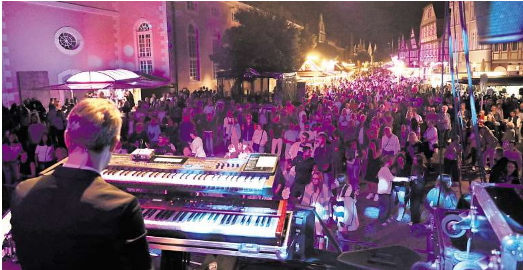
Seit gestern ist die Gifhorer Innenstadt wieder eine einzigartige Partymeile.

Bier, Wein und diverse Spirituosen sowie Cocktails werden aus- geschenkt - allerdings nur im