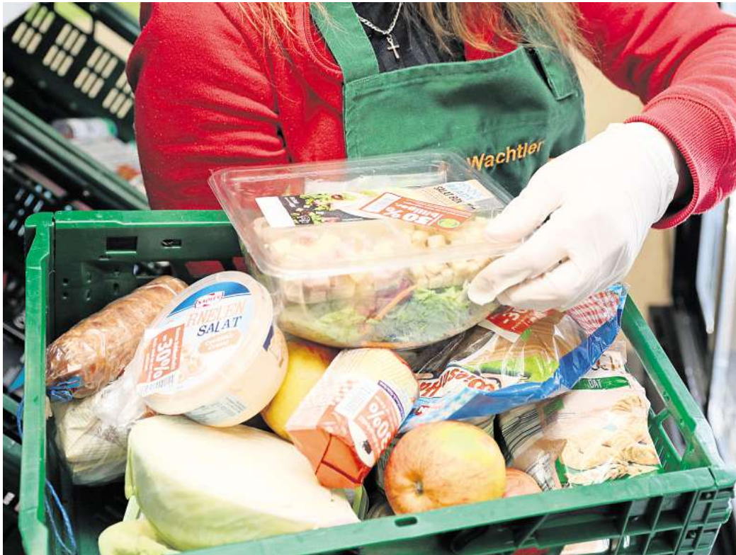
So lässt es sich sparen – Rabattcoupons für Lebensmittel.

Für Verbraucher bedeutet dies vor allem: sorgfältigere Budgetplanung, vermehrte Preisvergleiche und eine zunehmende Bereitschaft, auf Rabatte, Eigenmarken oder saisonale Angebote zurückzugreifen. Die Einkaufsgewohn-