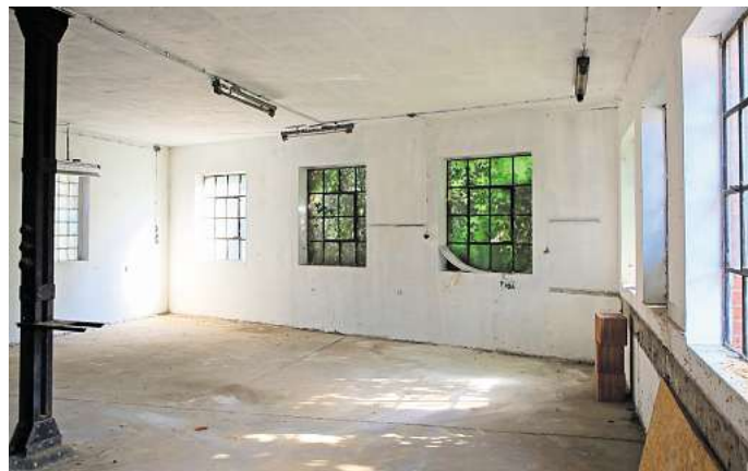
„Projekt Hauptstraße 7“: In der ehemaligen Werkstatt Schepelmann möchte die Gemeinde Meinersen einen Bürgertreff einrichten.

Die Pizzeria im Vorderhaus ist von jeglichen Plänen ausgenommen und soll Bestand haben. Ein östlich daran angebauter Fachwerkgebäudeteil, der noch nicht