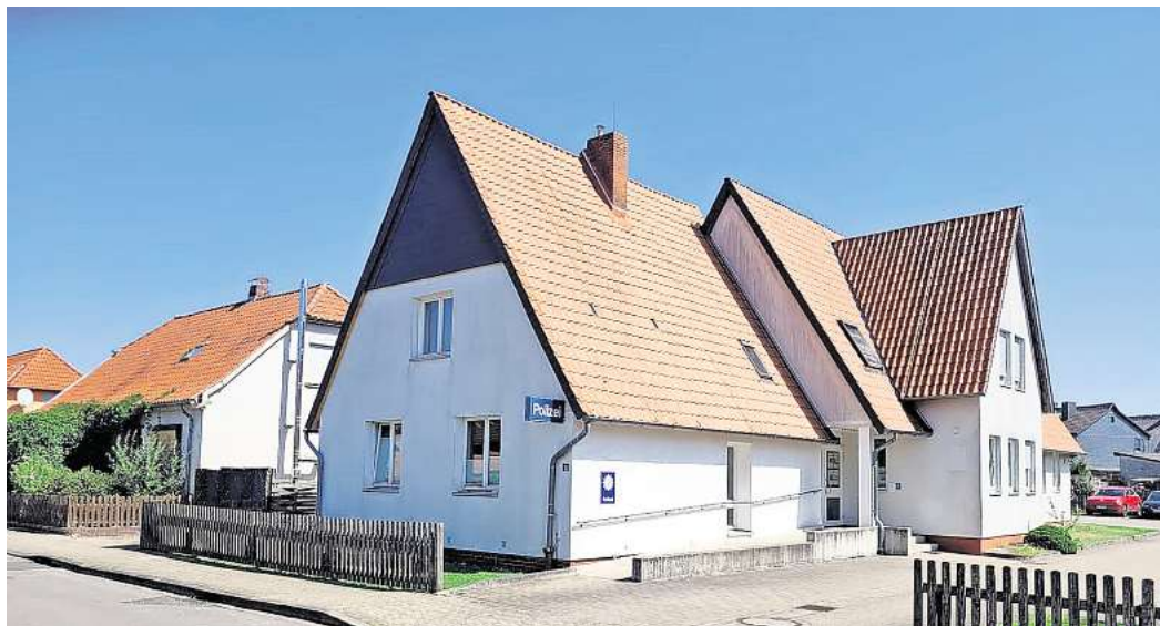
Marodes Dienstgebäude: Die Mängelliste zum Polizeikommissariat Wittingen ist lang. Neulich fiel fast ein Fenster auf einen Beamten.