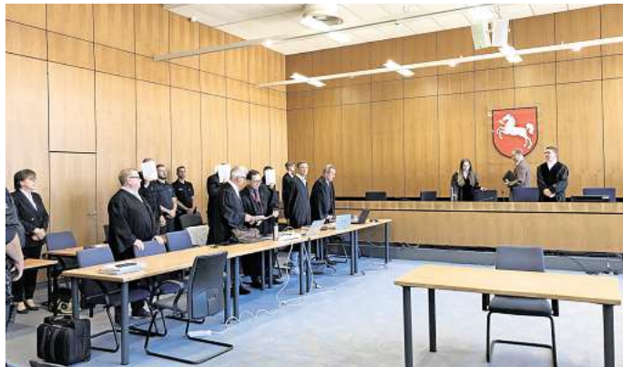
Teure Autos geklaut: Am Landgericht Hildesheim wurde der Prozess gegen vier Männer im Alter von 27 bis 38 Jahren wegen schweren Bandendiebstahls fortgesetzt.

Ja, er habe den „Funkwellen-Verlängerer“ betätigt, mit dem die Signale des Funkschlüssels der Keyless-Entry-Modelle abgefangen und zum Öffnen und Starten der Fahrzeuge verwendet wurde. „Man braucht dafür nicht viel Geschick oder Verständnis“, ließ der Angeklagte erklären. Die Auswahl der Fahrzeuge sei nicht von ihm getroffen worden, sondern von Beteiligten „in Polen“. Von diesen hätte die Gruppe