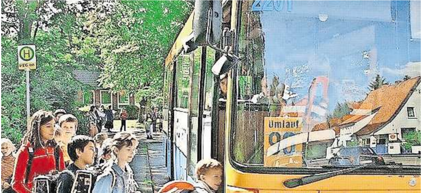
Auf dem Weg zum Unterricht: Schülerinnen und Schüler müssen sich auf geänderte Zeiten und Wege einstellen.

Für den Ort Zasenbeck wird ein Shuttleverkehr eingerichtet, der an den Unterrichtszeiten der Schulen in Hankensbüttel, Wittingen, Radenbeck, Brome und Wolfsburg ausgerichtet ist. Der Umstieg auf die weiterführenden Linien erfolgt in Radenbeck.