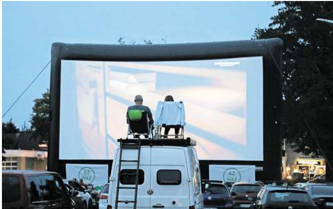
Das Autokino der Aller-Zeitung ist ein ganz besonderes Event, das Kinofans aus der ganzen Region anzieht.

Hören und sehen lassen kann sich das Programm. Der Freitag wird dabei im Zeichen des Leser-Wunschfilms stehen. Die Leserinnen und Leser haben für „Harry Potter und der Stein der Weisen“ gestimmt. Zu diesem Event hat sich das Autokino-Team etwas Besonderes einfallen lassen: Der Filmabend soll eine lustige Kostümparty werden. Ob Harry Potter, Hermine Granger,