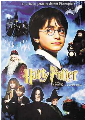
Harry Potter und der Stein der Weisen.

Freitag, 5. September, 21.00 Uhr (Einlass 19.30 Uhr) Harry Potter und der Stein der Weisen Kinderfilm/Fantasy (2001/FSK 6)