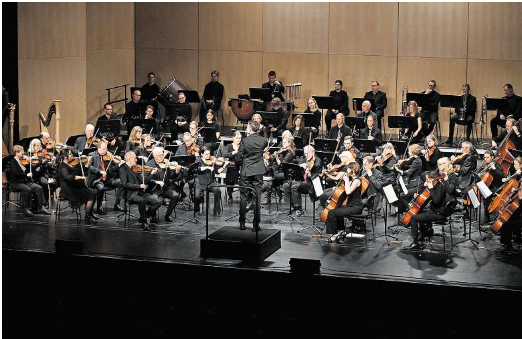
Auch im letzten Jahr begeisterte das Louis Spohr Orchester das Publikum

Für das Sinfoniekonzert des Louis Spohr Orchester am 28. September 2025, um 16 Uhr, in der Stadthalle Gifhorn, verlosen wir 3 x 2 Karten.