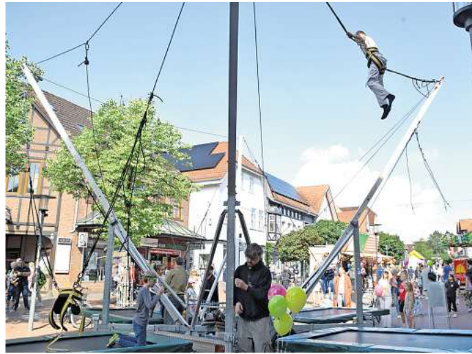
Hoch hinaus beim Kindersamstag in Gifhorns Fußgängerzone: Während die Kinder Spaß hatten, gibt es jetzt Streit um die Rolle der politischen Parteien bei der Veranstaltung.

Wegen der bereits vergebenen Sondernutzung im Bereich Ceka-Brunnen für den Kindersamstag sei eine Vergabe einer dortigen Fläche an die AfD nicht möglich gewesen. Dass SPD, CDU und Grüne dort ihre Stände aufbauen konnten, habe einen