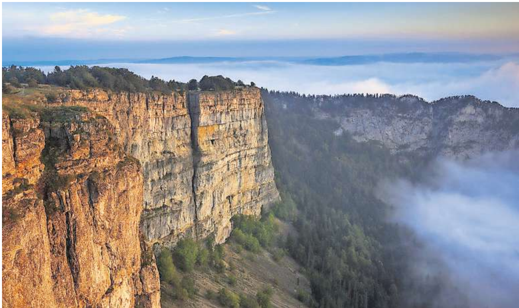
So beeindruckend ist der Grand Canyon der Schweiz.

Ein beliebter Ausgangspunkt für Erkundungstouren ist der Ort Noiraigue. Von dort führt ein 14 Kilometer