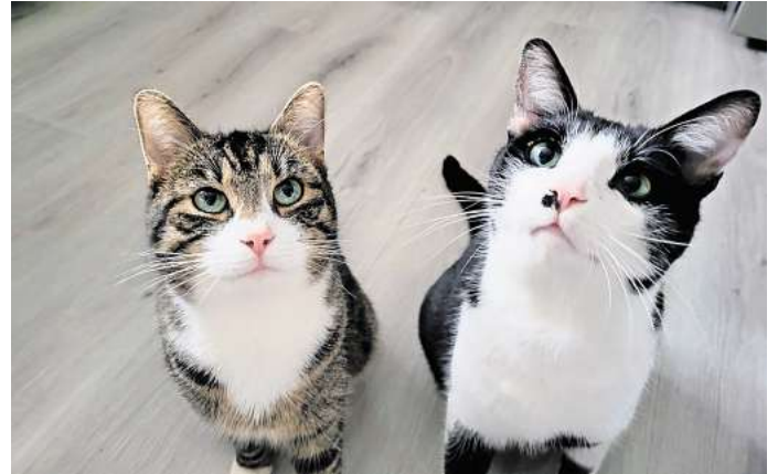
Mysteriös: Innerhalb weniger Wochen sind Katze Merle und Kater Spotty spurlos verschwunden.