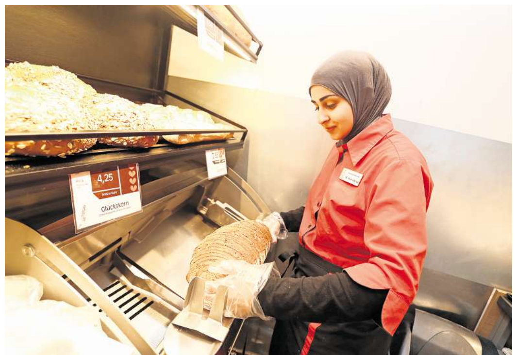
Eine Mitarbeiterin der Bäckerei Leifert schneidet Brot für die Kundschaft. Der Service kostet nichts extra.