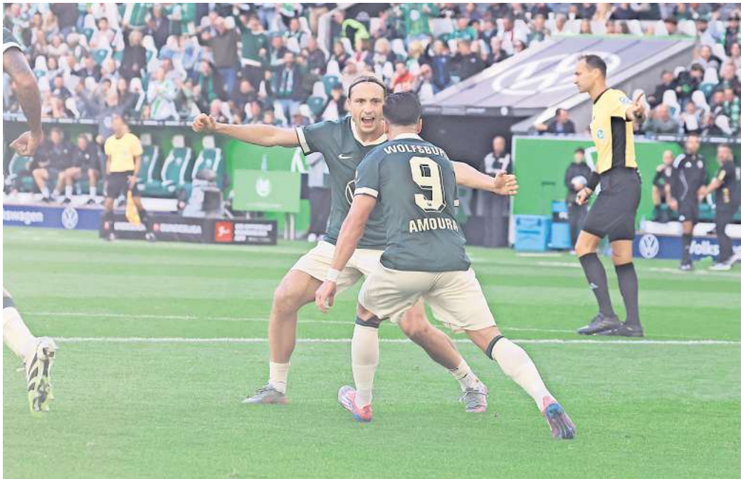
Für das Spiel des VfL Wolfsburg gegen den RB Leipzig können Leser Eintrittskarten gewinnen.

Die Heimbilanz des VfL Wolfsburg in der noch sehr jungen Saison ist bislang durchwachsen. Nach dem 1:1 gegen Mainz folgte auch im zweiten Heimspiel ein Unentschieden gegen Köln. Und auch der Gegner im dritten Heimspiel hat es in sich: Der RB Leipzig kommt am Sams-