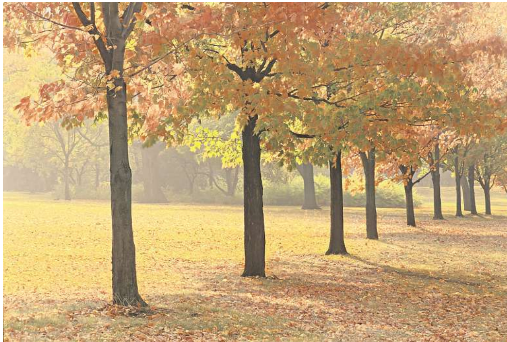
Herbstzauber: Wenn die Blätter sanft zu Boden fallen

Wir möchten gern von Ihnen wissen: Freuen Sie sich auf den Herbst? Machen Sie mit bei