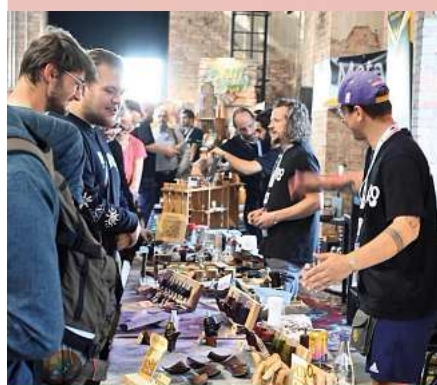
Großer Andrang herrschte 2024.

PERFECTE VIBES DEN GANZEN TAG Outdoor-Bühne, live DJs & Künstler