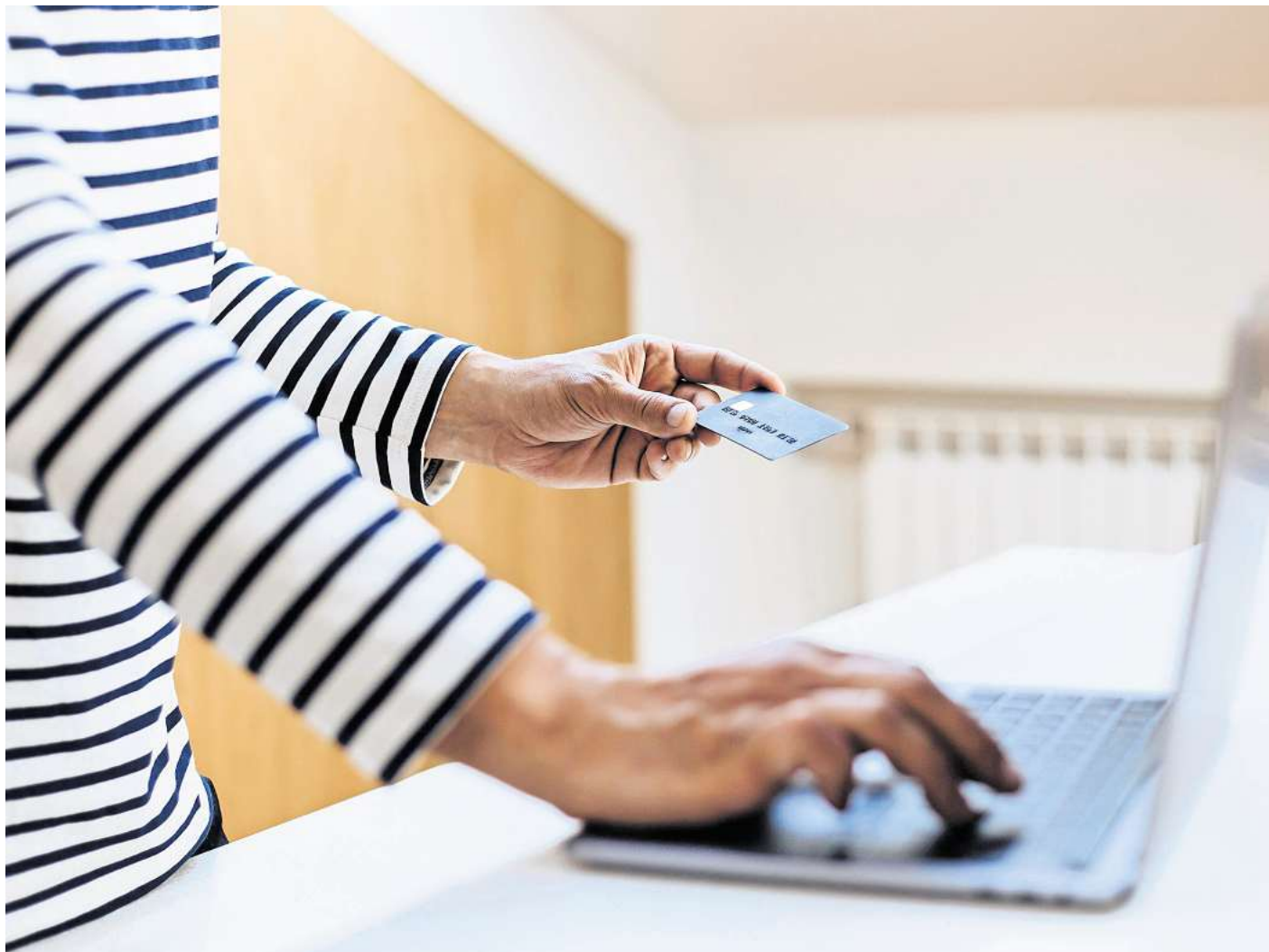
Wer ungewöhnliche Abbuchungen auf seinem Konto feststellt, sollte das schnellstmöglich klären.

Zudem ist es wichtig, keine Anhänge oder Links in E-Mails von unbekanntem Absendern zu öffnen. E-Mails im Namen von Behörden oder bekannten Firmen sollte man genau prüfen, etwa die Absenderadresse. ■ Niemals Passwörter oder TANs preisgeben, auch wenn dies in Nachrichten gefordert wird.