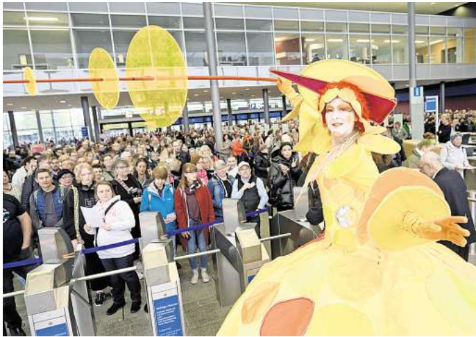
Auch in diesem Jahr werden bei der infa wieder Tausende Besucher erwartet

Die Messe läuft bis zum 19. Oktober und ist jeweils von 10 bis 18 Uhr geöffnet. Tickets kosten von Montag bis Freitag zwischen 12 und 13 Euro, am Wochenende 14 bis 15 Euro.