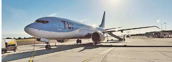
Neu ab dem Flughafen Braunschweig-Wolfsburg im Frühjahr/Sommer 2026 für momento im Einsatz: Die deutsche TUIfly

Den Katalog, weitere Informationen und Buchungsmöglichkeit dieser exklusiven Angebote unter der kostenfreien (aus dem dt. Festnetz) Buchungshotline T. 08 00 / 38 300 38 (Mo-Fr. 9 – 18, Sa. 9 – 13 Uhr), im FIRST Reisebüro Schmidt und weiteren Reisebüros oder unter www.fliegen-ab-braunschweig.de .