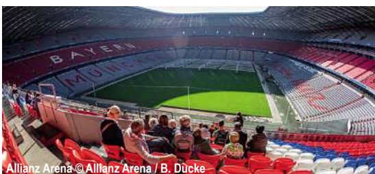
Allianz Arena

Champions League Kracher: FC Bayern München gegen Sporting Lissabon 2 Tage ✓ Fahrt im Luxusreisebus ✓ 1 x Übernachtung im ****Mercure Hotel München Süd ✓ 1 x Frühstücksbuffet ✓ 1 x Eintrittskarte Sitzplatz Kategorie 4 bzw. Kategorie 3 (Mischkontingent) für das Champions League Spiel FC Bayern München gegen Sporting Lissabon