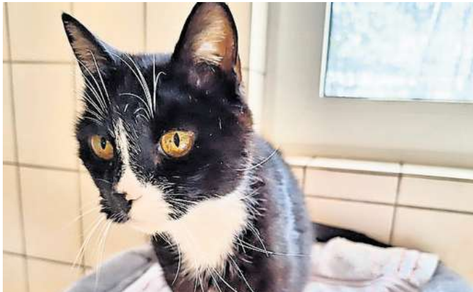
Sie nannten ihn Socke: Der Ü10-Kater hat ein leichtes Handicap, seine Hinterbeine knicken beim Laufen etwas weg.

Socke selbst stört der Umstand nicht - er läuft lediglich etwas langsamer und springt nicht mehr so wendig. Grund für Sabine Hölter, dem alten Katzen-