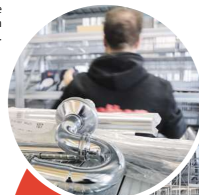
Das Lager bietet viel Platz, um alle Kleinteile unterzubringen.