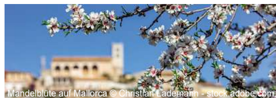
Mandelblüte auf Mallorca

Zur Mandelblüte nach Mallorca 8 Tage ✓ Transfer bis/ab Flughafen Hannover ✓ Flug mit TUIfly Hannover - Palma de Mallorca - Hannover inkl. Flughafensteuern und Sicherheitsgebühren ✓ Transfer Flughafen - Hotel - Flughafen ✓ 7 x Ü/HP im ****Hotel THB El Cid Class direkt am Strand von Can Pastilla im DZ ✓ Informationsveranstaltung inkl. Willkommenscocktail am Anreisetag ✓ Mandelblütenfahrt mit Reiseleitung ✓ deutschsprachige Reisebetreuung während des gesamten Aufenthaltes ✓ durchgehende Reisebegleitung ab/bis Deutschland ✓ Ausflüge Inselrundfahrt; Sineu & Formentor; Drachenhöhlen inkl. Eintritt; Bergdörfer & Olivenöl inkl. Vesper; Stadtführung Palma zubuchbar