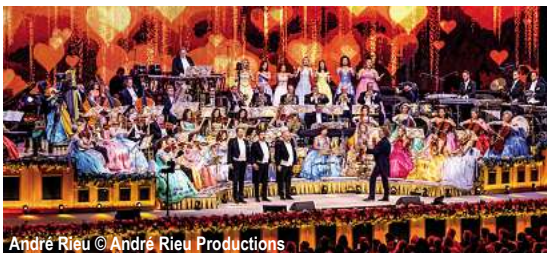
André Rieu

André Rieu - Vorweihnachtlicher Walzerzauber auf der MS Olympia D-MSOLAR Maastricht - André Rieu Konzert - Lüttich - Namur - Dinant 5 Tage ✓ Anreise nach Maastricht und Rückreise ab Dinant im Luxusreisebus ✓ 4 x Übernachtung an Bord ✓ 4 x Frühstücksbuffet an Bord ✓ 3 x Mittagessen als 3-Gang-Menü ✓ 3 x 4-Gang-Abendessen ✓ 1 x Kapitänsdinner (als 5-Gang-Menü) ✓ Kaffee/Tee mit Kuchen und Biskuit ✓ Begrüßungsgetränk ✓ Tägliche Live-Musik ✓ Besuch des Konzerts von Andre Rieu am 14.12.2025 in Maastricht in der Kategorie 1 ✓ Kofferservice ✓ Steuern und Gebühren ✓ Deutschsprachige Reiseleitung an Bord ✓ Ausflugspaket zubuchbar (69,- €)