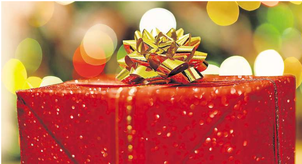
Bereits im Herbst bieten Geschäfte Ihre Weihnachts-Geschenkideen an

Direkt zur Umfrage: Einfach den QR-Code mit dem Handy scannen.