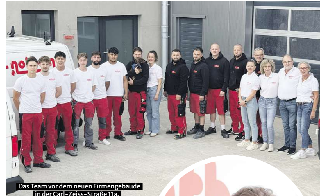
Das Team vor dem neuen Firmengebäude in der Carl-Zeiss-Straße 11a.