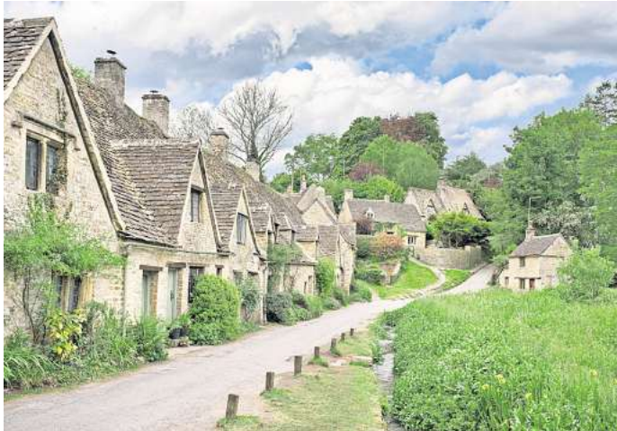
Nun laut „Forbes“-Liste auch offiziell: Bibury in England ist das schönste Dorf der Welt.

Er selbst kann es manchmal gar nicht glauben, im schönsten Dorf der Welt zu leben: „Ich bin ziemlich verblüfft, dass ich, nachdem ich die Welt bereist habe, glauben kann, dass wir das attraktivste Dorf der Welt sind.“ Auf dem zweiten Platz ist übrigens der österreichische Ort Hallstatt, der bekanntlich auch unter dem Massentourismus leidet. Bibury ist wirklich ein kleines Dorf und hat gerade mal