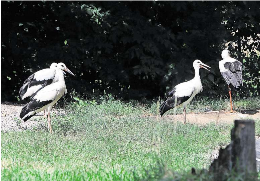
„Storchkolonie“: Im Nabu-Artenschutzzentrum Leiferde wurden weiter fünf Nester besetzt.

In den 69 Nestern mit Bruterfolg wurden 143 Jungstörche flügge. Das ist nach dem Rekord im Vorjahr mit 176 Jungen immer noch das zweitbeste Ergebnis seit über 90 Jahren. Die Jungenzahl mit durchschnittlich 1,51 pro Paar insgesamt und 2,07 pro Paar mit Jungen liegt allerdings wesentlich unter dem jährlichen Durchschnitt. Hauptursache dafür ist vor allem der durch die lange Trockenheit bedingte Nahrungsmangel. Regen-