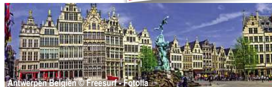
Antwerpen Belgien

Silvesterkreuzfahrt durch Holland & Belgien mit der MS Dutch Grace NL-SDGR Nijmegen - Wijk bij Duurstede - Schoonhoven - Kinderdijk - Dordrecht - Antwerpen - Maastricht - Arnhem 7 Tage ✓ Anreise nach Nijmegen u. Rückreise ab Arnhem im Luxusreisebus ✓ Flusskreuzfahrt lt. Reiseverlauf ✓ 6 x Übernachtung in der gebuchten Kabine ✓ volle Verpflegung an Bord: (beginnend mit dem Abendessen am 1. Tag u. endend mit dem Frühstück am 7. Tag), reichhaltiges Frühstücksbuffet, Mittagessen als 3-Gang-Menü, Kaffee/Tee mit Kuchen am Nachmittag, 4-Gang-Abendessen sowie Mitternachtsnack ✓ Begrüßungs-/Abschiedscocktail ✓ Kofferservice ✓ Kapitänsdinner (5-Gang-Menü) ✓ Silvesterfeier an Bord mit 1 Glas Sekt und Oliebollen um Mitternacht sowie Musik & Tanz ✓ tägliche Live-Musik ✓ in- u. ausländische Gebühren und Steuern ✓ deutschsprachige Reiseleitung an Bord ✓ Ausflugspaket zubuchbar (158,- €)