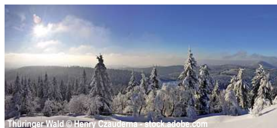
Thüringer Wald

Jahreswechsel im Thüringer Wald 4 Tage ✓ Fahrt im Luxusreisebus ✓ 3 x Ü/F im ***Achat Hotel Suhl im DZ ✓ Begrüßungsdrink im Hotel ✓ 1 x Katerfrühstück (i. R. d. HP) ✓ 2 x Abendessen als 3-Gang-Menü oder Buffet ✓ Silvesterfeier mit 5-Gang-Menü, Musik, Mitternachtsnack ✓ Stadtführung Erfurt ✓ Ausflug Oberhof und Meinungen mit Reiseleitung ✓ Ausflug Suhl und Rennsteig mit Reiseleitung ✓ durchgehende Reisebegleitung