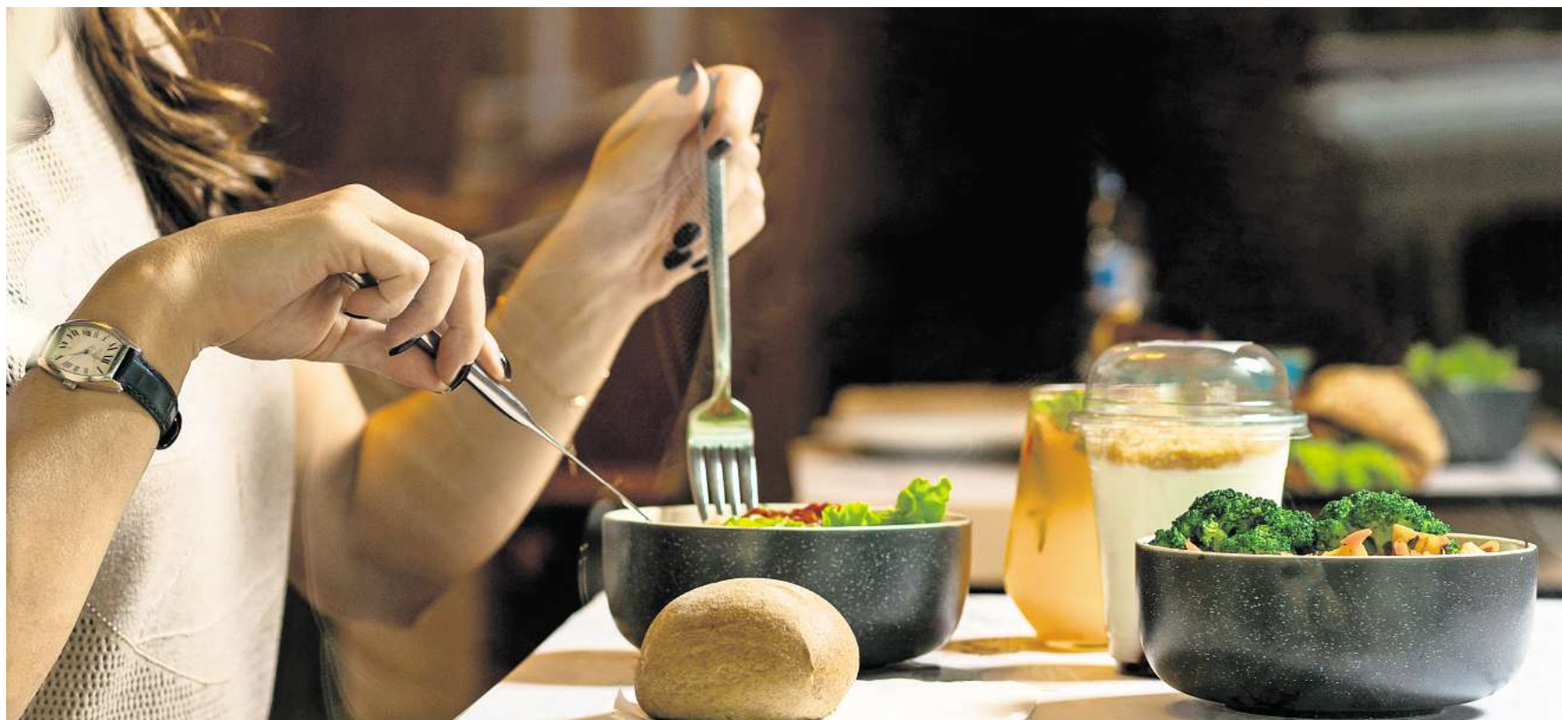
Essen soll Freude machen und die Sinne anregen.