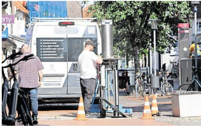
Reparatur an Pollern: Am südlichen Ende der Gifhorner Fußgängerzone waren diese Woche Techniker im Einsatz.

Der Verdacht damals: Kurz zuvor hatten Techniker die Frequenz der Induktionsschleifen