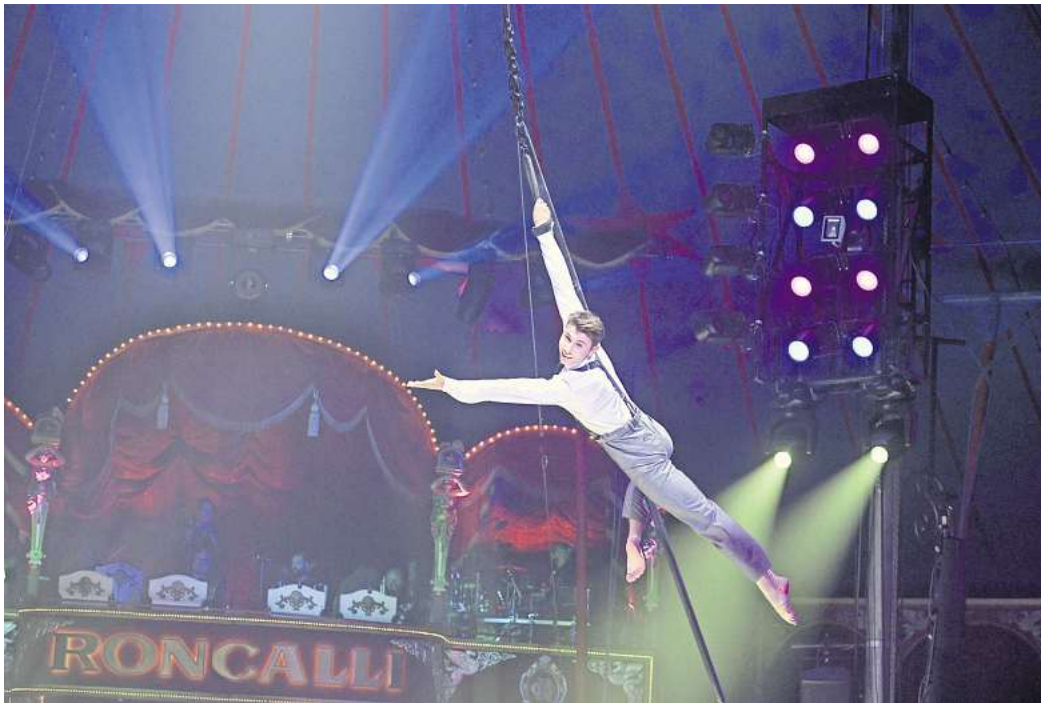
Roncalli - die Premiere von ArtisArt in Hannover

Wenn Kunst auf Zirkus trifft, entsteht eine magische Fusion aus atemberaubender Artistik, charmanter Clownerie und der typischen Roncalli- Atmosphäre.