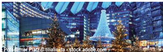
Potsdamer Platz

Weihnachtsmärkte rund um Berlin mit der MS Princess D-PRBEBE Berlin - Potsdam - Brandenburg - Berlin 5 Tage ✓ Fahrt im Luxusreisebus ✓ Flusskreuzfahrt laut Reiseverlauf ✓ Kofferservice an/von Bord ✓ 4 x Übernachtung in der gebuchten Kabine ✓ All-Inclusive-Verpflegung an Bord: 4 x Frühstück, 3 x 4-Gang-Mittagessen, 4 x Nachmittagskaffee/tee, 4 x 4-Gang-Abendessen, 1 x 5-Gang-Kapitänsdinner ✓ Getränkepaket: Hauswein, Bier vom Fass, alkoholfreies Bier, Softdrinks, Säfte, Kaffee/Tee u. Mineralwasser (10:00 Uhr - 22:00 Uhr) ✓ 1 x Willkommens-Sekt und 1 x Abschiedsgetränk im Rahmen des Kapitänsdinners ✓ Stadtrundfahrt Berlin ✓ Besuch der Weihnachtsmärkte in Potsdam, Brandenburg und am Schloss Charlottenburg in Berlin ✓ Bordmusiker ✓ durchgehende Reisebegleitung ✓ alle Schiffsgebühren