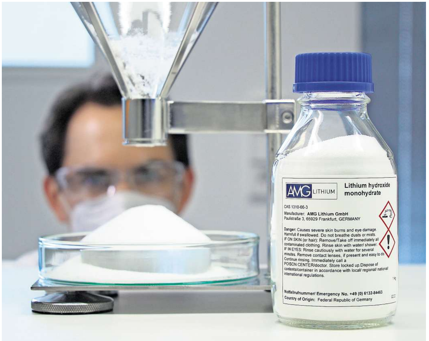
In einem Labor wird Lithium bearbeitet.

Die Firmen seien damit beschäftigt, möglichst viele verfügbare Daten über den tiefen Untergrund zu bekommen und auszuwerten. So könnten sie eingrenzen, wo innerhalb des jeweiligen Erlaubnisfeldes tatsächliche technische Tätigkeiten - wie zum Beispiel Seismik und dann zu einem späteren Zeitpunkt eventuell auch eine Probebohrung - sinnvoll erscheinen. Dabei gelte es auch, alle Parameter über Tage - wie zum Beispiel Schutzgebiete - im Blick zu behalten, damit später technische Tätigkeiten überhaupt möglich sind. All diese Daten würden die Unternehmen sammeln und auswerten,