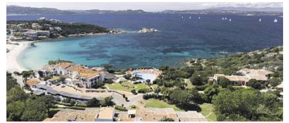
Zahlreiche Top Hotels, wie hier das 4,5* Premium Hotel La Bisaccia auf Sardinien, stehen in allen Zielen zur Auswahl.

„Fliegen ab Braunschweig“ bereits ab € 499,- inkl. Top Hotel Städte wie die angebotenen Reiseziele Barcelona oder Rom gehören zu den absoluten Highlights in Europa. In Italien geht es an die Amalfiküste, nach Sizilien, auf die Liparischen Inseln, nach Ischia oder Sardinien. Die Blumeninsel Madeira im Atlantischen Ozean steht ebenso im Flugplan wie Zypern, das mit besten Temperaturen und tollen Hotels lockt. In Griechenland wird ein echter Geheimtipp angefliegen: die Halbinsel Chalkidiki. Neu im Flugplan ist die Insel Malta, die mit Kultur und Lifestyle in Südeuropa