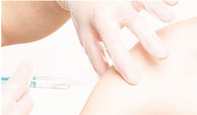
Eltern müssen den Masern-Impfschutz ihrer schulpflichtigen Kinder nachweisen - so schreibt es ein seit 2020 bestehendes Gesetz vor.