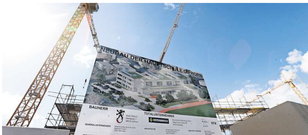
Neuer Standort, neuer Name: Gifhorns Hauptschule soll künftig nicht mehr Freiherr-vom-Stein-Schule heißen.

Rund um die neue Hauptschule soll ein sogenannter Bildungs- und Betreuungscampus gebildet werden, vernetzt mit dem bestehenden Bildungs-, Jugend-, Freizeit- und Sportareal.