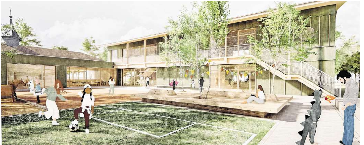
Architektenwettbewerb: So soll die Mühlenbergschule in Osloß bald aussehen.