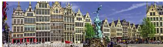
Antwerpen Belgien