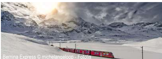
Bernina Express