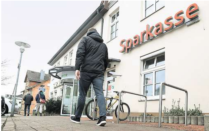
Am Schillerplatz bleibt der SB-Bereich der Sparkasse noch, bis in der Innenstadt ein neuer SB-Pavillon entsteht.

Mitarbeitende aus der Filiale Calberlaher Damm sind eben-