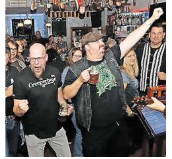
Das Honky Tonk-Festival wird es wohl künftig in der Mühlenstadt nicht mehr geben.

Und nun? Ist das das endgültige Aus für Honky Tonk in Gifhorn? Wahrscheinlich schon, wenn man Brählers Ausführungen zugrunde legt: „Eine Wiederbelebung bräuchte eine große Kraftanstrengung im Zusammenspiel von unserer Agentur, Sponsoren, Stadtmarketing, Gastronomen. Ob es dann funktioniert, ist aber auch fraglich.“