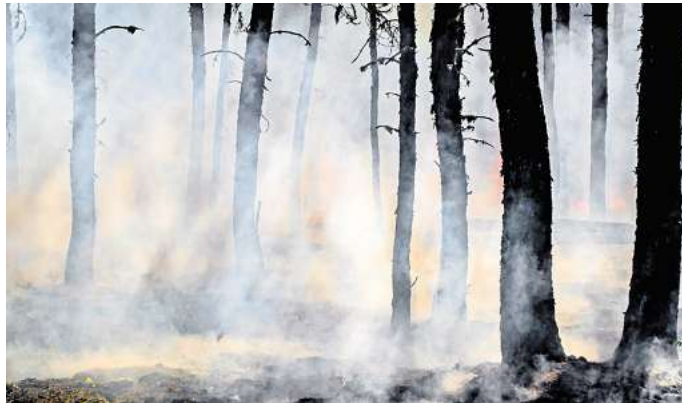
Invasive Arten begünstigen Wald- und Flächenbrände.

Die in Eurasien heimische Dach-Trespe verursacht im Nordwesten der USA ein anderes Problem: Sie breitet sich nach einem Feuer so schnell aus, dass andere Pflanzen kaum eine Chance haben, sich zu regenerieren. Somit tragen sie nicht nur zu einer erhöhten Intensität der Brände bei, sondern durch ihre leichte Entzündlichkeit auch zu deren Häufigkeit.