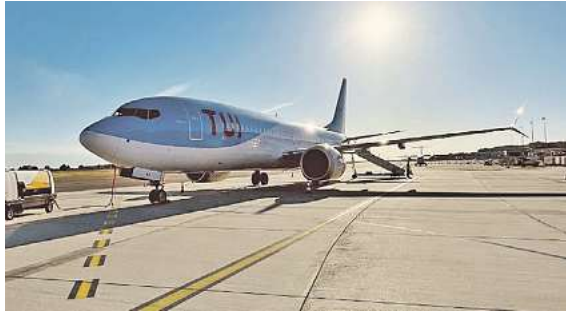
2026 exklusiv für momento ab dem Flughafen Braunschweig im Einsatz: Die deutsche TUIfly

zu diesen exklusiven Angeboten erhalten Sie unter der kostenfreien (aus dem dt. Festnetz) Buchungshotline T. 0800 / 38 300 38 (Mo-Fr 9-18 Uhr, Sa 9-13 Uhr), im FIRST Reisebüro Schmidt, in weiteren Reisebüros oder unter www.fliegen-ab-braunschweig.de .