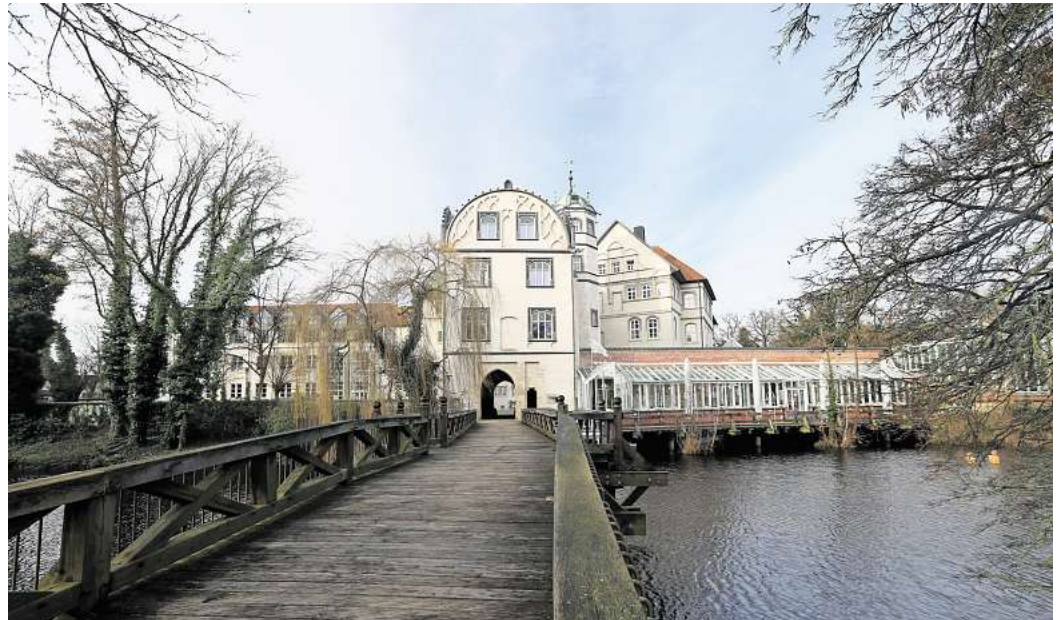
Das Gifhorner Schloss: In diesem Gebäude sitzt der Gifhorner Landrat/die Landrätin.

Aktuell wird das Landratsbüro nicht genutzt. Es ist in dunklen Braun-Tönen gehalten. Ein großer Schreibtisch, ein Besprechungstisch mit einem halben Dutzend Stühlen sowie eine Sitzcke mit Sofas und Couchtisch stehen in dem Raum. In einer Fensternische stehen drei Fahnen: für Europa, Deutschland und den Landkreis Gifhorn. Die meisten Bilder sind derzeit abgehängt und stehen auf dem Boden, an die Wand gelehnt. Vor der Tür steht aktuell ein kleines Bild von Tobias Heilmann mit Trauerflor.