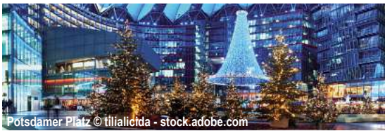
Potsdamer Platz