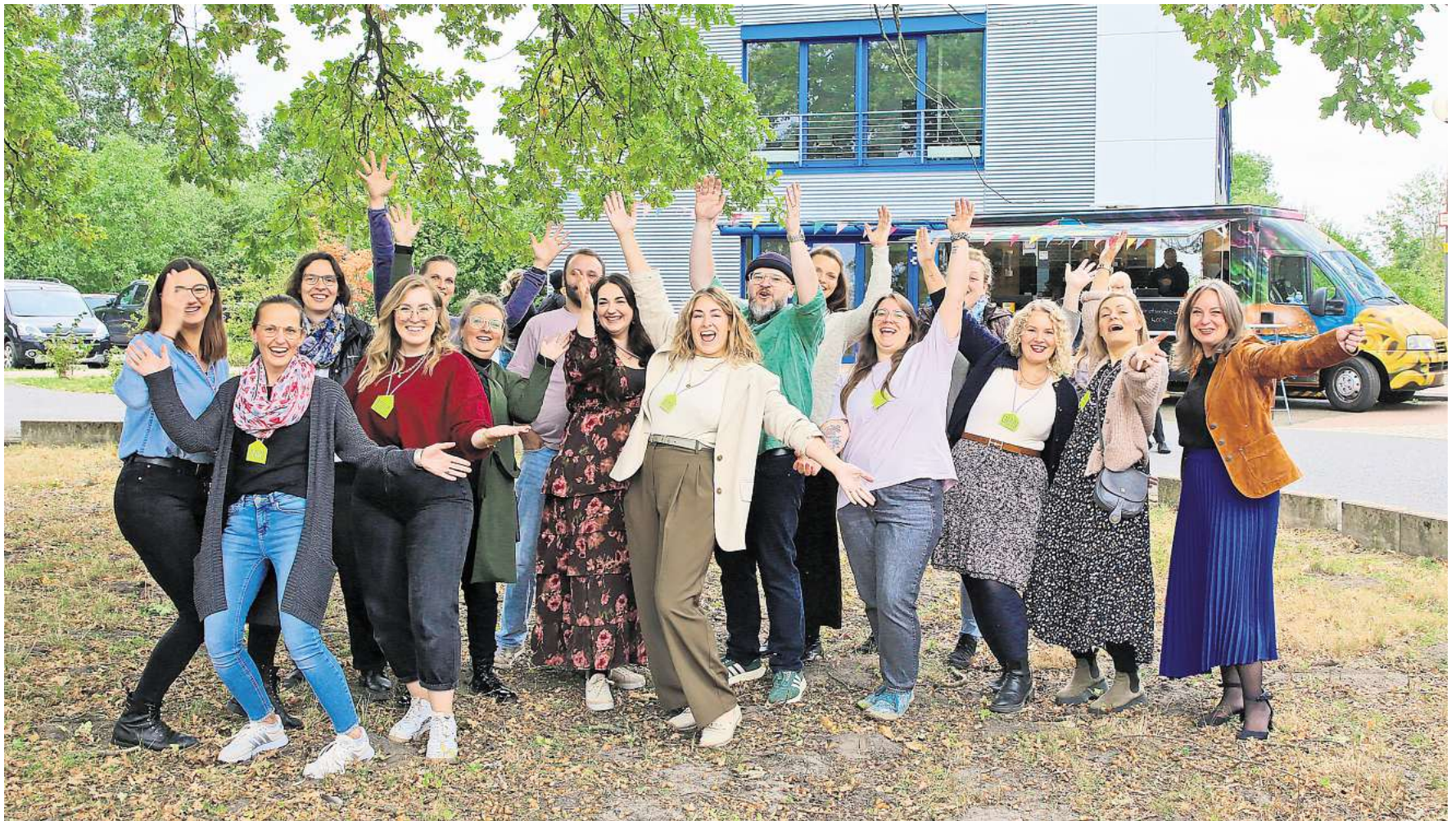
In Feierlaune: Das Team der Freien Schulen Gifhorn freute sich über den großen Andrang zum Informationstag.

Initiatoren geben Einblick in Vorhaben, Projektstand und Schulgeld