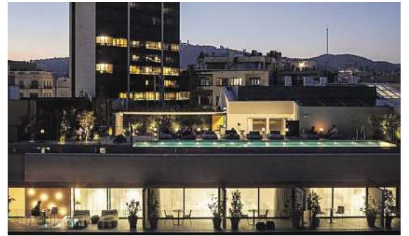
Viele Top Hotels, wie hier das 5* Ohla Eixample in Barcelona, stehen in allen Zielen zur Auswahl.

In allen Zielen hat der Gast die Auswahl aus einem vielfältigen Hotelangebot. So kann man vom Flair-Hotel bis zur Luxusherberge,