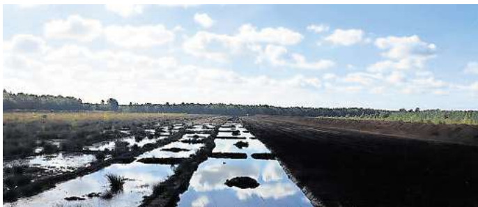
Das Große Moor nordöstlich von Gifhorn: Das Wissen um den Lebensraum ist für den Erhalt enorm wichtig.

Gifhorn/Leiferde. Der Kreisverband Gifhorn des Naturschutzbundes (NABU) hat die Ausbildung von Zertifizierten Natur- und Landschaftsführern (ZNL) mit dem Themenschwerpunkt Moor erfolgreich abgeschlossen: Die Teilnehmerinnen und Teilnehmer legten ihre schriftlichen und praktischen Prüfungen im Neudorf-Platendorfer Moormuseum mit großer Erfolgsquote ab - und voraussichtlich werden alle mit den noch folgenden Nachprüfungen die Qualifizierungsmaßnahme mit einem Zertifikat in der Hand abschließen können. Vor sechs Monaten hatte eine bunt gemischte Gruppe Men-