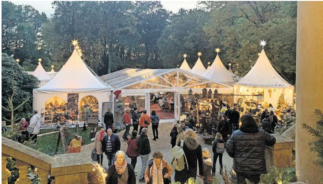
„Winterträume“ auf Schloss Eldingen: hallo Wochenende verlost Freikarten für das Festival.

Eldingen. Bereits zum 14. Mal findet auch in diesem Jahr wieder das Winterfestival „Winterträume“ auf Schloss Eldingen statt. Vom 30. Oktober bis zum 2. November wird das imposante historische Herrenhaus mitsamt seiner romantischen Parkanlage für den Publikumsverkehr geöffnet, damit hier wieder internationale Aussteller anspruchsvoller Wohnkultur, Kunst und Design, Antiquitäten, Schmuck, Landhausmoden und die schönsten Winterdekorationen aus aller Welt