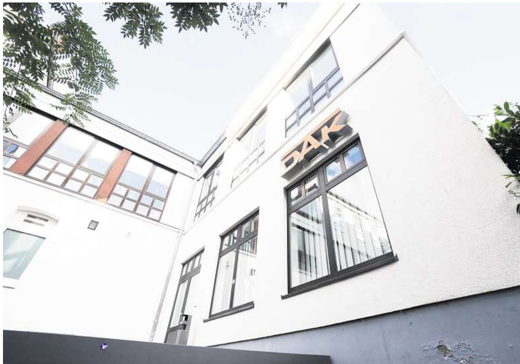
Standort geschlossen: Die Krankenkasse DAK hat ihre Filiale am Steinweg aufgegeben.

Wie in vielen anderen Unternehmen sei „der persönliche Kundenkontakt deutlich zurückgegangen“. Die Kundinnen und Kunden nutzten stattdessen immer öfter digitale Kommunikationswege. „Ein Weiterbetrieb