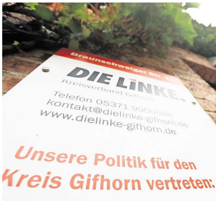
Landratswahl in Gifhorn: Jetzt hat sich auch Die Linke in Sachen Kandidatur positioniert.