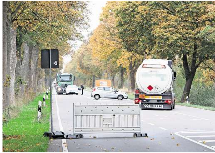
Am Montagmorgen kam es in Meine zu einem Verkehrschao: Zahlreiche Verkehrsteilnehmer ignorierten die Hinweisschilder zur Sperrung und mussten letztlich wenden.