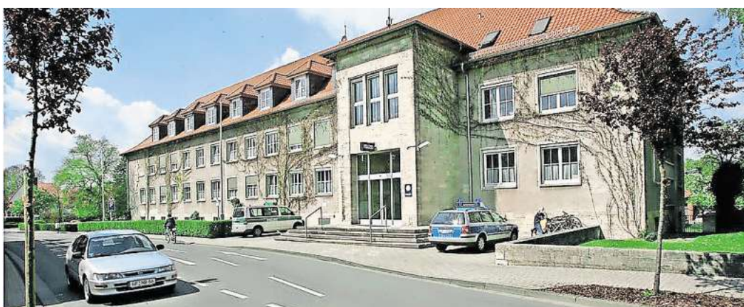
Auch eine Besichtigung der Gifhorer Polizeiinspektion steht auf dem Programm der Seniorenschule.

Gifhorn. Die Seniorenschule in Gifhorn ist mit einem vielseitigen Themenangebot in das 52. Semester gestartet: Unter anderem stehen Formate wie „Clever alt werden“ mit Dr. Ulrich Prang, Englischunterricht, Besichtigung des Polizeigebäudes in Gifhorn, Führung durch das Stadt-