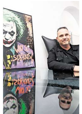
Kommt nach Gifhorn: Der weltweit angesagte Pop Art Künstler Michel Friess.

Die Friess-Ausstellung soll von März bis Ende 2026 40 bis 50 großformatige Bilder zeigen. „Wir werden die Ausstellungsfläche verdoppeln. Michel wird noch einige Bilder für die Ausstellung produzieren“, kündigt Edler an.