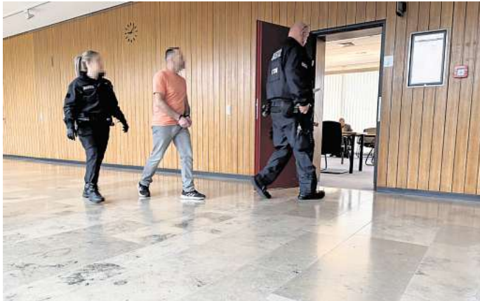
Dem 43-jährigen Angeklagten (Mitte) wird unter anderem vorgeworfen, seine Lebensgefährtin schwer verletzt zu haben.

Dabei habe die Beziehung ganz harmonisch angefangen. Zu Be-