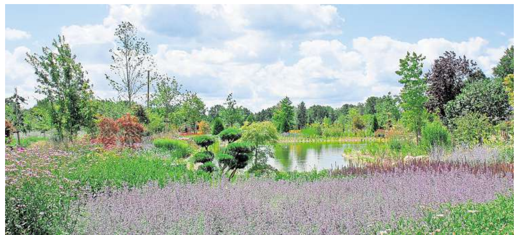
Opa Erny lädt am Samstag und Sonntag zum Herbstfest in seinen üppigen Garten ein.