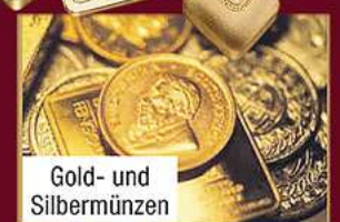
Gold- und Silbermünzen

Ankauf von Goldschmuck aller Art. Altgold, Bruchgold, Münzen, Barren, Platin sowie gut erhaltene Ringe, Broschen, Ketten (Armbänder bevorzugt in breiter Form) Colliers, Medaillons, Golduhren - auch defekt, VB Pelz mit Gold