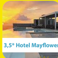
3,5* Hotel Mayflower