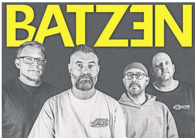
Rock an der Riede 2025 in Isenbüttel: Unter anderem die Band "Batzen" wird den Saal zum Kochen bringen.