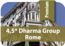
4,5* Dharma Group Rome