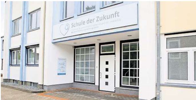
Die Schule der Zukunft in Gifhorn: Betreiber Lebenshilfe und der Landkreis ringen um die Finanzierung der Einrichtung.

Empfehlung der Verwaltung: Sachkosten in Höhe von 616.000 Euro jährlich übernehmen