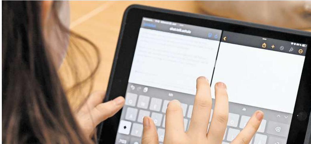
Künstliche Intelligenz an Schulen: Das Präventionsbündnis für ein friedfertiges Gifhorn lädt zum Fachtag ein.