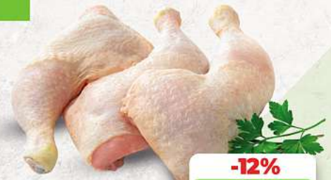
Hähnchenschenkel mit Rücken an unserer Frischetheke je 1 kg