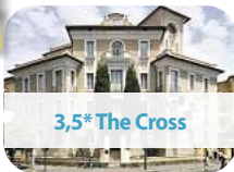
3,5* The Cross