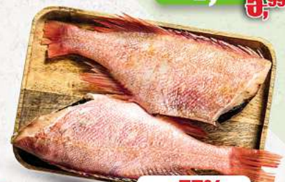
Rotbarsch frisch, ohne Kopf, aufgetaut an unserer Frischetheke je 1 kg