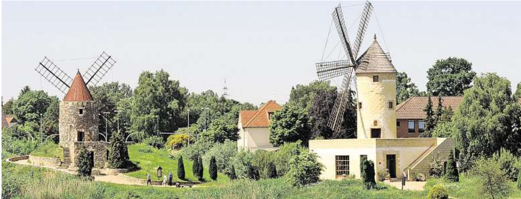
Ging es bei der Vergabe der Sanierungsaufträge im Mühlenmuseum nicht mit rechten Dingen zu? Der Bund der Steuerzahler ist dieser Auffassung und hat die Stadt Gifhorn angezeigt.

Vergabe der Sanierungsaufträge soll widerrechtlich erfolgt sein