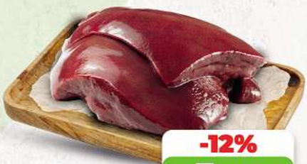
Rinderleber an unserer Frischetheke je 1 kg