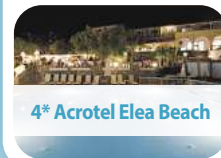
4* Acrotel Elea Beach

8 Tage pro Person ab € 699,- 20.05. – 27.05.2026 Feiertag 03.06. – 10.06.2026 (+ € 40,-)