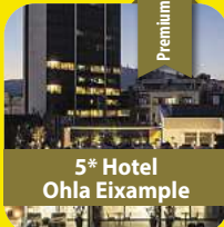
5* Hotel Ohla Eixample

5 Tage pro Person ab € 699,- 21.03. – 25.03.2026 Ferien 29.03. – 02.04.2026 (+ € 30,-) Ferien Auch in den Osterferien