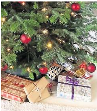
Weihnachtszeit ist Geschenkzeit – Viele suchen noch nach dem passenden Geschenk für ihre Liebsten.

Andere wiederum finden den Konsum rund um das Weihnachtsfest zu viel und haben sich auf die Fahne geschrieben, nur nachhaltige Geschenke zu machen. Manch einer findet Geschenke generell unnötig und