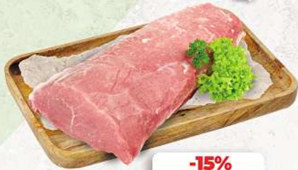
Schweinelachse ohne Knochen an unserer Frischetheke je 1 kg