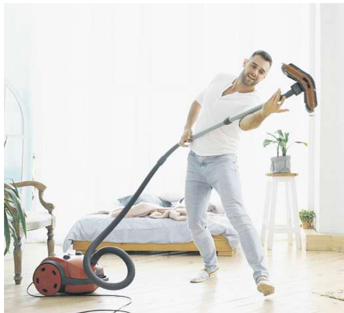
Ein Trend für Frauen und Männer: Putzen kann längst nicht nur funktional, sondern auch stilvoll sein.

Ob Putzen tatsächlich entspannend wirkt, hängt laut Adli auch davon ab, wie vertraut die Handlung ist. „Nur wer eine Routine hat, kann sie als Ritual erleben“, sagt er. „Wer sich erst in eine Tätigkeit hineindenken muss, erlebt sie eher als Arbeit denn als Meditation.“ Daher tritt dieser Effekt nicht bei allen Men-