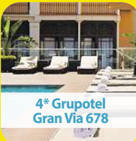
4* Grupotel Gran Via 678