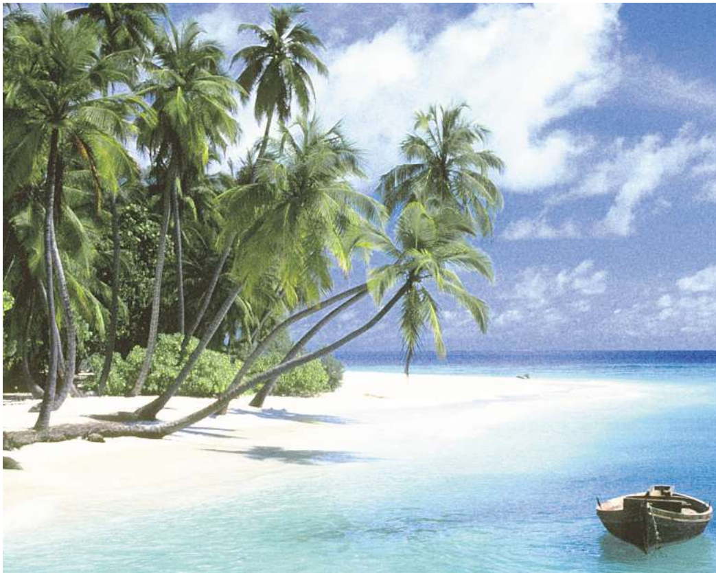
An den malerischen Stränden der Malediven ist das Rauchen für jüngere Generationen ab sofort verboten.

Der Bann gilt ausdrücklich nicht nur für Einheimische. Auch Reisende, die nach dem Stichtag geboren wurden, dürfen auf den Malediven keine Tabakwaren kaufen, besitzen