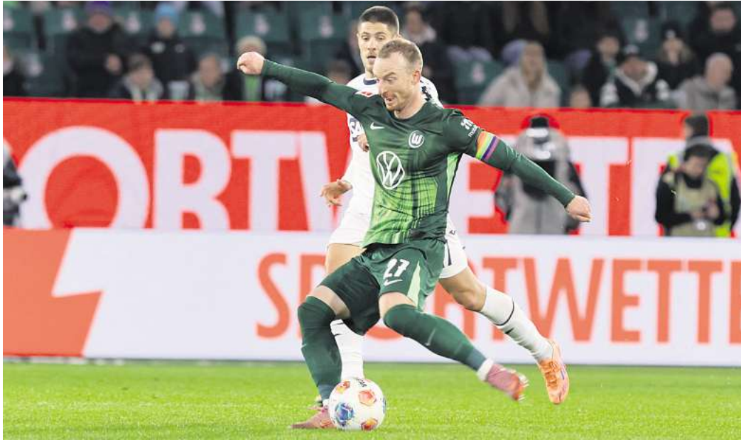
Für das Spiel des VfL Wolfsburg gegen Leverkusen können Leser Eintrittskarten gewinnen.

Für Wolfsburg dürfte es also kein leichtes Spiel werden. Doch gerade gegen die favorisierten Leverkusener wollen die Gastgeber zeigen, dass mehr in ihnen steckt, als der aktuelle Tabellenplatz vermuten lässt. Ein Sieg wäre nicht nur Balsam für die angeschlagene Mann-