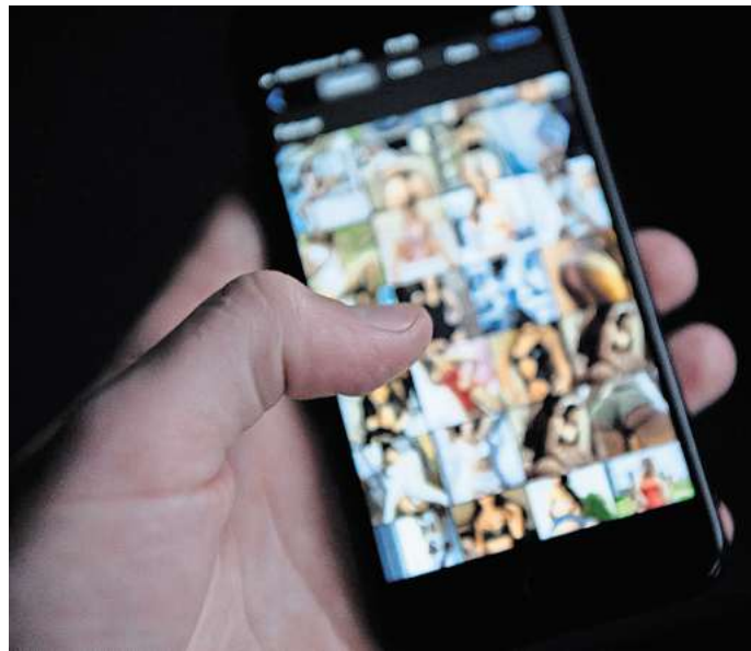
Intime Fotos verschickt: Weil er das gegen den Willen der Freundin getan hat, hat das Gifhorer Amtsgericht einen 33-jährigen Mann verurteilt.

Der 33-Jährige bestand aber darauf, die Bilder nur an die Cousine seiner ehemaligen Freundin geschickt zu haben. Diese Behauptung widerlegte der Richter mit den vorliegenden Beweisen aus der Analyse des Handys des Angeklagten. „Die Beweise zeigen deutlich, dass die Bilder an mehrere Personen geschickt wurden“, sagte der Richter. Der 33-Jährige widersprach dann allerdings deutlich dem zweiten Tatvorwurf der Nötigung. Er habe nicht versucht, seine ehemalige Freundin zu einer erneuten Be-