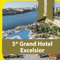
5* Grand Hotel Excelsior