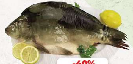
Spiegelkarpfen (Cyprinus carpio) an unserer Frischetheke je kg