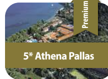
5* Athena Pallas