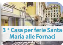
3* Casa per ferie Santa Maria alle Fornaci