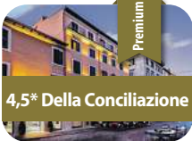
4,5* Della Conciliazione