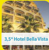
3,5* Hotel Bella Vista

Malta begeistert mit Geschichte, klarem Wasser und charmanten Städten. Valletta, UNESCO-Weltkulturerbe, beeindruckt mit Barockarchitektur. Tempel, Festungen und Fischerdörfer, mildes Klima – Kultur, Natur und Meer vereint.