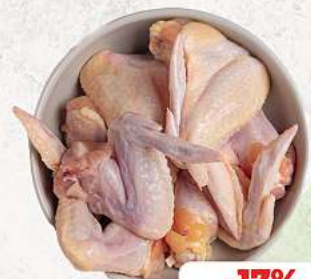
Putenfügel an unserer Frischetheke je 1 kg