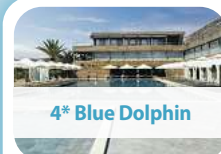
4* Blue Dolphin

8 Tage pro Person ab € 699,- 20.05. – 27.05.2026 Feiertag 03.06. – 10.06.2026 (+ € 40,-)