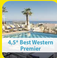
4,5* Best Western Premier