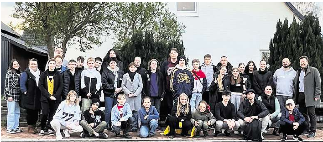
Im Rahmen von Workshops konnten Jugendliche sich in die Gestaltung des neuen Jugendzentrums einbringen.