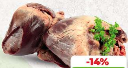
Schweineherz an unserer Frischetheke je kg

Herkunftsnachweise von unseren Produkten - siehe Etikettierung