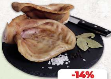
Schweineohren an unserer Frischetheke je 1 kg

Herkunftsnachweise von unseren Produkten - siehe Etikettierung