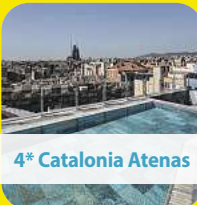
4* Catalonia Atenas