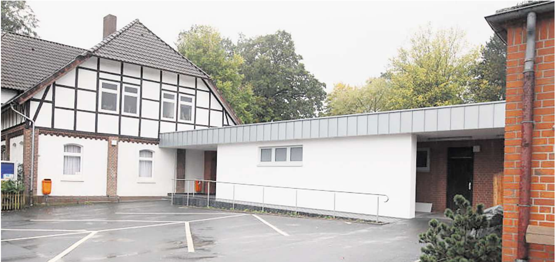
Vom Ortsrat geplante Investitionen in Gamsen: Unter anderem soll das Dorfgemeinschaftshaus ein neues Rednerpult und neue Bestuhlung erhalten.