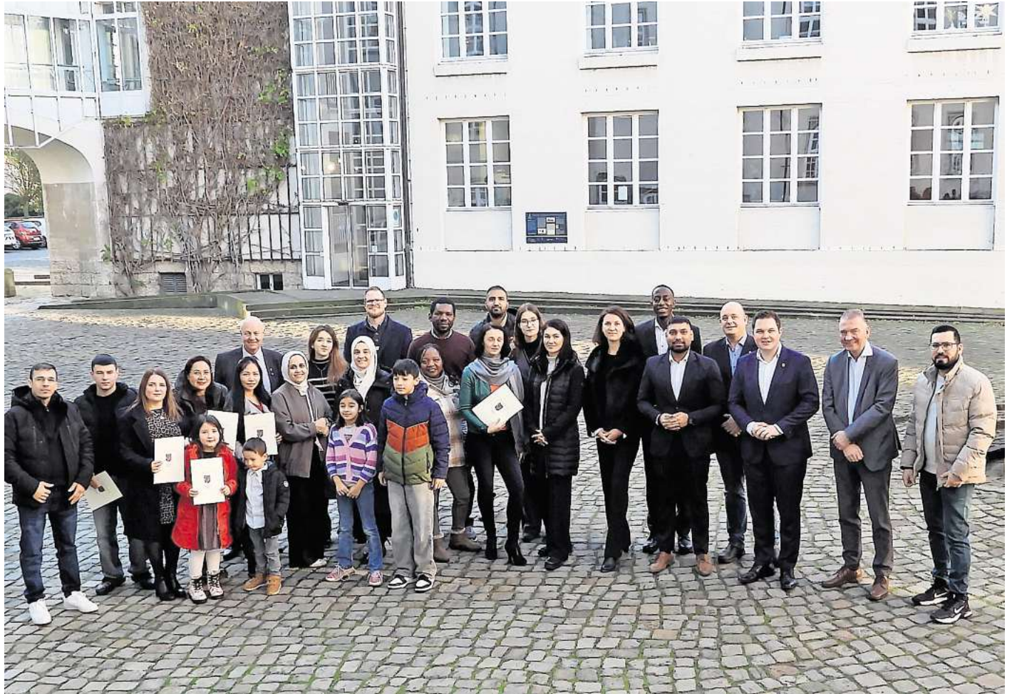
Landrat Philipp Raulfs (3.v.r.) händigte die Einbürgerungsurkunden an 35 Personen aus 17 Herkunftsländern aus.

Bis zum jetzigen Zeitpunkt wurden in 2025 insgesamt 350 Anträge auf Einbürgerung gestellt, teilt der Landkreis Gifhorn mit. Die Statistik zeige, dass sich das Interesse an einer Einbürgerung seit dem Jahr 2023 mehr als verdoppelt hat. Immer mehr Menschen fühlten sich dem deutschen Staat zugehörig, wodurch auch der Wunsch, die deutsche Staatsbürgerschaft zu erwerben, stetig wachse.