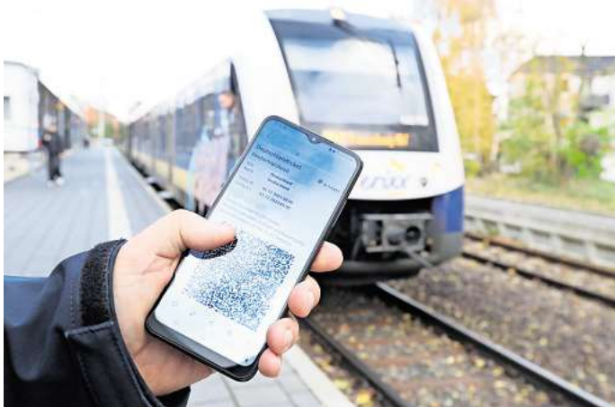
Nahverkehr wird teurer: Bei den Tickets des Verkehrsverbundes Region Braunschweig sind die Preise gestiegen.

Das Gute vorneweg: „Preisstabil bleiben die kostengünstigen Schüler-Monatskarten. Das verbundweite Ticket kostet weiterhin 30 Euro, das Ticket für das Stadtgebiet Braunschweig 20 Euro“, teilte der VRB mit. Während das Deutschlandticket auf den Preis von 63 Euro pro Monat im Abo steigt, bleibe das D-Ticket Job weiterhin 30 Prozent billiger als das Deutschlandticket daselbst. „Es kostet im nächsten Jahr 44,10 Euro monatlich oder weniger, je nach Zu-