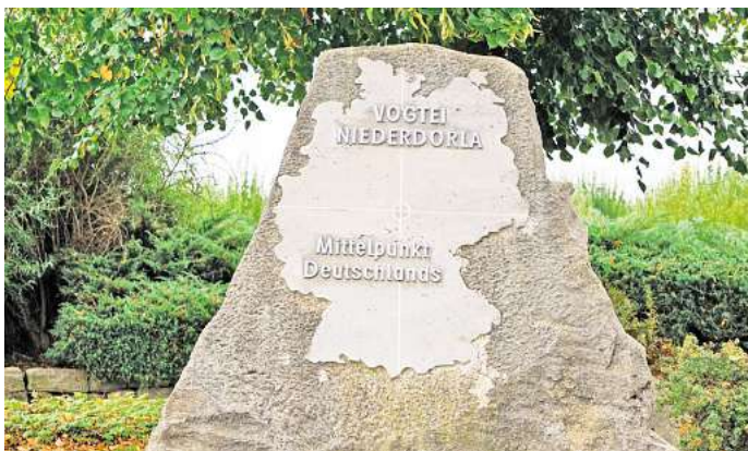
In Niederdorla ist man sicher und feiert den Mittelpunkt Deutschlands mit einem Stein.

Um den Mittelpunkt von Deutschland und jedes anderen Landes zu bestimmen, gibt es deshalb unterschiedliche Metho-