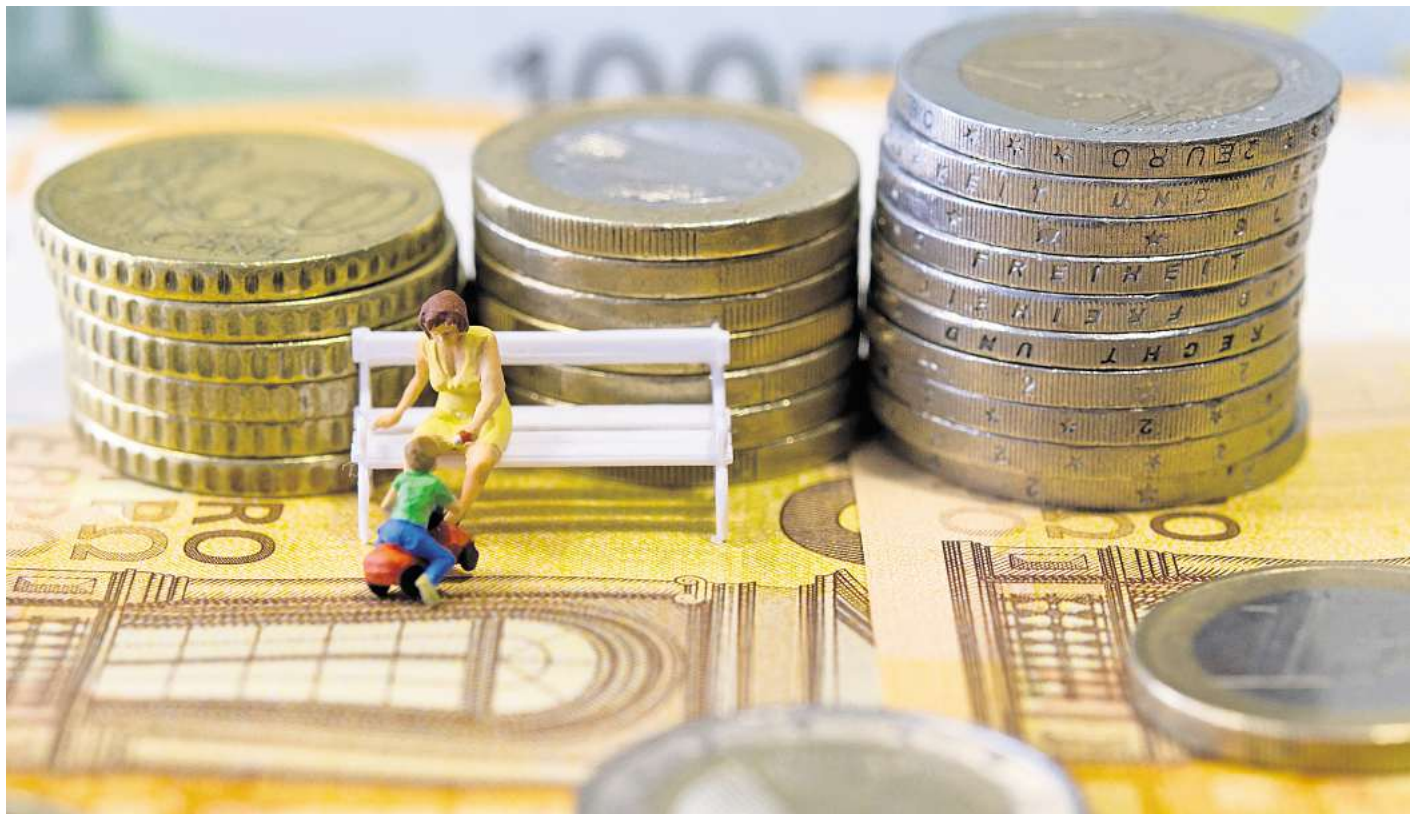
Familien werden 2026 deutlich gestärkt: Der Kinderfreibetrag steigt und das Kindergeld wird zudem erhöht.

Familien werden 2026 ebenfalls deutlich gestärkt, auch das ist schon sicher. Der Kinderfreibetrag steigt auf 6.828 Euro je Kind für beide Eltern zusammen. Das sind 3.414 Euro pro Elternteil.