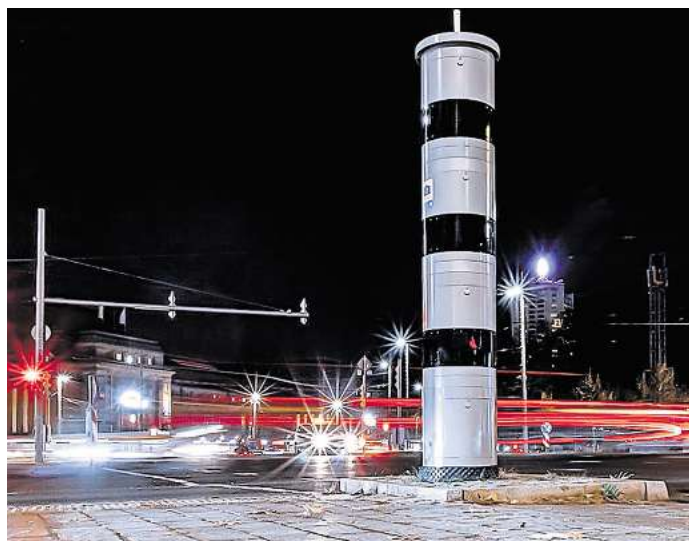
Der ultimative Vorsatz sollte im Straßenverkehr lauten, sich an Tempolimits zu halten.

Kommt trotz aller guten Vorsätze ein Bußgeldbescheid ins Haus, ist es zudem sinnvoll, unter anderem zu prüfen oder prüfen zu lassen, ob die Messung korrekt war. Auch auf diesem Weg lässt sich der eine oder andere Punkt vermeiden, denn rund ein Drittel aller Bußgeldverfahren sind fehlerhaft oder die Vorwürfe werden nicht ausreichend belegt. „Fehlt beispielsweise die vorschriftsmäßige Eichung eines Geräts, ist die Messung nicht verwertbar. Einer der häufigsten Gründe für die Einstellung von Verfahren sind fehlende oder qualitativ schlechte Messfotos, die die Identifizierung des Fahrers unmöglich machen. Natürlich ist auch menschliches Versagen denkbar. Haben Polizisten ihr mobiles Radargerät auch nur um wenige Grad falsch ausgerichtet, kommen Autofahrer davon. Auch wenn sie möglicherweise wirklich zu schnell unterwegs waren“, erklärt Tom Louven. Da Laien in der Regel nicht alle Besonderheiten von Gesetzgebung und Rechtsprechung kennen, lohnt sich in jedem Fall die Prüfung durch einen Anwalt.