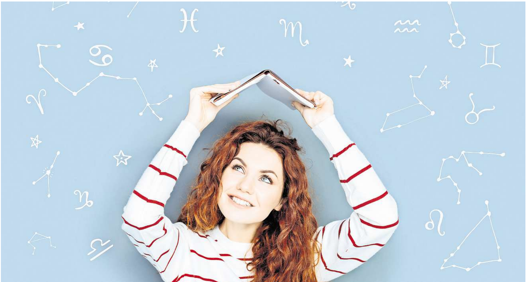
Die Sterne für 2026 stehen gut.