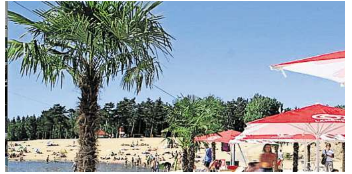
Urlaubsoase Bernsteinsee in Stüde: Hotel und Gastronomie werden ab 2026 von der international tätigen Gruppe Belvilla betrieben.