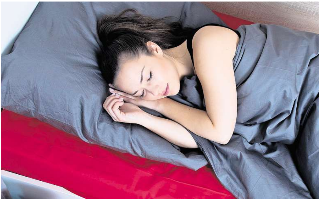
Erholsamer Schlaf ist wichtig - und man kann ein paar einfache Dinge dafür tun.

Besonders wichtig ist Schlaf auch fürs Gehirn. Nachts werden Erinnerungen sortiert, Unwichtiges gelöscht und neue Inhalte verknüpft. Zudem ist im Tiefschlaf das sogenannte glymphatische System aktiv – eine Art Müllabfuhr des Gehirns, die schädliche Stoffwechselproduk-