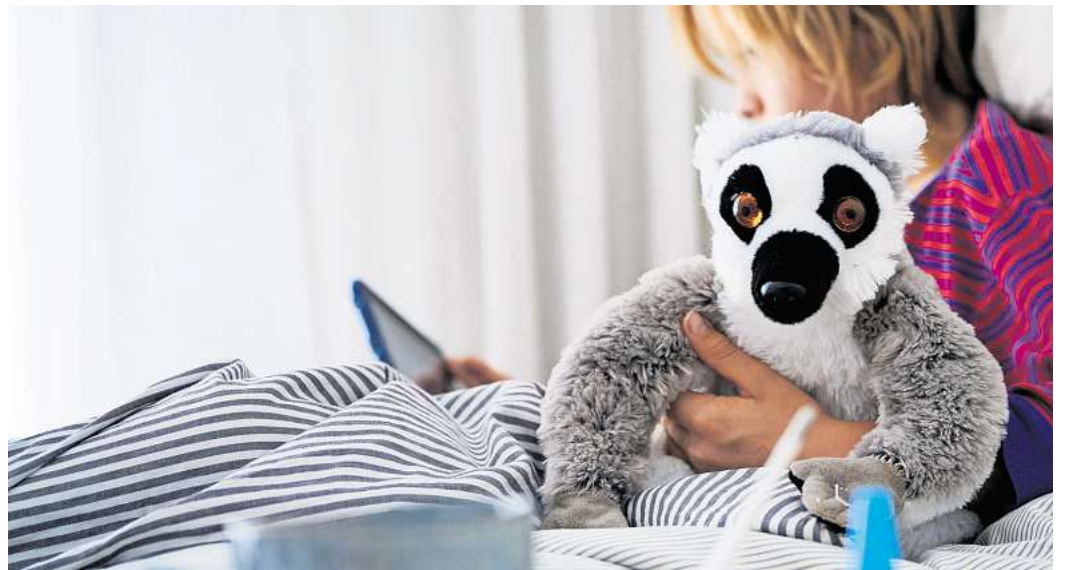
Je älter das Kind, desto schwieriger wird es, die Notwendigkeit einer persönlichen Betreuung zu begründen.

Arbeitnehmerinnen und Arbeitnehmer sollten sich frühzeitig informieren, rät die Kammer. Hilfestellungen bieten etwa das Pflegetelefon des Bundesfamilienministeriums oder regionale Pflegestützpunkte.