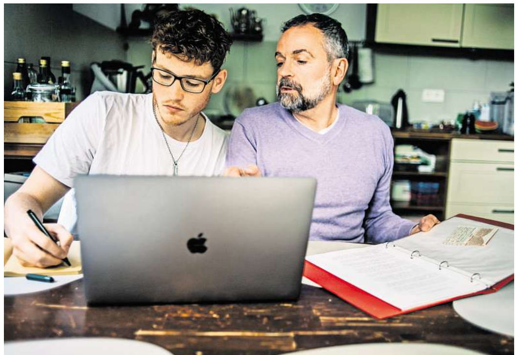
Notfallordner erstellt? Dann sollte Ihre Vertrauensperson auch wissen, wo dieser zu finden ist.

wahrungsort der Mappe mitzuteilen, sofern sie ihr nicht ohnehin ein Duplikat aushändigen. (DPA)