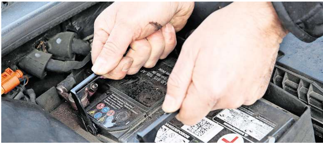
Gehört meist in die Hände von Fachleuten: Der Austausch der Autobatterie ist alles andere als einfach.

Laien sollten die Finger von einem Wechsel in Eigenregie lassen. Denn mit Abklemmen, Herausnehmen, Einsetzen und Anklemmen ist es meist nicht getan.