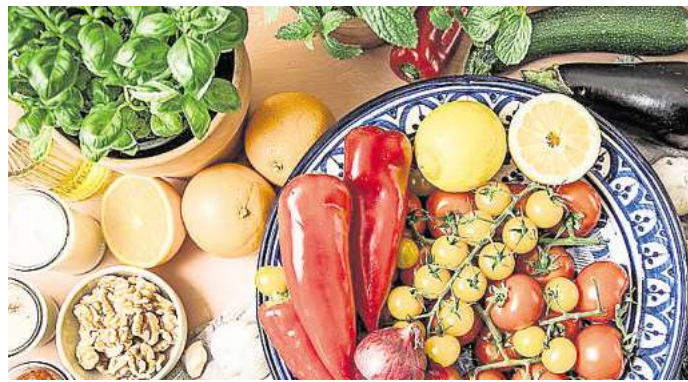
Viel Gemüse, Nüsse, Fisch: Mediterrane Kost kommt der Leber zugute.

Suchen Sie sich Snack-Alternativen für den schnell in den Mund geschobenen Schokoriegel. Gesünder sind Obst oder