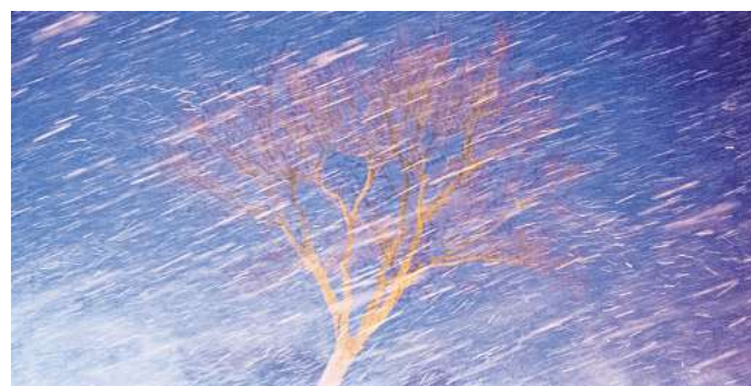
Mit langen Belichtungszeiten werden bei Wind und Sturm Bewegungen sichtbar.

Langzeitbelichtungen von 30 Sekunden und länger dagegen bieten sich für die leuchtenden Farben von Straßenlichtern an. Sturm und Wind: Machen Sie