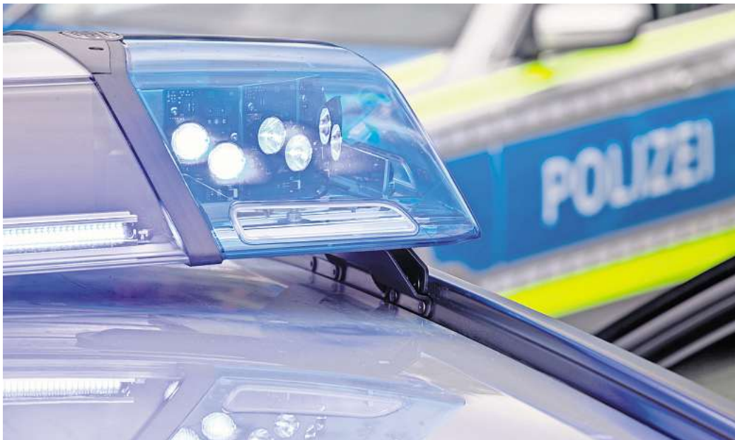
Blaulicht im Einsatz: Bei Unfällen im Straßenverkehr sind die rechtlichen Fragen oft komplex.

In dem Fall ging es um einen sechsjährigen Jungen. Dieser stieg aus dem Auto seiner Mutter aus, dass entgegen der Fahrtrichtung am Rand der Straße angehalten hatte. Er stieg auf der rechten Autoseite aus, machte die Tür zu und ging um das Auto herum. Dann lief er auf die Straße und wurde von einem etwa 20 km/h schnellem Auto erfasst und verletzt. Dessen Fahrerin hatte ihn nicht mehr erkennen