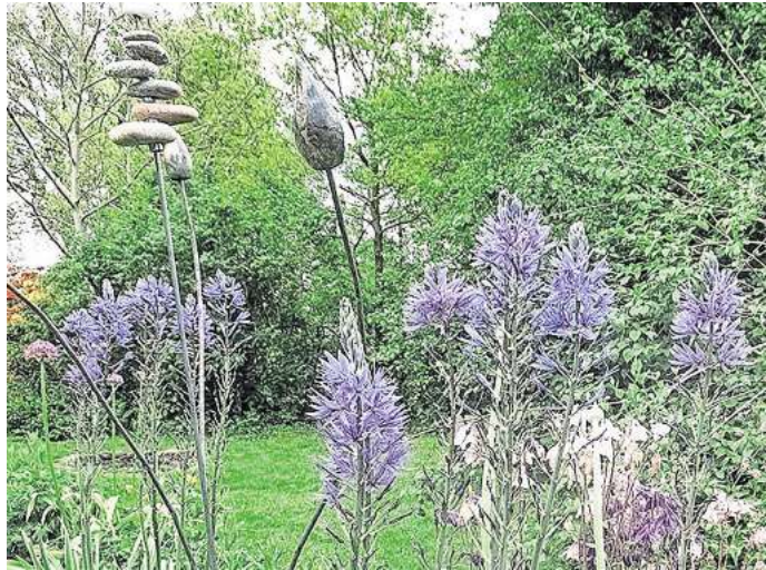
Aktion "Offener Garten": Der Kreisverband der Landfrauenvereine Gifhorn-Wolfsburg lädt Besitzer von schönen Gärten zur Teilnahme ein.

bis Dienstag, 10. Februar: Per Post an Rosemarie Camehl, Im Grundfeld 5 in 29399 Wahrenholz, per E-Mail an rose.marie-camehl@gmx.de oder telefonisch unter der Rufnummer (05835) 352.