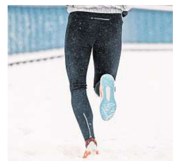
Joggen bei winterlichen Temperaturen ist möglich.

Der Lauf ist geschafft, nun ist das Dehnen dran. Das sollte aber lieber in warmer Umgebung, also drinnen, stattfinden, rät der Experte. Das belastet Bänder und Muskeln weniger. Dazu kommt: Wer verschwitzt in der Kälte steht, kühlt schnell aus. (DPA)