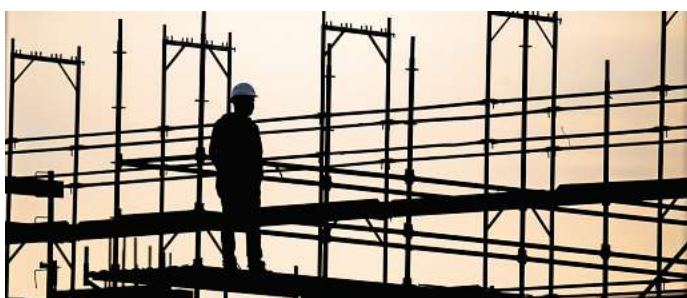
Ist durch betriebliche Gründe zu wenig zu tun, bekommen Arbeitnehmende ihren vollen Lohn, auch wenn sie die Arbeitsleistung nicht erbringen können.

Wird zum Beispiel ein Arbeitsverhältnis beendet, kann es sein, dass noch solche durch Arbeitnehmende verursachte Minusstunden auf dem Arbeitszeitkonto stehen. Diese können dann mit dem letzten Gehalt verrechnet werden - laut Arbeitnehmerkammer allerdings nur, wenn es ausdrücklich so vereinbart wurde. Denn Arbeitszeitkonten müssen in Arbeitsvertrag, Tarifvertrag oder Betriebsvereinbarung klar geregelt sein.