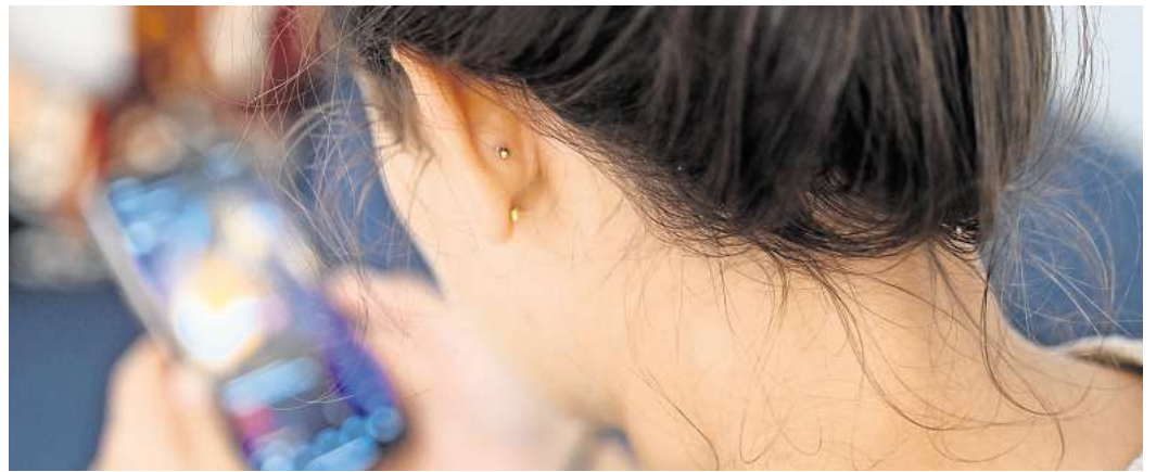
Gerade auf Social Media vergleichen wir uns viel mit anderen. Das kann Druck erzeugen.

Gerade in Phasen von Umbrüchen kann das Druck und Wertung erzeugen - etwa in Themen wie Elternschaft oder Beziehung, wo Normen vermittelt werden, an denen man sich mes-