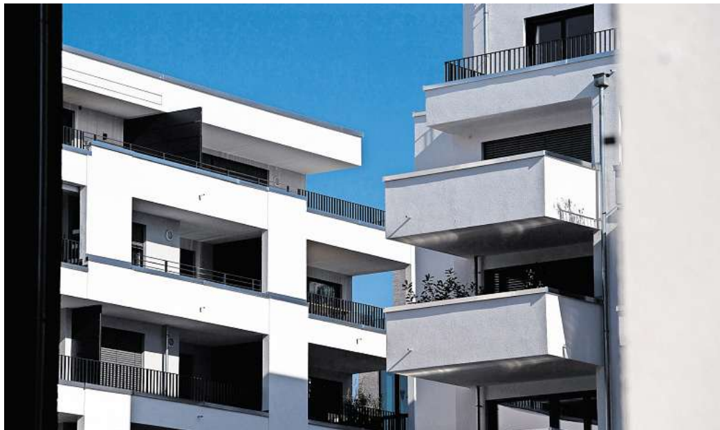
Gilt die gewöhnliche Nutzungsdauer oder eine verkürzte? Steuerlich kann das für vermietete Immobilien einen großen Unterschied machen.

2021 stellte der Bundesfinanzhof klar, dass der Nachweis einer kürzeren Nutzungsdauer nicht auf bestimmte Gutachtenformen