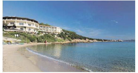
In allen Zielen steht ein großes Hotelangebot, wie hier das 4* Club Hotel Baja Sardinia auf Sardinien, zur Auswahl.

Doch nicht nur diese Badedestinationen werden im Frühjahr/Sommer 2026 ab Braunschweig angefliegen. Die Jets