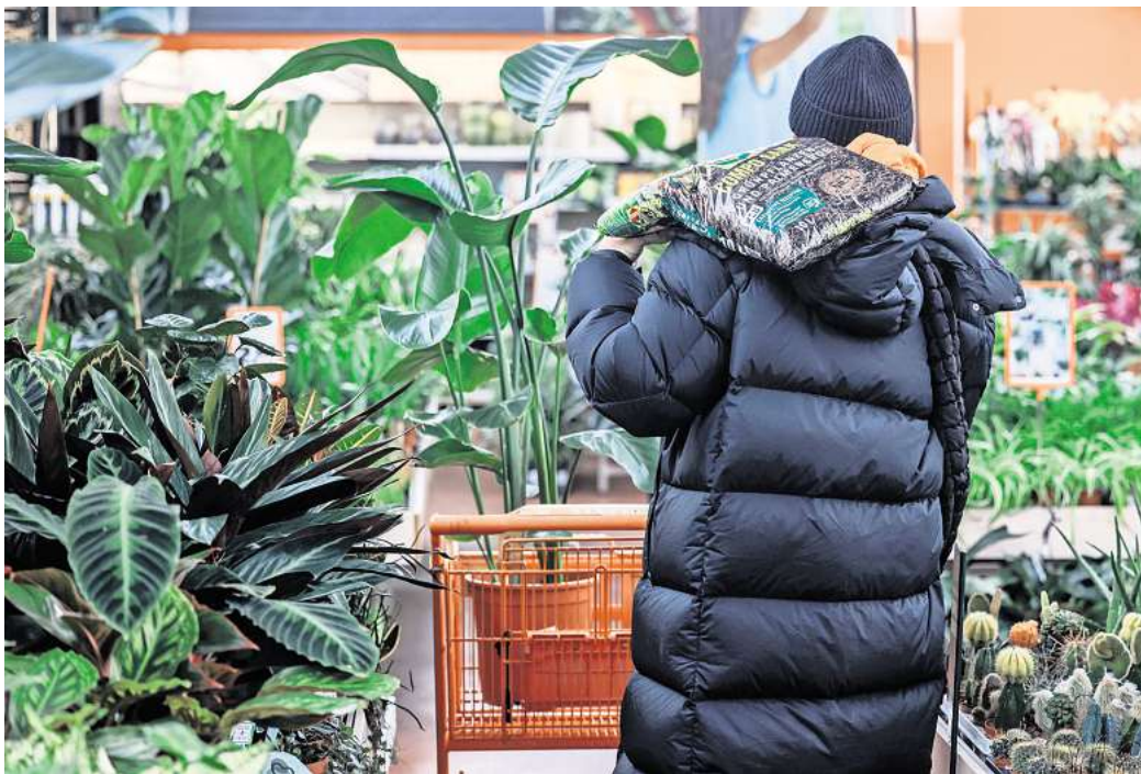
Neue Pflanzen fürs Zuhause: Bereits im Laden lohnt ein genauer Blick auf Topf und Blätter.