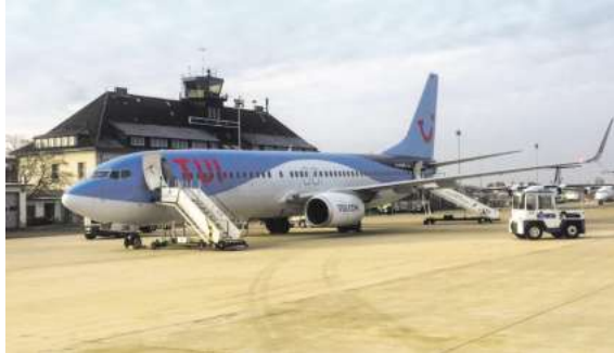
Ab Braunschweig direkt in die Sonne. Mit momento und TUIfly im Frühjahr/Sommer abheben.

Den Katalog, weitere Informationen und Buchungsmöglichkeiten dieser exklusiven Angebote erhalten Sie unter der kostenfreien Buchungshotline T. 08 00 / 38 300 38 (Mo-Fr. 9-18, Sa. 9-13 Uhr), in den FIRST Reisebüros Schmidt und weiteren Reisebüros der Region oder unter www.fliegen-ab-braunschweig.de .