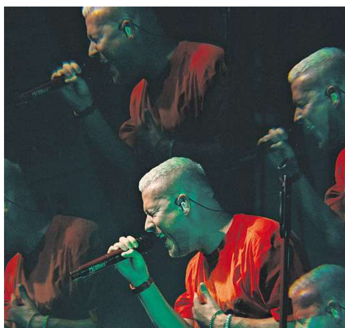
Der dritte Schlosshof-Act 2026 ist bestätigt: Der Deutsch-Pop-Künstler Mo-Torres tritt beim Unser Aller Festival auf.

Bereits im Vorverkauf für den Schlosshof sind außerdem die Berliner Indiepop-Künstlerin Madeline Juno (am Samstag, 30. Mai), die bereits bei Sing meinen Song ein Millionen-Publikum überzeugte, sowie die britische Independent-Legende New Model Army (am Sonntag, 31. Mai),