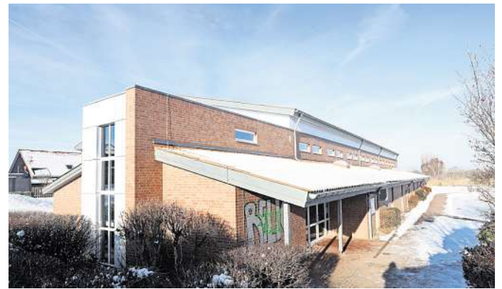
Für die Sporthallen, auch für die in Calberlah, erhebt die Samtgemeinde Isenbüttel nun Gebühren.

„Dabei hat sich der Samtgemeinderat ganz klar dafür entschieden, bei der Nutzung durch hiesige Vereine keine Kosten zu erheben“, betont der Rathauschef. „Schließlich wollen wir das Ehrenamt stärken.“ Andererseits kämen auch Vereine, die nicht in der Samtgemeinde ansässig sind, zum Training in die hiesigen