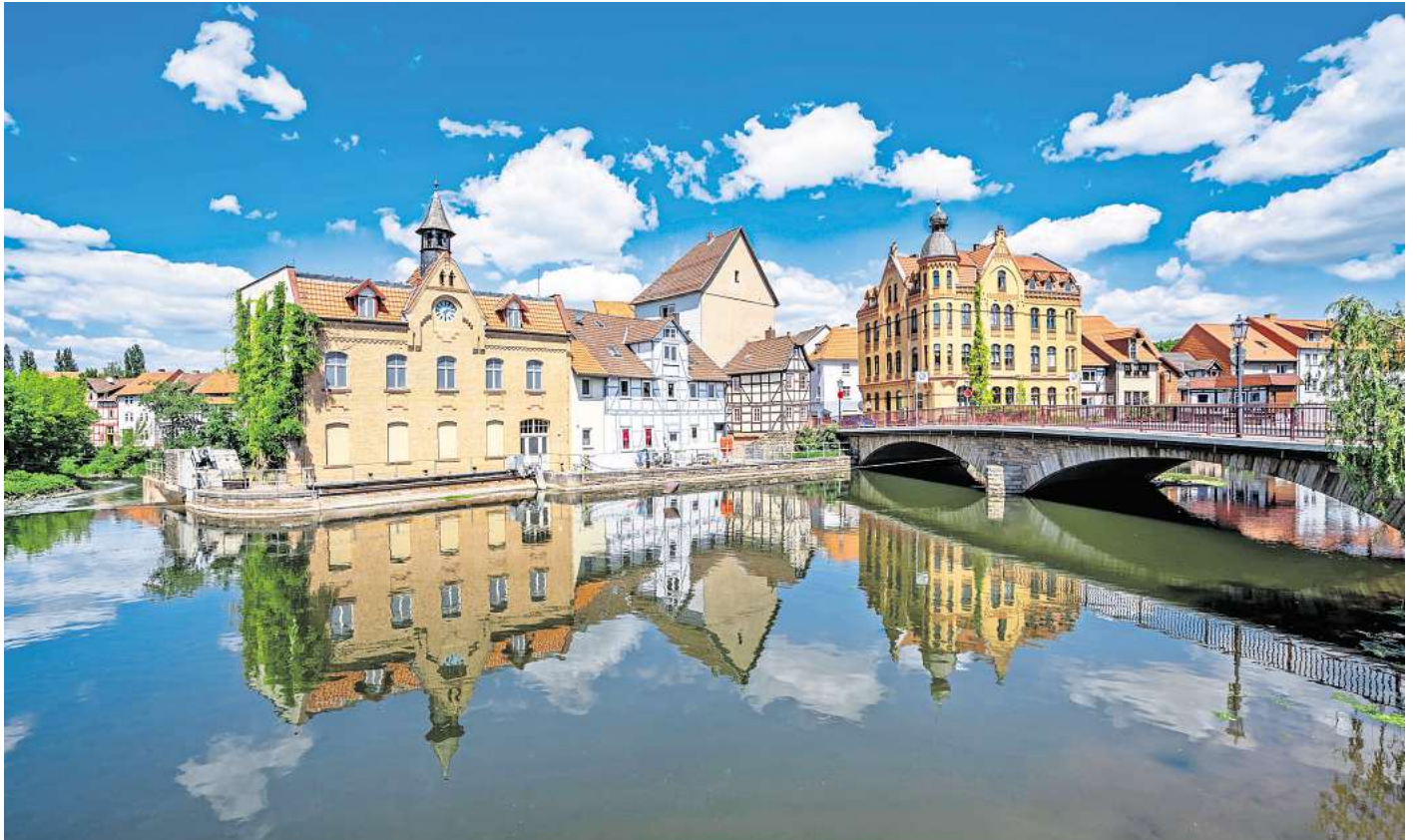
Schöner Ausblick aus den historischen Fachwerkhäusern: Eschwege liegt am Ufer der Werra – und ist eine der schönsten Fachwerkstädte Deutschlands.

Der Rundgang durch die Altstadt führt vorbei an Bauwerken aus mehreren Jahrhunderten. Viele Stationen liegen nah beieinander, sodass sich Geschichte