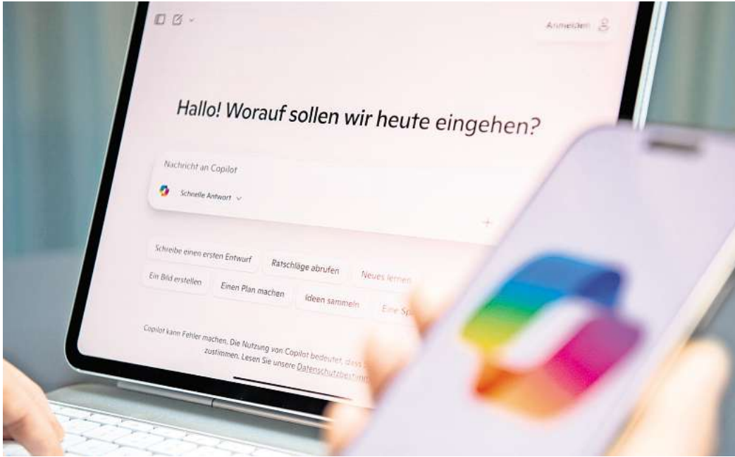
Ob zur Inspiration oder als Organisationshelfer: Wer Chatbots clever einsetzt, kann sich im Arbeitsalltag Erleichterung verschaffen.

KI Assistenten können jede Menge. Zum Beispiel: den Arbeitsalltag strukturieren,