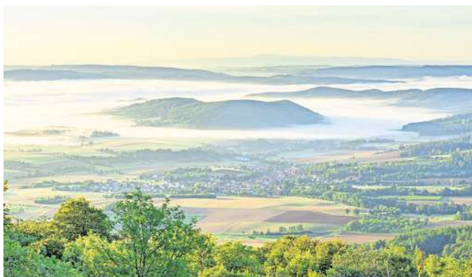
Der Blick vom Hohen Meißner ist atemberaubend.

Für Reisende bedeutet das: zusätzliche Anlässe für einen Besuch, lebendige Innenstädte und ein Sommer, in dem Geschichte nicht nur betrachtet, sondern gefeiert wird.