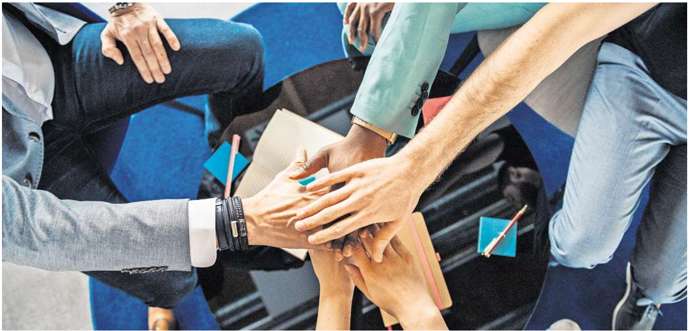
Wer seine Stärken kennt, kann berufliche Veränderungen gelassener angehen.

Viele würden bei beruflichen Entscheidungen steckenbleiben,