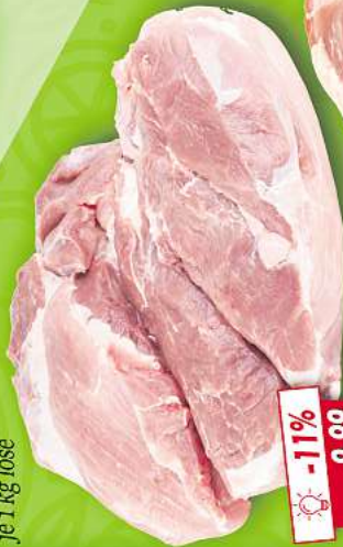
Putenoberkeule ohne Haut und Knochen je 1 kg lose