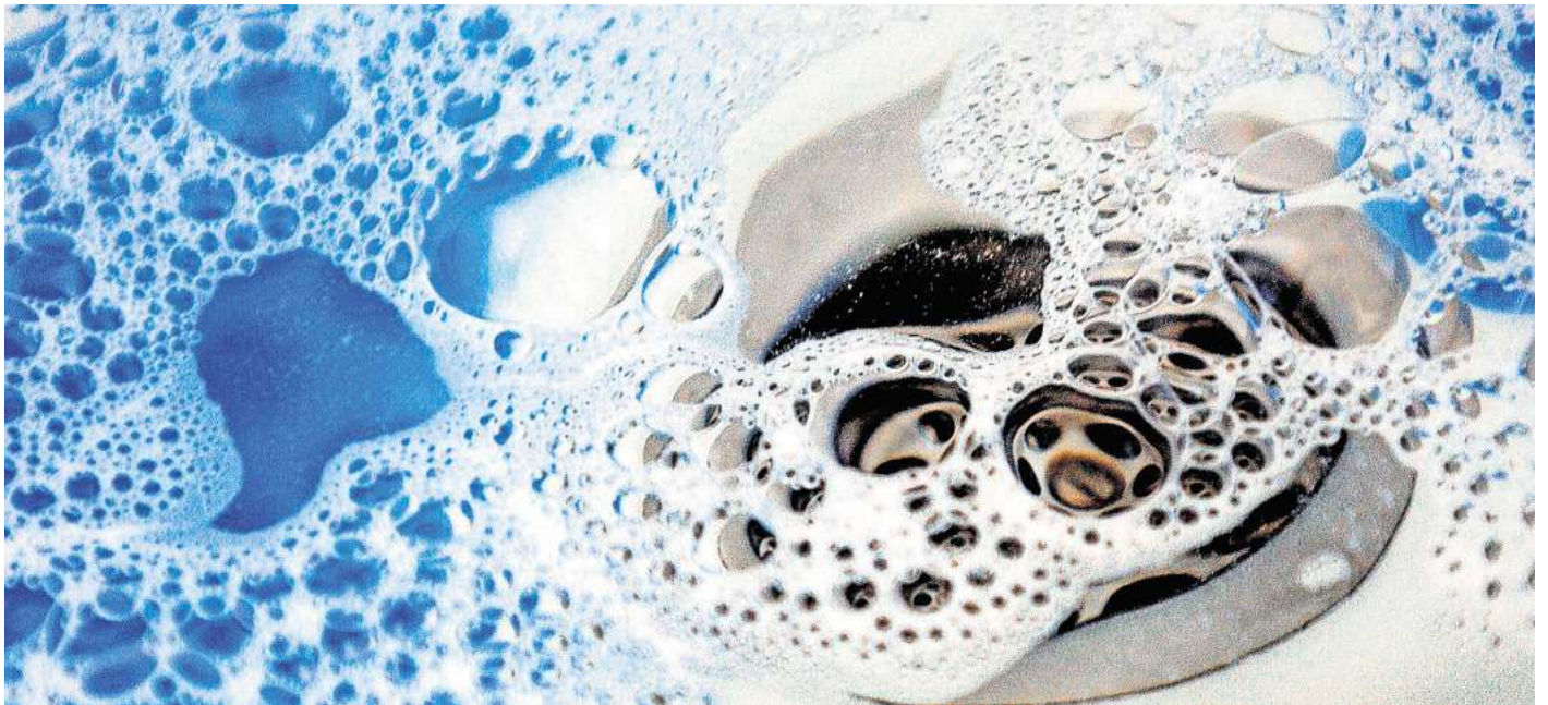
Hausmittel wie Natron, Essig und heißes Wasser helfen, leichte Verstopfungen im Abfluss zu beseitigen und sind eine umweltfreundliche Alternative zu chemischen Reinigern.

wöchentlich kochendes Wasser in die Abflüsse von Bad und Küche zu kippen. Dies hilft, Fett- und Seifenreste zu lösen und wegzuspülen. (DPA)