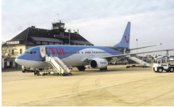
Ab Braunschweig direkt nach Bella Italia und zu anderen Zielen: exklusiv mit momento