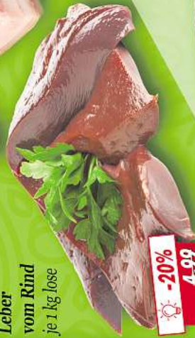
Leber vom Rind je 1 kg lose