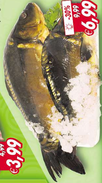
Spiegelkarpfen ausgenommen je 1 kg lose