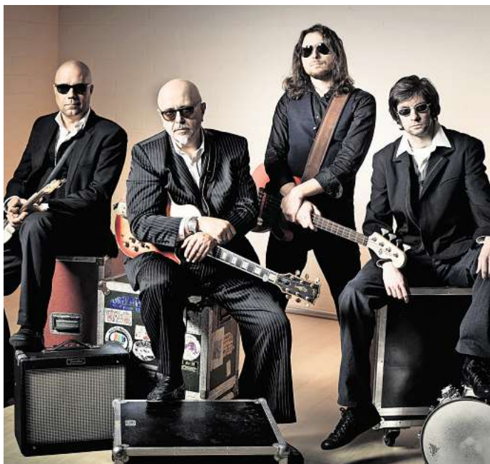
Authentischer, handgemachter Blues: Die legendäre Blues Company ist wieder zu Gast im Gifhorner KultBahnhof.

Der Auftritt im KultBahnhof verspricht einen intensiven Konzertabend in besonderer Club-Atmosphäre. Einlass ist ab 16 Uhr. Tickets gibt es für 32,04 Euro unter www.kultbahnhof-gifhorn.de/veranstaltungen , bei Famila und allen bekannten Vorverkaufsstellen. Restkarten sind an der Abendkasse erhältlich.