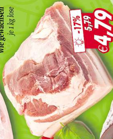
Schweinebauch wie gewachsen je 1 kg lose