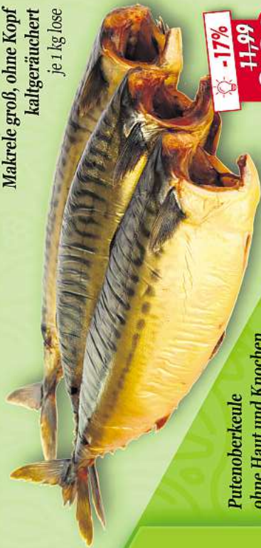
Makrele groß, ohne Kopf kaltgeräuchert je 1 kg lose