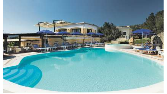
Vieffältige Hotelangebote mit Flair, wie hier das 4* Myo Hotel Stelle Marine auf Sardinien, sind in Italien und allen Zielen buchbar.

die Wiege der Christenheit und die wohl kulturell bedeutendste Stadt Rom (sogar über Ostern) mit dem mondänen römischen Lebensstil. Ein echtes Naturwunder sind auch die Liparischen Inseln mit dem bekannten Stromboli. Italien bietet unglaubliche Erlebnisse und ein angenehmes Klima.