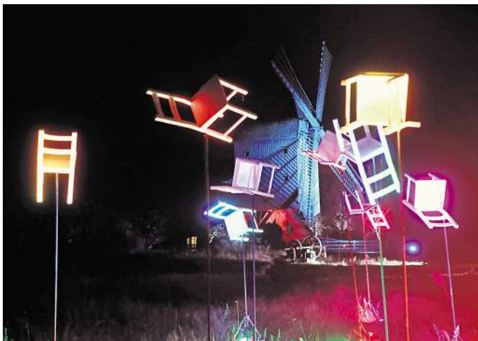
18.000 Besucher im Vorjahr: Die zweite Auflage der Brawo Mühlenlichter im Gifhorer Mühlenmuseum soll noch spektakulärer werden.

Die Volksbank Brawo lässt sich vom Insolvenzverfahren der V&T Mühlenmuseum GmbH nicht beirren: „Die Brawo Mühlenlichter werden wie geplant im angesprochenen Zeitraum stattfinden“, so Volksbank-Sprecher