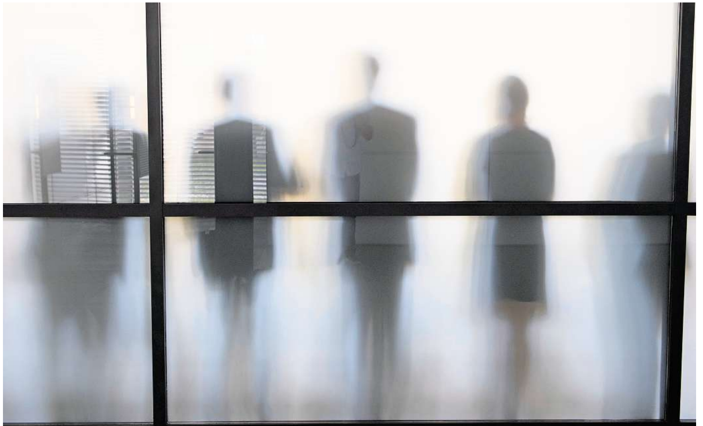
Kleine Notlügen im Job sind alltäglich: Oft geht es darum, sich selbst oder andere zu schützen.

Besonders Führungskräften kommt hier eine besondere Rolle zu. Dem Kommunikationsberater und Buch-Autor Branko Woischwill zufolge gilt: „Je größer die Verantwortung und je mehr Macht, desto weniger Spielraum gibt es.“ Führung