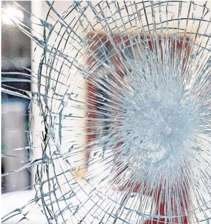
Kleiner Unfall mit einer Glasscheibe? Die private Haftpflichtversicherung deckt Personen-, Sach- und Vermögensschäden ab.