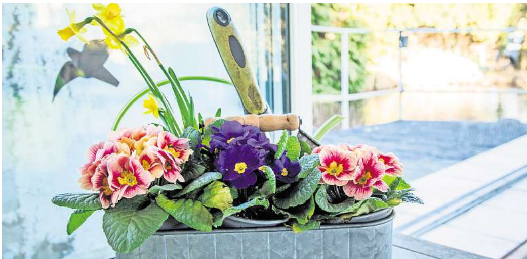
Schutz für Frühjahrsblüher: Primeln und andere Frühblüher aus dem Gewächshaus brauchen Schutz vor Frost, zum Beispiel auf der Terrasse.

Doch das könnte sich bald ändern. Nach Angaben des Deutschen Wetterdienstes sollen am Wochenende die frostigen Nächte vorerst enden. Die Höchsttemperaturen steigen an und erreichen teilweise sogar zweistellige Plusgrade. Damit stellt sich langsam ein vorfrühlinghaftes Gefühl ein.