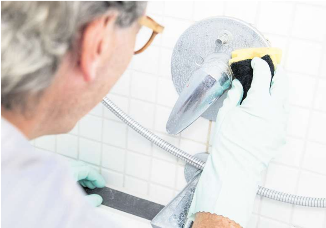
Kalk entfernen leicht gemacht: Essig und Zitronensaft sind umweltfreundliche Alternativen zu chemischen Reinigern.

Den Abfluss können Sie laut BUND übrigens auch mit ko-