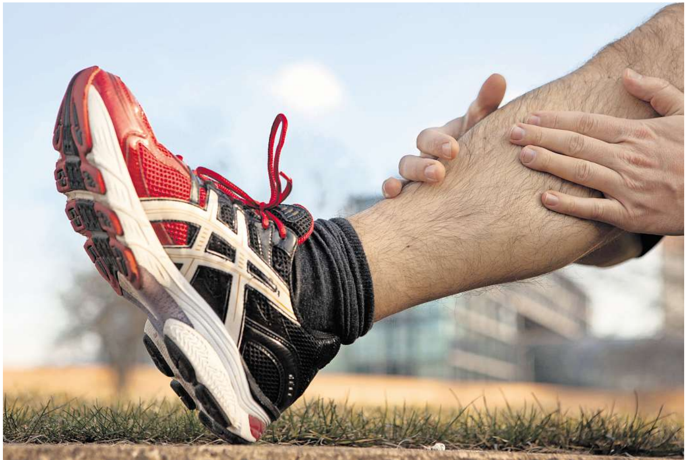
Aua, Wadenkrampf! Vorsichtiges Massieren und Dehnen kann dann erste Linderung bringen.

Krämpfe sind nach Sturms Worten eine Überlastung des Muskels, bei der viele Faktoren eine Rolle spielen. Was dagegen fast immer helfe: Dehnung. Sturm sagt: „Der Muskel neigt viel weniger zum Krampfen, wenn er ge-