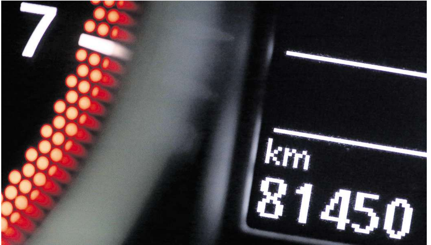
Manipulierte Tachostände sind keine Seltenheit: Bis zu ein Drittel der Gebrauchtwagen könnten nach Polizeizahlen betroffen sein.