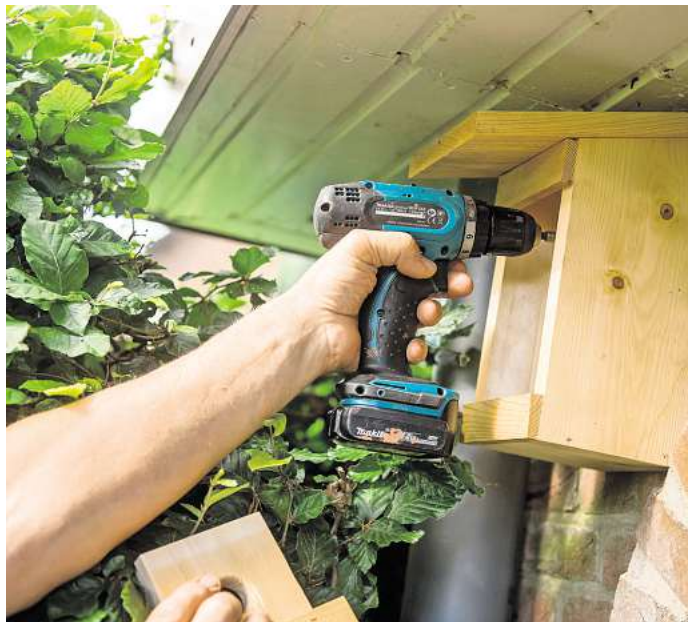
Regen? Kein Problem! Unter dem Dachvorsprung bleibt der Kasten trocken.

Halboffene Nistkästen eignen sich besonders für Arten, die ihre Nester gern in Nischen oder unter Vorsprüngen bauen. Zu