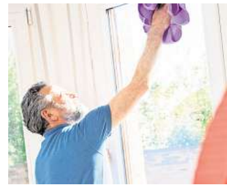
Die meisten Unfälle passieren zu Hause: FOTO: CHRISTIN KLOSE/DPA-MAG

Beim Putzen gilt es auch darauf zu achten, rutschfeste Schuhe zu tragen. Stolperfallen wie Eimer oder Kabel räumt man am besten direkt aus dem Weg. Auf nas-