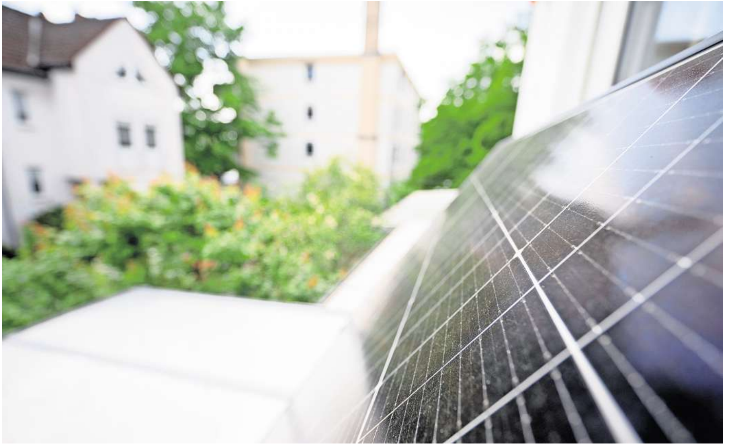
Staub, Pollen, Moos: Damit das Balkonkraftwerk auch volle Leistung bringen kann, braucht es gelegentlich eine Reinigung.

Bei flexiblen Modulen mit Kunststoffoberfläche empfiehlt Zukunft Altbau nur mit einem weichen Tuch zu arbeiten. Auf Metallschwämme sollte man ohnehin verzichten: Sie können die Oberfläche zerkratzen. Die Folge: ein geringerer Stromertrag des Balkonkraftwerks. Auch von