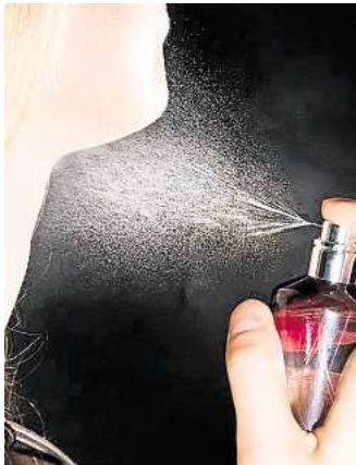
"Ich war auch naiv": Ein 24-Jähriger verkaufte ein gefaktes Marken-Parfüm.

Gifhorn. Mehr als 200 Kilometer reiste ein 24-Jähriger aus Nordrhein-Westfalen an, um erst einmal ausgiebig seine Befindlichkeiten im Gerichtssaal in Gifhorn los zu werden. Die Anreize wert war ihm Folgendes: Das Amtsgericht hatte ihm einen Strafbefehl in Höhe von insgesamt 750 Euro zukommen lassen, weil er einem Gifhorer ein Parfüm verkauft hatte, das sich jedoch als Produktfälschung erwiesen hatte. Statt Marken-Ware hatte er für eine Billig-Variante 180 Euro kassiert.