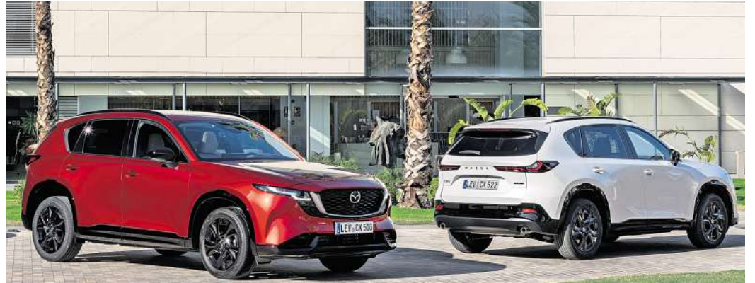
Mehr Platz und Komfort: Der neue Mazda CX-5 bietet mehr Beinfreiheit und einen größeren Kofferraum mit bis zu 2.019 Litern Volumen.

Als einzigen Motor gibt es einen auf 2,5 Liter vergrößerten Vierzylinder mit nun 104 kW/141 PS und Front- oder Allradantrieb, den ein Mildhybrid und eine Zylinder-Abschaltung besonders effizient machen soll. So ist er zwar bis zu 195 km/h schnell, soll aber im Zusammenspiel mit der serienmäßigen ebenfalls überarbeiteten Sechsstufen-Automatik aber nur 7,3 Liter verbrauchen (CO 2 -Ausstoß 157 g/km).