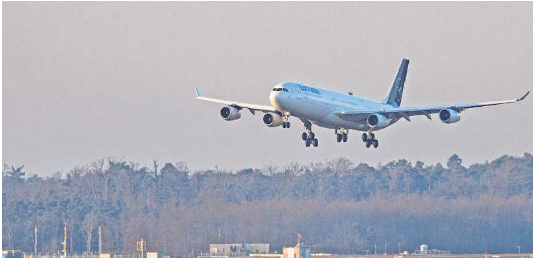
Rückholaktion: Für Evakuierungsflüge erhebt das Auswärtige Amt einen Kostenbeitrag, der sich meist am Preis eines Economy-Linienflugs orientiert.