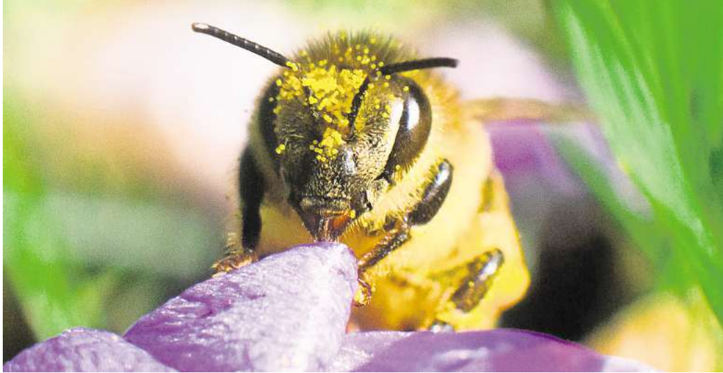
Frühe Tankstelle: Krokusse versorgen Bienen schon am Frühlingsanfang mit Pollen und Nektar.