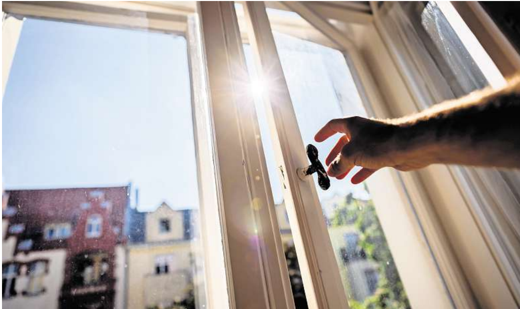
Längeres Lüften im Frühling: Die feuchtere Luft erfordert längere Lüftungszeiten, um Schimmelbildung vorzubeugen.

Das eigene Lüftverhalten sollte man aber durchaus an die Jahreszeit anpassen – und im Frühjahr etwa länger lüften als im Winter, um etwa Schimmel vorzubeugen. Der DVFG empfiehlt im Frühling, wenn die Luft mehr Feuchtigkeit enthält als im Win-