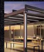
Terrassenüberdachungen Glasoasen Markisen