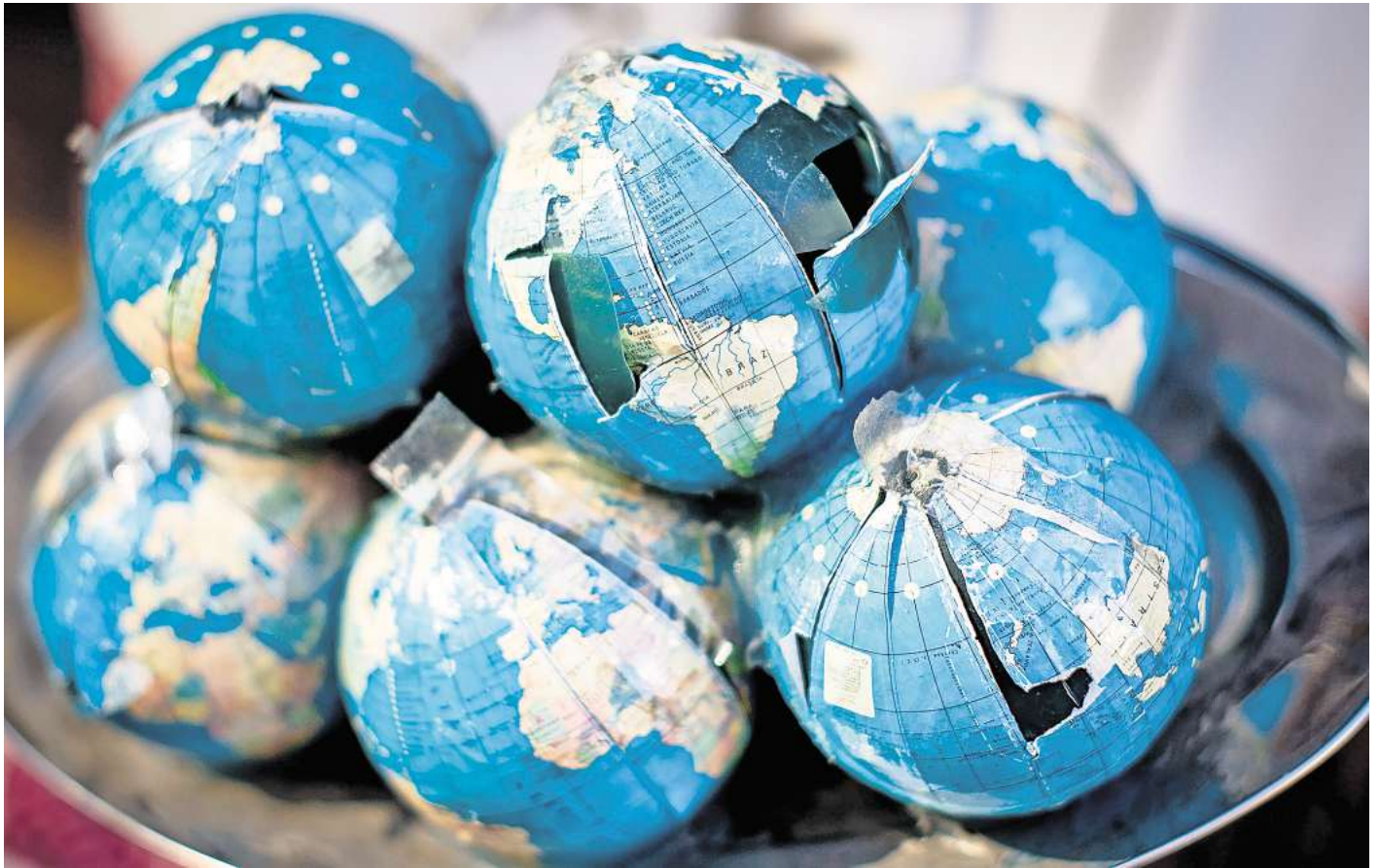
Keine Leistung bei Kriegshandlungen: Reiserücktrittversicherungen zahlen in der Regel nicht bei Abbruch oder Rücktritt aufgrund von Kriegsgefahr.