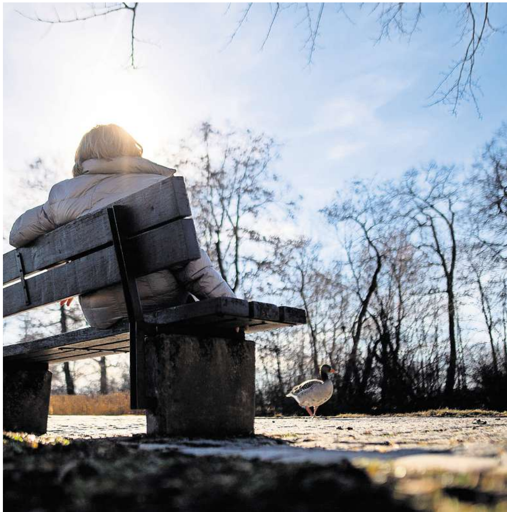
Frühlingssonne nicht unterschätzen: Auch bei kühlen Temperaturen kann die UV-Strahlung stark sein und Schutz erfordern.

Die Sonnencreme sollte dabei sowohl vor UV-A- als auch vor UV-B-Strahlung schützen und einen ausreichend hohen Lichtschutzfaktor mitbringen. Das