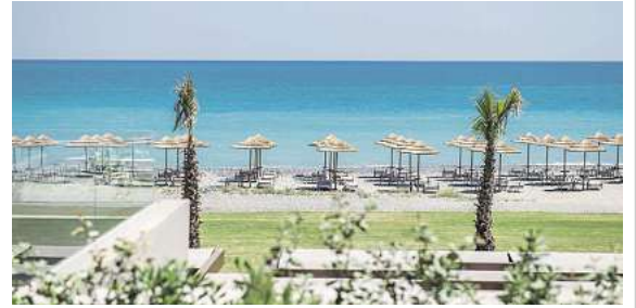
Außergewöhnliche Hotellebnisse, wie hier das 5,5* Euphoria Resort auf Kreta, stehen in allen Zielen zur Auswahl

Wer spontan noch fliegen möchte: In ausgewählten Zielen gibt es