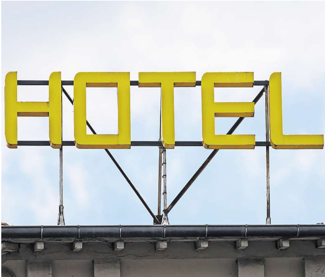
Anfrage ist nicht gleich Angebot: Hotels müssen zwischen unverbindlichen Kapazitätsanfragen und rechtlich bindenden Buchungsangeboten unterscheiden.