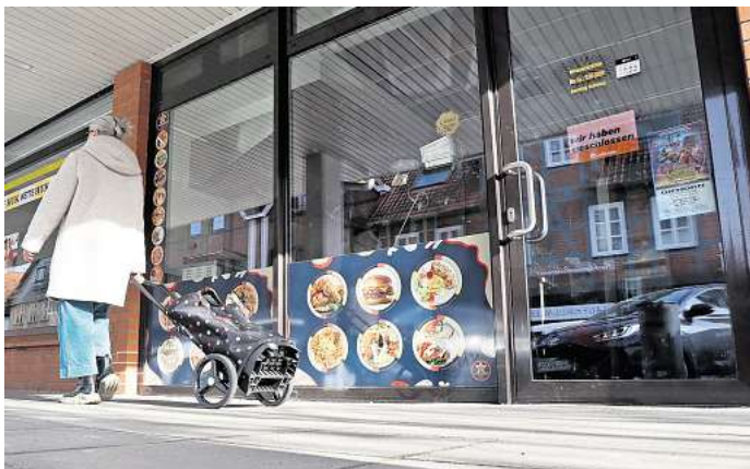
Wegen eines Wasserschadens musste das Stern Bistro am Cardenap schon wenige Wochen nach der Eröffnung wieder schließen.

Die Gebäudeversicherung wurde laut Moritz involviert und eine Begehung durch den beauftragten Sachverständigen zur