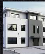
Fenster & Rollläden Schiebeanlagen Falthanlagen

V. Gloger Direktförderung ohne komplizierte Antragstellung auf alle Produkte