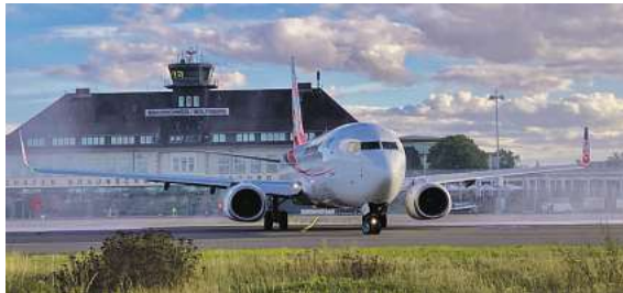
Am Flughafen Braunschweig Wolfsburg startet die Reise in den Süden Europas – den Sommer noch ein Stück verlängern, auch in den Herbstferien.

der kostenfreien (aus dem dt. Festnetz) Buchungshotline Tel. 0800 / 38 300 38 (Mo-Fr 9-18 Uhr, Sa 9-13 Uhr), im FIRST Reisebüro Schmidt sowie weiteren Reisebüros oder unter www.fliegen-ab-braunschweig.de