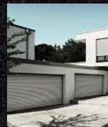
Garagentore Deckenlifftore Kastenrolltore