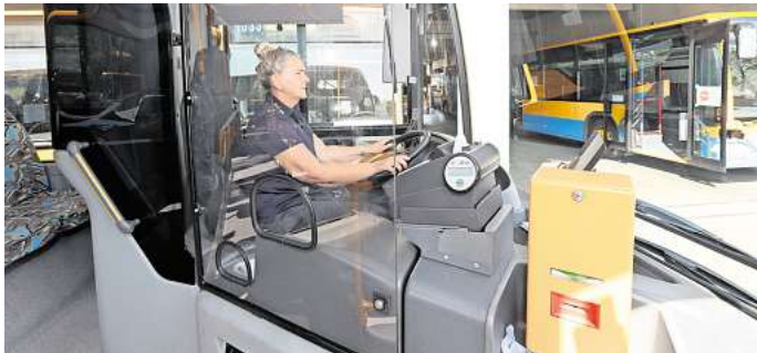
Herausforderungen für den Nahverkehr.