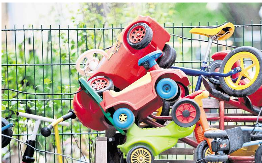
Heute leider geschlossen: Im Kitaalltag müssen Eltern oft improvisieren.

Sollte die Kita unerwartet und kurzfristig schließen, muss eine schnelle Lösung her. Optionen sind neben spontanem Urlaub unter anderem der Abbau von