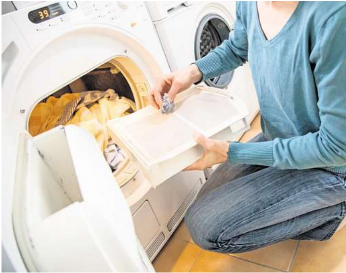
Flusen entfernen für Effizienz: Verstopfte Flusensiebe verlängern die Trockenzeit und erhöhen die Stromkosten und sollten am besten nach jedem Trockengang gereinigt werden.