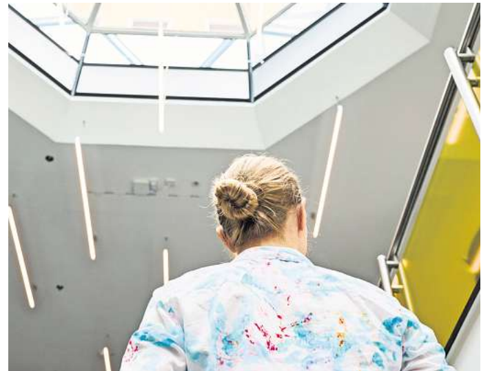
Unsicherheit begegnen: Der Gedanke an einen Jobwechsel kann Angst machen, doch das bewusste Konfrontieren von Ängsten bringt oft mehr Klarheit.

Wer seine Befürchtungen kennt, kann ihnen begegnen. Beispiel: Hat man etwa die Sorge, dass im neuen Job eine unangenehme Arbeitsatmosphäre herrscht, kann man diese früh-