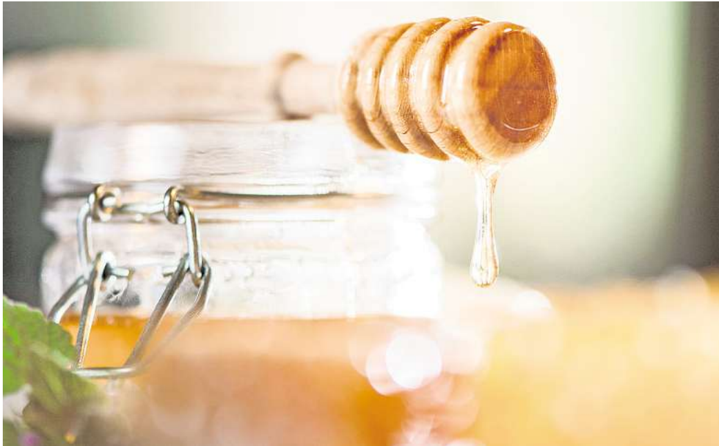
Typisch Akazienhonig: Der hohe Fructoseanteil im Akazienhonig sorgt für seine langanhaltende flüssige Konsistenz und besondere Süße.

Akazienhonig hat laut Hol-Hausen noch eine Besonderheit. Anders als der Name ver-