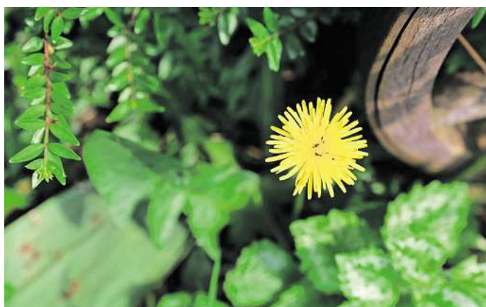
Unterschätzte Wildpflanze: Löwenzahn wird oft als Unkraut verkannt, ist jedoch ein wertvoller Beitrag für die Natur und ein Hingucker im Garten.

Für früh fliegende Wildbienen wie Sandbienen, Mauerbienen oder Hummeln ist Löwenzahn oft die erste Nahrungsquelle nach dem Winter. Sein proteinreicher Pollen sorgt dafür, dass die Larven gesund heranwachsen - die Löwenzahn-