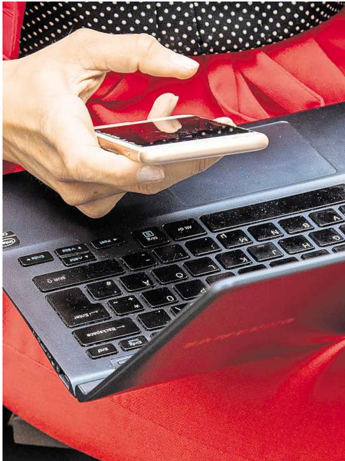
Ungewöhnliche Aktivitäten im Postfach: Auffällige Anmeldeversuche oder fremde Nachrichten deuten auf einen möglichen Hackerangriff hin.