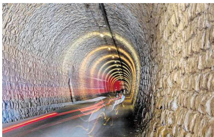
Der Bahntrassenweg führt auch über Brücken und durch dunkle Tunnel wie hier im slowenischen Strunjan.

Trst (Triest) – Rabujez – Škofije – Bertoki – Koper – Izola – Strunjan – Portorož – Sečovlje – Markovac – Kaldanija – Buje – Grožnjan – Livade – Motovun – Vižinada – Višnjan – Nova vas – Poreč (Parenzo)