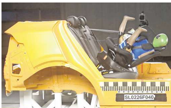
Sicherheitsrisiko im Crashtest: Acht Kindersitze zeigten gravierende Mängel und versagten im Frontalaufprall.

Sieben der Modelle sind baugleiche Kindersitze des Reecle 360 (ZA 10 i-Size). Vor diesem Modell warnte die Stiftung Warentest bereits im Oktober 2025. Die Sitzschale riss in rückwärtsgerichteter Position beim simulierten Frontalaufprall von ihrer Basis und schleuderte mitsamt Testdummy durch das Testfahrzeug.