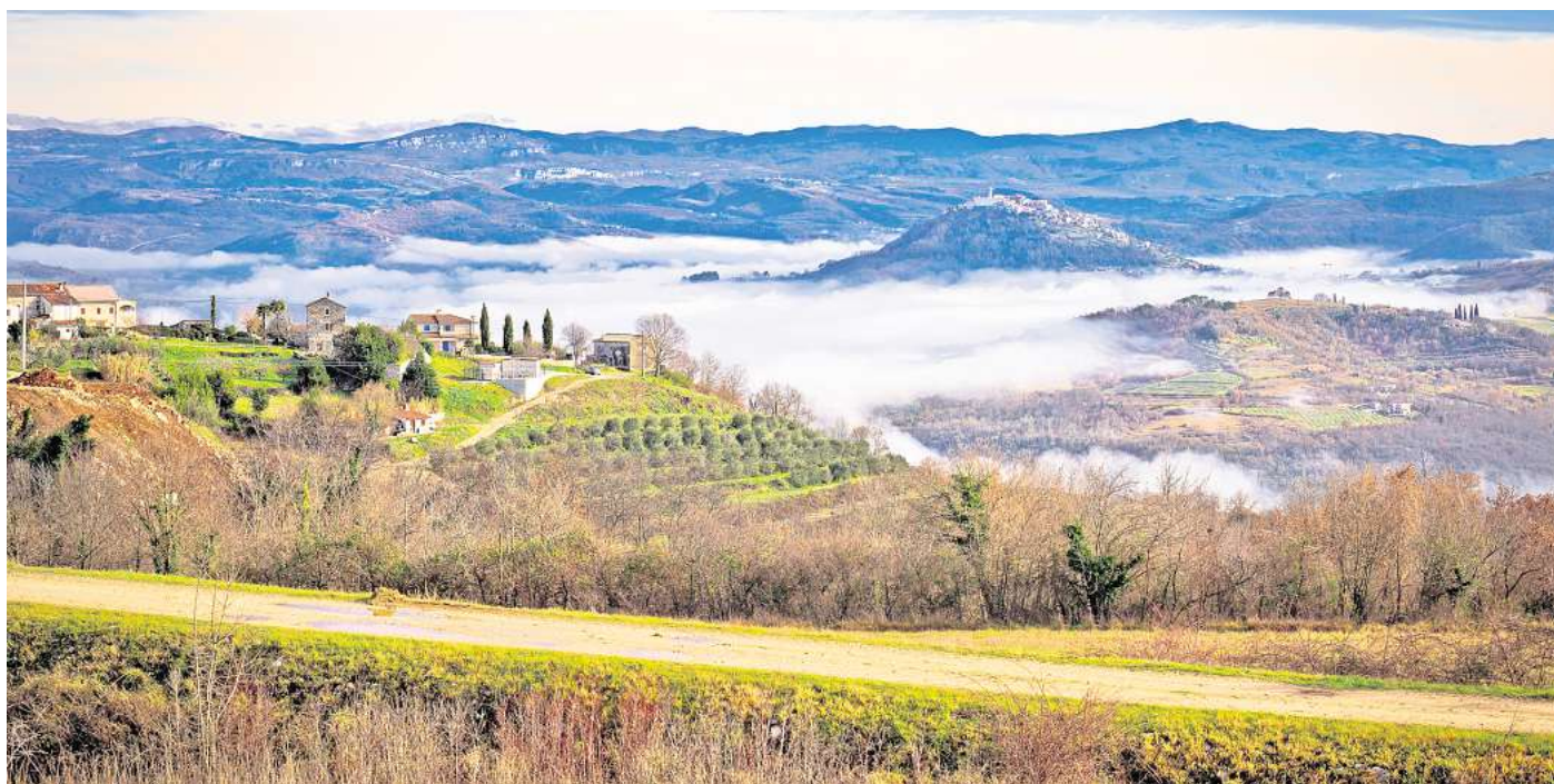
Blick auf die Orte Motovun und Vizinada und die Naturidylle.

Gestartet wird im schönen Triest, das als entspannte Alternative zu Venedig gehandelt wird und mit seiner beeindruckenden Architektur und der lebhaften Kaffeekultur zu einem