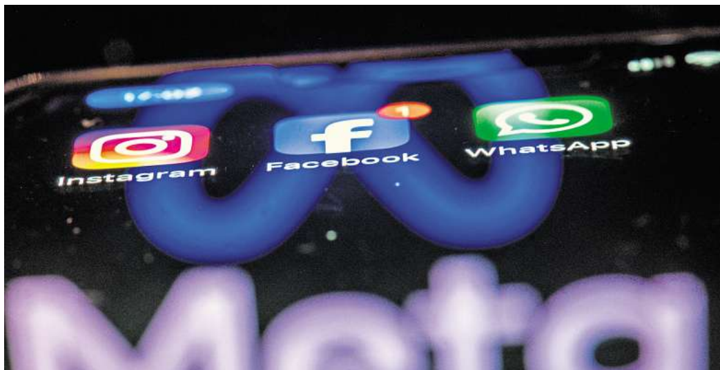
Grenzüberschreitende Datenflüsse sind für den Betrieb global konzipierter sozialer Netzwerke technisch erforderlich und datenschutzrechtlich zulässig, sagt das Landgericht Ellwangen.

In dem Fall hatte ein Nutzer von Facebook und Instagram gegen die irische Tochtergesellschaft des Meta-Konzerns geklagt. Er verlangte, die Übermittlung sei-