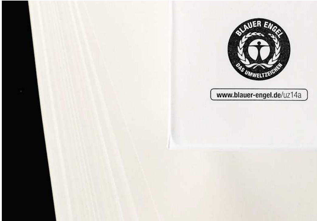
An ihm kann man sich beim Papierkauf getrost orientieren: Der «Blauer Engel» ist eine bekannte Kennzeichnung unter anderem für Recyclingpapier.

Ein konkretes Beispiel veranschaulicht die Auswirkungen: Bei einem Paket mit 500 Blatt