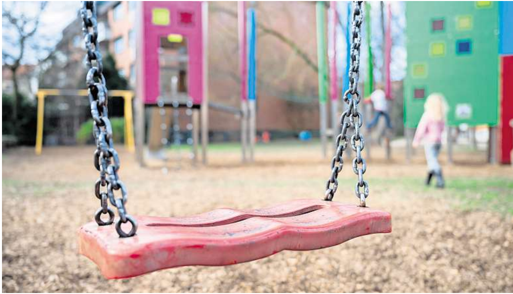
Spielplatz-Check: Nach der Winterpause sollten Eltern den Zustand von Sandflächen und Spielgeräten prüfen, um mögliche Gefahren zu vermeiden.