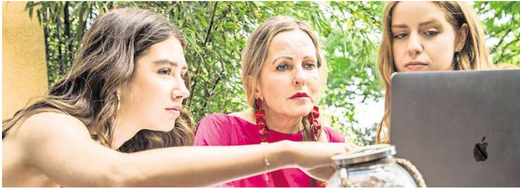
Flex-Tarife erlauben eine Absage oder Umbuchung ohne Angabe von Gründen bis zu einem gewissen Datum vor der Abreise – und: ohne die sonst anfallenden Stornokosten.

In unsicheren Zeiten wünschen sich viele Reisende mehr Sicherheit und die Möglichkeit, ihre Reise bei Bedarf anzupassen, so Linnhoff. Reiseveranstalter beobachten das ebenfalls: Seit Beginn des Iran-Kriegs sei die Nachfrage nach flexiblen Buchungsoptionen gestiegen, heißt