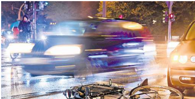
Schwerpunkt der Gifhorer Polizei: Weil Senioren besonders häufig in Fahrradunfälle verwickelt sind, startet die Polizei eine Aufklärungskampagne.

Hintergrund: Der Anteil der Menschen, die älter als 55 Jahre sind, war im vergangenen Jahr sowohl bei den Unfalltoten insgesamt als auch bei den Schwerverletzten, die mit einem Rad oder Pedelec in einen Unfall verwickelt waren, überdurchschnittlich hoch. Diese Entwicklung ist besonders besorgniserregend vor dem Hintergrund des positiven Trends, dass die Unfallzahlen im Kreis Gifhorn insgesamt zurückgehen. Ereignis-