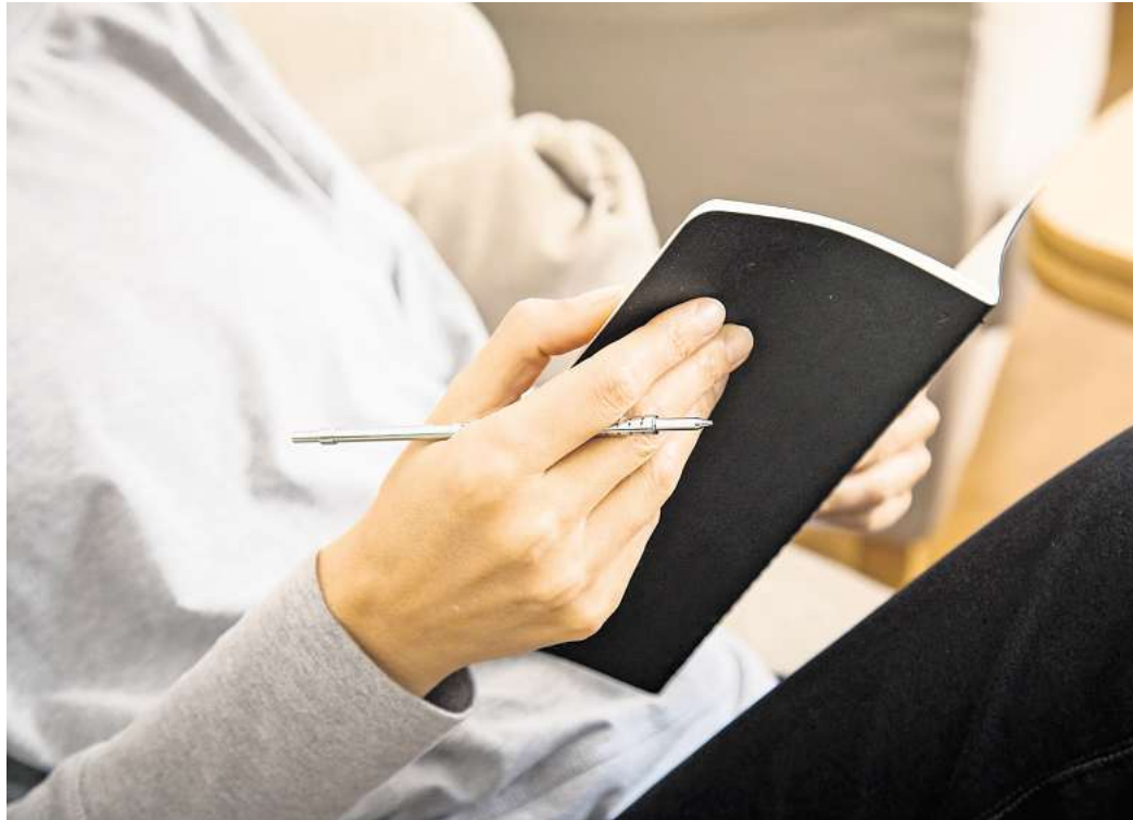
Journaling ist eine beliebte Mental-Health-Praxis - es gibt aber viele Mythen dazu.

Auch das ist falsch. Ein Tagebucheintrag muss kein Meisterwerk werden, wir dürfen auch banales festhalten. Fehlerhafte Grammatik und Rechtschreibung spielen keine Rolle.