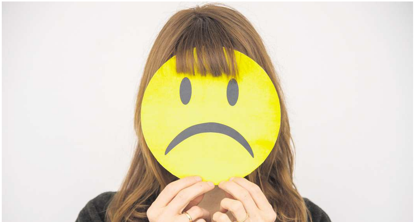
Emotionen zulassen: Drei Minuten Jammern geben Raum, um Ärger auszuleben, danach kann der Blick wieder nach vorn gehen.

Wem das zu albern ist, dem rät Glück: „Zoomen Sie kurz aus der Situation und schauen Sie von außen auf das, was ist.“ Betrachten Sie sich selbst wie eine