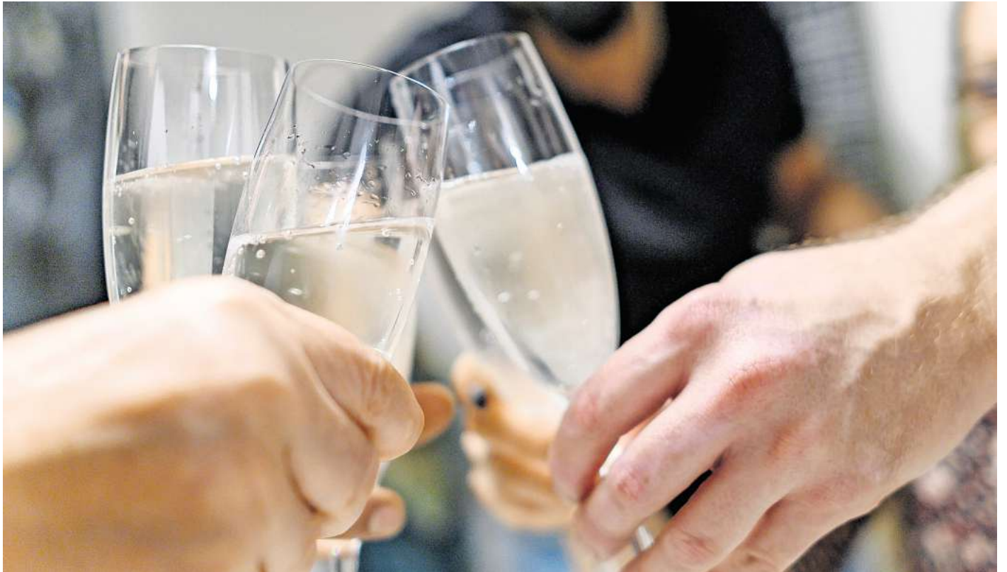
Ein letztes Anstoßen mit den Kollegen: Firmenabschiede bleiben unter bestimmten Voraussetzungen steuerfrei.

Der BFH widersprach dieser Sichtweise. Nach Auffassung der Richter kommt es nicht allein auf die Höhe der Kosten an. Entscheidend ist vielmehr der Charakter der Veranstaltung. Wenn der Arbeitgeber Gastge-