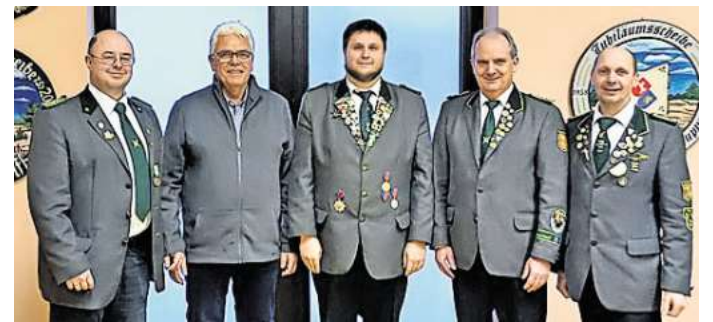
Jahreshauptversammlung: Der SV Isenbüttel-Gifhorn ist jetzt unter neuem Vorsitz.

Die Versammlung zeigte einmal mehr den starken Zusammenhalt innerhalb des SV Isenbüttel-Gifhorn. Mit dem neu aufgestellten Vorstand blickte der Verein geschlossen und motiviert auf die kommenden Monate, so hieß es abschließend.