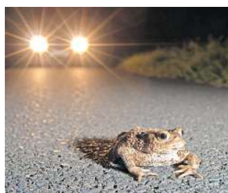
Die Wanderschaft geht wieder los: Amphibien überqueren auf dem Weg zu ihren Laichplätzen Straßen.

Eine weitere Aktivität der zukünftigen Arbeitsgemeinschaft könnte neben der Pflege bestehender Laichgewässer auch die Beratung bei der Anlage von naturnahen Gartenteichen sein. Wer helfen möchte, Krötenschutzzäune in Teichgut, Stüde, Warmbüttel, Abbesbüttel, Ummern, Bokendorf und Calberlah aufzubauen und zu betreuen oder anderweitig beim Amphibienschutz mitwirken möchte, meldet sich gerne per E-Mail an amphibienschutz@nabu-gifhorn.de oder unter Tel. (0 53 73) 43 61 während der Geschäftszeiten.