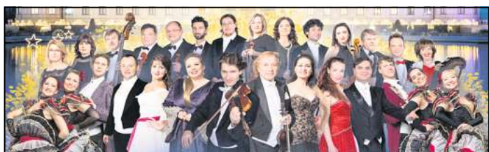
Mitglieder des Gala Sinfonie Orchesters Prag, Solisten und Ballett präsentieren unvergessliche Melodien der Strauß Familie

Das nächste Kapitel ist auch schon aufgeschlagen: Im August zieht FeSo an die Carl-Miele- Straße ins Gewerbegebiet Wester- feld in Gamsen. Der Geist der Tradition soll auch dort weiterle- ben. „Aber alles beim Alten belas- sen geht auch nicht“, so Jaensch. Ein Instagram-Auftritt für FeSo etwa steht noch auf seinem Wunschzettel. Zum Schluss möchte der 36-Jährige andere er- muntern, es ihm nachzumachen. „Regionale Firmen sind so wich- tig. Wenn ein Chef schlau ist, zieht er einen Mitarbeiter zu sei- nem Nachfolger heran – so wie es bei mir war.“