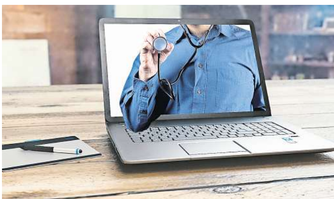
Telemedizin: Könnte das zum künftigen Konzept der ärztlichen Versorgung im Landkreis Gifhorn gehören?