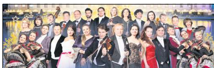
Mitglieder des Gala Sinfonie Orchesters Prag, Solisten und Ballett präsentieren unvergessliche Melodien der Strauß Familie