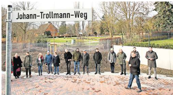
Würdiges Andenken: In Wilsche erfolgte die offizielle Namensgebung des Johann-Trollmann-Wegs.

Auch im Konzentrationslager Neuengamme bei Hamburg, in dem der in Hannover lebende Trollmann 1942 im Oktober interniert wurde, habe er alle Kämpfe gewonnen: Trotz schwerer Zwangsarbeit musste er Abend für Abend gegen SS-