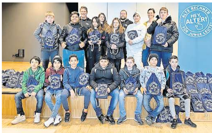
Für Homeschooling und Hausaufgaben: Insgesamt 70 Kindern der Oberschule Weyhausen spendierte der Verein „Hey, Alter!“ aus Braunschweig ein Tablet oder einen Laptop.