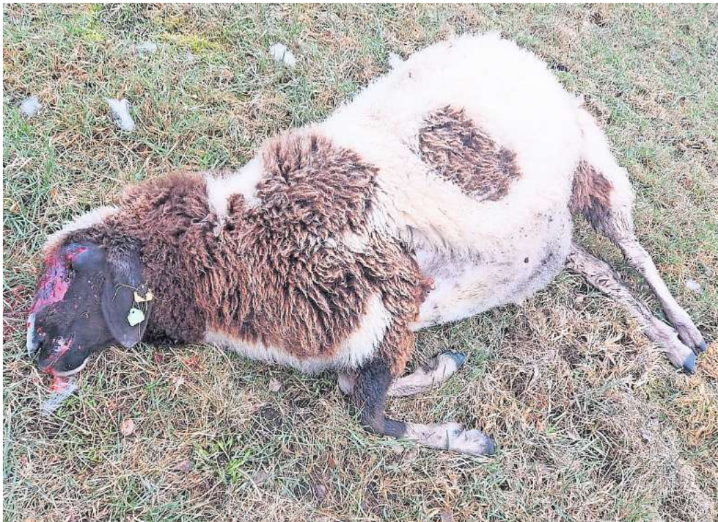
Eines von 13: Ein Wolf soll in Neudorf-Platendorf 13 tragende Schafe gerissen haben.

Sogenannte Rissgutachter der Landwirtschaftskammer hätten den Vorfall aufgenommen und auch die Zäune kontrolliert. Geschützt gewesen sei die Schafherde durch einen 1,05 Meter hohen mobilen Elektrozaun, be-