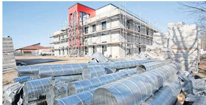
Neues Ärztehaus am I. Koppelweg in Gifhorn: Ende Juni sollen die Praxen darin ihren Betrieb aufnehmen.

„Wir hatten eine Kostenexplosion gehabt“, so Ehlers, der das Volumen bei 7 Millionen Euro sieht. Die moderne Technik spiele dabei eine Rolle. Doch: Was jetzt teuer sei, werde sich im Lauf