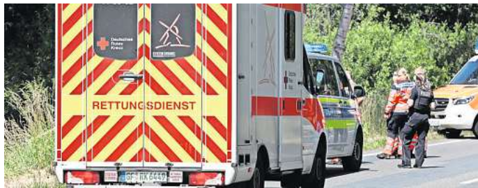
Ein Fall für die Notruf-Nummer 112: Bei Unfällen ebenso wie bei Verdacht auf Herzinfarkt oder Schlaganfall ist das die richtige Nummer.

Eine Telefonnummer, die für viele andere Fälle die richtige ist, ist die bundesweit einheitliche Nummer des ärztlichen Bereitschaftsdienstes unter der Nummer 116 117. „Die Elfen, die helfen“ ist der Slogan dieses Service-Angebots für alle Fälle, in denen es jemandem nicht gut geht, jemand nach Sprechstunden-Ende einen Arzt braucht oder auch auf der Suche nach einem Arzt oder Psychotherapeuten beziehungsweise einem freien Termin ist. Der Landkreis zählt in seiner Pressemitteilung einige Beispiele für solche Fälle auf, in denen die 116 117 die Nummer der Wahl ist: Bei leichteren Krankheitsbil-