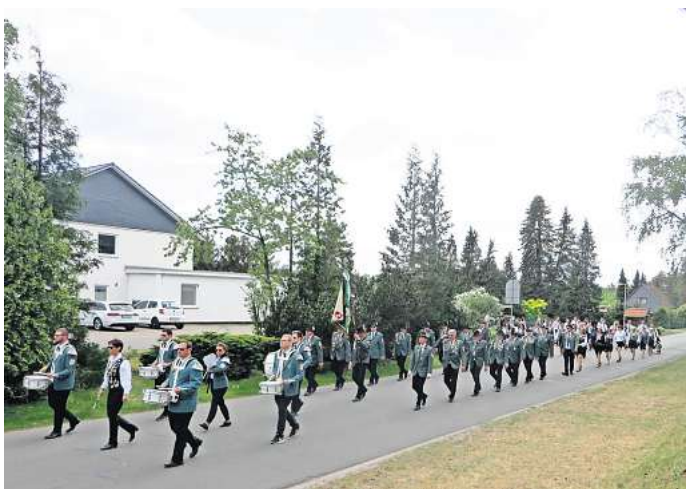
Am Fest-Sonntag wird der Festumzug durch den Ort marschieren.

11.00 Uhr: Antreten zum Abholen der Majestäten und Anbringen der Königsscheibe Jugendkönig/-in und Jungschützenkönig/-in 13.30 Uhr: Stechen: Damenkönigin und Schützenkönig