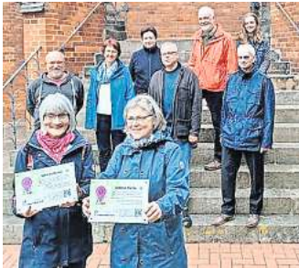
Erweitertes Tankorte-Angebot: Der evangelische Kirchenkreis lädt ein.

Saison 2023 startet am 1. Mai – Der Kirchenkreis erweitert das Angebot