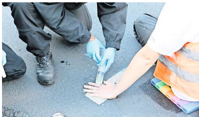
Ein Polizist versucht, mit einer Flüssigkeit die Hand eines Klima-Klebers vom Asphalt zu lösen.