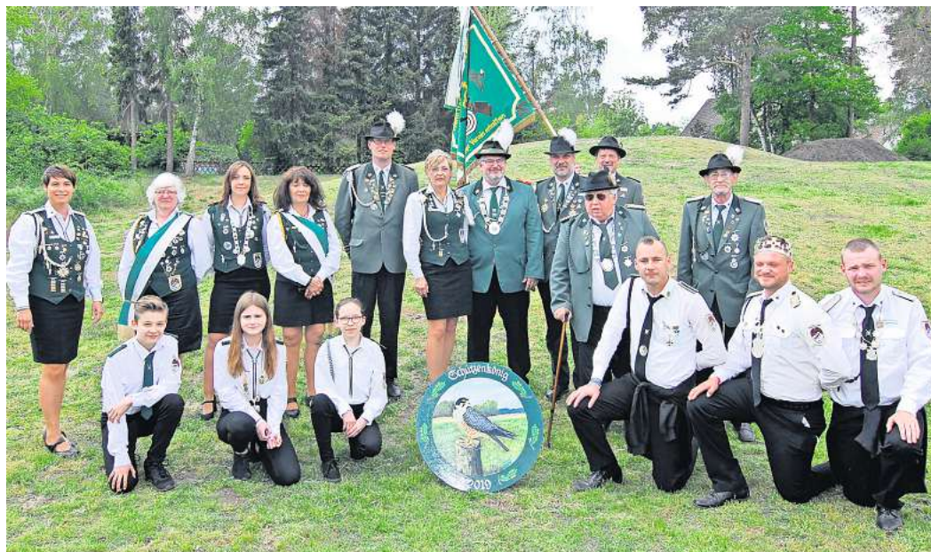
Seit 2019 im Amt: Die derzeit noch amtierenden Wagenhoffer Majestäten werden in diesem Jahr abgelöst.