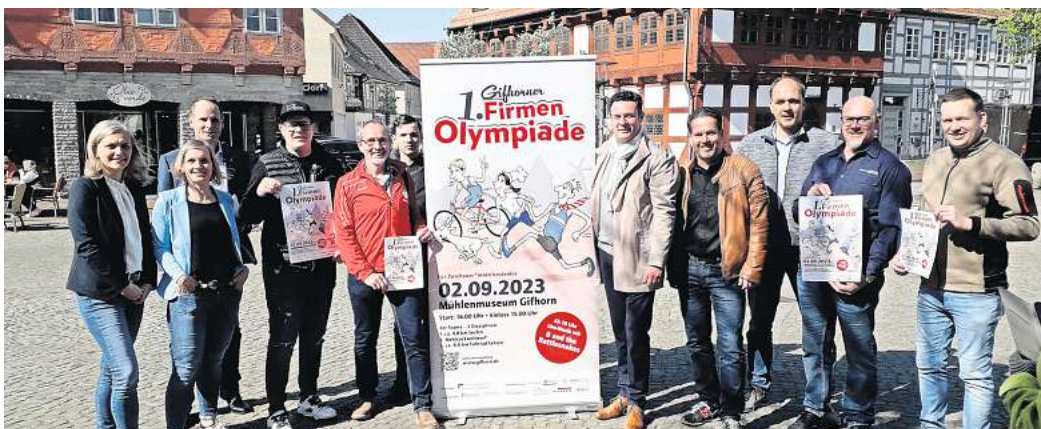
1. Gifhorer Firmen-Olympiade: Organisatoren und Sponsoren suchen jetzt mindestens 100 Dreier-teams für das sportliche Event am 2. September.

Gesucht werden für diese Firmen-Olympiade 100 Teams – es dürfen aber auch gerne mehr werden –, die aus je drei Mitgliedern bestehen. In einem Dreikampf treten die Teams am 2. September gegeneinander an. Jedes Teammitglied bewältigt dabei eine der drei Disziplinen: 4,8-Kilometer-Lauf, 9,5-Kilometer-Radfahrt und Mehlsackweitwurf. Anmeldungen sind möglich unter www.wista-gifhorn.de . Dort – und auf den Flyern und Plakaten im Stadtgebiet – gibt es