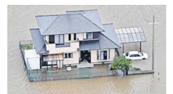
Probealarm im ganzen Landkreis Gifhorn: Im Ernstfall könnte auch ein Hochwasser die Alarmierung der Bevölkerung auslösen.

diosender einschalten, auf eventuelle Lautsprecherdurchsagen von Feuerwehr oder Polizei achten, die Notrufnummern 110 und 112 nur bei wirklichen Notfällen anrufen. Alle weiteren Informationen erhält die Bevölkerung anlassbezogen über die App NINA sowie über die lokalen Radiosender. Der kreisweite Probealarm wird jeweils am dritten Samstag im Januar und Juni durchgeführt.