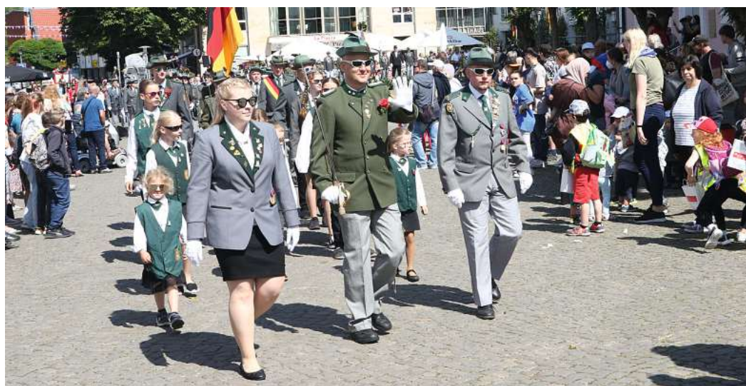
Die Schützen marschieren, die Zuschauer jubeln: Ein gewohntes Bild in Gifhorn, wenn hier Schützenfest gefeiert wird.