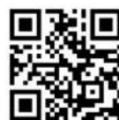
QR Holztechnik Film

Die Online-Anmeldung für das Schuljahr 2023/24 ist weiterhin möglich unter www.bbs2-gifhorn.de/Service