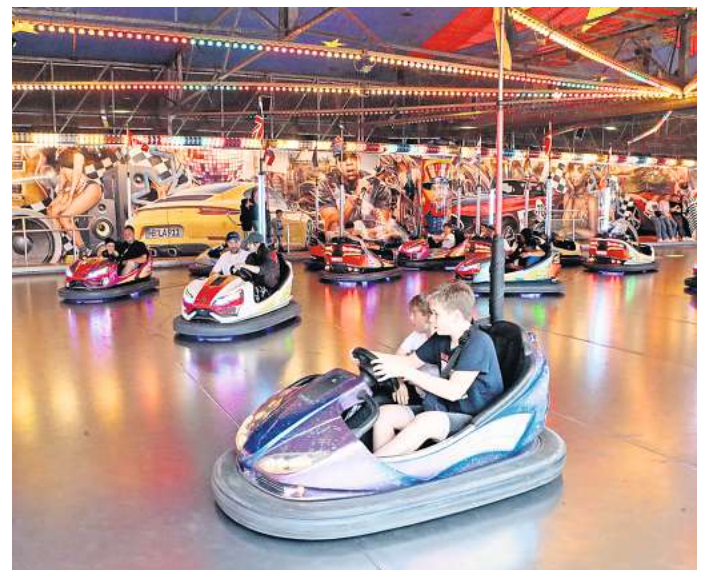
Gifhorn feiert Schützenfest: Der Rummel mit zahlreichen Fahrgeschäften und einem vielfältigen gastronomischen Angebot lockt vom 15. bis 18. Juni auf den Schützenplatz.

Die größtmögliche Barrierefreiheit möchte der „Top in“-Autoscooter aus Bremen bieten: So gibt es hier nicht nur Sitzplätze rundherum, sondern auch eine Auffahrrampe für Rollstühle und sogar drei Fahrzeuge, die per Handgasbedienung und somit von Menschen mit Gehbehinderungen über die XXL-Fahrfläche mit ihren über 350 Quadratmetern