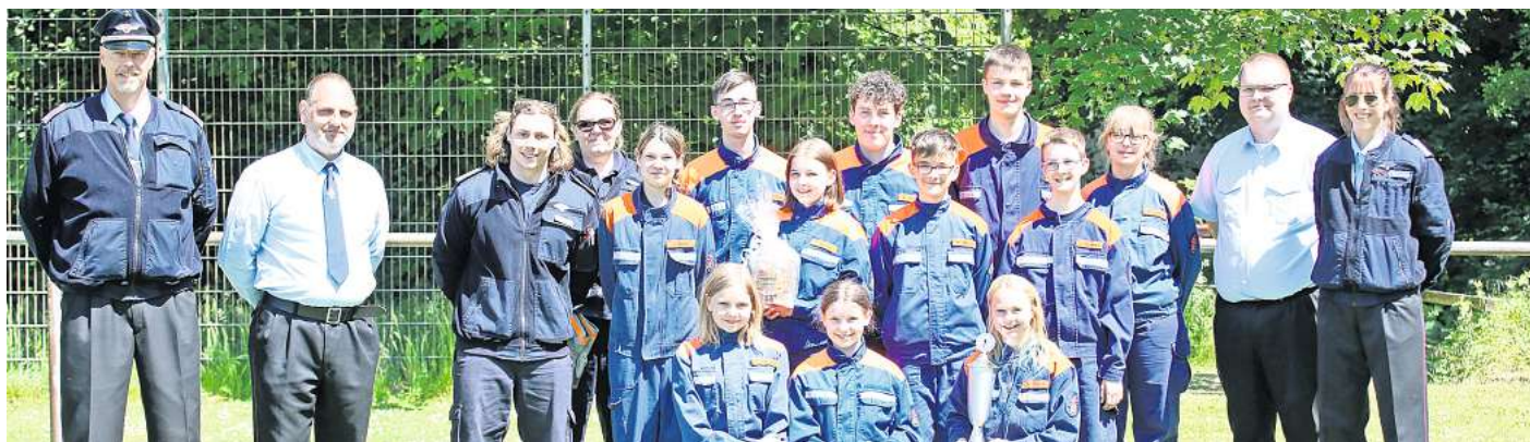
Feuerwehrwettkämpfe Boldecker Land: Strahlende Gesichter gab es bei der Siegerehrung für die Jugendwehren (Foto) und die Aktiven.

Die Jugendfeuerwehren begannen den Leistungsvergleich mit einem Staffellauf auf einer asphaltierten Strecke in Richtung Pumpstation. In diesem Teil des Leistungsvergleiches waren feuerwehrtechnische Elemente integriert. Die Teilnehmer mussten einen Schlauch rollen, ihre Bekleidung vervollständigen und eine Leine durch ein Ziel werfen. Im nachfolgenden dreiteiligen Löschangriff galt es, eine Wasserversorgung von