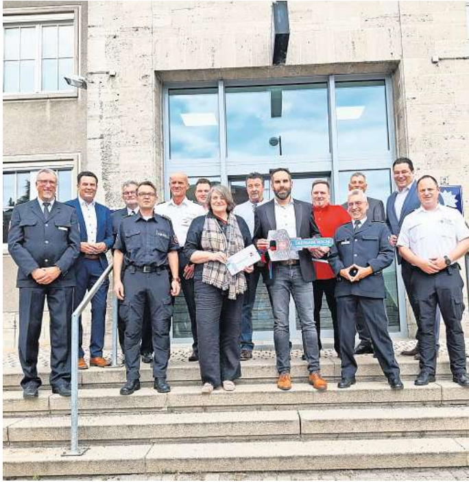
Frisch modernisiert: Nun ist auch der Trakt, in dem die Wache der Gifhorner Polizeiinspektion untergebracht ist, fertig.

Auch Landrat Tobias Heilmann lobte, dass der Wachbereich kaum wiederzuerkennen sei. In seiner Zeit als Landtagsab-