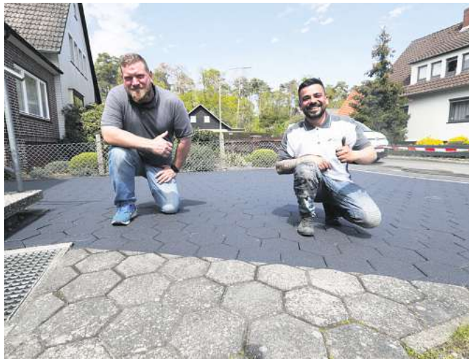
Eine mit dem ‚Steinfresh®‘-Verfahren sanierte Pflasterung. Das geniale Pflegesystem verhindert Flechten und Schwarzalgen.