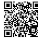
QR Farbtechnik Flyer