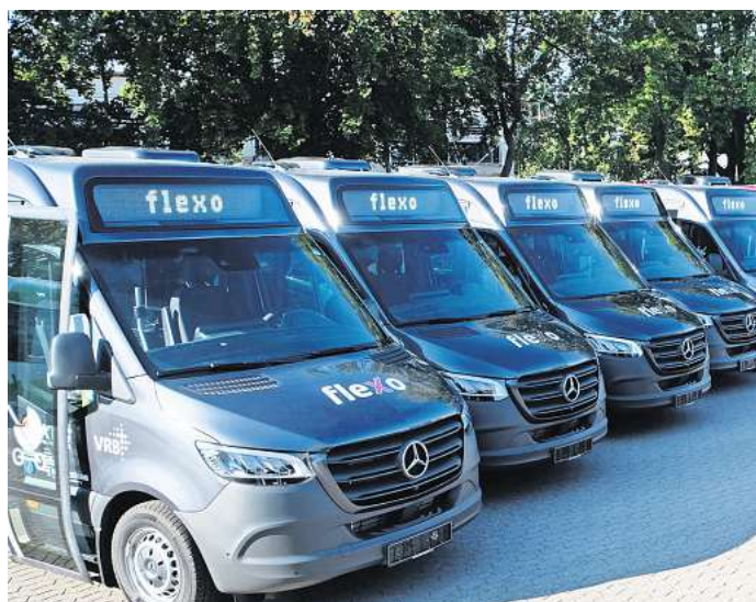
Nahtloser Übergang: Ab Mitte 2024 soll der Bürgerbus in Meinersen durch das Flexo-Angebot des Regionalverbands abgelöst werden.

die Fahrgäste im Linienverkehr von 7.45 bis 17.41 Uhr zwischen Hahnenhorn, Müden, Meinersen, Leiferde und Hillerse befördern. Für einige Teilstrecken ist ein Anruf bis 20 Minuten vor dem vorgesehenen Sonderhalt notwendig unter Tel. (0176) 92 20 32 14. Infos und Fahrplan unter www.buergerbus-meinersen.de .