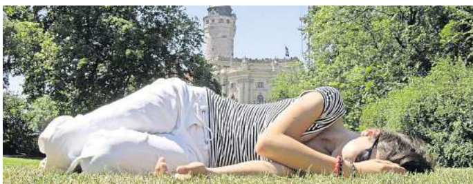
In südlichen Ländern gibt es sie schon, nun regen Amtsärzte sie auch für Deutschland an: die Siesta.

Derweil forderte das Vorstandsmitglied des Deutschen Gewerkschaftsbundes (DGB), Anja Piel, alle Arbeitgeber auf, während der Sommermonate re-