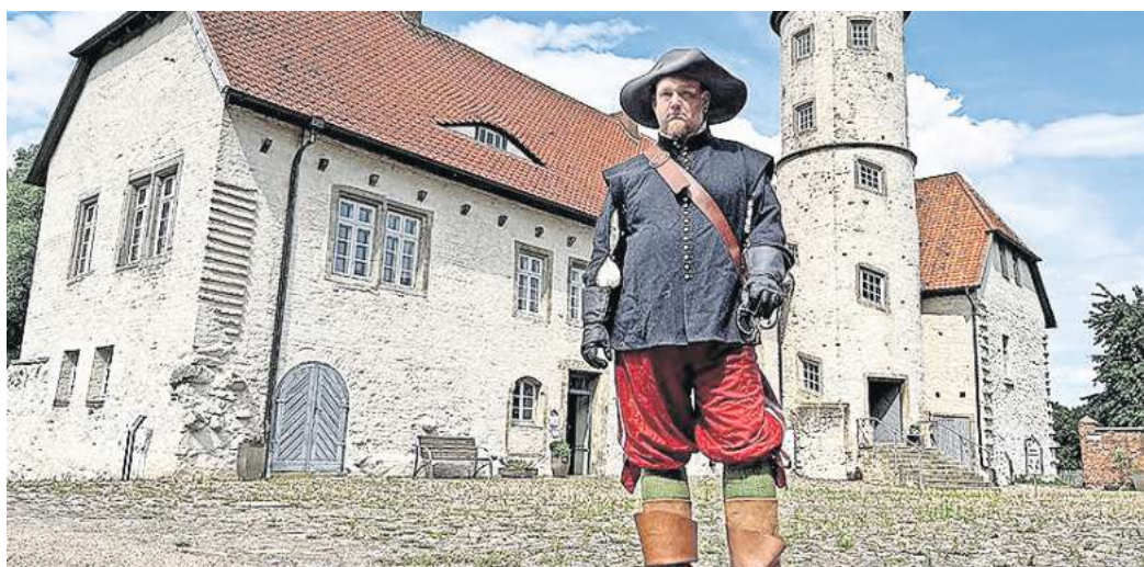
„Pulverdampf und Trommelschlag“: Die Burg Brome lädt ein zum bunten historischen Treiben.