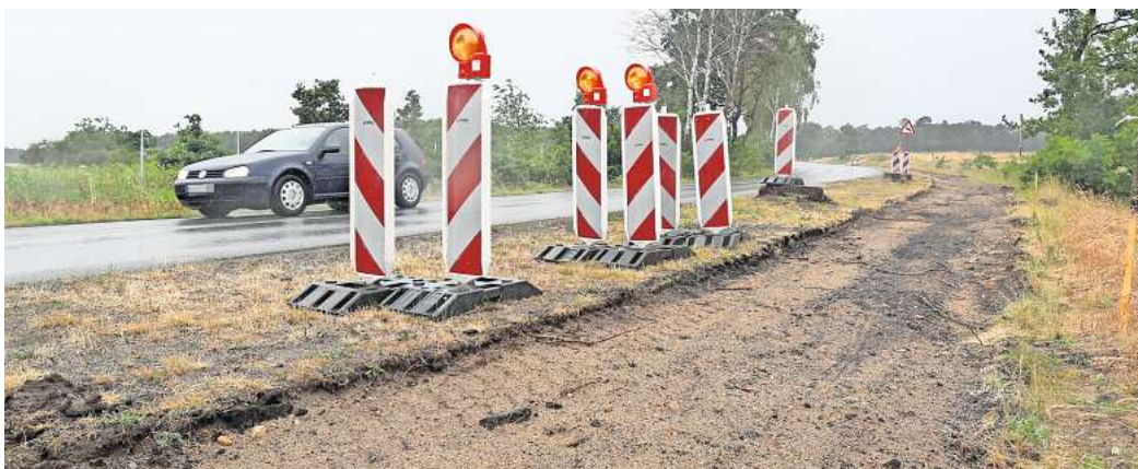
Radweg-Neubau zwischen BGS-Siedlung und Wilsche: Bis Ende September müssen sich alle Verkehrsteilnehmer hier noch gedulden.