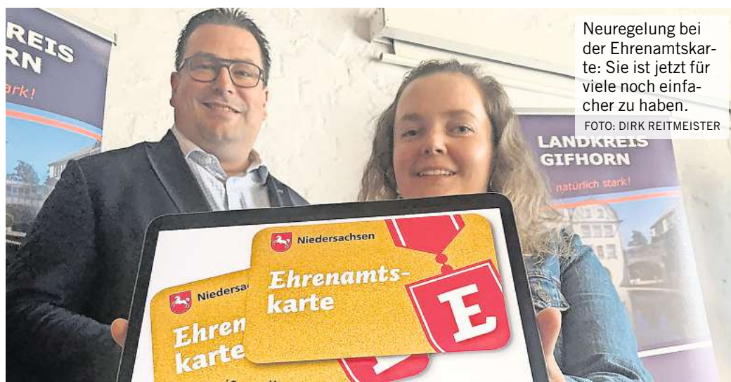
Neuregelung bei der Ehrenamtskarte: Sie ist jetzt für viele noch einfacher zu haben.

Die dritte Neuerung: Interessierte können die Ehrenamtskarte unter www.freiwilligenserver.de auf rein digitalem Weg beantragen, Vereine und Organisationen können für ihre Ehrenamtlichen die Ehrenamtskarte ebenfalls digital beantragen. Voraussetzung: Sie müssen sich registrieren. „Das funktioniert schon gut“, sagt Manske. Es habe in den vergangenen Wochen bereits einige Registrierungen gegeben. Die Möglichkeit, die Ehrenamtskarte auf dem alten Postweg zu beantragen – nach Eintrag ins Online-Formular und dessen Ausdruck –, bleibt