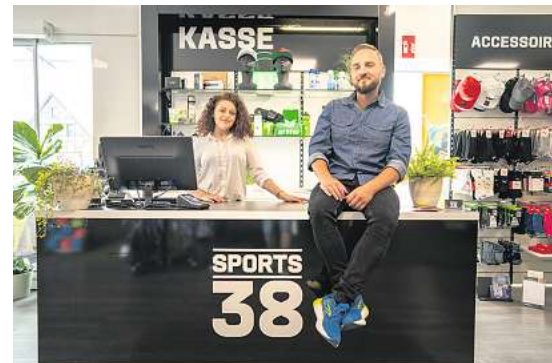
Sports38 ist ein Paradies für Sportbegeisterte.