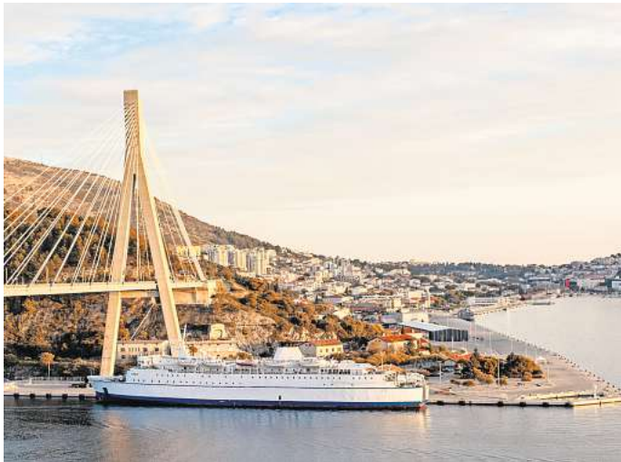
Sonnenuntergang über Dubrovnik: Im Herbst leuchtet die Natur rund um die kroatische Küstenstadt in warmen Farben.

Durchschnittlich zwölf Grad und neun Regentage: Das Oktober-Wetter in Dänemarks Hauptstadt Kopenhagen erscheint bei der Reiseplanung zunächst etwas abschreckend. Und doch ist für Städtereisende, die die dänische Kultur genauer kennenlernen möchten, der Herbst ein passender Reisezeitraum. Denn dann beginnt in ganz Dänemark die Hygge-Saison. Der einzigartige Begriff umschreibt das Gefühl von Gemütlichkeit, Wärme und die Nähe von Freundinnen, Freunden und Familie. Zu Hause kuscheln sich die Familien in ihre Decken, zünden Kerzen an, lesen Bücher und trinken Tee. Touristinnen und Touristen können es sich in Kopenhagen ganz einfach in den kuscheligen Cafés hyggelig machen. Im klassisch-royalen Traditionshaus La Glace schmausen Besucherinnen und Besucher