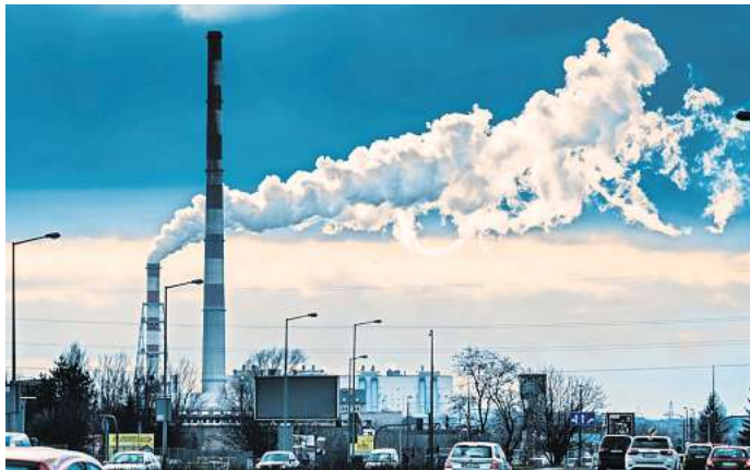
Deutschland schneidet im internationalen Vergleich einigermaßen gut beim Klimaschutz ab.

Deutschland ist hier einer der Vorreiter: In diesem Jahr kommen bislang sogar 52 Prozent der elektrischen Energie aus erneuerbaren Quellen. Und auch der CAT lobt, dass die Bundesregierung Hindernisse beim Ausbau der regenerativen Energieerzeugung beseitigt habe.