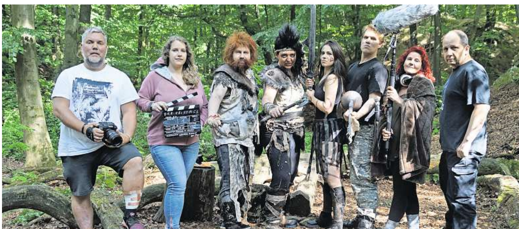
„Der Kristall“: Die Story im Universum der Heftromanserie „Maddrax“ hat die Kurzfildmschmiede in diesem Sommer aufwendig verfilmt – inklusive Kostümen und Kampfchoreografien.

Den ersten „kleinen Wendepunkt“ im Schaffen markierte 2011 „Der letzte Tag“, eine filmische Hommage an „Perry Rhodan“. Die Heftromanserie feierte damals 50. Jubiläum unter anderem mit einem Fanfilmwettbewerb („Stardust Award“). „Wir haben mit unserem Beitrag den dritten Platz belegt“, erzählt Kompio und unterstreicht zugleich, dass Filmemachen eben „keine One-Man-Show, sondern immer Teamwork“ ist. In der übrigen für Neulinge stets offenen Kurzfildmschmiede bringt sich jede und jeder mit ihren und seinen Stärken ein, sei es Kamera, Licht, Ton, digitale Effekte,