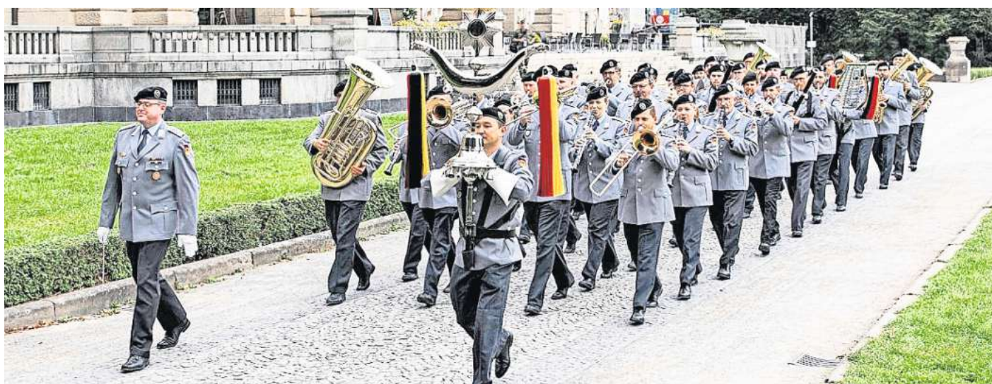
Musikalischer Höhepunkt: Das Heeresmusikkorps Hannover spielt in der Gifhorer Stadthalle zugunsten der AZ-Aktion „Helfen vor Ort“.

Stammgäste wissen: Das Militärorchester kann mehr als Märsche. Weit mehr. Das beweist das Heeresmusikkorps Hannover seit Jahren bei den Benefizkonzerten zugunsten der AZ-Aktion „Helfen vor Ort“ immer wieder aufs Neue. Mit einer abwechslungsreichen Vielfalt stellen die Musiker unter Beweis, dass jeder und jede einzelne ein echter Künstler oder eine echte Künstlerin ist. Das Heeresmusikkorps hat immer wieder mit hoher Musikalität, einem ausgefallenen Programm und viel Witz für Standing Ovationen in der Stadthalle gesorgt und schon so manchen Skeptiker davon überzeugt,