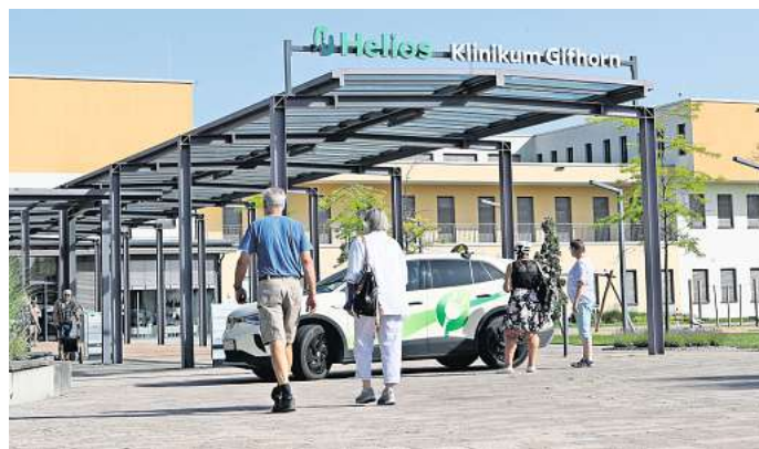
Das Helios Klinikum empfiehlt, sich bei akuten Atemwegsinfektionen an Hygieneregeln zu halten.

Regelmäßige Testungen bei Patienten und Mitarbeitern würden aktuell als unwahrscheinlich eingestuft. „Corona hat seinen Schrecken verloren, da die Krankheit nicht mehr bei so vielen Menschen schwer verläuft und zudem ein hoher Pro-