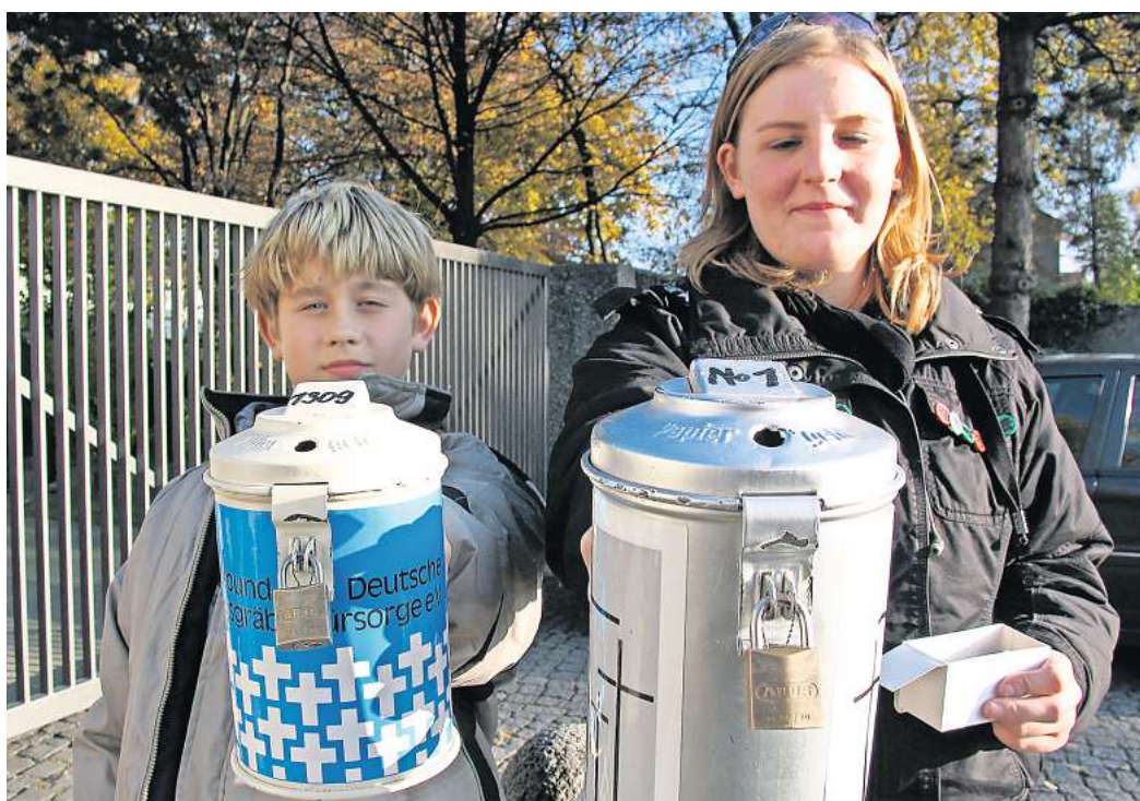
Spenden für den Volksbund Deutsche Kriegsgräberfürsorge: Auch im Landkreis Gifhorn sind bis 30. November wieder Sammler unterwegs.

Weitere Informationen zur Arbeit des Volksbundes gibt es unter www.volksbund.de .