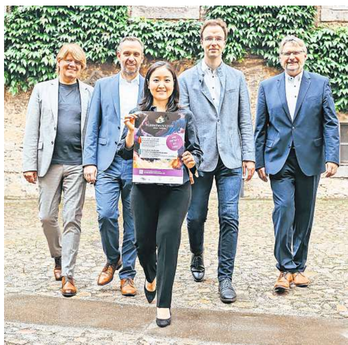
Gemeinsam junge Talente fördern: Das Herbstmusikfest Gifhorn-Wolfsburg findet Anfang Oktober statt.

Für alle Konzerte sind Karten unter www.herbstmusikfest.de erhältlich. Der Eintritt für beide Konzerte ist frei, es wird allerdings um Voranmeldung gebeten.