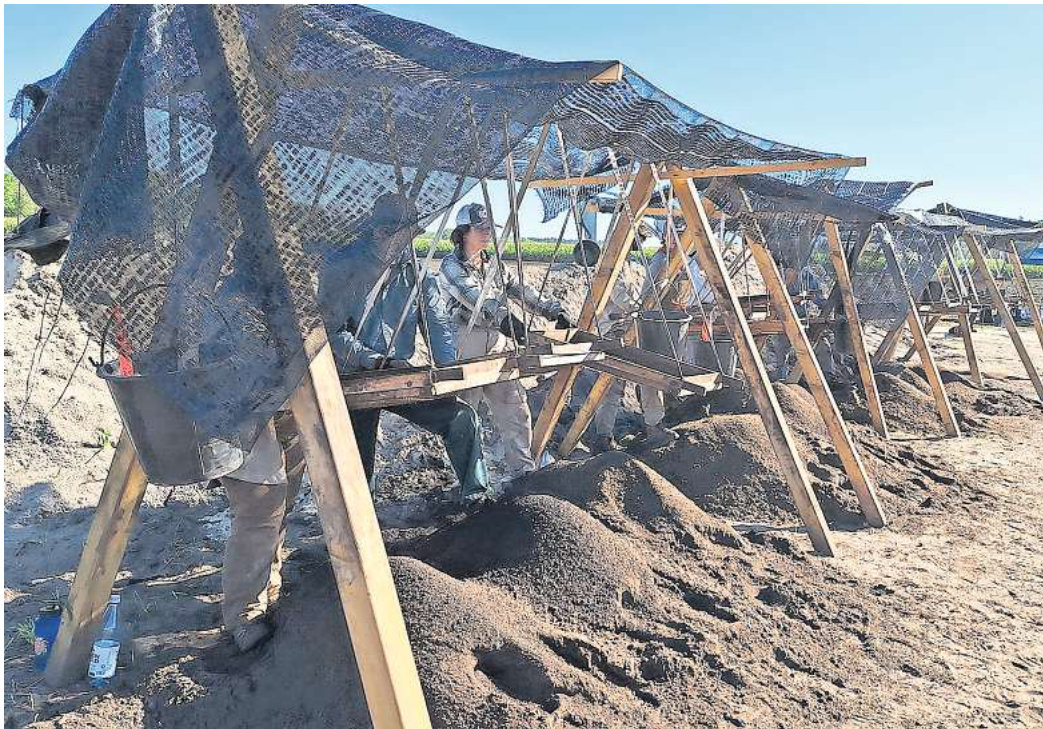
Detailarbeit: Die Studenten sieben akribisch die Erde aus der Absturzstelle.

Dabei verweist Villwock darauf, dass es sich bei dem abgestürzten Flugzeug um einen Bomber voller Munition handelte. Entsprechend groß ist dem Spezialisten zufolge offenbar die Explosion gewesen. Die Teile, die jetzt von den Studenten entdeckt werden, sind laut Villwock zumeist nicht größer als eine Zwei-Euro-Münze. Gefunden