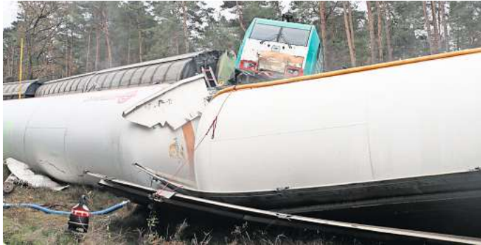
Einsatzkräfte des DRK halfen beim Zugunglück, das sich im November 2022 bei Dalldorf ereignete.