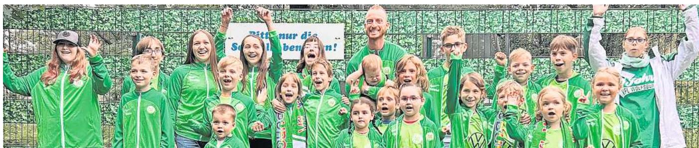
Fünftes Erlebnis-Wölfe-Camp: Zehn Familien mit krebskranken Kindern waren diesmal am Stüder Bernsteinsee mit dabei.

Während nachmittags ein Teil der Kids zum Fußballspielen in der kleinen SoccerArena war, ging es für den Rest zum Reiterhof und gemeinsamen Ausritt