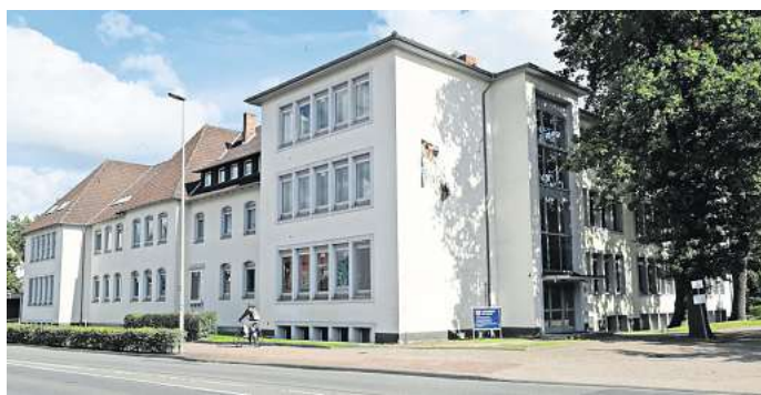
Machbarkeitsstudie: Das Schulgebäude an der Konrad-Adenauer-Straße in Gifhorn soll eine Außenstelle des Otto-Hahn-Gymnasiums werden.

Man sei sich bewusst, dass die Ergebnisse einer Befragung, zu der es im Vorfeld vielleicht Info-Veranstaltungen geben werde, keine absolute Datenerhebung darstelle, sondern eher ein Stimmungsbild zeige, aus dem eine Wahrscheinlichkeit berechnet werden könne. Betont wurde in der Sitzung immer wieder, dass es (noch) nicht darum gehe, Fakten zu schaffen, und die Einrichtung einer Oberstufe in Wittingen auch „keine Nachteile“ für das Gymnasium in Hankensbüttel