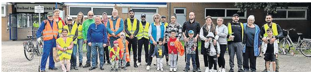
Brome: Viele freiwillige Helfer folgten dem Aufruf der Initiative „Plastik – Nein Danke!“.