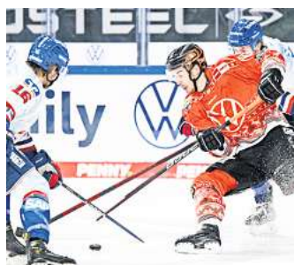
Grizzlys gegen Adler Mannheim: Es gibt Karten zu gewinnen.

Ein Besuch in der Eis-Arena in Wolfsburg bietet in diesen Tagen ein starkes Kontrastprogramm zu Aktivitäten an der frischen Luft. Während der Spätsommer in der vergangenen Woche alle Register gezogen hat und die Temperaturen in Gifhorn in der Spitze noch einmal bis auf 25 Grad geklettert sind, hat die Klimaanlage in der Eis-Arena alle Hände voll zu tun, um die nötigen Minusgrade für