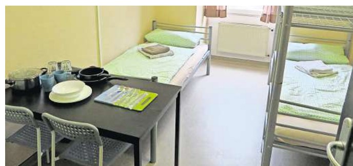
Blick in eine Flüchtlingsunterkunft im Landkreis Gifhorn (Symbolbild).

Wir würden gerne von Ihnen wissen, wie Sie zu diesem Thema