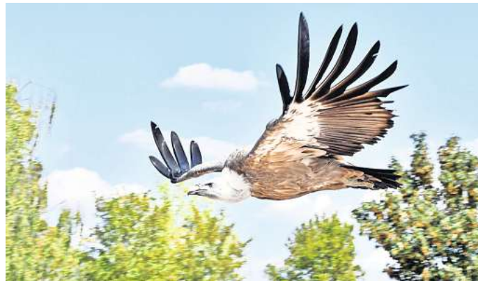
Gänsegeier sind mächtige Greifvögel und werden bis zu einem Meter lang.

Ihren Namen haben die Greifvögel aufgrund ihres charakteristischen Gefieders, das an den