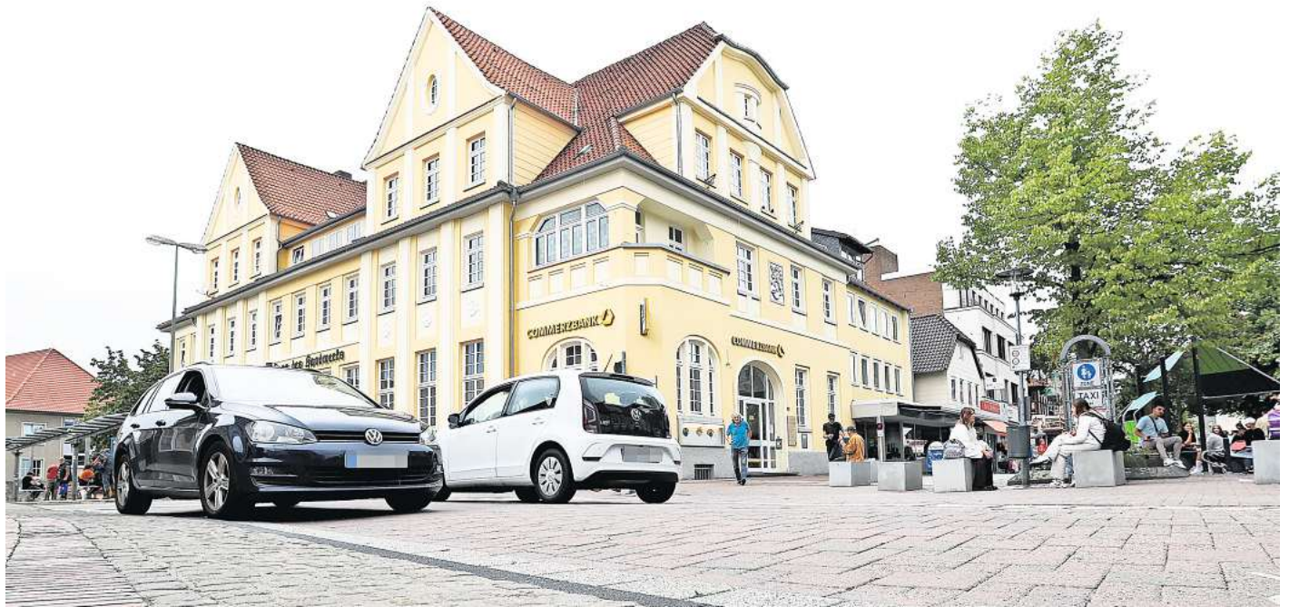
Autos raus aus der Fußgängerzone? Zur geplanten dauerhaften Sperrung der Hindenburgstraße startet am 23. Oktober ein sechsmonatiger Verkehrsversuch in Gifhorn.

Erste Vorbereitungen dazu laufen laut Bley längst. „Wir erheben im Vorfeld die Verkehrsmengen.“ An neuralgischen Kreuzungen wie Allerstraße/Hindenburgstraße, Schillerplatz und Konrad-Adenauer-Straße/Fallerslebener Straße, in den beiden Parkhäusern Schütte und Hindenburgstraße sowie in der Fußgängerzone nehmen Stadt und Verkehrsplanungsbüro