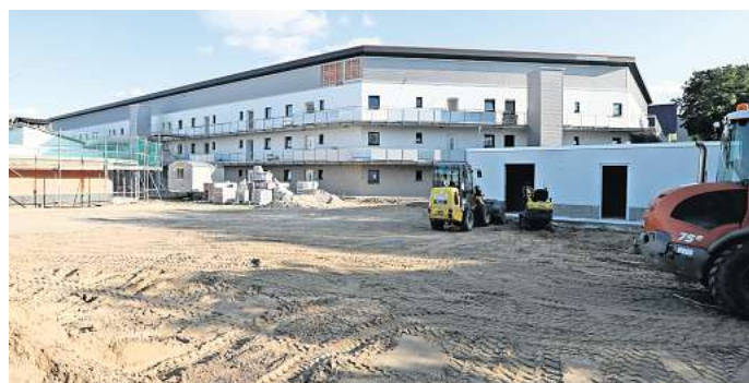
Neue Zimmer, Service-Wohnen und Veranstaltungen: Die Erweiterung des Seniorenzentrums in Calberlah steht vor der Fertigstellung.

Interessierte sind eingeladen, sich unter Telefon (0 53 74) 95 57 70 mit dem Seniorenzentrum in Calberlah in Verbindung zu setzen. Außerdem wird weiteres Personal benötigt. Unter www.drk-gifhorn.de/drkstellenportal sind alle derzeit offenen Stellen zu finden.