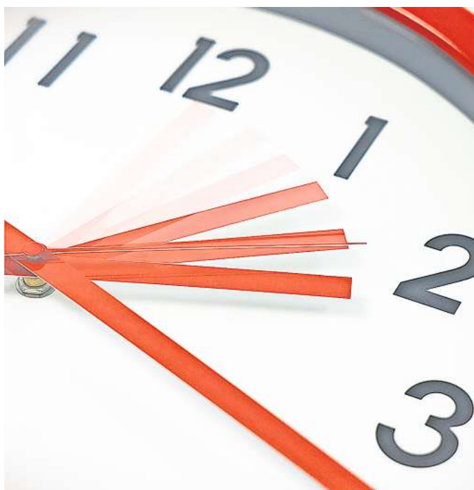
Mal eben eine Stunde dranhängen – oder auch zwei oder drei: Der Überstunden-Berg ist auch im Landkreis Gifhorn enorm.

und Gaststätten leisteten die Beschäftigten im vergangenen Jahr im Landkreis Gifhorn rund 14.000 Überstunden. 6.000 davon ohne Bezahlung – quasi für umsonst“, so das Pestel-Institut. Die Wissenschaftler haben bei ihrer Untersuchung aktuelle Mikrozensusdaten ausgewertet. Basis der Überstunden-Berechnung ist die Übertragung von Branchen-Durchschnittswerten auf die Beschäftigungsstruktur vom Kreis Gifhorn. Mit Blick auf die Überstunden warnt die NGG Süd-Ost-Niedersachsen-Harz: Hotellerie und Gastronomie könnten nicht dauerhaft auf die „Goodwill-Überstunden“ ihrer Beschäftigten bauen. „Es wird höchste Zeit, das Fachkräfte-Loch zu stopfen, das die Corona-Pandemie noch vergrößert hat. Das klappt allerdings nur, wenn Hotels und Restaurants bereit sind, attraktive Löhne zu bezahlen. Perspektivisch muss der Gastro-Startlohn für eine Köchin oder einen Restaurantfachmann nach der Ausbildung bei 3.000 Euro pro Monat für einen Vollzeitjob liegen“, so