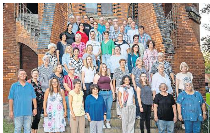
Die Singgemeinschaft Isenbüttel freut sich schon auf ihr Jubiläumskonzert „The Peacemakers“.