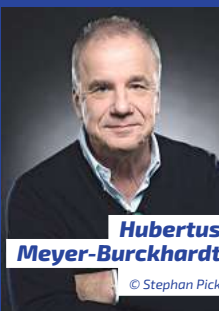
Hubertus Meyer-Burckhardt

Außergewöhnliche Frauen, erstaunliche Geschichten, beeindruckende Lebenswege: Hubertus Meyer-Burckhardt liest aus seiner Sammlung unterhaltsamer und tiefgründiger Gespräche mit Frauen, die den Horizont erweitern und das Herz öffnen. Folgende Frauen haben ihn mit ihren Geschichten besonders beeindruckt: Barbara Becker, Senta Berger, Ann-Marlene Henning, Nina Hoss, Caren Miosga, Katrin Sass, Britta Steffen, Stephanie Stumph, Insa Thiele-Eich, Christiane Woopen.