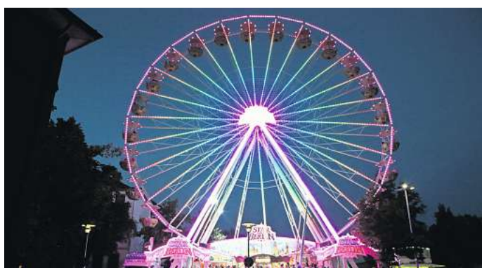
Hoch hinauf: Wie beim Altstadtfest (Foto) soll nun auch auf dem Weihnachtsmarkt ein Riesenrad aufgebaut werden, dass die Besucher in die Innenstadt lockt.

Den Marktplatz in diesem Jahr auszusparen, sehen die Organi-