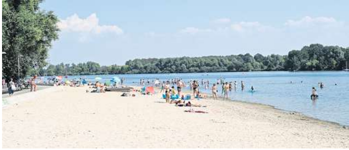
Entspannung am Strand: Mitarbeitende einer Klinik in Hannover erhalten ab Januar 15 Tage mehr Urlaub.

Wir würden gerne von Ihnen wissen, wie Sie das Programm der Klinik finden. Machen 45 Urlaubstage einen Arbeitgeber für Sie attraktiver? Oder ist Ih-