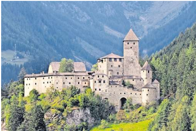
Die Burg Taufers in Südtirol.

In der einstigen Stammburg der Tiroler Grafen befindet sich heute das Südtiroler Museum für