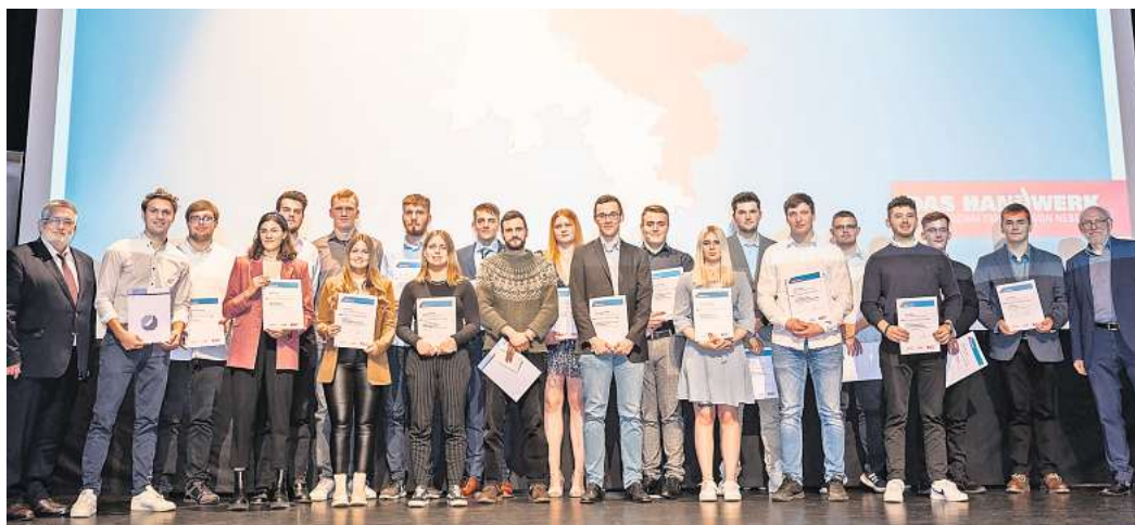
Ehrung: Die Handwerkskammer hat die landesbesten Gesellen 2023 ausgezeichnet. Unter den 21 Geehrten sind auch drei aus dem Landkreis Gifhorn.