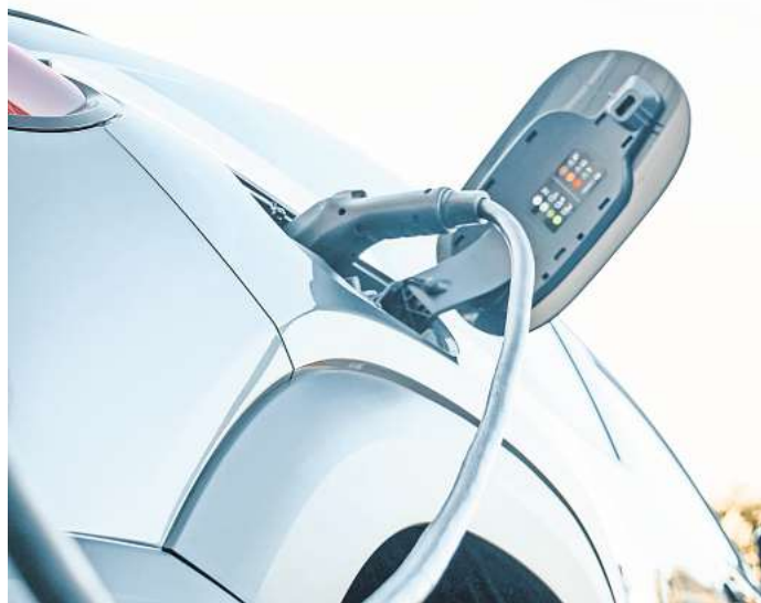
Die Zahl der Stromtankstellen steigt deutlich an. Doch es kommt nicht allein auf die Quantität an.

Eher kritisch betrachtet der ADAC den aktuellen Zustand der Ladeinfrastruktur an Autobahnen: So verfüge nur etwas mehr als die Hälfte der Raststätten über eine Ladeleistung ab 150 Kilowatt. Es gebe „erheblichen Nachholbedarf“. Größtes Ärgernis seien weiterhin die „seit jeher hohen Preise“. Beim aktuellen ADAC-Raststättentest wurden 40 Anlagen getestet. Davon bekamen 24 die Note „ausreichend“. 15-mal vergaben die Tester die Note „gut“ – ein „sehr gut“ gab es nicht.