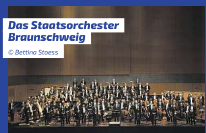
Das Staatsorchester Braunschweig

Der Kulturverein lädt auch 2024 herzlich zum traditionellen Neujahrskonzert in die Gifhorer Stadthalle ein. Das Orchester hält einen bunten Strauß an Melodien bereit. Das Programm verbindet Heiteres und Besinnliches zugleich. Populäre Werke werden ebenso erklingen wie beliebte Klassiker. Der Sektempfang startet um 19 Uhr.