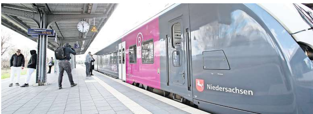
Der Gifhorer Bahnhof: Wie der VRB mitteilt, werden die ÖPNV-Ticketpreise zum kommenden Jahr steigen.