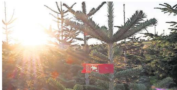
Auch in diesem Jahr gibt es genügend erschwingliche Weihnachtsbäume in guten Qualitäten.

Schon beim Kauf kann der Baum ständerfertig gemacht