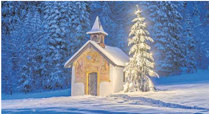
Weiße Weihnachten sind für viele Menschen der Inbegriff von Romantik.

Um herauszufinden, wo die Chancen insgesamt am besten stehen, wo du Weihnachten nicht mit Schnee rechnen musst und ob es früher häufiger weiße