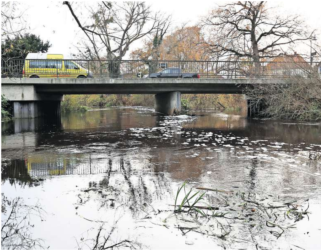
Doppelt so viel Regen wie im November-Durchschnitt: Der Monat ergab jetzt schon 91 Liter pro Quadratmeter, vor allem die Ise bringt viel Wasser mit.

Pustekuchen ist es dagegen gerade mit der Renaturierung der Rotaller in Gifhorn. Dort sorgten die Wassermassen dafür, dass die Pegelabsenkung im Zusammenspiel aus Gerberwehr und Schlauchwehr ge-