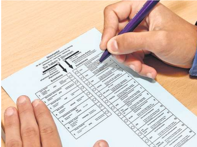
Umfrage der Woche: Sind Sie für vorgezogene Neuwahlen?

Diese Planungsunsicherheit nutzt die Opposition, um gegen die Ampelregierung zu schießen. CSU-Politiker Markus Söder fordert jetzt sogar Neuwahlen. Auf dem Nachrichtendienst