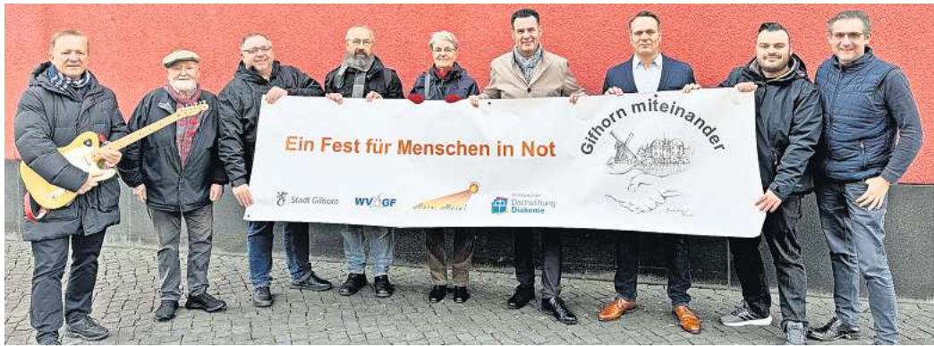
Feier zeigt die „Solidarität der Stadtgesellschaft“: Verantwortliche, Organisatoren und Mitwirkende freuen sich auf „Gifhorn miteinander“ am 12. Dezember.

„Gifhorn miteinander“ in der Stadthalle – Organisatoren rufen zu Spenden auf