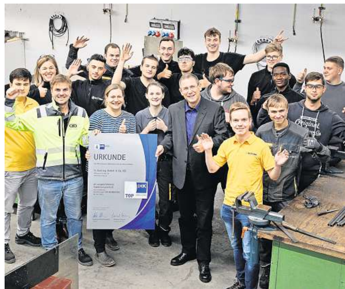
Daumen hoch für die zertifizierte „TOP Ausbildung“ in der Butting GmbH.

an der Nachwuchssicherung sowie an der Verbesserung unserer Ausbildungsprozesse und -standards zu arbeiten und eine gute Vorbereitung der Lehrlinge auf die Anforderungen der Arbeitswelt sicherzustellen.“