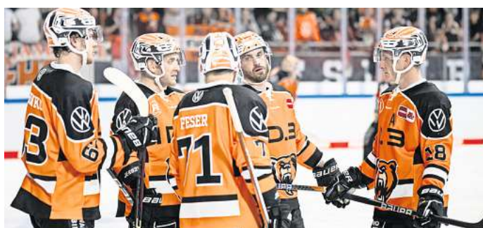
Tickets zu gewinnen: Die Grizzlys treffen am 10. Dezember auf die Pinguins Bremerhaven.

Angstgegner Bremerhaven? In der vergangenen DEL-Saison gab es vier Aufeinandertreffen der beiden Teams. Die Pinguins Bremerhaven konnten alle vier Spiele für sich entscheiden. In dieser Saison gab es ebenfalls bereits ein Aufeinandertreffen der beiden Kontrahenten, und auch in diesem Spiel am 17. September war für die Grizzlys Wolfsburg nichts zu holen. Mit 2:6 ging das Duell verloren. Torschützen für die Grizzlys waren Chris Wilkie und Spencer Machacek. Der letzte Sieg für die Grizzlys gegen Bremerhaven liegt schon ein