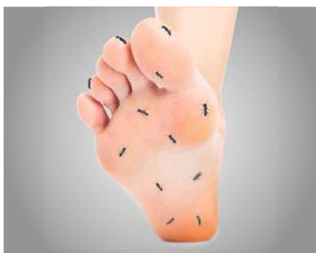
Kribbelnde Füße infolge von Nervenschmerzen?