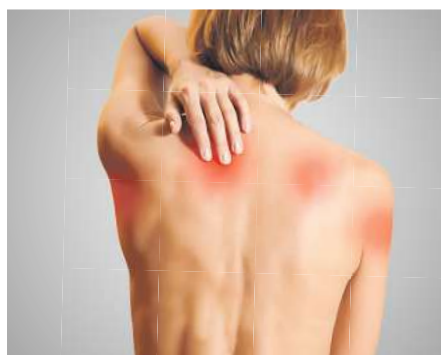
Nervenbedingte, muskelkaterartige Schmerzen?

Mehr als 23 Millionen Deutsche klagen heutzutage über chronische Schmerzen. Besonders häufig sind Nacken- oder Rückenschmerzen, die sogar bis in die Beine ausstrahlen können. Andere haben Schmerzen in Beinen oder Füßen, die von Missempfindungen wie Brennen, Kribbeln oder Taubheitsgefühlen begleitet werden können. Wieder andere kämpfen mit mysteriösen muskelkaterartigen Schmerzen am ganzen Körper. Und auch wenn es so scheint, als würden die Betroffenen unter völlig verschiedenen Beschwerdebildern leiden, so steckt doch meist derselbe Auslöser dahinter: geschädigte oder gereizte Nerven!