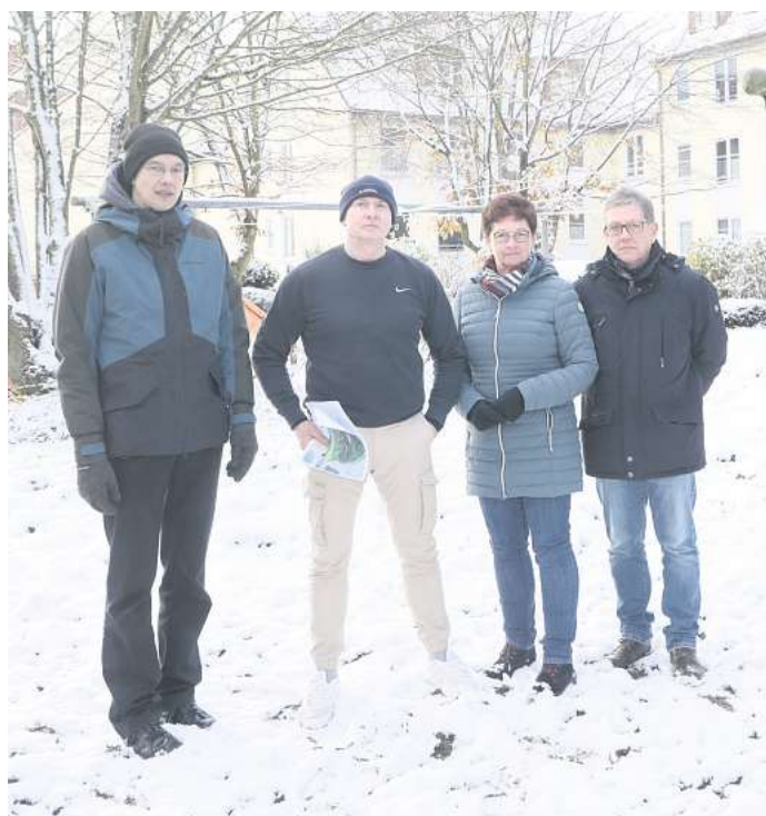
Fallersleben: Die Mieter fürchten sich vor den Wildschweinen, die ins Wohngebiet kommen.

Eigentümern abgestimmt“, so das Unternehmen der Stadtwerke Wolfsburg.