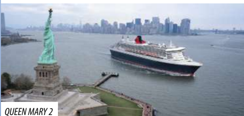
QUEEN MARY 2

✓ Haustürabholung & Transfer zum Schiff ✓ 9 x Übernachtung in der gebuchten Kabinenkategorie ✓ Vollpension an Bord (Frühstück, Mittag- und Abendessen, Afternoon-Tea, 24-Stunden-Kabinenservice und Buffetrestaurant) ✓ Getränkestationen zur 24-Stunden-Selbstbedienung mit Kaffee, Tee, Wasser und Säften ✓ Eine Flasche Sekt zur Begrüßung auf der Kabine ✓ Vielfältiges Unterhaltungsprogramm ✓ Nutzung des Fitness-Centers, der Pools und der Bibliothek ✓ Gepäckbeförderung bei Ein- und Ausschiffung ✓ Trinkgelder, Hafen- und Sicherheitsgebühren ✓ Transfers in New York: Schiff - Hotel & Hotel - Flughafen ✓ 3 x Übernachtung im ****Hotel Hilton in Midtown Manhattan (oder vergleichbar) inkl. Frühstück und Welcome Drink ✓ Hospitality-Service in New York ✓ Rückflug New York - Hamburg ✓ Rücktransfer in die Heimatorte ✓ Exklusiver Cocktailempfang und Fuhrmann Mundstock Reisebegleitung an Bord ab 20 Teilnehmern