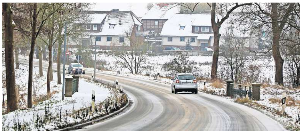
Die damalige Unfallstelle: Die Ermittlungen im Fall eines auf der L294 zu Tode gefahrenen Mannes sind eingestellt worden.

Die weitere Fluchtrichtung des Autofahrers ist nicht bekannt. Nach eingegangenen Zeugenhinweisen hatte die Polizei damals zunächst nach einem dunklen Passat Variant gesucht. Die Staatsanwaltschaft ermittelte wegen des Verdachts der fahrlässigen Tötung und des unerlaubten Entfernens vom Unfallort. Bisher konnte der Täter oder die Täterin aber nicht ermittelt werden. Das Verfahren wurde inzwischen eingestellt. „Sollten sich neue Ermittlungsansätze ergeben, kann das Verfahren aber jederzeit wiederaufgenommen werden“, erklärte Wolters.