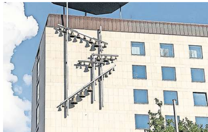
Glockenspiel: Bis zum 27. Dezember wird es weihnachtlich.