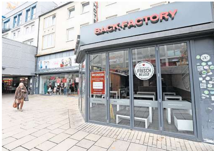
Die Back-Factory-Filiale hat im Zuge des geplanten Neubaus der BraWo Arkaden jetzt ihre Türen geschlossen.

Auch die Fahrschule Holtmann, im Pavillon vor der Drogerie Müller ansässig, verlässt den alten Standort in der Porschestraße 68. Plakate in den Schaufenstern und eine Ansage auf dem Anrufbeantworter kündigen den Umzug der Fahrschule in die Porschestraße 46a an. Der Salon „Brigitte“ und „Arko“ hatten den Pavillon bereits vor