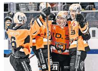
Für das Spiel der Grizzlys Wolfsburg gegen den ERC Ingolstadt gibt's Eintrittskarten zu gewinnen.

In der vergangenen DEL-Saison gab es vier Aufeinandertreffen zwischen den Grizzlys Wolfsburg und dem ERC Ingolstadt. Dabei konnte jedes Team seine beiden Heimspiele gewinnen. Den deutlichsten Sieg hatten die Eishockey-Cracks aus Wolfsburg in ihrem ersten Heimspiel kurz nach Weihnachten 2022 eingefahren. 9:1 hieß es damals am 28. Dezember 2022. In dieser Saison haben beide Mannschaften auch schon zweimal gegeneinander gespielt. Beide Partien wurden in Ingolstadt ausgetragen. Das erste Spiel gewannen die Grizzlys mit 5:2. Das zweite Duell konnte der ERC mit 5:1 für sich entscheiden. Nach dem 24. Spieltag stehen die