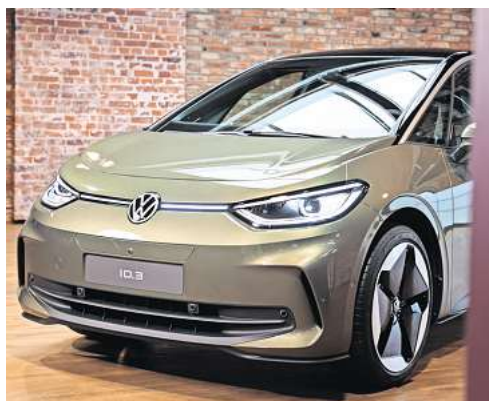
VWs kleinster Stromer: Der ID.3 hat im Frühjahr ein Facelift erhalten.

Darum geht es: Die Fachzeitschrift „auto motor und sport“ schreibt mit Berufung auf VW-Vorstandskreise, dass der Golf 9 2028 als vollelektrisches Auto – zumindest in Europa – auf den Markt kommen soll. Dann werde auch der ID.3 eingestellt. Eine Begründung liefert die Zeit-