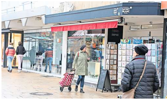
Viele Leerstände in der Wolfsburger Innenstadt: Auch das Traditionsgeschäft „Haase Schreiben & Schenken“ soll zum Jahresende schließen.

Schon im Januar hatte es die erste Schließung gegeben: Die Wellensteyn-Filiale in der Goethestraße zog nach Braunschweig um. Im Sommer dieses Jahres wurde das Ende der mexikanischen Bar „Tita – The Mexican Way“ bekannt, die erst im November 2022 ihre Neueröffnung in der City-Galerie feierte. Mitte September erfolgte die Schließung von „Mäc-Geiz“ und die Münchener Modekette Hallhuber meldete im vergangenen Mai Insolvenz an, was auch die Filiale in der City-Galerie betraf, die Ende Oktober schließen musste.