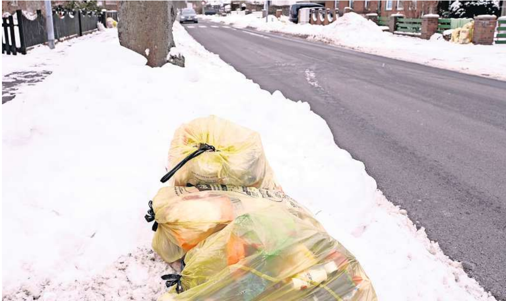
Gelbe Säcke wurden in Heiligendorf wegen der Witterungsverhältnisse nicht abgeholt.

„Ja, tatsächlich konnten witterungsbedingt und aufgrund der Straßenverhältnisse in bestimmten Straßen die Gelben Säcke nicht abgeholt werden“, räumt Remondis auf Nachfrage der WAZ ein. Gerade Nebenstraßen, die nicht geräumt worden seien und somit nicht ge-