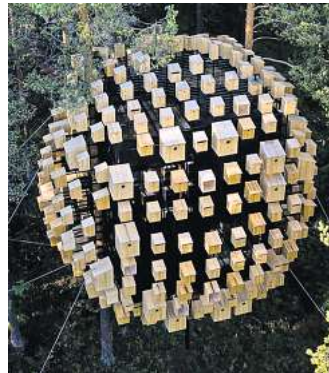
Eine Nacht umgeben von Natur und Vögeln ist eine besondere Erfahrung – und auch eine besonders preisintensive ...

Die Unterkünfte des Treehotels in Schweden sehen aus wie von einem anderen Planeten. Sogar ein Ufo steht hier mitten im Wald, eine andere sogenannte Cabin wiederum ist umschlossen von Hunderten Vogelhäuschen. Du findest dieses abgelegene Hotel in Harads, einem kleinen Dorf im Norrland-Wald in Nordschweden. Der nächstgrößere Ort Boden ist fast 50 Kilometer entfernt, du hast hier also wirklich deine Ruhe. Die hat aber auch ihren Preis: Für eine Übernachtung im von Vogelhäuschen umgebenen Baumhaus zahlst du über 1370 Euro.