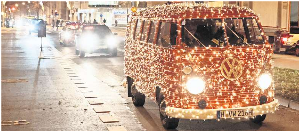
Bei der Käfer-Lichterfahrt durch Wolfsburg waren auch Bullis dabei.