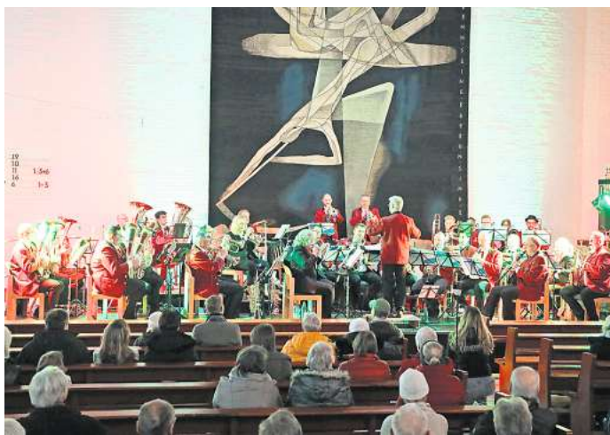
Das Orchester der Stadtwerke Wolfsburg gab sein Adventskonzert in der Pauluskirche.