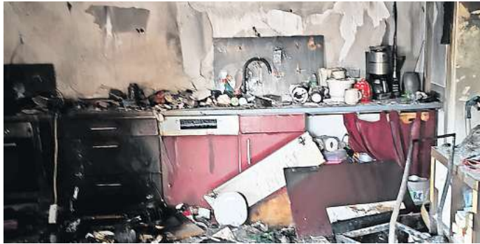
Ein Brand in einer Wohnung zerstörte die Einrichtung.