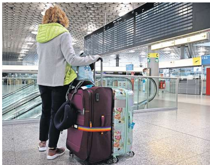
Viele Deutsche fliegen gerne über Weihnachten und Silvester in die Ferne. Sie auch?