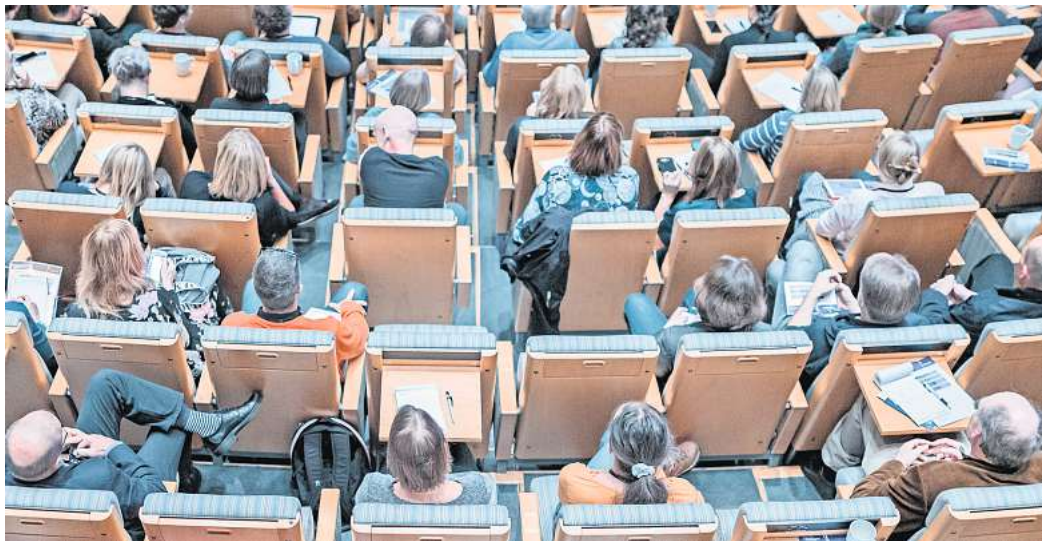
Die Union will die Ampelkoalition dazu bewegen, die Zinsen für den Studienkredit der staatlichen Förderbank KfW wieder deutlich zu senken.