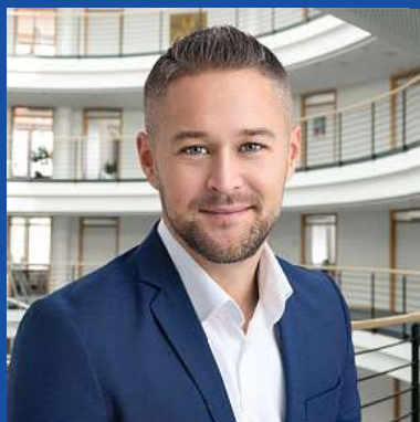
Geschäftsstelle Sascha Glawé Lange Straße 38 · 38448 WOB-Vorsfelde T 0 53 63 / 79 95

Ihnen und Ihren Angehörigen wünschen wir frohe Festtage sowie ein erfolgreiches und glückliches neues Jahr.