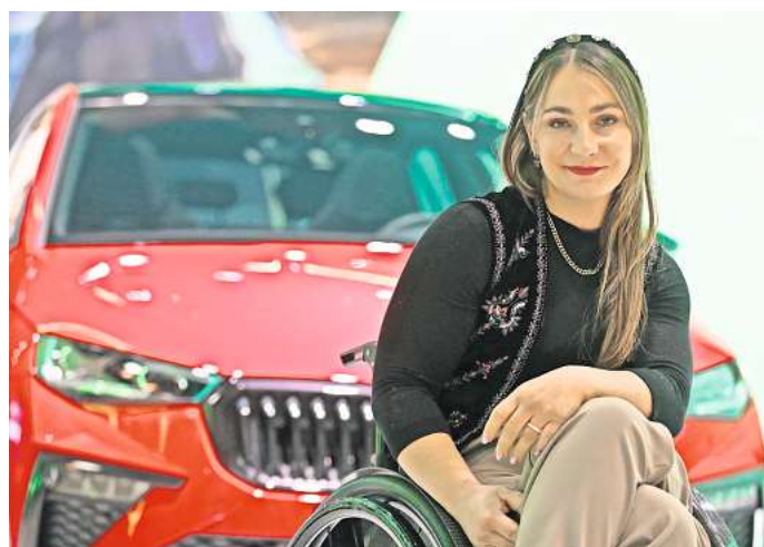
Voller Lebensfreude: Kristina Vogel ist Skoda-Markenbotschafterin und drehte einen Film in der Autostadt.

Außerdem vermittele sie ihnen eine zentrale Botschaft: „Das Leben kann sich ganz schnell ändern – dann ist ein Partner an deiner Seite wichtig.“ Bei ihr sei es unter anderem Skoda gewesen: Dort habe man ihren Superb rollstuhlgerecht umbauen lassen, jetzt führt sie mit Handgas statt mit Fußpedalen. Auch von Berlin aus fuhr sie mit dem Auto nach Wolfsburg – und staunte über den Adventsmarkt der Autostadt: „Ich habe gelernt, dass er Winterzauber heißt – er ist wirklich schön.“ Für sie war es der erste Besuch in der Auto-