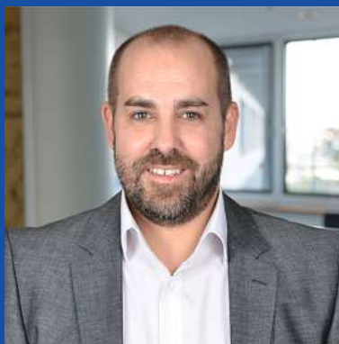
Geschäftsstelle Lars Kreipke Zu dem Balken 25 · 38448 WOB-Kästorf T 0 53 61 / 65 15 35