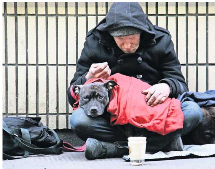
Ein Obdachloser und sein Hund.

In den meisten Unterkünften für Obdachlose ist aber die Mitnahmen von Hunden und anderen Tieren untersagt. Gerade jetzt in der kalten Jahreszeit werden die Menschen dann vor die Entscheidung gestellt: eine Nacht im Warmen ohne den vierbeinigen Alltagsbegleiter. Oder aber eine Nacht im kalten Freien zusammen mit der Fellnase. Doch viele Obdachlose