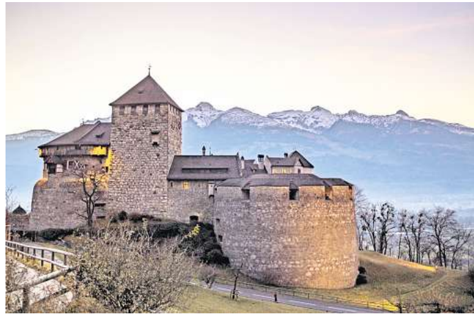
Winter im Norden Liechtensteins: Hinter der besinnlich beleuchteten Kirche von Eschen zeigt sich das Alpenpanorama.

Die schönsten und tiefgründigsten Einblicke in Liechtenstein eröffnen sich Wanderinnen und