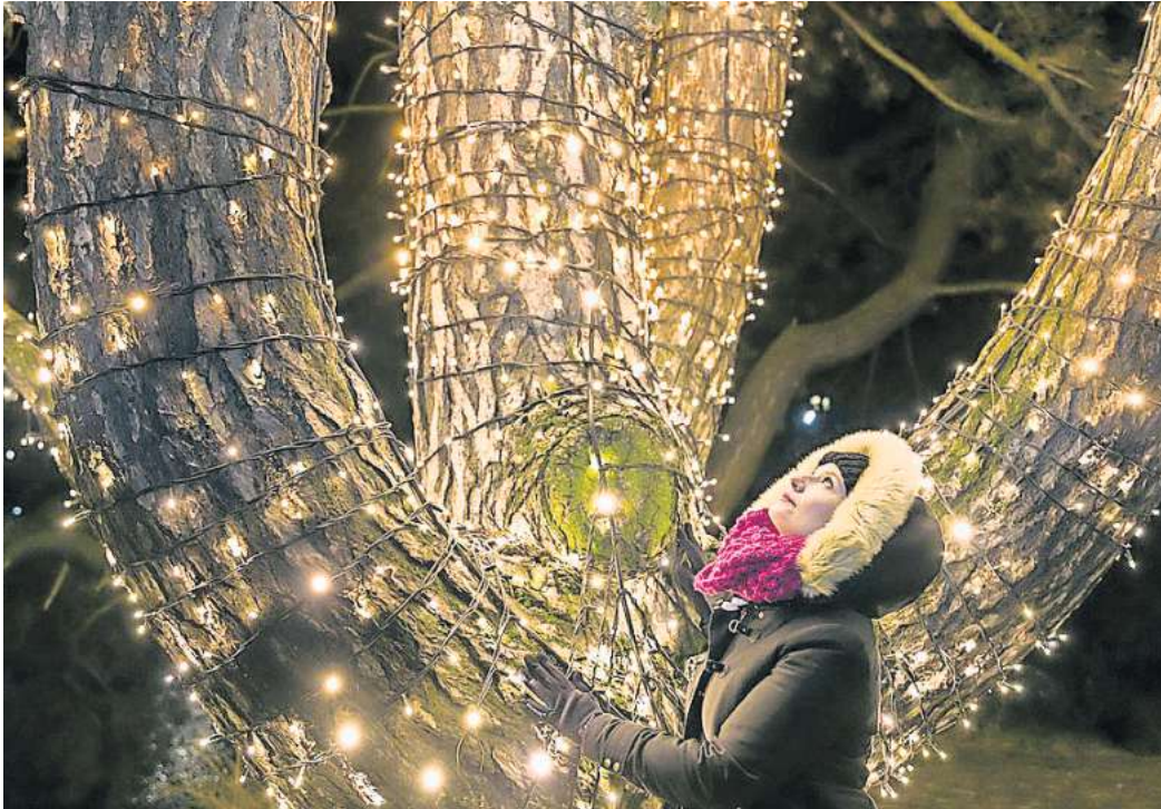
Die WAZ verlost Tickets für den Christmas Garden im Erlebnis-Zoo Hannover.

Erlebnis-Zoo Hannover: Die WAZ verlost fünfmal zwei Eintrittskarten