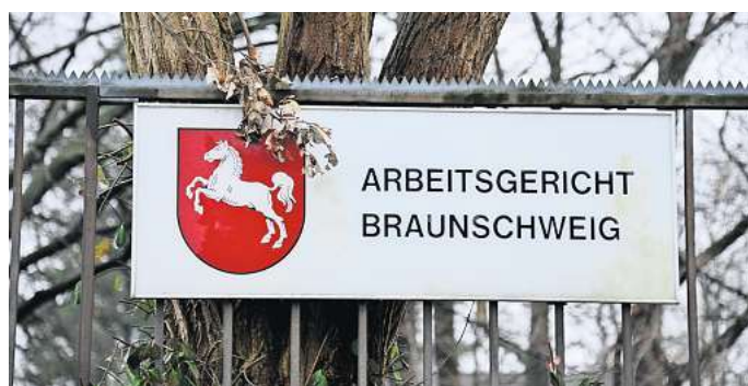
Eine Krankenschwester wurde während der Probezeit am Klinikum Wolfsburg gekündigt.

Und dann kam es wohl zur Kündigung: Nach dem Tod der Patientin soll sich die Krankenschwester gegen den Oberarzt aufgelehnt haben. Sie soll in einer Teamsitzung gesagt haben,