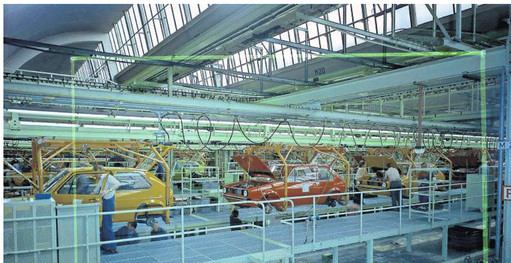
Nachfolger mit durchschlagenden Erfolg: Im März 1974 lief der erste Golf I vom Band. 1976 waren schon eine Million Fahrzeuge verkauft.