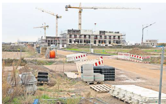
Beim Wohnungsneubau liegt Wolfsburg an der Spitze des Feldes des deutschlandweiten Vergleiches.

Helmstedt, auf Anfrage erläuterte. Pandemiebedingt seien die Arbeitslosenzahlen im Jahr 2020 von 2.800 auf 3.500 angestiegen. „Ähnliche Auswirkungen gab es in vielen Städten, Wolfsburg erholte sich aber nicht so schnell von der Pandemie, weil es dort eine Monostruktur gibt, in der sich Kurzarbeit und Lieferengpässe auswirken“, so Saalfrank. Nach einer kurzen Erholungsphase gab es im Juni 2022 durch den Ukrainekrieg einen erneuten Schub nach oben auf 4000 Personen. Analog dazu habe sich die Jugendarbeitslosigkeit entwickelt.