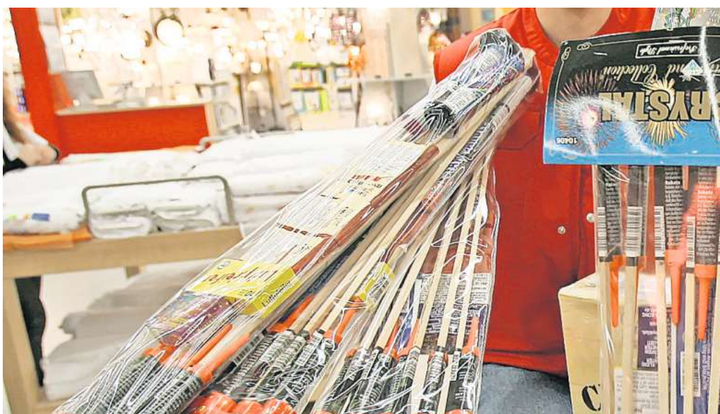
Kaufen Sie selbst Raketen und Böller zu Silvester?

Über dieses Thema wird Land auf, Land ab heiß diskutiert, sei es vor dem Hintergrund von Kriegen, im Zusammenhang mit Umwelt- und Tierschutz, aufgrund des allgemeinen Verletzungsrisikos oder wegen Ausschreitungen in deutschen Großstädten, die in den vergangenen Jahren stetig zunahmen.