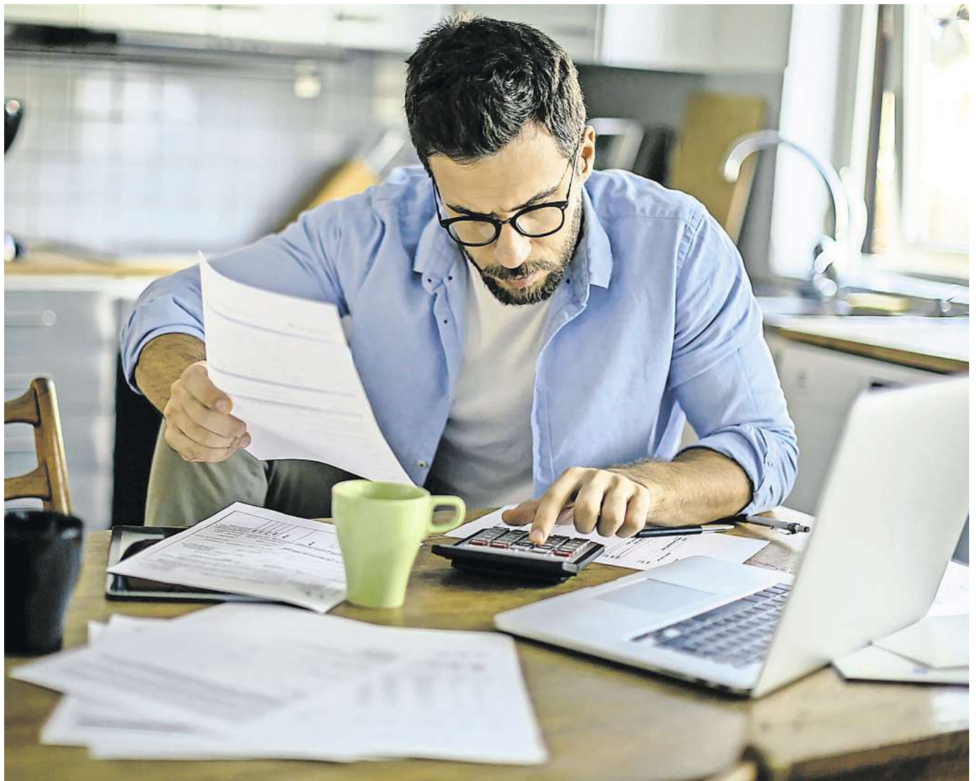
Im Laufe eines Lebens fallen viele Unterlagen an. Häufig ist es nicht nötig, sie dauerhaft aufzubewahren. Doch für manche gelten bestimmte Aufbewahrungsfristen.

Für Rechnungen und Belege für Reparaturen und Wartungsarbeiten in Haus oder Wohnung gilt ebenfalls eine Aufbewahrungsfrist von zwei Jahren ab dem Ende des Kalenderjahres, in dem der Handwerker die Rechnung gestellt hat. Sowohl Eigentümer als auch Mieter müssen laut Umsatzsteuergesetz für diesen Zeitraum belegen können, dass keine Schwarzarbeit vorlag, sonst droht ein Bußgeld von bis