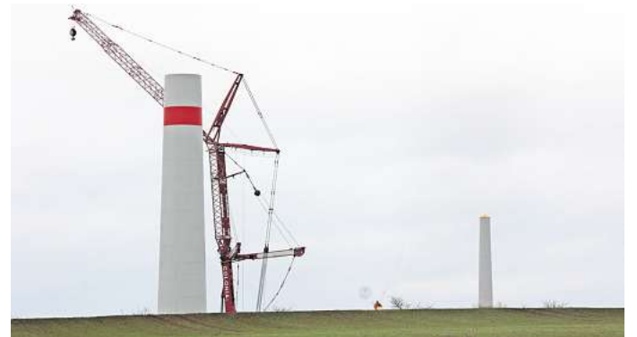
An der Stadtgrenze zu Wolfsburg werden bei Volksmarsdorf sechs neue Windräder gebaut.

Swisspower betreibt seit 2014 den Ausbau von Windenergieanlagen. Laut Unternehmensangaben betreibt die Firma mit Sitz in der Berlin 15 Onshore-Windparks in sechs Bundesländern. Swisspower kann eigenen Angaben zufolge mit den genannten Anlagen etwa 120.000 Haushalte mit Strom versorgen.