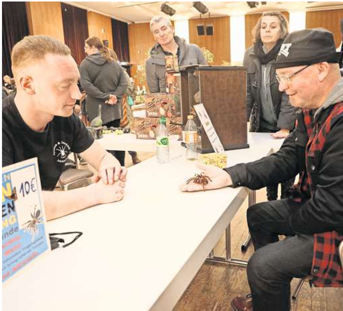
Bei der Spinnen- und Insekten-Ausstellung im Congress Park kamen die Besucher den Tieren ganz nah.

Eines der Highlights: die 'Theraphosa Blondi' – die weltgrößte Vogelspinnenart mit bis zu 35 Zentimeter. Nicht weniger spektakulär ist die 'Sydney Trichterspinne', die im Gegensatz zu den meisten Spinnen aber nicht lebend ausgestellt wurde. Der Grund: Als giftigste