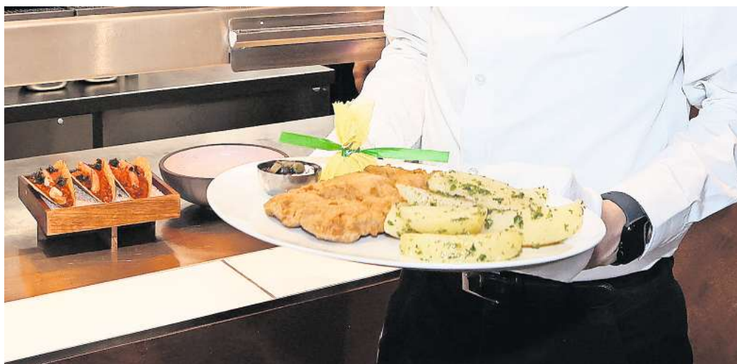
Mehrwertsteuersatz wieder bei 19 Prozent: Das Schnitzel wird in vielen Restaurants teurer.

Blieben nun die Gäste aus, so wie es der Branchenverband befürchtet? Knausern die Restaurantbesucher beim Trinkgeld? Wir würden gerne von Ihnen wissen, ob Sie bei steigenden