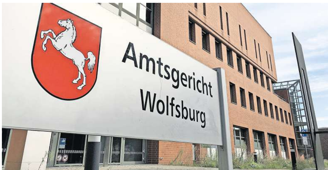
Drei Klimaaktive müssen sich nun vor dem Amtsgericht Wolfsburg verantworten.

Der Vorwurf gegen die drei Angeklagten lautet: gemeinschaftliche Nötigung. Dafür sollten sie, laut Strafbefehl, 40 Tagessätze zahlen. Doch jetzt kommt es zum Prozess am Amtsgericht. Erster Verhandlungstag ist am Donnerstag, 15. Februar. Ein Fortsetzungstermin ist für den