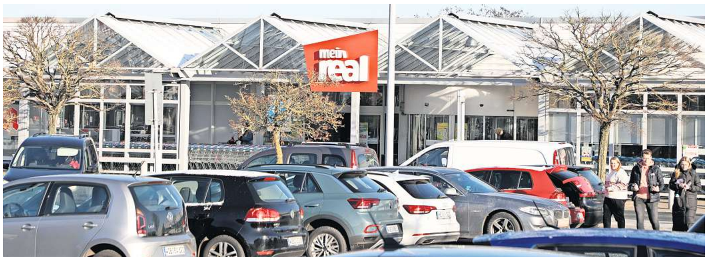
Der Termin rückt näher: Ende März schließt der Lebensmittelmarkt „Mein Real“ in Nordsteimke.

Von der Schließung des Real-Marktes ist auch der griechische