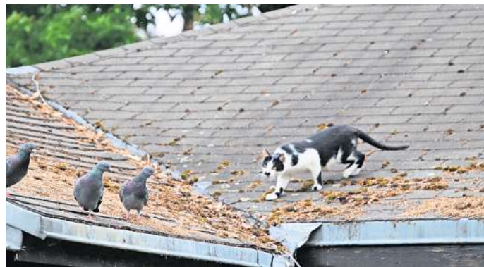
Freilaufende Katzen haben einer Studie zufolge ein sehr breites Beutespektrum.