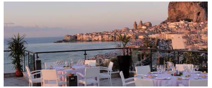
Viele außergewöhnliche Hotelerlebnisse - wie hier das 4,5* Hotel Sea Palace - lassen sich in allen Urlaubsgebieten buchen.

Wer einen echten Geheimtipp erleben möchte, kann auch einen Urlaub auf den Liparischen Inseln buchen. Nicht nur das be-