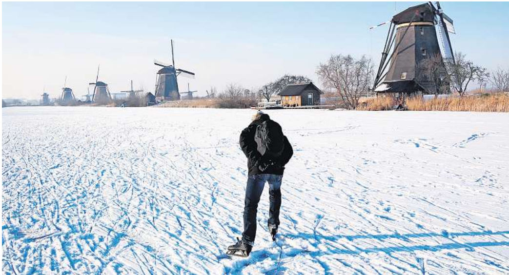
Einzigartige Kulisse: Der zugefrorene Kanal bei Kinderdijk.

Der Lago Di Braies, auch als Prager Wildsee bekannt, verwandelt sich im Winter mit zugefrorener Eisfläche zu einem