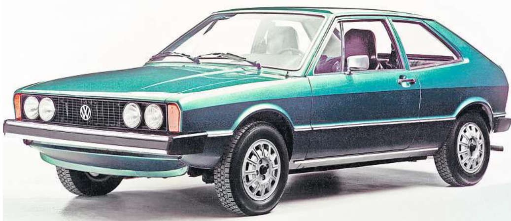
50 Jahre VW Scirocco: Mit dem Golf-Ableger wollte VW ein jüngeres Zielpublikum ansprechen.

Dass der Scirocco in Osnabrück entwickelt und produziert wurde, ist kein Zufall. Karmann benötigte zu dieser Zeit dringend einen erfolgreichen Nachfolger des Karmann Ghia Typ 14. Man realisiert schließlich ein kompaktes, von Giorgetto Giugiaro entworfenes, klassisches 2+2-sitziges Sportcoupé, dem man nicht ansieht, dass es auf der Basis des