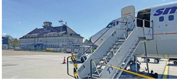
Fliegen ab Braunschweig mit momento by DER SCHMIDT ist ein exklusives Erlebnis

Den Katalog, weitere Informationen und Buchungsmöglichkeit dieser exklusiven Angebote unter www.fliegen-ab-braunschweig.de , im FIRST Reisebüro Schmidt und weiteren Reisebüros oder unter der kostenfreien (aus dem dt. Festnetz) Buchungshotline T. 08 00 / 38 300 38 (Mo.-Fr. 9-18, Sa. 9-13 Uhr).