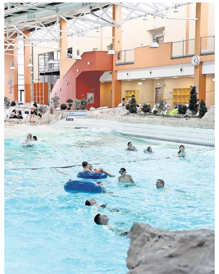
Ein Mann aus Hildesheim soll im Badeland Wolfsburg beleidigt worden sein.

Wegen seines Verhaltens weiß er und alle anderen Gäste nun, wie man sich im Wolfsburger Schwimmbad verhalten soll. Es sei sein dritter Besuch mit der Familie im Badeland gewesen. Doch ob sie noch mal nach Wolfsburg zum Schwimmen kommen, wisse der 36-jährige Vater nicht. „Meine Kinder wollen schwimmen lernen und daher sind wir in der dunklen Jahreszeit alle zwei Wochen in einem Schwimmbad. Wegen des Vorfalls werde ich von Besuchen im Badeland in Zukunft absehen. Da fahre ich mit meiner Familie lieber nach Bad Lauterberg, Braunschweig oder Hannover“, sagte der Hildesheimer.