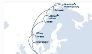
Beispielroute für die Abfahrt am 29.07.2024