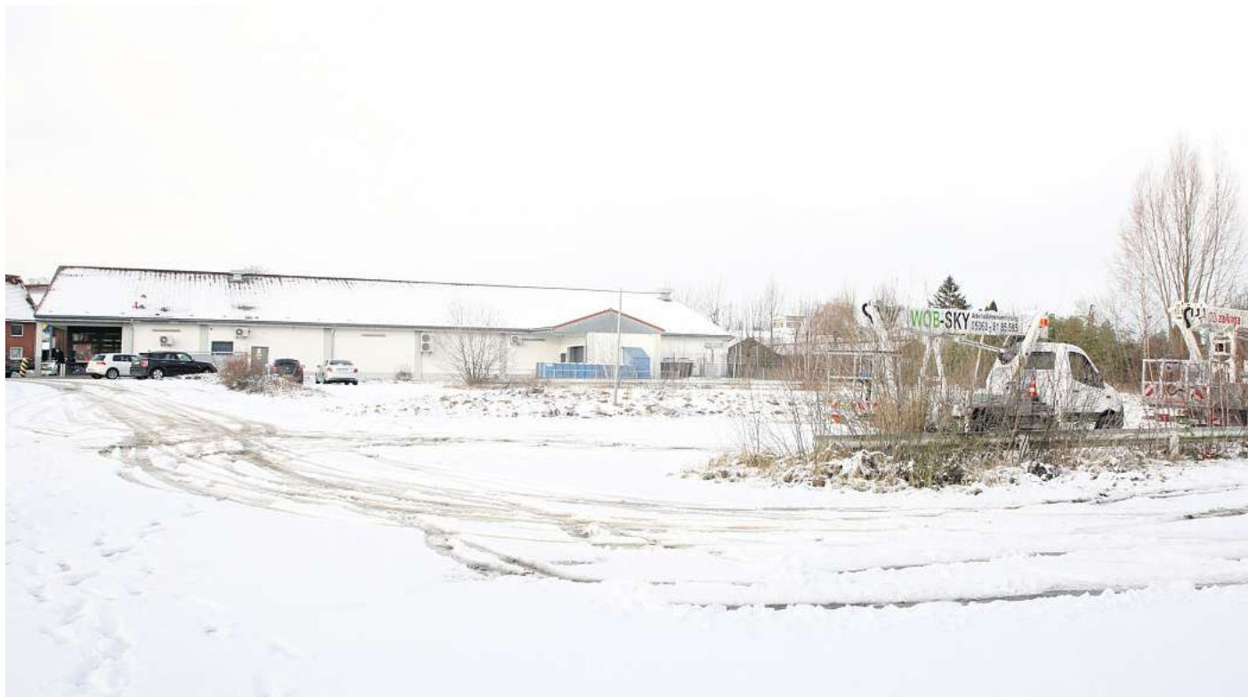
Entsteht hier das neue Eingangstor zum Drömling? Der Ortsrat äußert sich zu den Vorschlägen des NABU Wolfsburg.

Allerdings gehen die Meinungen zwischen der Politikseite und den Naturschützern bei der Platzwahl auseinander. „Ob mit dem vom NABU vorgeschlagenen Standort auf der Parkplatzfläche An der Meine eine richtige Verortung gefunden ist, ist allerdings fraglich“, führt Straube an und bezieht sich auf den Weg, der zum Niederungsgebiet beschritten werden muss. „Denn um von dort in den Drömbling zu kommen, müsste erst einmal eine nicht unerhebliche Strecke entlang der Aller und des Wasserverbands zurückgelegt werden, bevor dann am Ende eines kilometerlangen Feldweges die Aller überquert werden kann und man sich dann im eigentlichen Drömbling befindet.“ Daher präferiere die Ortsbürgermeisterin einen anderen Standort für das Eingangstor zum Drömbling: „Ich würde einen Standort in der Südstadt wesentlich sinnvoller