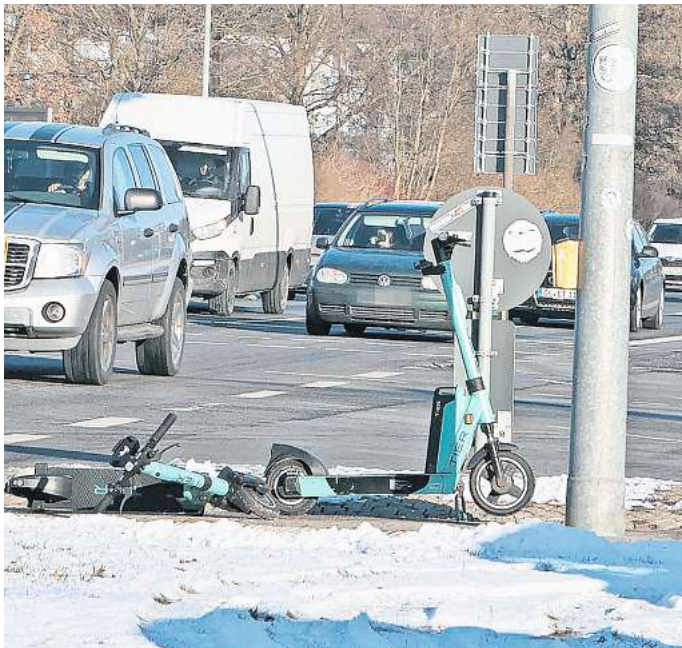
Rücksichtsloser geht es kaum: Im Weg liegende E-Scooter an einer Ampel an der B188.

Anfang Januar hatte es ein Treffen mit Vertretern von E-Scooter-Verleihern, Verwaltung und Ortsratsvertretern gegeben,