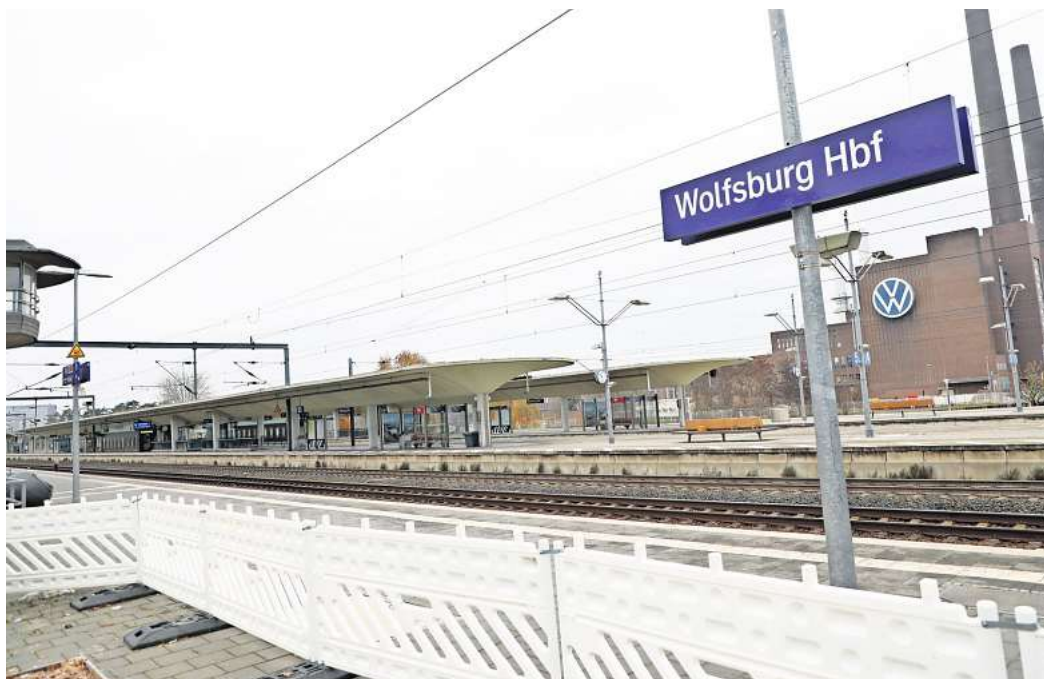
Es trifft auch Berufspendler und Reisende: Die Lokführergewerkschaft hat zum sechstägigen Bahnstreik aufgerufen.

Direkt zur Umfrage: Einfach den QR-Code mit dem Handy scannen.