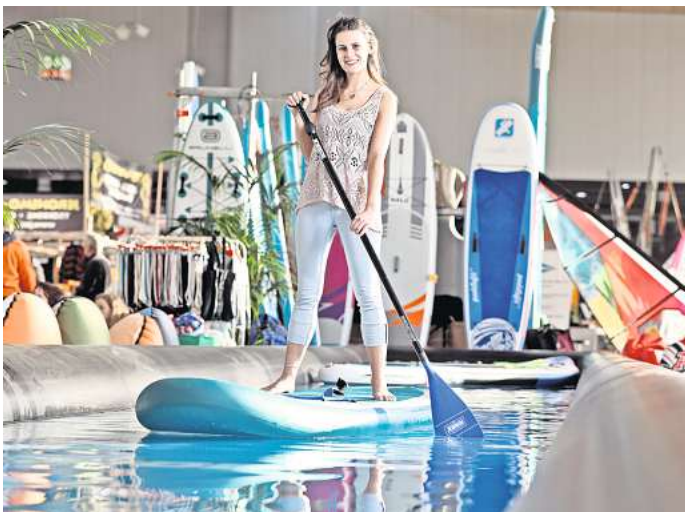
Die ABF präsentiert vielfältige Inspirationen für die aktive Freizeitgestaltung.

Beliebte Freizeitmesse startet am 31. Januar in Hannover