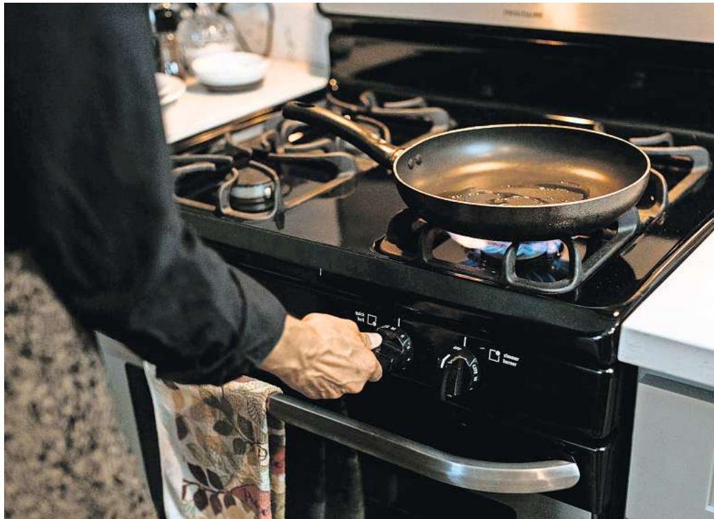
Die Versorgung mit Erdgas ist in diesem Winter gesichert, selbst wenn es noch mal bitterkalt werden sollte.

Das Angebot ist derzeit größer als es erwartet wurde. Die USA sind im vergangenen Jahr zum weltgrößten Exporteur geworden. Ein Großteil geht nach Europa. Der wichtigste Versorgungsstrang für Deutschland ist aber Norwegen, das Methan über Pipelines nach Süden pumpt. Russisches Gas wird zwar nicht mehr direkt nach Deutschland eingeführt, für den europäischen Markt ist es aber