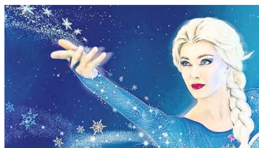
„Die Eiskönigin – Die Musik-Show auf Eis“ ist am Samstag im CongressPark zu erleben.

Am kommenden Samstag erleben die Zuschauer gemeinsam mit den Schwestern Anna und Elsa sowie ihren Gefährten eine abenteuerliche, musikalische Reise, die auf wunderbare Weise aufzeigt, welche wichtigen Rollen Liebe, Freundschaft und Tapferkeit im Leben spielen. Die eindrucksvoll inszenierte Eisshow bringt die Geschichte der erfolgreichen „Frozen“-Animationsfilme nun auf die europäischen Bühnen – beziehungsweise aufs Eis. Gänsehaut-Stimmung bei Elsas „Lass es los!“, lustige Momente bei Olafs „Im Sommer“ oder sentimentale Gefühle bei Annas „Willst du einen Schneemann bauen“: