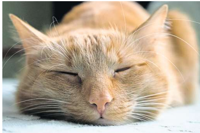
Wenn die Musik die Seele der Samtpfote sanft streichelt.

Bei diesen Klängen entspannen Samtpfoten