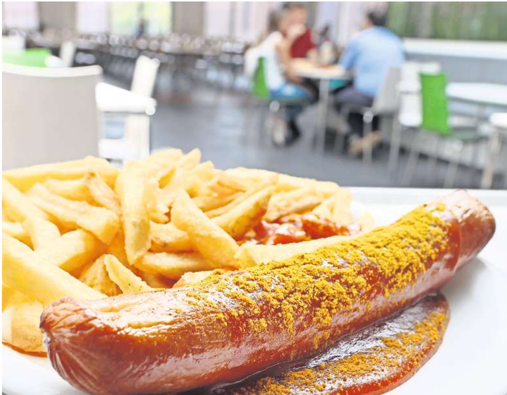
Verkaufsschlager VW-Currywurst: Sie soll ab Februar ebenfalls teurer werden, wird aber bezuschusst, sodass die Beschäftigten immer noch einen moderaten Preis zahlen.

Um die Qualität der Lebensmittel weiterhin gewährleisten zu können, „werden die Preise