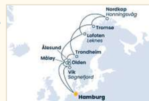
Beispielroute für die Abfahrt am 25.05.2024