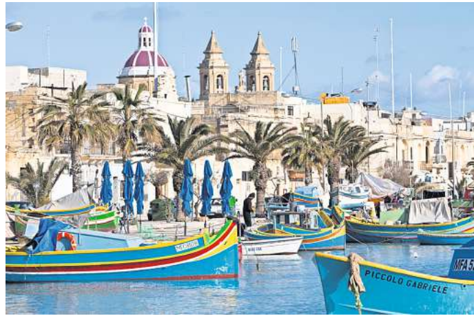
Maltesische Hafenidylle: Im Hafen von Marsaxlokk liegen bunte Fischerboote.

Ganz gleich, zu welcher Jahreszeit man nach Irland reist: Regen ist ein ständiger Begleiter. Bei