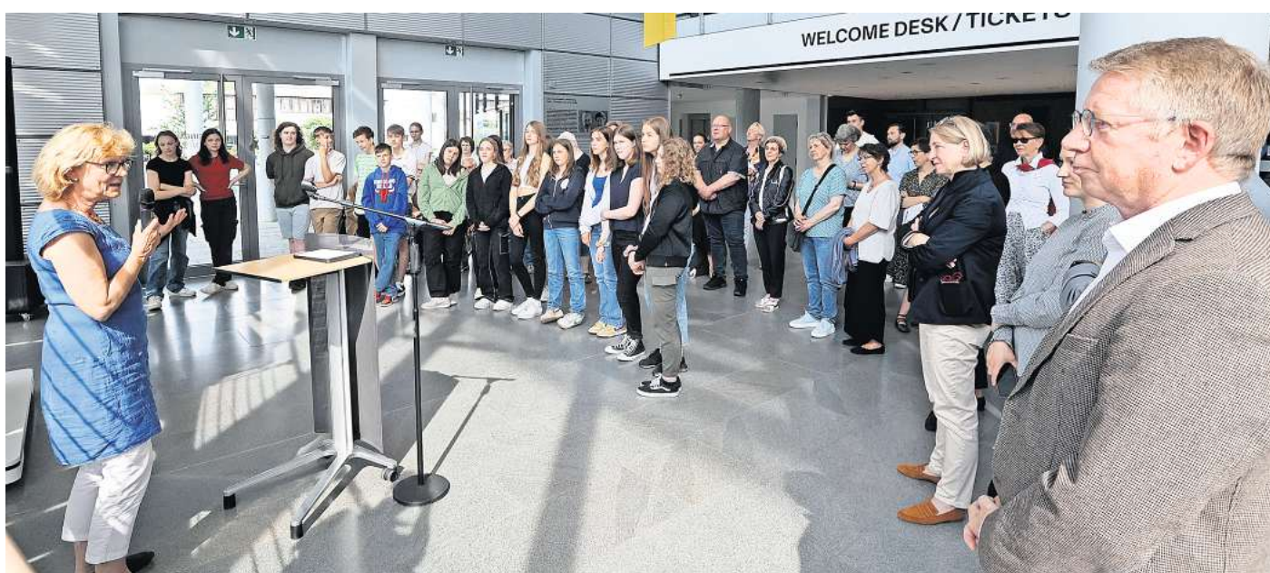
Das Kunstmuseum Wolfsburg soll ein Ort für alle sein. Deshalb ist der Eintritt für junge Menschen unter 18 Jahren ab sofort frei.

„Das Kunstmuseum Wolfsburg steht für eine besonders professionelle Kunstvermittlung. Mit dem freien Eintritt für Menschen bis 18 Jahre will Volkswagen nun einen weiteren Schritt gehen. Kindern und Jugendlichen frühzeitig einen Zugang zu kultureller Bildung und zu Erlebnissen mit Kunst und