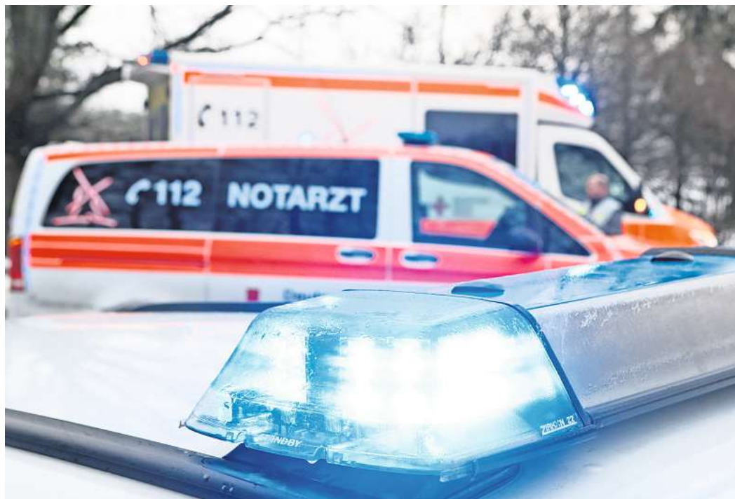
Berauscht am Steuer einen Unfall bauen: In der Wochenumfrage geht es um eine Verschärfung der Strafen für jene, die alkoholisiert oder unter Drogen mit einem Fahrzeug unterwegs sind.