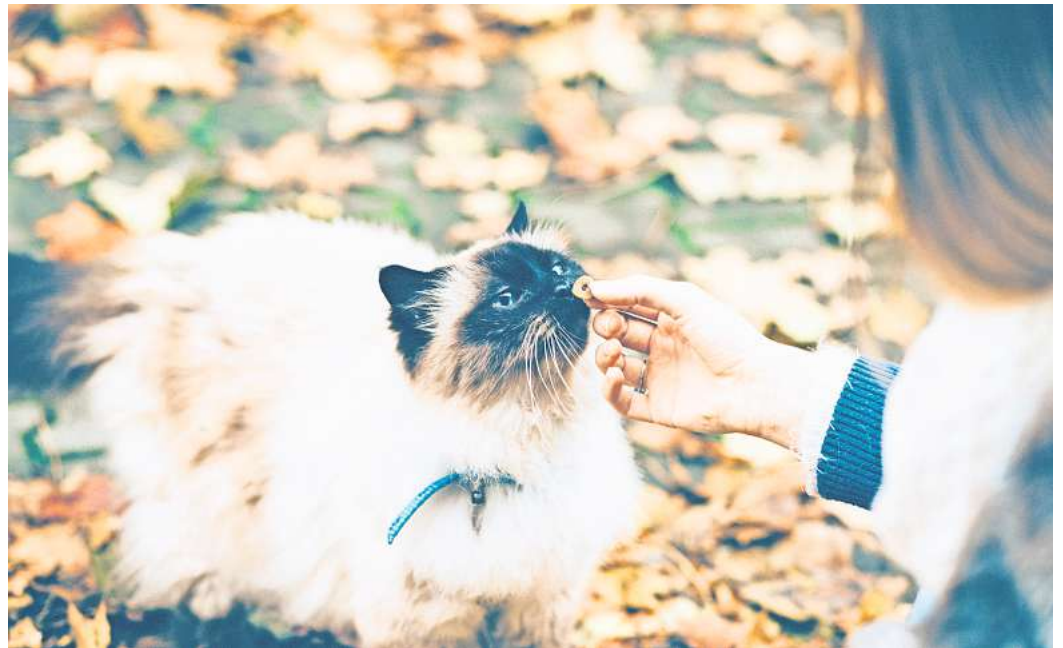
Katzenleckerlies: Die Belohnung für zwischendurch.

Wer seiner Mieze kleine Tricks beibringen will oder Klickertraining macht, merkt wahrscheinlich selbst, dass kleine Naschis dem ganzen Prozedere erheblich helfen. Aber natürlich gibt es die Leckerlis auch mal einfach so, weil die Samtpfote sie eben gerne futtert. Muss man deshalb jetzt ein schlechtes Gewissen haben? „Wer seine Katzen liebt, kommt, glaube ich, nicht drumrum, ihnen Naschis zu geben, weil es natürlich auch was ist, was uns sehr glücklich macht“, lacht die Ernährungsberaterin. „Worauf ich viel Wert lege ist, dass ich weiß, wo es herkommt – also so weit es geht.“ Ein Blick auf die Zutatenliste der Leckereien oder selbstgemachte Naschis sind für