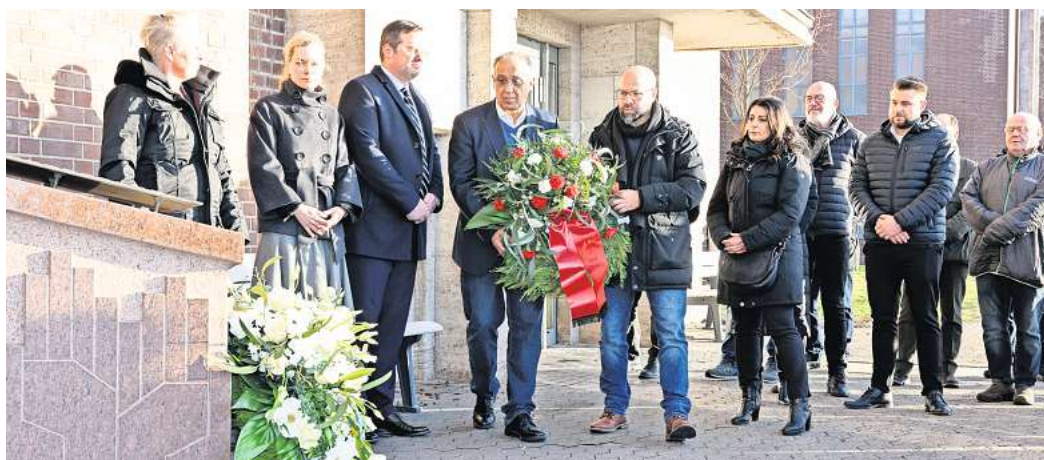
Der Volkswagen-Konzern gedachte der Opfer des Nationalsozialismus.

Dazu gehört auch die Geschichte vieler verschleppter Kinder. Eine Ausstellung im Bundestag setzt sich mit dem