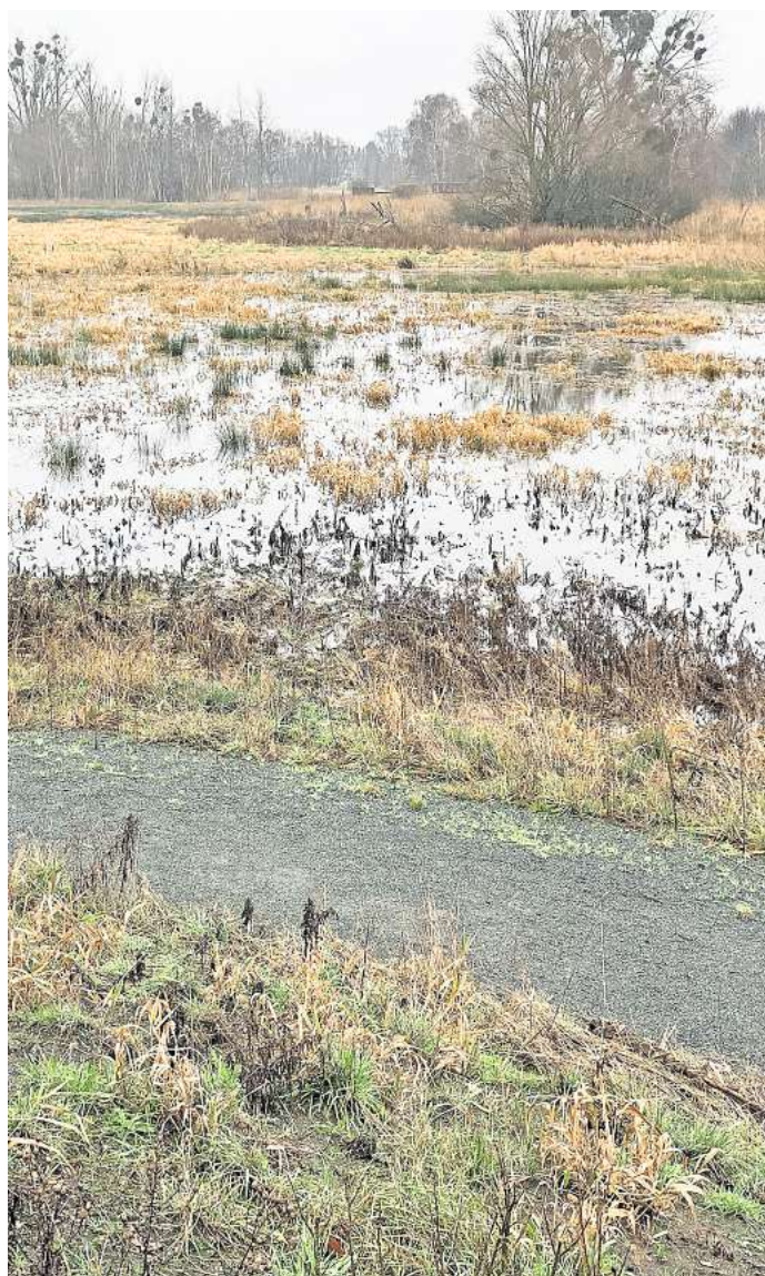
Die Renaturierung der Aller zwischen der Eishalle und Vorsfelde spielt in diesem Winter ihre Vorzüge in Sachen Hochwasserschutz voll aus.

Abschließend hat Kühn noch einen Tipp für Haus- und Grundstücksbesitzer: „Jeder entsiegelte Quadratmeter Fläche hilft dabei, die Klimafolgen erträglicher zu machen.“