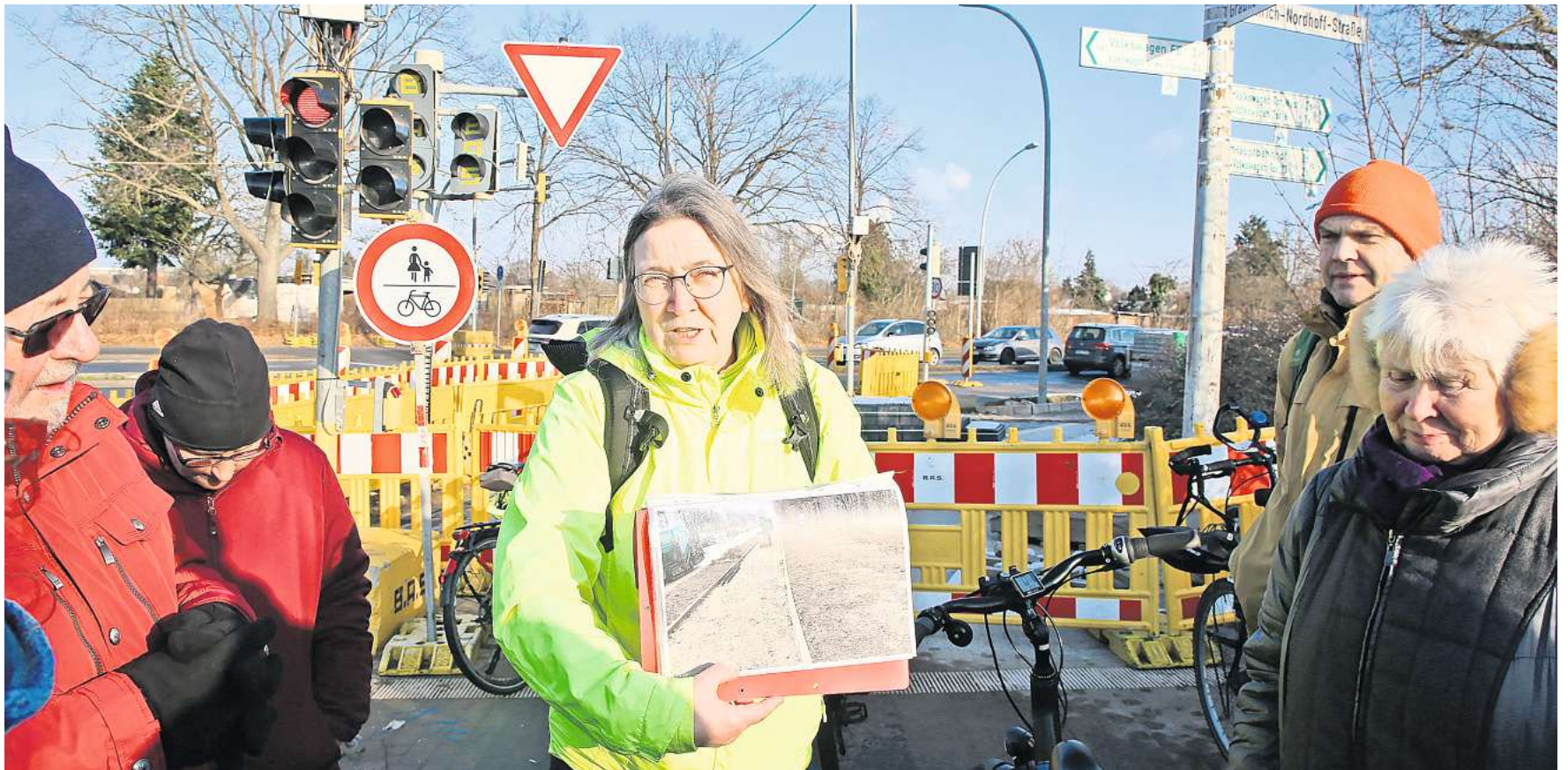
„Gelegenheiten nicht verstreichen lassen“: Vertreter von ADFC, BUND und VDC Wolfsburg fordern einen breiteren Radweg an der Nordhoff-Straße.