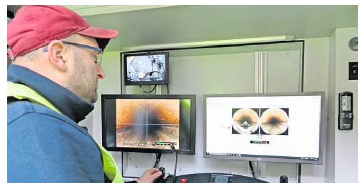
Kamera-Untersuchung im Abwasserkanal: Die Wolfsburger Entwässerungsbetriebe suchen nach möglichen Falschanschlüssen ans Kanalnetz.

Partner im RedaktionsNetzwerk Deutschland