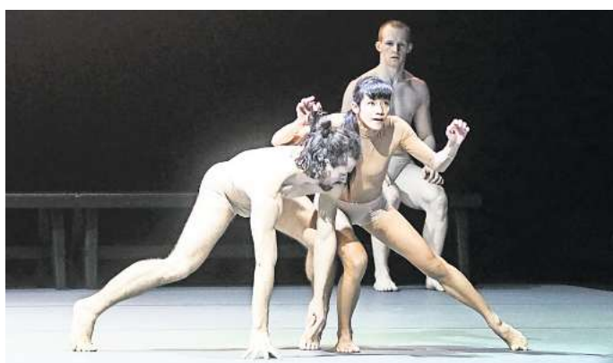
Das Hessische Staatsballett war mit zwei Ballett-Produktionen zu Gast im Wolfsburger Scharoun-Theater.

Zur Chormusik von zeitgenössischen Komponisten (Jóhannsson, Lang, Skempton, Whitacre, Pärt) werden Lebensstationen der Tanzenden sichtbar. In ausdrucksstarken Solo-