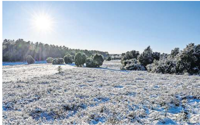
Wenige Menschen, ganz viel Natur und so manche Attraktion machen die Lüneburger Heide zu einer beliebten Winterdestination.

Über die Heideschleife Wilseder Berg wanderst du zur höchsten Erhebung in der Lüneburger Heide. Auf der knapp 15 Kilometer langen Wanderung erlebst du die Heidelandschaft in ihrer vollen Pracht. Der Weg führt zum Turmberg mit schönem Ausblick auf das Heidetal und passiert auch den Talkessel Totengrund, der zu den beliebtesten Fotospots der Lüneburger