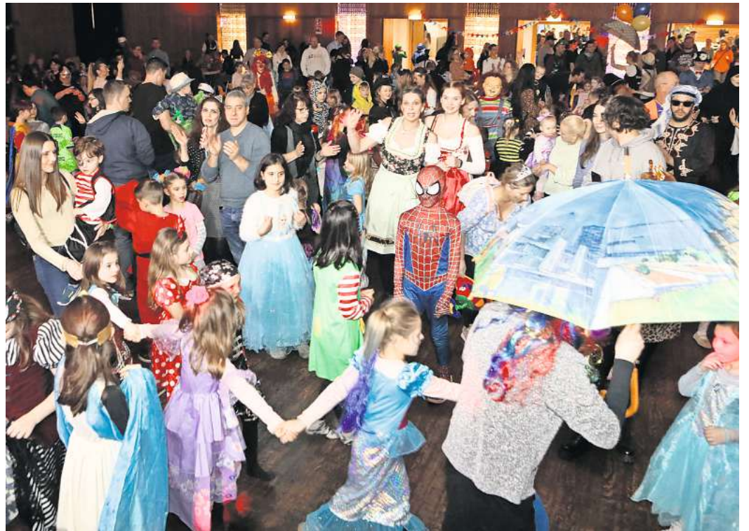
Da bebte der CongressPark: Hunderte bunt kostümierte Jungen und Mädchen feierten im vergangenen Jahr gemeinsam mit ihren Eltern ein fröhliches Faschingsfest.

Für kindgerechte Stärkungen sorgt das Team des CongressParks. Die Eintrittskarten zum Preis von 7 Euro gibt es über tickets.waz-online.de sowie auch am Veranstaltungstag an der Tageskasse vor Ort.