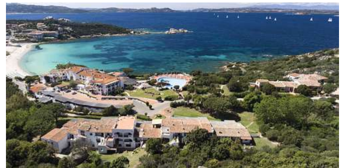
Viele außergewöhnliche Hotelerlebnisse - wie hier das 5* Hotel La Bisaccia auf Sardinien - lassen sich in allen Urlaubsgebieten buchen.

Wie in allen Zielen steht ein umfangreiches und vielfältiges Hotelangebot zur Buchung bereit. Vom Budget bis zum Flair-Hotel. Von Frühstück bis "All Inclusive" oder von Top-Lage bis zum Luxus-Domizil. So findet jeder Gast sein persönliches Angebot. Alle Hotels sind persönlich getestet und äußerst beliebt. So ist vom Badeurlaub bis zur Erlebnisreise alles möglich.