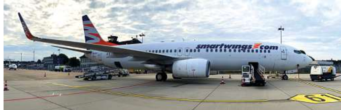
Fliegen ab Braunschweig mit momento by DER SCHMIDT ist ein exklusives Erlebnis

Den Katalog, weitere Informationen und Buchungsmöglichkeit dieser exklusiven Angebote unter www.fliegen-ab-braunschweig.de , im FIRST Reisebüro Schmidt und weiteren Reisebüros oder unter der kostenfreien (aus dem dt. Festnetz) Buchungshotline T. 08 00 / 38 300 38 (Mo.-Fr. 9-18, Sa. 9-13 Uhr).