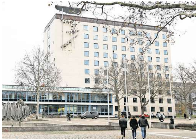
Die Stadtverwaltung Wolfsburg sucht eine Mitarbeiterin oder einen Mitarbeiter für die Dialogstelle Radikalisierungsprävention und Demokratieförderung.

Die vakante Stelle kann zum nächstmöglichen Termin besetzt werden und ist unbefristet. In der Stellenausschreibung steht: „Auch in Wolfsburg ist Radikalisierung in vielerlei Gestalt eine gesellschaftliche Herausforderung für das demokratische Grundverständnis unserer Gesellschaft.“ Die Förderung des