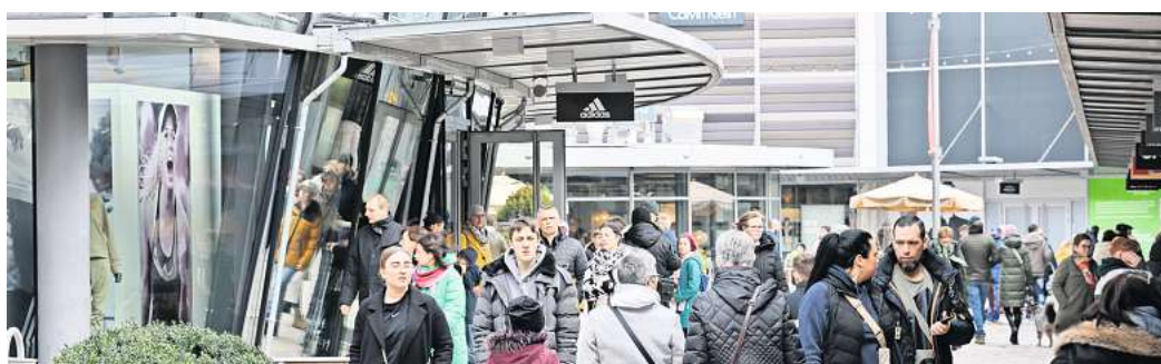
Designer Outlets Wolfsburg: Mit 2,7 Millionen Besuchern wurde das umsatzstärkste Jahr seit der Eröffnung verzeichnet.

„Unser Angebot orientiert sich daran, welche Marken auf den Wunschzetteln unserer Gäste stehen. So, wie sich auch die Mode stets neu erfindet, passen wir unser Angebot permanent an und machen Platz für neue Brands“, skizziert Ernst. Dabei blicke man positiv auf das aktuelle Jahr und wolle weitere Investitionen im Center vornehmen, um die Verweildauer von Besuchern zu erhöhen. Außerdem wollen die DOW nachhaltiger wirtschaften. „Nachdem wir bereits in den vergangenen Jahren