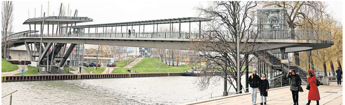
Soll zeitgemäßer und ökologischer werden: Die Stadtbrücke wird in den nächsten eineinhalb Jahren modernisiert.

Die gute Nachricht: Das Überqueren der Brücke ist während der Bauarbeiten weiterhin möglich, Passanten müssen durch die abschnittsweise erfolgende Modernisierung allerdings mit Teilsperren rechnen. „Diese Teil-