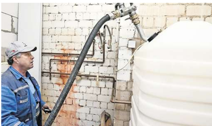
Wer eine Heizölanlage besitzt, sollte diese regelmäßig kontrollieren lassen.

Die Untere Wasserbehörde wiederum prüfe die Berichte und könne gegebenenfalls weitere Schritte einleiten. Dazu würden beispielsweise auch zusätzliche Prüfungen, die die Behörde anordnen kann, gehören. „Grundsätzlich ist die betreibende Person auch ohne gesonderte Aufforderung der Behörde verpflichtet, Mängel an ihrer Heiz-