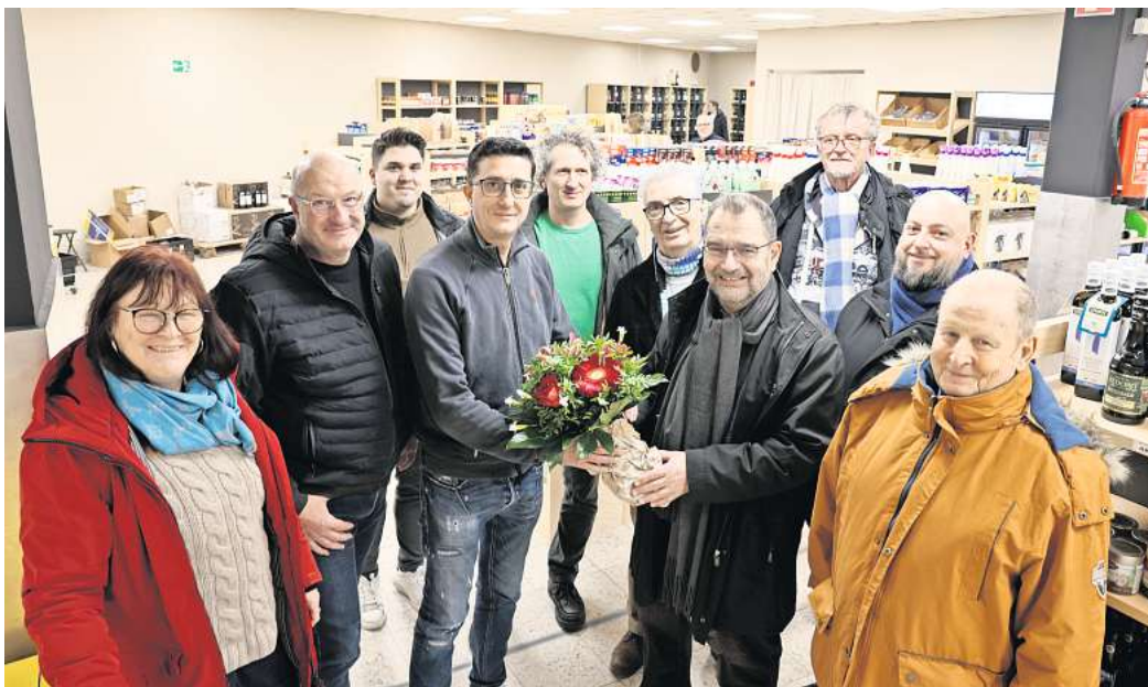
Der Ortsrat Mitte-West freut sich über die vielen italienischen Spezialitäten, die die „Bottega del Gusto“ zu bieten hat.