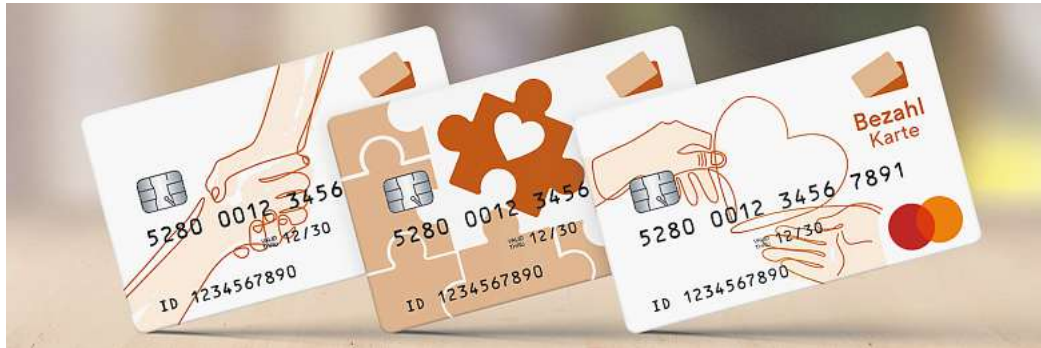
Bezahlkarte für Flüchtlinge: Niedersachsen rechnet mit dem Start im Sommer oder Herbst.

Wolfsburg. In diesem Jahr soll die Bezahlkarte für Flüchtlinge in Niedersachsen starten. Kommunen wie die Stadt Wolfsburg versprechen sich von der Bezahlkarte für Flüchtlinge weniger Personalaufwand. Momentan erfolgen Auszahlungen mithilfe der Kassenautomaten der Stadt. Das Wolfsburger Sozialamt hat laut der Verwaltung im vierten Quartal 2023 etwa 600 Auszahlungen über den Kassenautomaten mit einem Volumen von rund 260.000 Euro durchgeführt.