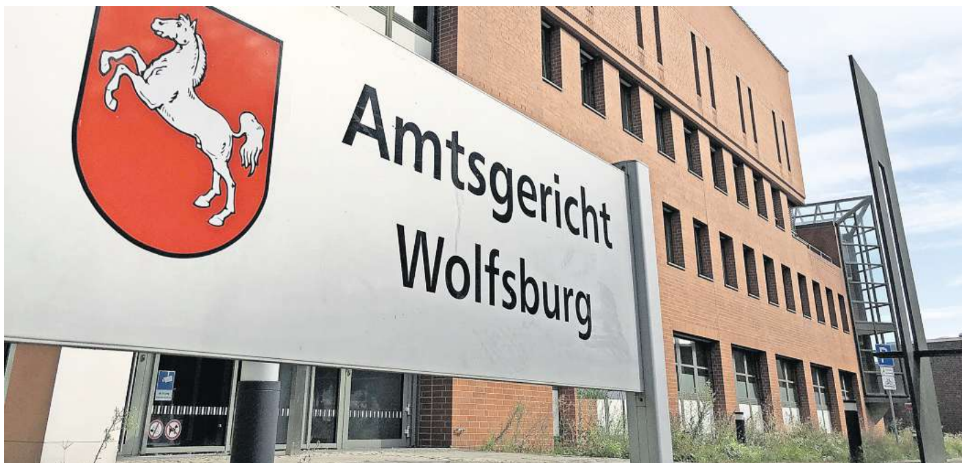
Nichts gelernt hat offenbar ein 28-jähriger Wolfsburger, der vom Amtsgericht Wolfsburg zum zweiten Mal wegen Belästigung derselben Frau verurteilt wurde.

Die 25-jährige Freundin sagte vor Gericht ebenfalls als Zeugin aus. Sie berichtete, wie aufgelöst die 28-Jährige gewesen sei.