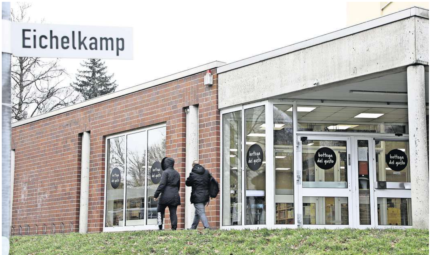
Nach der Schließung des Nahkauf-Marktes gibt es am Eichelkamp jetzt ein neues Geschäft.