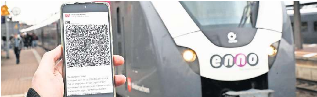
Online oder abfotografiert? Screenshots vom Deutschland-Ticket gelten nicht, denn sie können falsch sein – und sind es zuweilen auch.

Gifhorn/Wolfsburg. Zehntausende Pendler zwischen Peine, Gifhorn und Wolfsburg sind inzwischen mit dem Deutschland-Ticket (D-Ticket) unterwegs. Nicht alle Passagiere allerdings auf die ehrliche Tour. Immer wieder bekommen Schaffner falsche D-Tickets auf Smartphone-Displays an ihre Scanner gehalten. In der Regel handelt es sich dabei um Screenshots, also vom Bildschirm abfotografierte D-Tickets, die grundsätzlich ungültig sind. Das müssen auch ehrliche Abonnenten berücksichtigen,