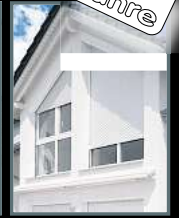
Fenster & Rollläden Schiebeanlagen Faltanlagen

V. Gloger Direktförderung ohne komplizierte Antragstellung auf alle Produkte mind. 22% FÖRDERUNG