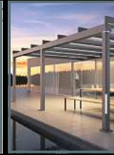
Terrassen- überdachungen Wintergärten Markisen