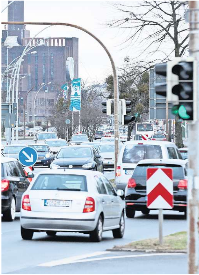
Nächste Baustelle steht an: Im Sommer wird auf dem Abschnitt der Heinrich-Nordhoff-Straße zwischen Lessingstraße und Saarstraße der Asphalt saniert.