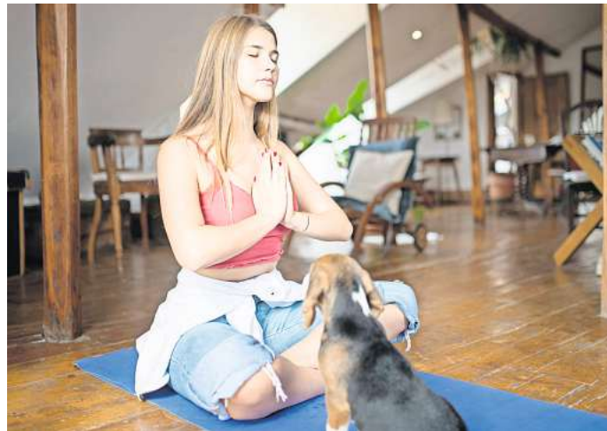
Puppy Yoga als Wellnesstrend aus den USA ist auch in Deutschland angekommen.

Der Trend fing zunächst in den USA an und sorgte auch in Großbritannien für Begeisterung. Die Idee hinter dem Puppy Yoga ist ganz einfach. Ein gewöhnlicher Kurs wird mit der Anwesenheit einiger Welpen zu einem besonderen Erlebnis und soll sogar für mehr Entspannung sorgen. Die Welpen, die beim Puppy-Yoga nach Lust und Laune durch das Studio toben können, haben angeblich einen positiven Aspekt auf die Teilnehmer, berichtet die Webseite „Yoga Basics“. Die klei-