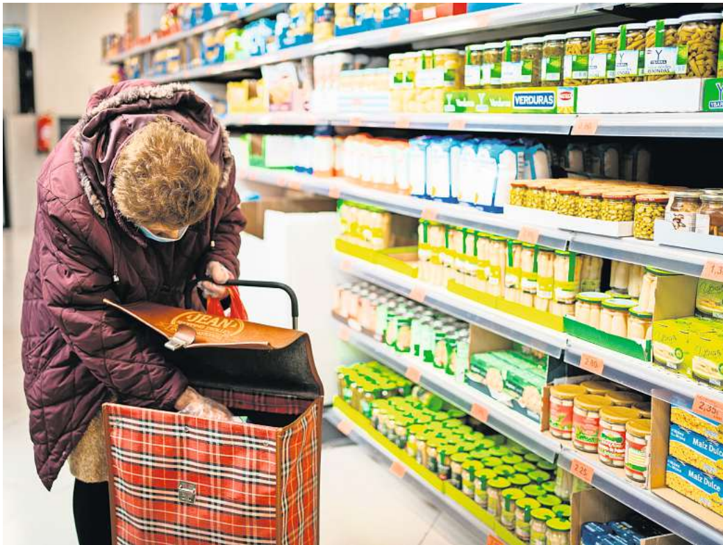
Hohe Lebensmittelpreise trotz sinkender Energiekosten: Nahrungsmittel sind zum Treiber der Inflation geworden.

Einerseits ist zu erkennen, dass die Preise inzwischen langsamer steigen als noch vor einigen Monaten. Andererseits verweisen Experten darauf, dass Nahrungsmittel und ihre Vorprodukte zunehmend stärker in den Weltmarkt integriert sind. Zum Beispiel beim Zucker: Die Notierungen an den Rohstoffbörsen sind enorm hoch. Im Dezember erreichten sie Rekordwerte. Das schlägt nun auf Süßwaren durch. Dazu beitragen dürfte, dass die weltgrößten Zuckerrohranbauer Thailand und Brasilien ihre Exporte in die EU deutlich verringert haben, weil der Rohstoff vermehrt für die lukrative Er-