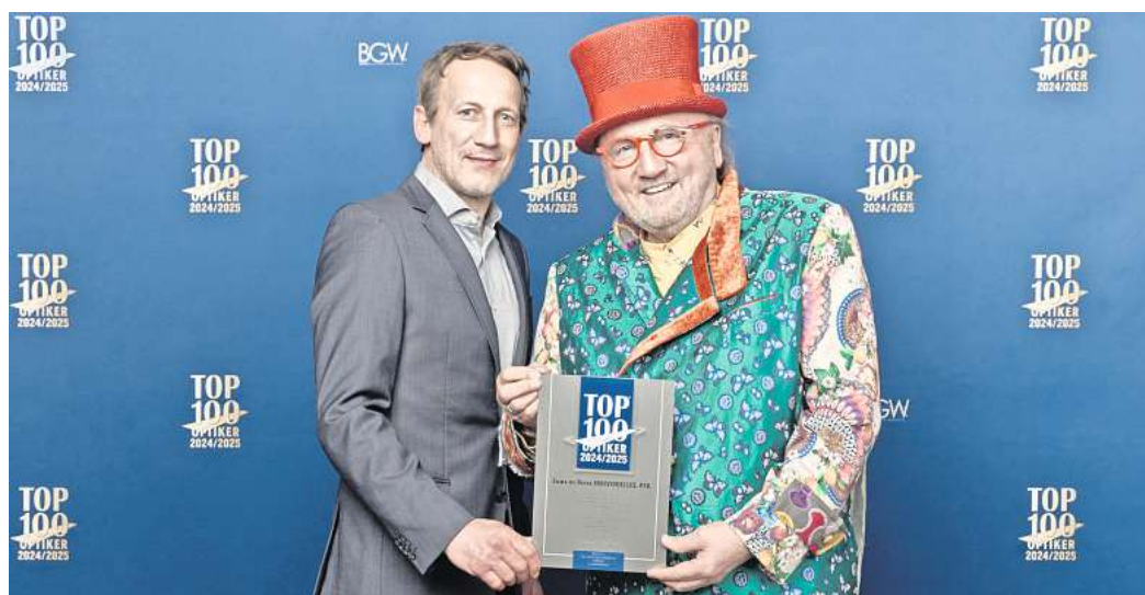
Erneut unter den Top 100 Optikern Deutschlands: Schauspieler Wotan Wilke Möhring (l.) übergibt dem Wolfsburger Ehme de Riese die Auszeichnung.

Wotan Wilke Möhring wird Ehme de Riese in Wolfsburg besuchen. Der Termin steht schon: Am 8. März holt der Schauspieler mit seinem Bruder Sönke die