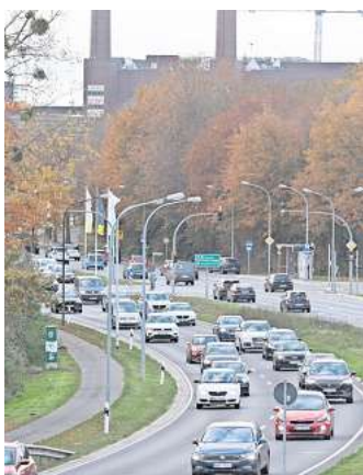
Wolfsburg ist die Stadt der Pendler.

Vertreter von VW und des Betriebsrates bündelten in dem Netzwerk zusammen mit der Stadt, der Wolfsburg AG und der Autostadt ihre Kräfte. Schon nach einem Jahr gab es erste Erfolge. Besonders der Shuttle für die Beschäftigten im VW-Werk gilt als absolute Erfolgsgeschichte. Am 15. Oktober 2012 rollte