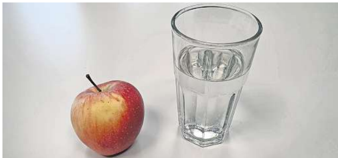
Fastenzeit: Obst und Wasser gehören hier für viele zur Standard-Ernährung.

% antworteten: „Nein, die Preise sind mir immer noch zu hoch.“