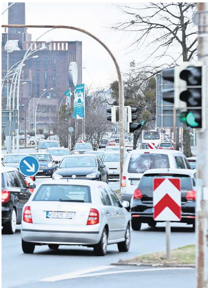
Nächste Baustelle steht an: Im Sommer wird auf dem Abschnitt der Heinrich-Nordhoff-Straße zwischen Lessingstraße und Saarstraße der Asphalt saniert.