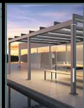
Terrassen- überdachungen Wintergärten Markisen