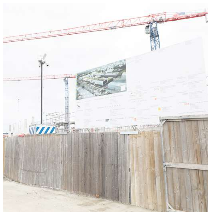
Neubau für neue Feuerwache: Der Plan für die zweite Feuerwache im Heinenkamp kommt auf den Prüfstand.

Kommune und die Bürgerinnen und Bürger eine ernsthafte Bedrohung darstellen können. Wer hätte beispielsweise vor fünf Jahren gedacht, dass uns in Kürze eine Pandemie erreichen und das öffentliche Leben lahmlegen wird? Ein durchdachter Masterplan für die Gefahrenabwehr ist daher unerlässlich, um eine Kommune sicher und ganzheitlich auf die Herausforderungen der Zukunft vorzubereiten“, unterstreicht Oberbürgermeister Dennis Weilmann (CDU).