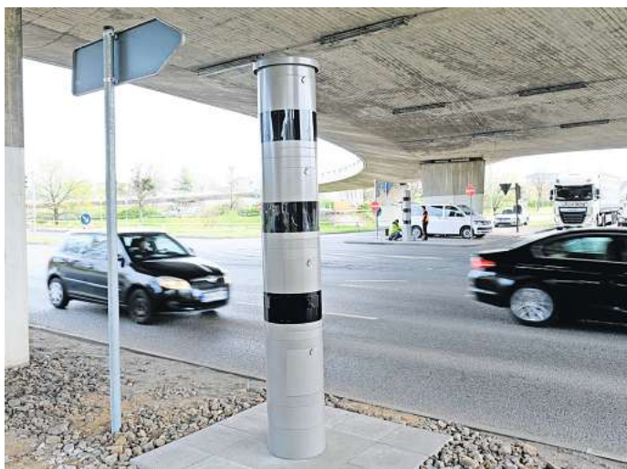
Blitzer am St. Annen-Knoten: Eine weitere Radarfalle soll nun die Geschwindigkeit messen.

Radarfalle kostet 135.000 Euro – Säule misst die Geschwindigkeit und erfasst auch Rotlicht-Verstöße