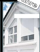
Fenster & Rollläden Schiebeanlagen Faltanlagen

V. Gloger Direktförderung ohne komplizierte Antragstellung auf alle Produkte mind. 22% FÖRDERUNG