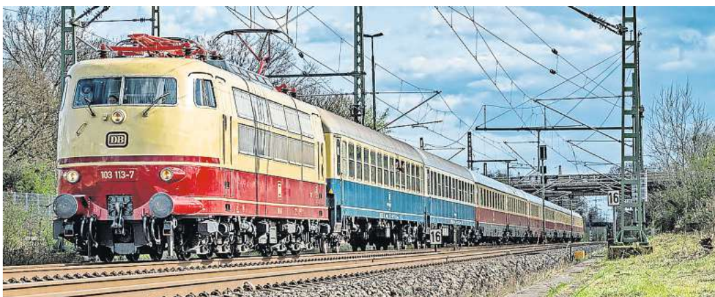
Die Bielefelder Eisenbahnfreunde fahren mit einem historischen Intercity nach Warnemünde. In Wolfsburg besteht eine Zustiegsmöglichkeit.