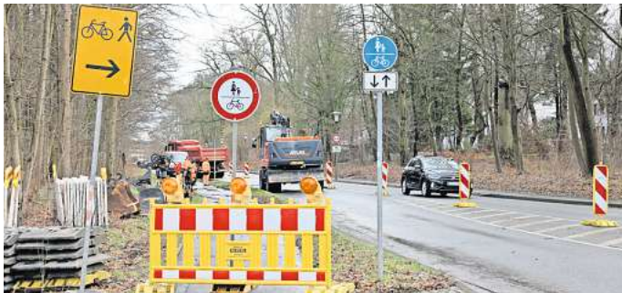
Nordsteimker Straße: Die Vorbereitungen für den Bau des Komfortadwegs haben am Montag begonnen.

Die Stadt hatte angekündigt, die Nordsteimker Straße stadtauswärts abschnittsweise sperren zu müssen. Der Plan: Der stadteinwärts fließende Verkehr soll aufrecht erhalten werden. Fahrzeuge im Fernverkehr, die aus der Innenstadt kommend Ziele im Osten ansteuern, sollen über eine Umfahrungsstrecke über den Berliner Ring, die Dieselstraße,