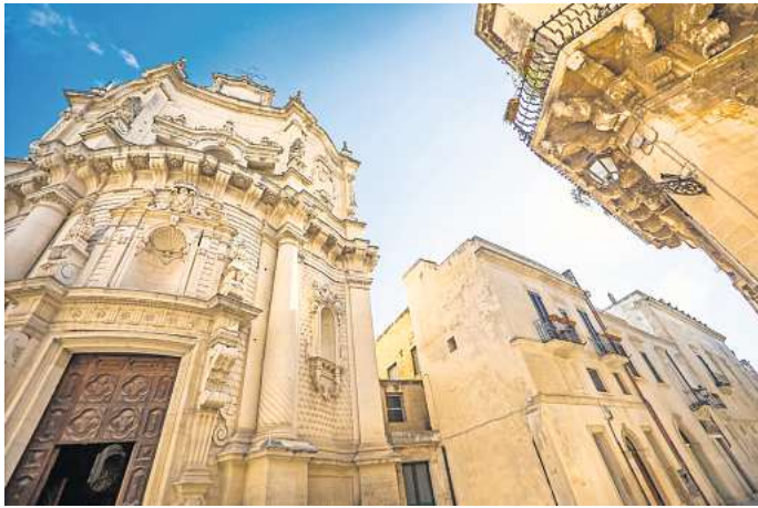
Die Stadt Lecce wird auch als „Florenz des Südens“ bezeichnet und ist ein echter Geheimtipp in Italien.

Der helle Kalkstein der Gebäude leuchtet leicht gilden in der Sonne und hüllt die Gebäude aus dem 16. bis 18. Jahrhundert in ein ganz besonderes Licht. Der weiche Tuffstein, Pietra di Lecce genannt, mit dem viele der Gebäude in Lecce erbaut wurden, ist besonders gut zu verarbeiten und oft mit kunstvollen Verzierungen versehen. In früheren Jahrhunderten wurde er in Milch getränkt, um ihn resistent gegen Umwelteinflüsse zu