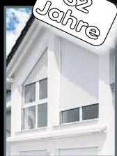
Fenster & Rollläden Schiebeanlagen Faltanlagen

V. Gloger Direktförderung ohne komplizierte Antragstellung auf alle Produkte mind. 22% FÖRDERUNG