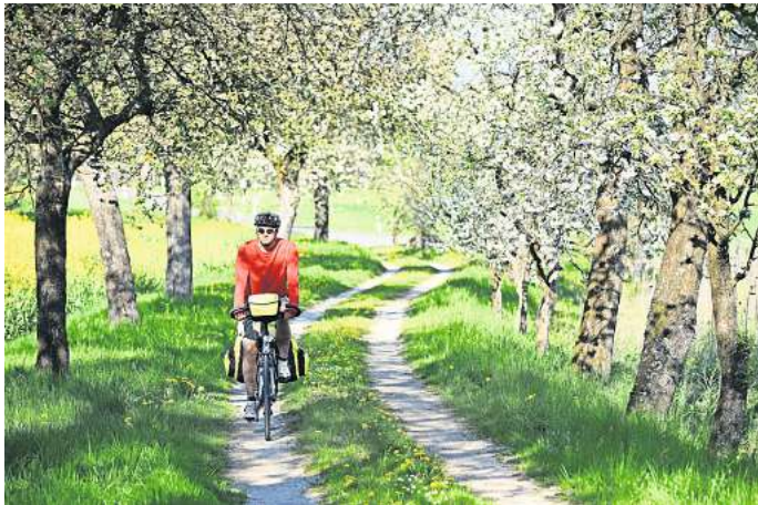
In der Fränkischen Schweiz erblühen jedes Frühjahr rund 250.000 Kirschbäume.

Das Alte Land in Niedersachsen, unweit von Hamburg, ist bekannt als größtes Obstanbaugebiet in Deutschland. Jedes Jahr