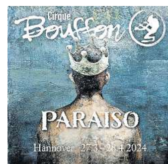
Gewinnen Sie Tickets für den Cirque Bouffon.

Wir verlosen unter allen Leserinnen und Lesern 15-mal zwei Tickets für die Vorstellung am 30. März 2024 um 19.30 Uhr! Was Sie dafür tun müssen? Gehen Sie auf unsere Online-Ge-