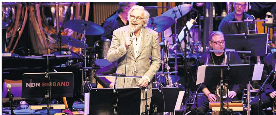
Sang die Lieder von Heinz Erhardt: Stefan Gwildis.