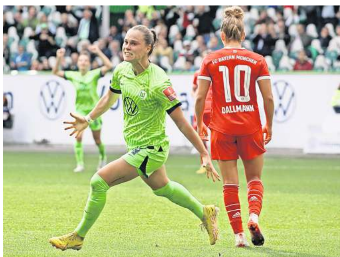
Grün-Weiß gegen Rot-Weiß: Für das Topspiel zwischen dem VfL Wolfsburg und dem FC Bayern werden 200 Tickets verlost.

Die Teilnahme ist über www.waz-online.de/FcBayern.de möglich. Gewinnspielberechtigt sind alle Personen ab einem Alter von 18 Jahren. Mitarbeitende sowie Angehörige der