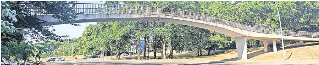
Der Termin für den Abriss der Theaterbrücke steht fest. Der Rückbau des maroden Bauwerkes soll am Wochenende 22. bis 24. März über die Bühne gehen.

Bereits ab kommendem Montag finden vorbereitende Maßnahmen statt. Der westliche Geh- und Radweg (Theaterseite) wird gesperrt. Auch auf der Ostseite (Tankstelle) muss der Radweg ge-