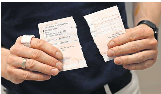
Das rosafarbene Papierrezept hat ausgedient: Seit Jahresanfang gibt es stattdessen das E-Rezept.

Patientinnen und Patienten, die ihre Verschreibung weiterhin lieber auf Papier erhalten möchten, haben einen Anspruch darauf, in der Arztpraxis einen Papiausdruck zu erhalten. Der Ausdruck enthält den Rezeptcode und kann in der Apotheke der Wahl eingelöst werden. Neben dem Code befinden sich für die Patienten sichtbar die Angaben zu den Medikamenten und gegebenenfalls Hinweise zur Einnahme.