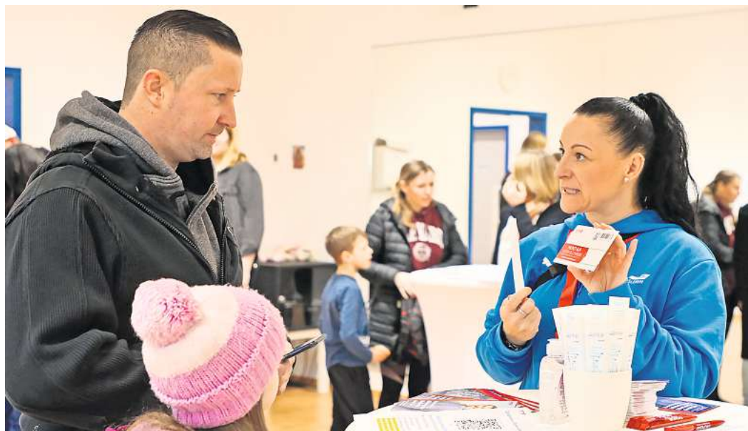
Eine Typisierungsaktion fand am Sonntag in Fallersleben statt.