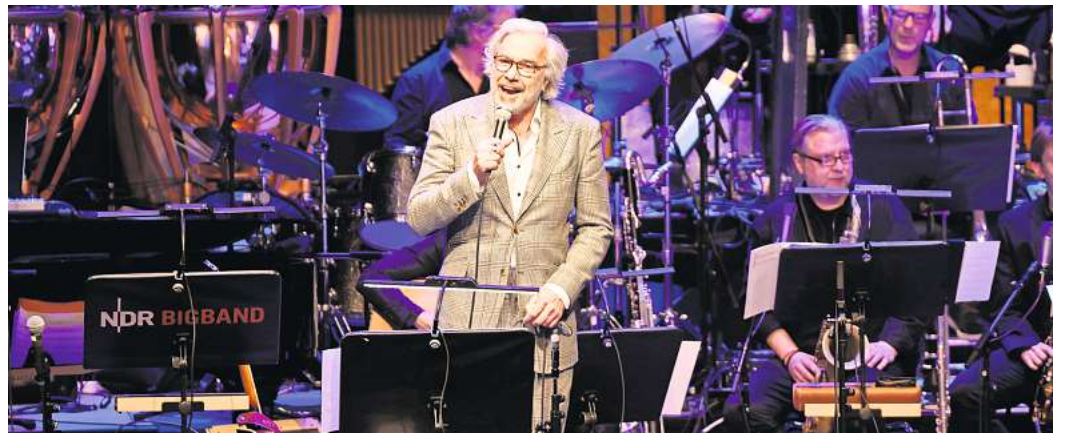
Sang die Lieder von Heinz Erhardt: Stefan Gwildis.