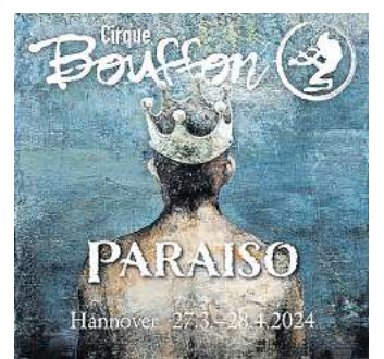
Gewinnen Sie Tickets für den Cirque Bouffon.

Wir verlosen unter allen Leserinnen und Lesern 15-mal zwei Tickets für die Vorstellung am 30. März 2024 um 19.30 Uhr! Was Sie dafür tun müssen? Gehen Sie auf unsere Online-Ge-