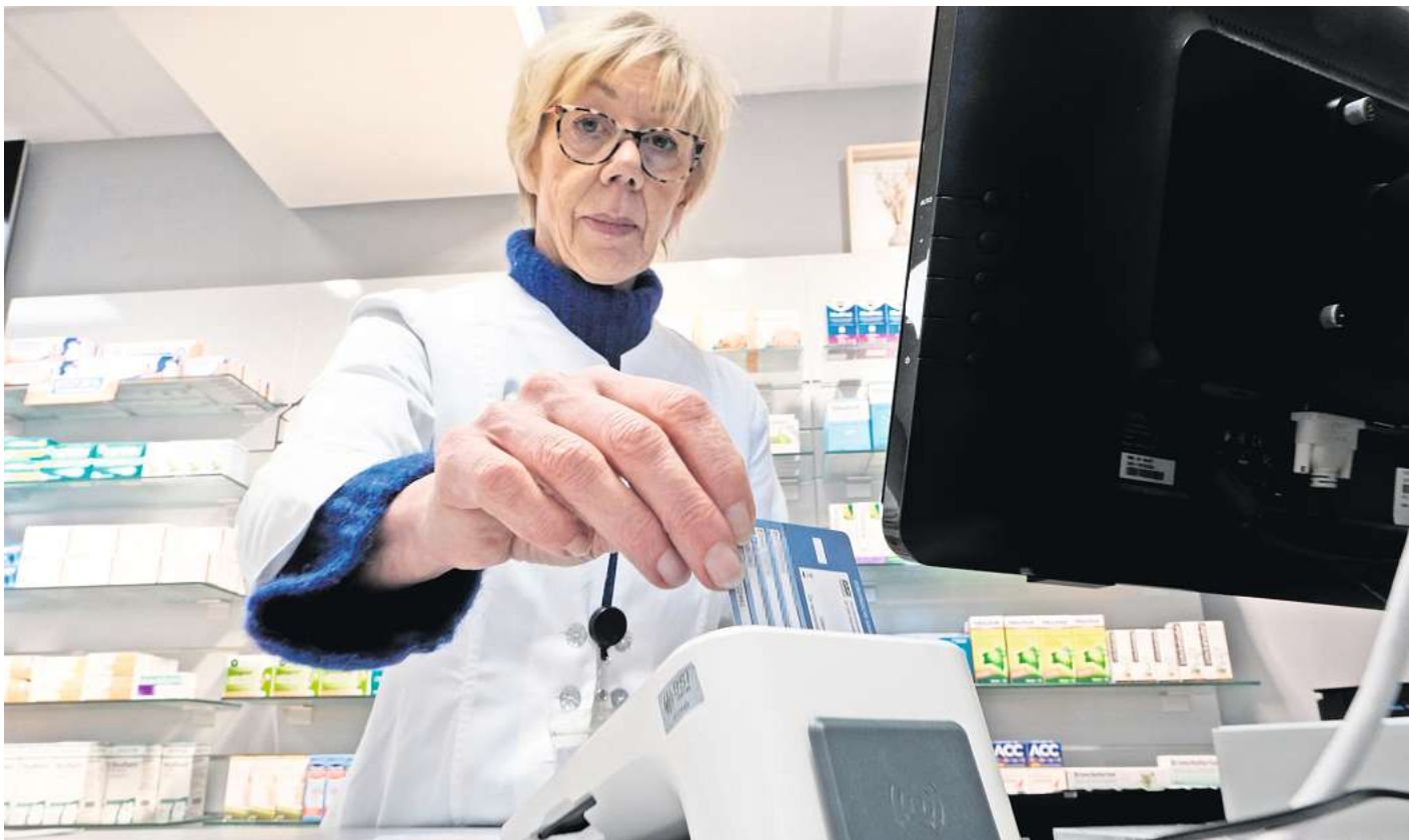
Trotz aller Neuerungen, eines bleibt doch gleich: Das E-Rezept wird weiterhin wie gewohnt in der Apotheke vor Ort eingelöst.

Die offizielle, werbefreie E-Rezept-App der Gematik ist kosten-