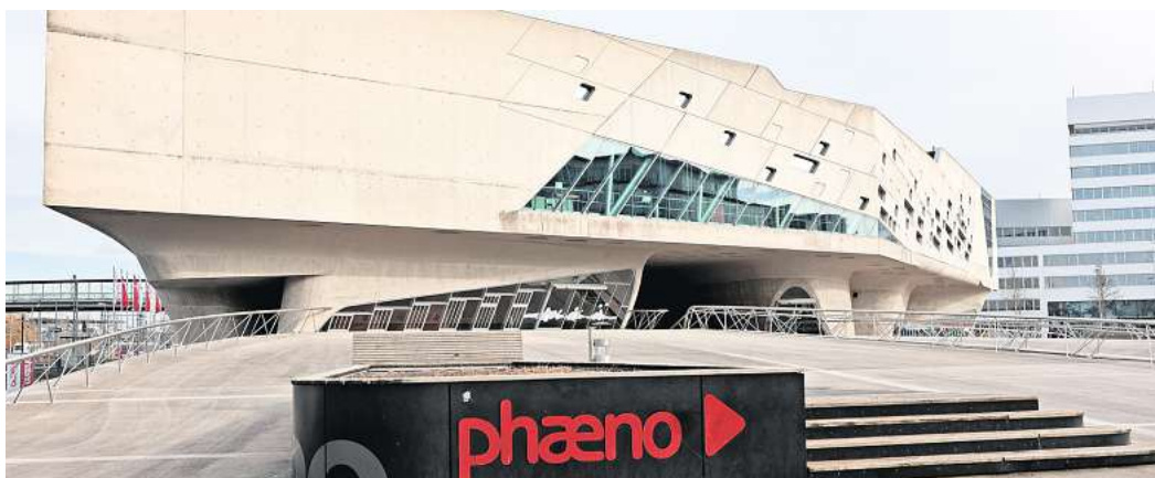
Auch das phäno ist Thema: Das Wolfsburger Online-Stadtquiz ist gestern gestartet.

Die WAZ und WMG laden Ratefüchse zum Mitmachen ein