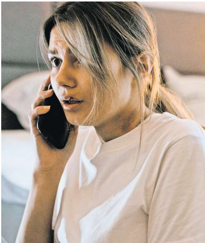
Seit Jahren fordern Opferverbände einen besseren Schutz für Frauen vor ihren gewalttätigen (Ex-)Partnern.

Zwei tote Frauen binnen acht Tagen, zwei Femizide. Statistisch gesehen ist in Deutschland zwischen den beiden Frauen noch eine weitere von ihrem Partner oder Ex-Partner getötet worden, weitere fünf Frauen haben, statis-