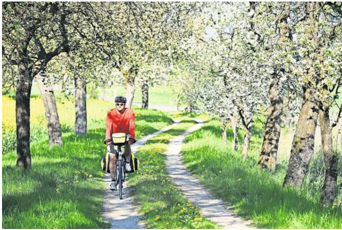
In der Fränkischen Schweiz erblühen jedes Frühjahr rund 250.000 Kirschbäume.

Das Alte Land in Niedersachsen, unweit von Hamburg, ist bekannt als größtes Obstanbaugebiet in Deutschland. Jedes Jahr