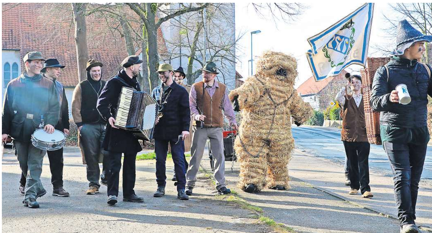
Mit Trommel, Akkordeon, Fahne – und natürlich Bärbel: Die Jungburschen zogen am Samstag durch Sülfeld.

Für die Beteiligten bedeutete das viel Arbeit im Vorfeld. Viermal traf man sich mehrere Stunden, um die Strohwürste zu wickeln. In der Nacht zum Samstag begann dann das Einkostümieren. Fast neun Stunden brauchte es, bis Bärbel, wie der Freiwillige genannt wird, fertig verpackt war. Wer wirklich in dem Kostüm steckte, blieb wie immer ein wohl gehütetes Geheimnis.