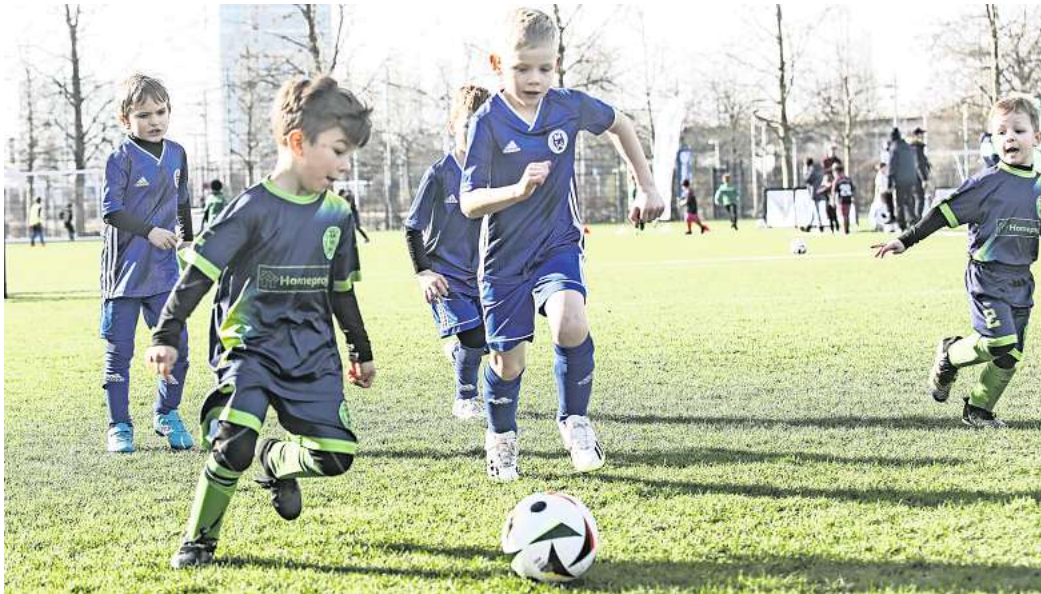
Auftakt der Kinderfußball-Tour: In Wolfsburg begeisterten sich am vergangenen Samstag rund 500 Kinder für das runde Leder.

Die weiteren Tourtermine bis zum Sommer sollen sich ähnlich dem Auftakt in Wolfsburg gestalten: An dem jeweiligen Tag findet ein großes Kinderfußball-Festival mit Amateurvereinen aus der Region und ihren Teams statt. Die genauen Einzelheiten legen die