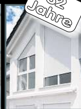
Fenster & Rollläden Schiebeanlagen Faltanlagen

V. Gloger Direktförderung ohne komplizierte Antragstellung auf alle Produkte mind. 22% FÖRDERUNG