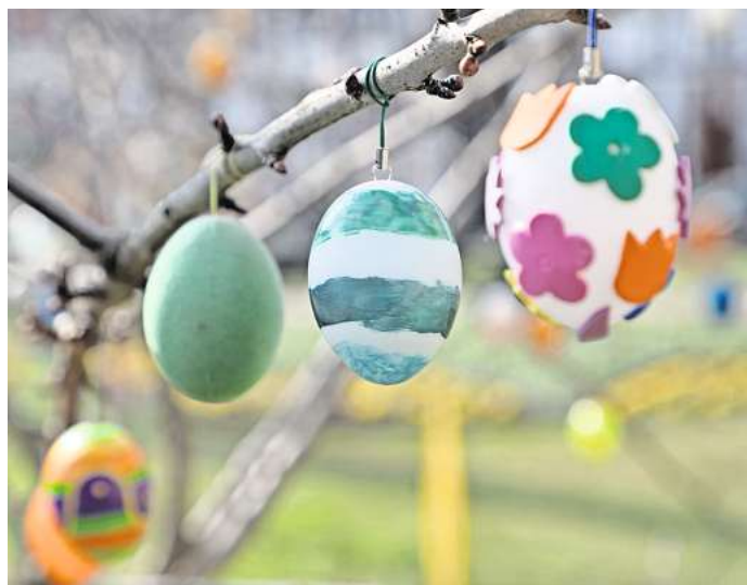
Ostern steht bevor: Was machen Sie an den Feiertagen?

Machen Sie mit und sichern Sie sich die Chance auf einen 50-Euro-Gutschein von Media-Markt