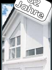
Fenster & Rollläden Schiebeanlagen Faltanlagen

V. Gloger Direktförderung ohne komplizierte Antragstellung auf alle Produkte mind. 22% FÖRDERUNG