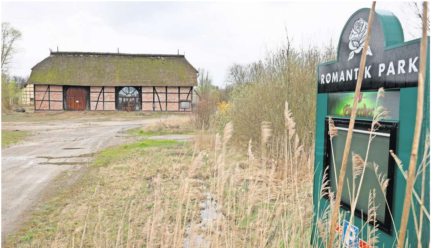
Der Eingang zum einstigen „Romantik-Park“: Das Gelände des Landlebens in Wolfsburg verfällt zusehends.