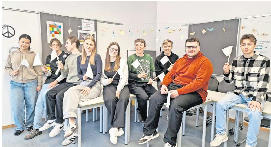
Schüler der Heinrich-Nordhoff-Gesamtschule in Wolfsburg befassten sich mit dem Thema Frieden.