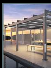
Terrassen- überdachungen Wintergärten Markisen