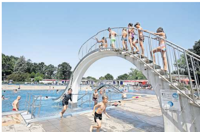
Die Temperaturen steigen: Im Mai startet die Badesaison in Wolfsburg.

Im Freibad Fallersleben und im VW-Bad sind die Tageskassen montags bis donnerstags von 6 bis 12.30 Uhr geöffnet, freitags, samstags, sonntags und an Feiertagen von 8 bis 19.15 Uhr. In den ersten vier Wochen nach der jeweiligen Bad-Eröffnung haben