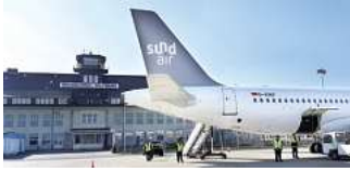
Fliegen ab Braunschweig bedeutet Urlaub ab der ersten Minute.

Ab dem Flughafen Braunschweig-Wolfsburg in den Urlaub zu starten ist fast wie ein Urlaub als VIP! Ohne lange Wartezeiten ganz entspannt in Richtung Sonne aufbrechen und die schönsten Urlaubsgebiete nonstop erreichen. Schnelle Abfertigung und Abheben fast ab Haustür machen je-