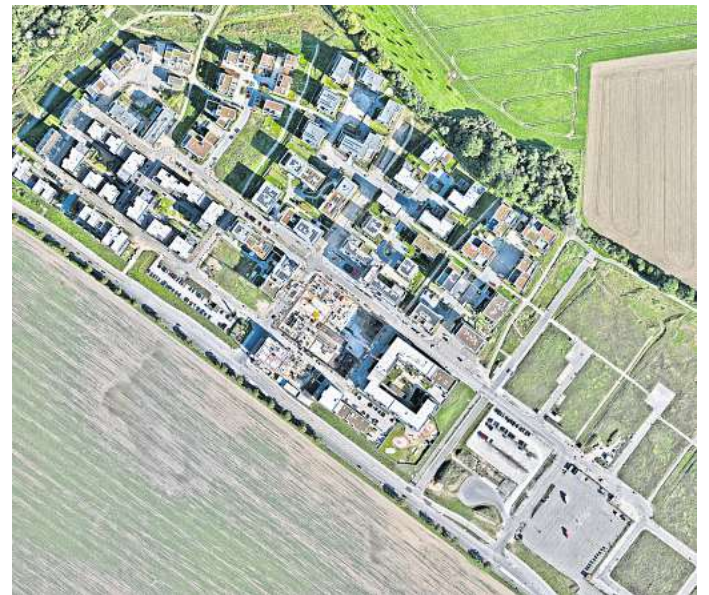
Die Steimker Gärten aus der Luft.

Der genaue Zeitpunkt für die Luftbildbefliegung stand bei Redaktionsschluss noch nicht fest.