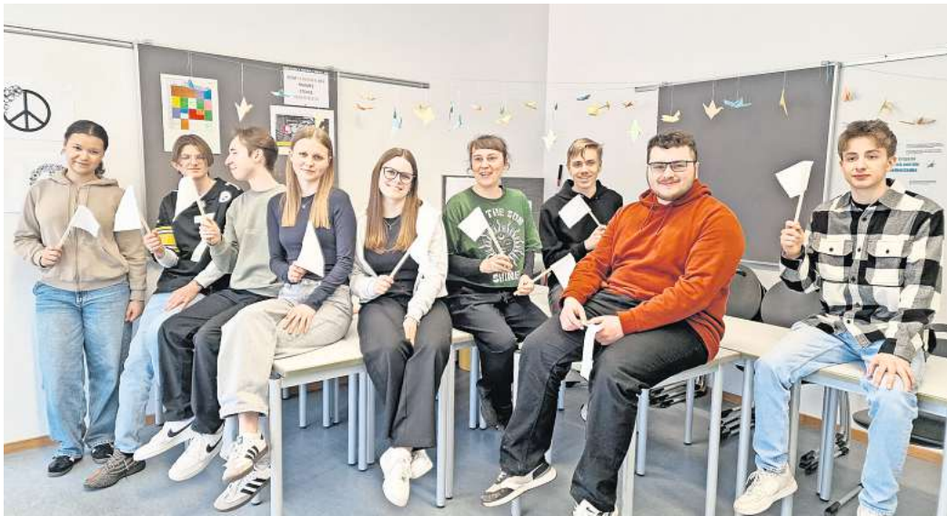
Schüler der Heinrich-Nordhoff-Gesamtschule in Wolfsburg befassten sich mit dem Thema Frieden.