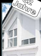
Fenster & Rollläden Schiebeanlagen Faltanlagen

V. Gloger Direktförderung ohne komplizierte Antragstellung auf alle Produkte mind. 22% FÖRDERUNG