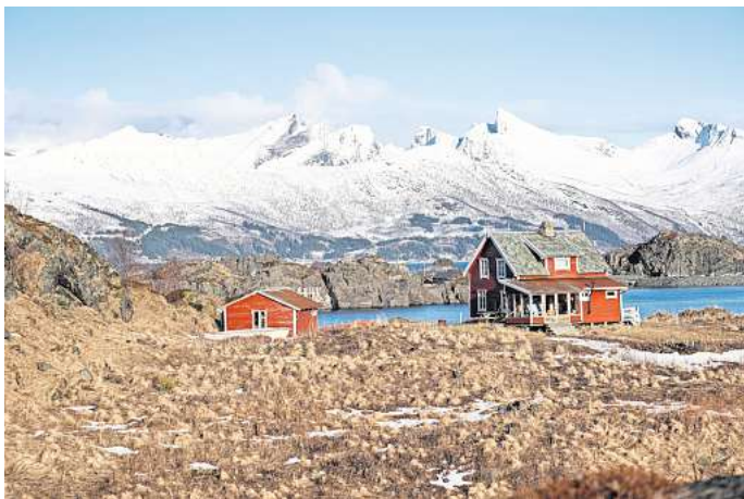
Senja fühlt sich an, als hätte jemand all die Schönheit Norwegens auf eine Insel gesteckt.

Zum Vergleich: Von Berchtesgaden nach Flensburg sind es gerade mal 1000 Kilometer. Doch um die ganze Schönheit Norwegens zu sehen, musst du dir nicht drei Wochen Urlaub nehmen und tagelang im Auto sitzen, du kannst die Magie auch innerhalb von ein paar Tagen erleben, nämlich auf der Insel Senja. Wie bereits erwähnt, ist Senja die zweitgrößte Insel Norwegens, noch größer ist nur Spitzbergen.