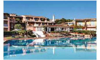
Ein vielfältiges Hotelportfolio, wie hier das 4* Grand Hotel Porto Cervo auf Sardinien, steht zur Auswahl.

Den Katalog, weitere Informationen und Buchungsmöglichkeit dieser exklusiven Angebote unter www.fliegen-ab-braunschweig.de ,