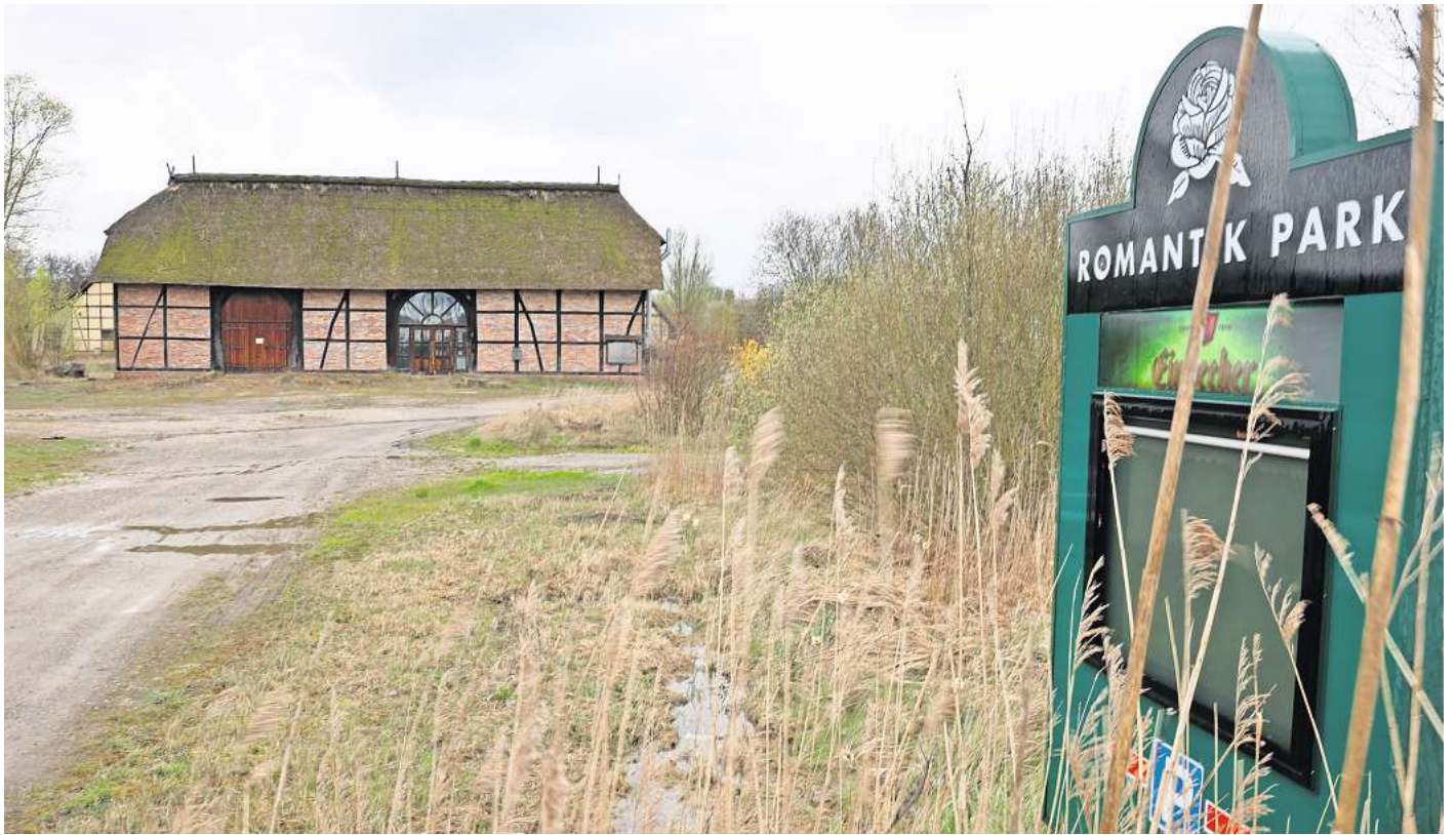
Der Eingang zum einstigen „Romantik-Park“: Das Gelände des Landlebens in Wolfsburg verfällt zusehends.